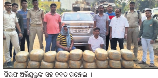
ଗିରଫ ଅଭିଯୁକ୍ତଙ୍କ ସହ ଜବତ ଗଞ୍ଜେଇ ।