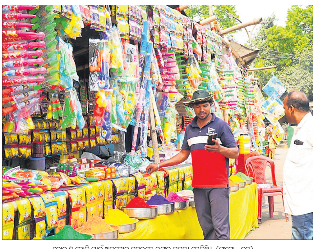
ବୋଲ ଓ ହୋଲି ପାଇଁ ଅନୁଗୋଳ ସହରରେ ରଙ୍ଗର ପସରା ମେଲିଛି।

ଦେଢ଼ାମାଲ ଅଫିସ, ୬୩୩: ଦେଢ଼ାମାଲ ସହରସ୍ଥିତ ରାଜବାଟି ପଛ ପାଖରେ ଥିବା ପାଣିଓହଳା ପାହାଡ଼ ପାଦଦେଶ ଜଙ୍ଗଲରେ ସୋମବାର ଅପରାହ୍ଣ ୫ଟାରେ ନିଆଁ ଲାଗି ଜଙ୍ଗଲ ଉତ୍ତରକୁ ବ୍ୟାପି ଯାଇଥିଲା। ନିଆଁ ଧାସରେ ଜଙ୍ଗଲ ନିକଟରେ ଥିବା ଜନବସତି ଅଞ୍ଚଳରେ ଧୂଆଁ ଓ ଗରମ ଅଶ୍ରୁକାଣ୍ଡର ସମ୍ମୁଖୀନ ହେବାକୁ ପଡ଼ିଥିଲା। ଖବରପାଇଁ ଅଗ୍ନିଶମ ସେବା ସଂସ୍ଥା କର୍ମଚାରୀମାନେ ଘଟଣାସ୍ଥଳରେ ପହଞ୍ଚି ବହୁ କଷ୍ଟରେ ନିଆଁ ଆୟତ୍ତ କରିଥିଲେ। ଖବର ପାଇବା ପରେ ମଧ୍ୟ ବନବିଭାଗ ପକ୍ଷରୁ ଘଟଣାସ୍ଥଳରେ କେହି ପହଞ୍ଚି ନ ଥିବାରୁ ସ୍ଥାନୀୟ ଅଞ୍ଚଳରେ ଅସହାୟ ପ୍ରକାଶ ପାଇଥିଲା।