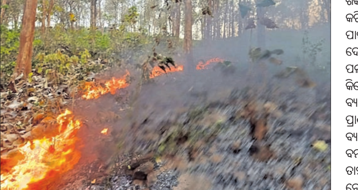
ପାଣିଓହଳା ପାହାଡ଼ ପାଦଦେଶ ଜଙ୍ଗଲରେ ନିଆଁ।

ଦେଢ଼ାମାଲ ଅଫିସ, ୬୩୩: ଦେଢ଼ାମାଲ ସହରସ୍ଥିତ ରାଜବାଟି ପଛ ପାଖରେ ଥିବା ପାଣିଓହଳା ପାହାଡ଼ ପାଦଦେଶ ଜଙ୍ଗଲରେ ସୋମବାର ଅପରାହ୍ଣ ୫ଟାରେ ନିଆଁ ଲାଗି ଜଙ୍ଗଲ ଉତ୍ତରକୁ ବ୍ୟାପି ଯାଇଥିଲା। ନିଆଁ ଧାସରେ ଜଙ୍ଗଲ ନିକଟରେ ଥିବା ଜନବସତି ଅଞ୍ଚଳରେ ଧୂଆଁ ଓ ଗରମ ଅଶ୍ରୁକାଣ୍ଡର ସମ୍ମୁଖୀନ ହେବାକୁ ପଡ଼ିଥିଲା। ଖବରପାଇଁ ଅଗ୍ନିଶମ ସେବା ସଂସ୍ଥା କର୍ମଚାରୀମାନେ ଘଟଣାସ୍ଥଳରେ ପହଞ୍ଚି ବହୁ କଷ୍ଟରେ ନିଆଁ ଆୟତ୍ତ କରିଥିଲେ। ଖବର ପାଇବା ପରେ ମଧ୍ୟ ବନବିଭାଗ ପକ୍ଷରୁ ଘଟଣାସ୍ଥଳରେ କେହି ପହଞ୍ଚି ନ ଥିବାରୁ ସ୍ଥାନୀୟ ଅଞ୍ଚଳରେ ଅସହାୟ ପ୍ରକାଶ ପାଇଥିଲା।