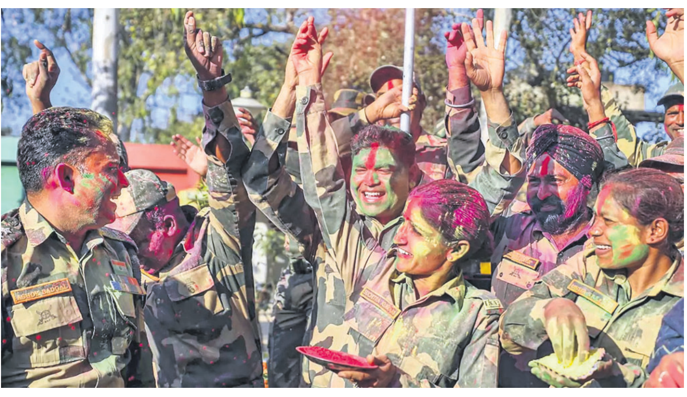
କମ୍ପୁ-କମ୍ପାନୀର ସାଧ୍ୟା କିଲ୍ ଅନ୍ତର୍ଗତ ଭାରତ-ପାକିସ୍ତାନ ସୀମାରେ ବିସ୍ଫୋଟ ସହାୟତାରେ ଯୋମବାର ହୋଇ ମନାଉଛନ୍ତି।

ହୁକା ବାର୍ରେ ନାବାଳିକାଙ୍କୁ ଗଣିବଳାକାର କାନପୁର, ୬୩: ଉତ୍ତର ପ୍ରଦେଶ କାନପୁରର ଏକ ହୁକା ବାରରେ ନାବାଳିକାଙ୍କୁ ବଳାହାର ଅଭିଯୋଗରେ ଜଣେ ଯୁବକଙ୍କୁ ପୋଲିସ୍ ଯୋମବାର ଭିରଫ କରିଛି।