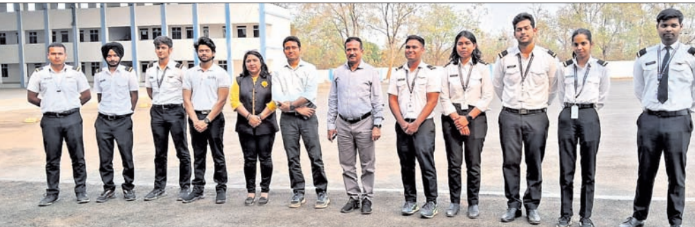
ପ୍ରଶିକ୍ଷାର୍ଥୀଙ୍କ ସହ ଜିଲ୍ଲାପାଳ ଓ ଉପଜିଲ୍ଲାପାଳ।