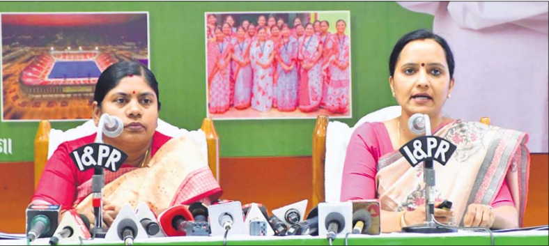
ଖବରଦାତା ସମ୍ମିଳନୀରେ ମହିଳା ଓ ଶିଶୁ ବିକାଶ, ମିଶନ ଶକ୍ତି ମନ୍ତ୍ରୀ ବାସନ୍ତୀ ହେମ୍ମନ୍ତ ଏବଂ ମିଶନ ଶକ୍ତି ବିଭାଗ କମିଶନର ପୁରୁଷା କାର୍ତ୍ତିକେୟନ