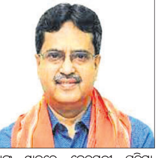
୮ରେ ଶପଥ ନେବେ

ମାନିକ୍ ଶାହା କ୍ରମାଗତ ତ୍ରିତୀୟ ଥର ପାଇଁ ଉତ୍ତରପ୍ରଦେଶ ରାଜ୍ୟ ତ୍ରିପୁରାର ମୁଖ୍ୟମନ୍ତ୍ରୀ ହେବାକୁ ଯାଉଛନ୍ତି। ସୋମବାର ଭାଜପା ବିଧାୟକ ଦଳ ବୈଠକରେ ଉଚ୍ଚ ନିଷ୍ପତ୍ତି ନିଆଯାଇଛି।