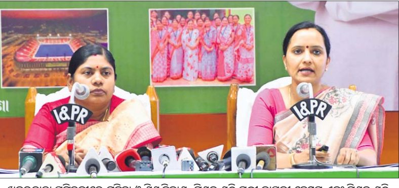
ଖବରଦାତା ସମ୍ମିଳନୀରେ ମହିଳା ଓ ଶିଶୁ ବିକାଶ, ମିଶନ ଶକ୍ତି ମନ୍ତ୍ରୀ ବାସନ୍ତୀ ହେମ୍ବର୍ଣ୍ଣ ଏବଂ ମିଶନ ଶକ୍ତି ବିଭାଗ କମିଶନର ପୁରୁଷା କାର୍ତ୍ତିକେୟନ