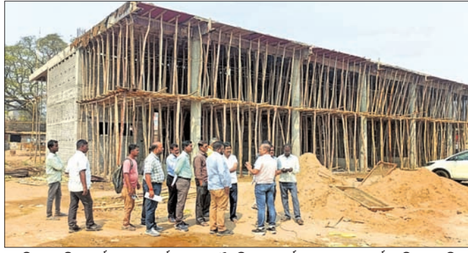
ପୋଲିସ ହାଉସିଂ କର୍ପୋରେସନ ବୋର୍ଡର ମୁଖ୍ୟ ବିଶେଷଜ୍ଞ ପରାମର୍ଶଦାତା ବସଷ୍ଟାଣ୍ଡ କାର୍ଯ୍ୟ ଦୂଳି ଦେଖୁଛନ୍ତି।

ଭୁବନେଶ୍ୱର ପ୍ରଭୁପାଦ କଂଷ୍ଟ୍ରକ୍ସନ କମ୍ପାନୀ ଏହି ନିର୍ମାଣ କାର୍ଯ୍ୟ ସମ୍ପାଦନ କରୁଥିବା ବେଳେ ଏହାର ତଦାରଖ ପୋଲିସ ହାଉସିଂ ବୋର୍ଡ କରୁଛି।