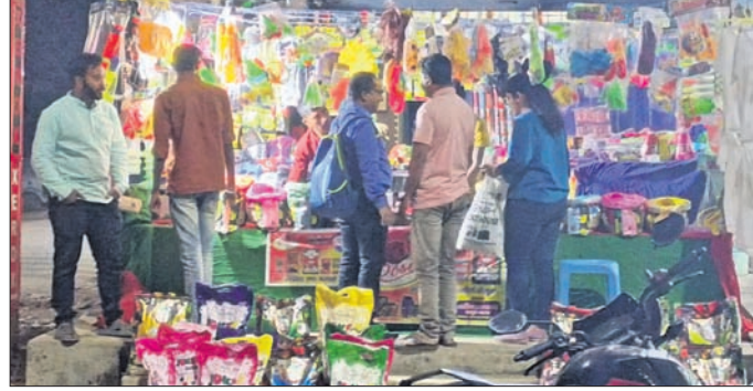
ଉପରକୋଟ ସହରର ଏକ ବୋକାନରେ ରଜ ଦିବସକୁ ଗ୍ରାହକଙ୍କ ଭିଡ଼ ଜମିଛି।

ଉପରକୋଟ, ୬ମାର୍ଚ୍ଚ(ସ.ପ୍ର.) ବ୍ୟସ୍ୟା ସମୟରେ ବେପାର ଜମୁଛି ବୋଲି ନବରଙ୍ଗପୁର ଜିଲ୍ଲା ଉପରକୋଟ ସହର