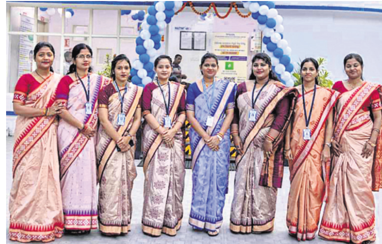
ଗାଗା ପାଞ୍ଚାଳ ସର୍ବନ ଓଡ଼ିଶା ଡିଷ୍ଟ୍ରିବ୍ୟୁଶନ ଲିମିଟେଡ କ୍ରହ୍ମପୁର ଯୁନିଟର ଗ୍ରାହକ ସେବା କେନ୍ଦ୍ରରେ କାର୍ଯ୍ୟରତ ମହିଳା କର୍ମଚାରୀମାନଙ୍କ ପାଇଁ କମ୍ପାନୀ ପକ୍ଷରୁ 'ଡିଜିଟାଲ ଲିଙ୍ଗଗତ ସମାନତା' ପାଇଁ ନବସୂଚନ ଓ ପ୍ରଯୁକ୍ତି ଶୀର୍ଷକ ବିଷୟବସ୍ତୁ ଜରିଆରେ ଅନ୍ତର୍ଜାତୀୟ ମହିଳା ଦିବସ ପାଳିତ ହୋଇଯାଇଛି ।