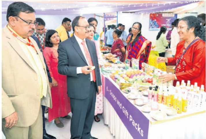
ୟୁନିୟନ ବ୍ୟାଙ୍କ ଅଫ ଇଣ୍ଡିଆର ମୁଖ୍ୟାଳୟ ପରିସରରେ ଅନ୍ତର୍ଜାତୀୟ ମହିଳା ଦିବସ ପାଳିତ ହୋଇଯାଇଛି । ଏହି ପରିପ୍ରେକ୍ଷାରେ ଗ୍ଲାନାୟ ସ୍ଵୟଂ ସହାୟକା ଗୋଷ୍ଠୀ (ଏସଏଚଏ)ଙ୍କ ସହାୟତାରେ ଏକ ବିଶେଷ ମେଳା ବ୍ୟାଙ୍କର ମହିଳା କର୍ମଚାରୀ ଓ ଗ୍ରାହକଙ୍କ ପାଇଁ ଆୟୋଜନ କରାଯାଇଥିଲା ।