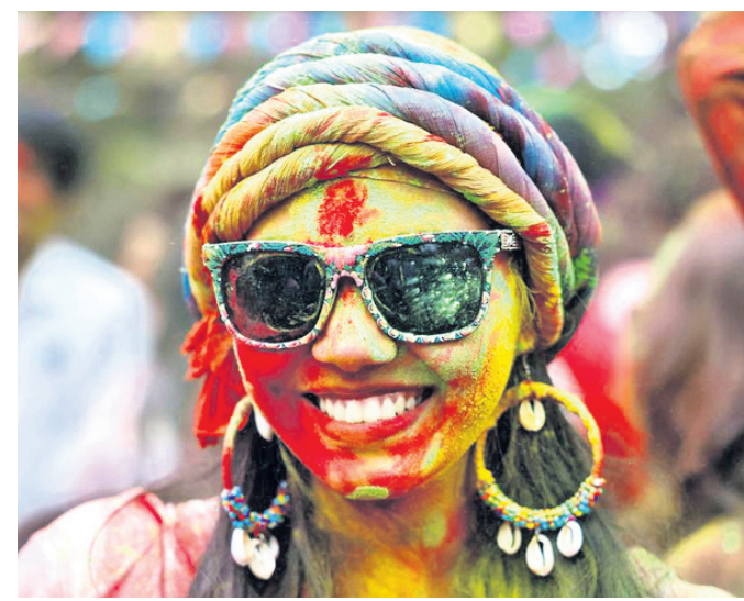
ବାଙ୍ଗାଦେଶର ଡାକା ଯୁନିଭର୍ସିଟି କଳା ବିଭାଗରେ ହୋଇ ପାଳନ ବେଳେ ଜଣେ ଛାତ୍ରୀ ହସୁଛନ୍ତି।

ନୂଆଦିଲ୍ଲୀ, ୯ମା: ଭାରତୀୟ ନୌସେନା ସର୍ବବୃହତ୍ ଦ୍ୱିବାର୍ଷିକ ଥିଏଟର ଲେଭେଲ୍ ଅପରେଶନାଲ ରେଡିନେସ୍ ଏକ୍ସପ୍ଲୋଜନ୍ (ଗ୍ରୋପେକ୍ସ)ରେ ପ୍ରାୟ ୭୦ ଜାହାଜ, ୬ ରୁଡ୍ଡାଜାହାଜ ଓ ୭୫୦୦ ଅଧିକ ଏୟାରକ୍ରାଫ୍ଟ ସାମିଲ ହୋଇଛି। ୨୧ ନିୟୁତ ନଟିକାଲ୍ ମାଇଲ୍ ଜଳବାଣି ଉପରେ ଏହି ଡ୍ରୀଲ୍ କରାଯାଇଥିବା ନୌସେନା ପକ୍ଷରୁ ଗୁରୁତ୍ୱପୂର୍ଣ୍ଣ ସୂଚନା ଦିଆଯାଇଛି। ଆରବ ସାଗରରେ ୨୦୨୨ ନଭେମ୍ବରରେ ଆରମ୍ଭ ହୋଇଥିବା ଏହି ଏକ୍ସପ୍ଲୋଜନ୍ ଭାରତୀୟ ସେନା, ବାୟୁସେନା ଓ ତଟରକ୍ଷା ବାହିନୀର ଅଧିକାରୀମାନେ ଯୋଗଦେଇଥିଲେ। ସମୁଦ୍ର ଉପରେ ସର୍ବୋଚ୍ଚ ବୃଷ୍ଟି ବର୍ଷା ଏହି ଡ୍ରୀଲ୍ ର ଉଦ୍ଦେଶ୍ୟ। ବୃତ୍ତାନ୍ତ ପର୍ଯ୍ୟନ୍ତ ସମରାଜ୍ୟାସ ବେଳେ ଗତ ୬ ତାରିଖରେ ପ୍ରତିରକ୍ଷା ମନ୍ତ୍ରୀ ରାଜନାଥ ସିଂ ନୂଆକରି ଜଳାବତରଣ କରିଥିବା ଏୟାରକ୍ରାଫ୍ଟ କେରିୟର୍ ବିକ୍ରାନ୍ତରେ ଦିନଟିଏ ବିତାଇ ଆଇଏନ୍ଏସ୍ ପ୍ରସ୍ତୁତି ସମାପ୍ତ କରିଥିଲେ।