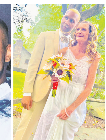
ତାହା ସମ୍ଭବ ହୋଇ ନ ଥିଲା । ଏବେ ସେମାନେ ସରୋରୋସି ମାଧ୍ୟମରେ ସନ୍ତାନ ଜନ୍ମ କରିବାକୁ ୩ ଜଣଙ୍କ ସହ କଥା ହୋଇଥିବା ଜଣାପଡ଼ିଛି ।