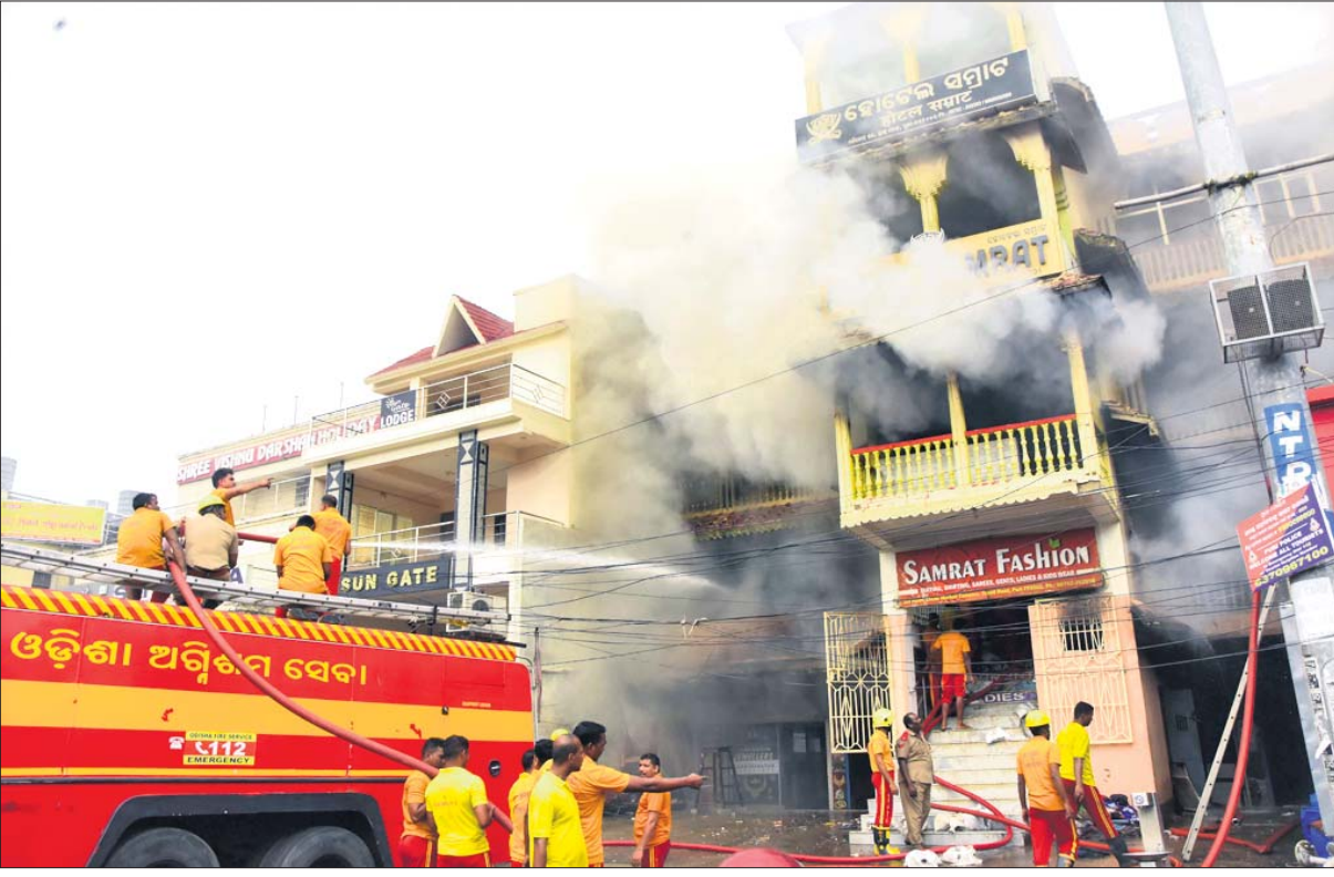
ପୁରୀ ବଡ଼ବାଣର ମରିଚିକୋଟ ଛକ ନିକଟସ୍ଥ ଲକ୍ଷ୍ମୀ ମାର୍କେଟ କମ୍ପ୍ଲେକ୍ସରେ ରୁଧିରା ନିଆଁକୁ ଅଗ୍ନିଶମ ବାହିନୀ ଏବଂ ଓଡ୍ରାୟ୍ ଟିମ୍ ଲିଭାଇଛନ୍ତି ।