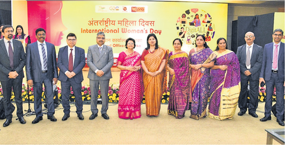
ପଞ୍ଜାବ ନ୍ୟାଶନାଲ ବ୍ୟାଙ୍କ (ପିଏନବି) ପକ୍ଷରୁ ଅନ୍ତର୍ଜାତୀୟ ମହିଳା ଦିବସ ପାଳିତ ହୋଇଯାଇଛି । ଏହି ପରିପ୍ରେକ୍ଷାରେ ପିଏନବିର ନୂଆଦିଲ୍ଲୀସ୍ଥିତ ଦ୍ଵାରକା ଠାରେ ଏକ ସ୍ଵତନ୍ତ୍ର କାର୍ଯ୍ୟକ୍ରମ 'ବ୍ୟାଙ୍କର ଅଭିବୃଦ୍ଧିରେ ମହିଳା କର୍ମଚାରୀଙ୍କ ଭୂମିକା ଏବଂ କାର୍ଯ୍ୟକ୍ଷେତ୍ରରେ ଲିଙ୍ଗଗତ ସମାନତା' ସମ୍ପର୍କରେ ଏକ ଆଲୋଚନା ଚକ୍ରର ଆୟୋଜନ କରାଯାଇଥିଲା ।