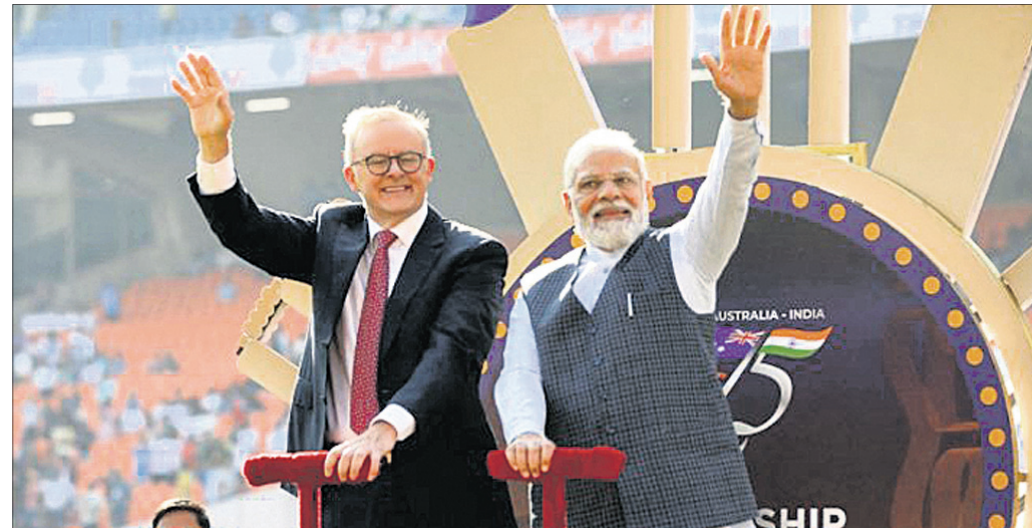
କ୍ରିକେଟ୍ ମ୍ୟାଚ୍ ପୂର୍ବରୁ ଅନୁସନ୍ଧାନ ସ୍ୱାଭିମ୍ବରେ ପ୍ରଧାନମନ୍ତ୍ରୀ ନରେନ୍ଦ୍ର ମୋଡିଙ୍କ ସହ ଅଷ୍ଟ୍ରେଲିଆ ପ୍ରତିପକ୍ଷ ଆଲବାନିସ୍।

ବହୁପୂର୍ଣ୍ଣ ମ୍ୟାଚ୍ ଚାଲିଥିବାବେଳେ ମୋଡି ଓ ଆଲବାନିସ୍ ଏକାଠି ଏହାକୁ ଉପଭୋଗ କରିଥିଲେ। ମ୍ୟାଚ୍ ପୂର୍ବରୁ ସେମାନେ ଏକ ଗଲ୍ଲୁ କାର୍ଡରେ ନରେନ୍ଦ୍ର ମୋଡିଙ୍କୁ ସ୍ୱାଗତ କରିବା ସହ ସର୍ବମାନଙ୍କୁ ହାତ ହଲାଇ ଅଭିନନ୍ଦନ ଜଣାଇଥିଲେ। କ୍ରିକେଟ ଫିଲ୍ଡରେ ଭାରତ ଓ ଅଷ୍ଟ୍ରେଲିଆ ବିଶ୍ୱରେ ସର୍ବଶ୍ରେଷ୍ଠ ପ୍ରତିଦ୍ୱନ୍ଦ୍ୱୀ ହୋଇଥିବାବେଳେ ପଢ଼ିଆ ବାହାରେ ଶ୍ରେଷ୍ଠ ବିଶ୍ୱ ନିର୍ମାଣରେ ସହଯୋଗୀ ବୋଲି ଆଲବାନିସ୍ କହିଛନ୍ତି। ଉଭୟ ଦଳ ଜାତୀୟ ସଙ୍ଗୀତ ଗାନ କଲାବେଳେ ମୋଡି ଓ ଆଲବାନିସ୍ ସ୍ୱାଭିମ୍ବରେ ପ୍ରତିଦ୍ୱନ୍ଦ୍ୱୀତାମୂଳକ ତଥା ସେମାନଙ୍କ ସହ ଛିଡ଼ା ହୋଇଥିଲେ।