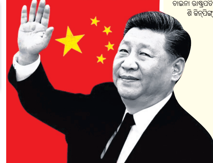
ଚୀନର ରାଷ୍ଟ୍ରପତି ଶି ଜିନ୍ପିଙ୍ଗ୍

ଚୀନର ମଧ୍ୟୋକ୍ତ କୃତନୈତିକ, ପ୍ରତିରକ୍ଷା, ଆର୍ଥିକ ଓ ବୈଷୟିକ ସମ୍ପଦରେ ମନେକରୁଛନ୍ତି। ଆମେରିକାର ନ୍ୟାଶନାଲ୍ ଇଣ୍ଟେଲିଜେନ୍ସ୍ ତାଲିକାରେ ବେଙ୍ଗି ଚୀନକୁ ଉଦ୍ଦେଶ୍ୟରେ ଚାପି ଚାଲି ରଖିବ। ତାଲିକାରେ ସହ ଆମେରିକାର ବହୁଥିବା ପ୍ରତିକ୍ରୟଶୀଳ ହୋଇପାରେ। ସେହିପରି ଦକ୍ଷିଣ ଚୀନର ସାଗର (ଏସିଏସିଏ)ରେ ବ୍ରୁନେଇ, ମାଲେସିଆ, ଫିଲିପାଇନ୍ସ, ତାଲିକା ଓ ଭିଏତ୍ନାମ ଭଳି ପ୍ରତିଦ୍ୱନ୍ଦ୍ୱୀ ଦାବିଦାରକୁ ପ୍ରତିହତ କରିବା ପାଇଁ ବେଙ୍ଗି ବିଶ୍ୱବ୍ୟାପୀ ନିଆଁ କରାଯାଇଥିବାବେଳେ