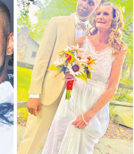
ତାହା ସମ୍ଭବ ହୋଇ ନ ଥିଲା । ଏବେ ସେମାନେ ସରୋଗେସି ମାଧ୍ୟମରେ ସନ୍ତାନ ଜନ୍ମ କରିବାକୁ ୩ ଜଣଙ୍କ ସହ କଥା ହୋଇଥିବା ଜଣାପଡ଼ିଛି ।

ମୁଖ୍ୟ: ସାଥ୍ୟ ସୁପରଷ୍ଟାର ପ୍ରତ୍ୟାସକ ୩ଟି ଫିଲ୍ମ 'ଆଦିପୁରୁଷ', 'ସାଲାର' ଏବଂ 'ପ୍ରୋଜେକ୍ଟ କେ' ଦର୍ଶକଙ୍କୁ ଆଗାମୀ ଦିନରେ ଭେଟି ଦେବାକୁ ଯାଉଛି । ହେଲେ ପ୍ରଶଂସକଙ୍କୁ ଆହୁରି ଅପେକ୍ଷା କରିବାକୁ ପଡ଼ିବ ବୋଲି ଜଣାପଡ଼ିଛି । ତାଙ୍କ ଶରୀରର ଚାପମାତ୍ରା ବଢିବା ପରେ ସେ ତାଙ୍କ ଶୁଟିଂ ବାଟିଲ କରିଛନ୍ତି । ସମ୍ପୂର୍ଣ୍ଣ ସୁସ୍ଥ ହେବା ପାଇଁ ସେ ବିଦେଶକୁ ଯିବା ସହ ଅଧିକ ସମୟ ଲାଗିବ ବୋଲି କୁହାଯାଇଛି । ସେ ଯେଉଁ ରୋଗରେ ପଡିତ ଅଛନ୍ତି, ସେ ବାବଦରେ କିଛି ତଥ୍ୟ ସାମ୍ନାକୁ ଆସିନାହିଁ । ସେ ଏକାଧିକ ପ୍ରୋଜେକ୍ଟରେ କାମ କରୁଥିବାବେଳେ ତାଙ୍କ ସାମ୍ବାଦିତ୍ରୀ ବିଚିତ୍ରାକୁ ସେ ଚିକିତ୍ସା ପାଇଁ ବିରତି ନେଇଛନ୍ତି । ତେବେ ଜୁନ୍ ୧୨ରେ ଫିଲ୍ମ 'ଆଦିପୁରୁଷ'ର ଟିକର ରିଲିଜ୍ ହୋଇଥିବାବେଳେ ତାହା ବିବାଦକୁ ଆସିଥିଲା । ସେଥିରେ ପରିବର୍ତନ କରି ଫିଲ୍ମ ରିଲିଜ୍ ହେବାକୁ ନିଷ୍ପତ୍ତି ହୋଇଥିଲା । ତେବେ ତାହା ବିଲମ୍ବ ହେବ ବୋଲି ଚର୍ଚ୍ଚା ହେଉଛି । 'ସାଲାର' ଏବଂ 'ପ୍ରୋଜେକ୍ଟ କେ'ର ଶୁଟିଂ ତାକୁ ରହିଥିବାବେଳେ ତା'ର ରିଲିଜ୍ ତାରିଖ ଘୁଞ୍ଚିବ ବୋଲି କୁହାଯାଉଛି ।