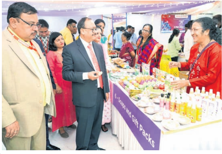
ୟୁନିୟନ ବ୍ୟାଙ୍କ ଅଫ ଇଣ୍ଡିଆର ମୁଖ୍ୟାଳୟ ପରିସରରେ ଅନ୍ତର୍ଜାତୀୟ ମହିଳା ଦିବସ ପାଳିତ ହୋଇଯାଇଛି । ଏହି ପରିପ୍ରେକ୍ଷାରେ ଗ୍ଲୋବାଲ ସ୍ଵୟଂ ସହାୟକା ଗୋଷ୍ଠୀ (ଏସଏଚଏ)ଙ୍କ ସହାୟତାରେ ଏକ ବିଶେଷ ମେଳା ବ୍ୟାଙ୍କର ମହିଳା କର୍ମଚାରୀ ଓ ଗ୍ରାହକଙ୍କ ପାଇଁ ଆୟୋଜନ କରାଯାଇଥିଲା ।