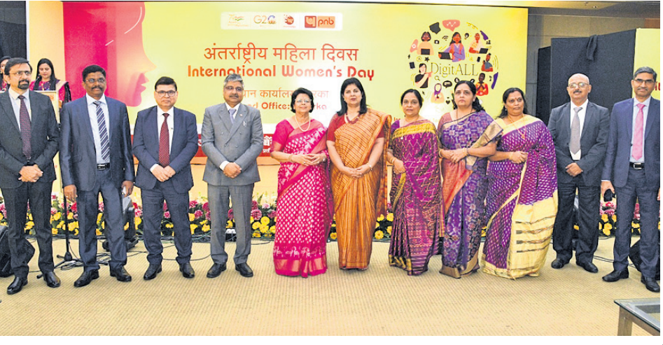
ପଞ୍ଜାବ ନ୍ୟାଶନାଲ ବ୍ୟାଙ୍କ (ପିଏନବି) ପକ୍ଷରୁ ଅନ୍ତର୍ଜାତୀୟ ମହିଳା ଦିବସ ପାଳିତ ହୋଇଯାଇଛି । ଏହି ପରିପ୍ରେକ୍ଷାରେ ପିଏନବିର ନୂଆଦିଲ୍ଲୀସ୍ଥିତ ଦ୍ଵାରକା ଠାରେ ଏକ ସ୍ଵତନ୍ତ୍ର କାର୍ଯ୍ୟକ୍ରମ 'ବ୍ୟାଙ୍କର ଅଭିବୃଦ୍ଧିରେ ମହିଳା କର୍ମଚାରୀଙ୍କ ଭୂମିକା ଏବଂ କାର୍ଯ୍ୟକ୍ଷେତ୍ରରେ ଲିଙ୍ଗଗତ ସମାନତା' ସମ୍ପର୍କରେ ଏକ ଆଲୋଚନା ଚକ୍ରର ଆୟୋଜନ କରାଯାଇଥିଲା ।