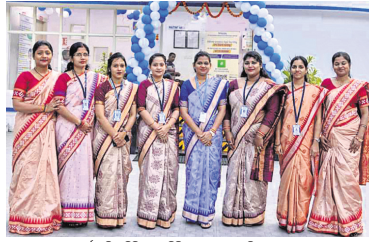
ଗାଗା ପାଞ୍ଚାଳ ସର୍ବନ ଓଡ଼ିଶା ଡିଷ୍ଟ୍ରିବ୍ୟୁଶନ ଲିମିଟେଡ ବ୍ରହ୍ମପୁର ମୁନିସିପାଲ ଗ୍ରାହକ ସେବା କେନ୍ଦ୍ରରେ କାର୍ଯ୍ୟରତ ମହିଳା କର୍ମଚାରୀମାନଙ୍କ ପାଇଁ କମ୍ପାନୀ ପକ୍ଷରୁ 'ଡିଜିଟାଲ ଲିଙ୍ଗଗତ ସମାନତା' ପାଇଁ ନବସୂଚନ ଓ ପ୍ରମୁଦ୍ଧ ଶୀର୍ଷକ ବିଷୟବସ୍ତୁ ଜରିଆରେ ଅନ୍ତର୍ଜାତୀୟ ମହିଳା ଦିବସ ପାଳିତ ହୋଇଯାଇଛି ।