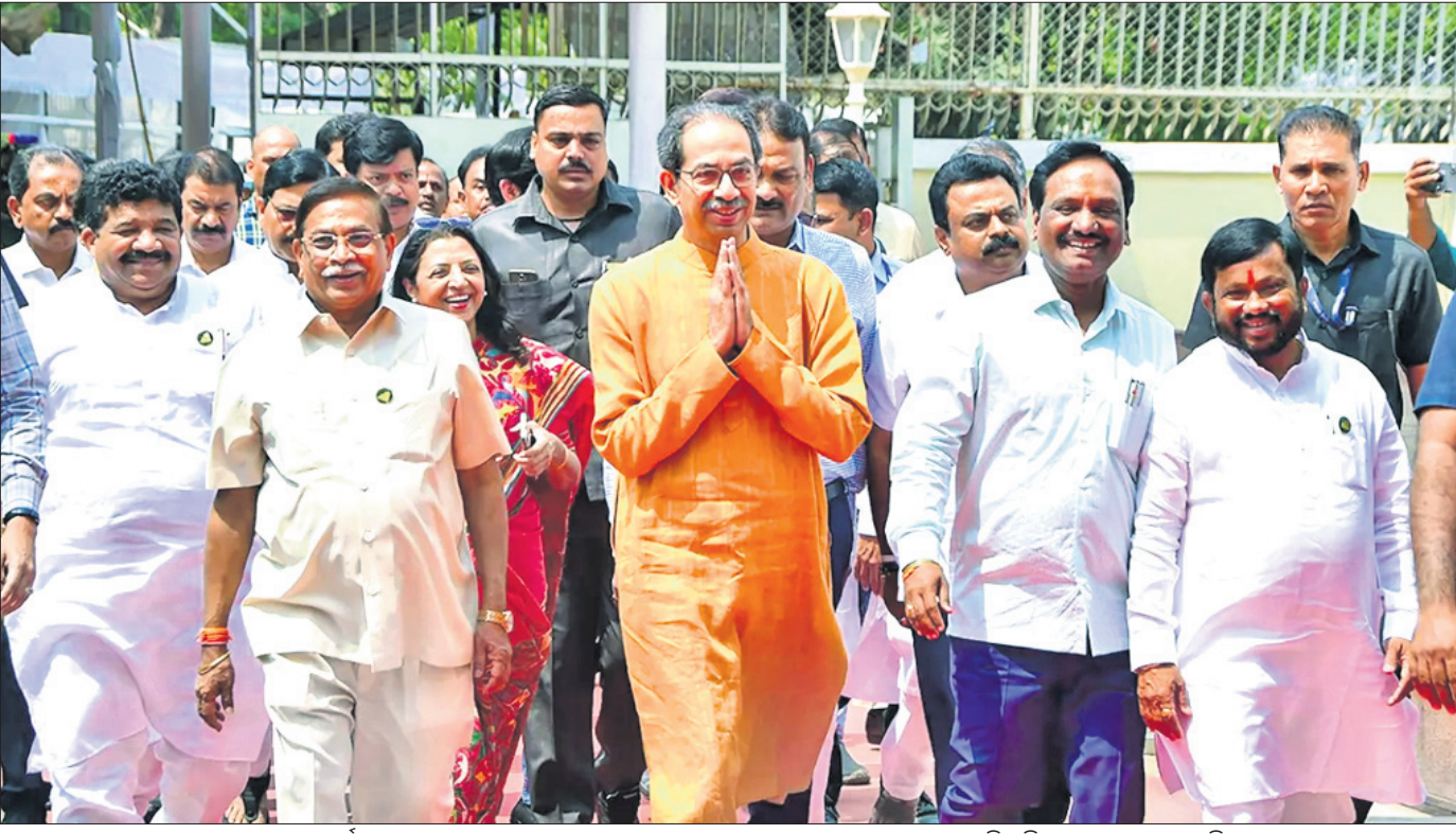
ମହାରାଷ୍ଟ୍ର ପୂର୍ବତନ ମୁଖ୍ୟମନ୍ତ୍ରୀ ଉତ୍ତମ ଠାକୁରେ ରାଜ୍ୟ ବଜେଟ ଅଧିବେଶନ ଅବସରରେ ମୁଖ୍ୟମନ୍ତ୍ରୀ ବିଧାନ ଭବନକୁ ଯାଉଛନ୍ତି।