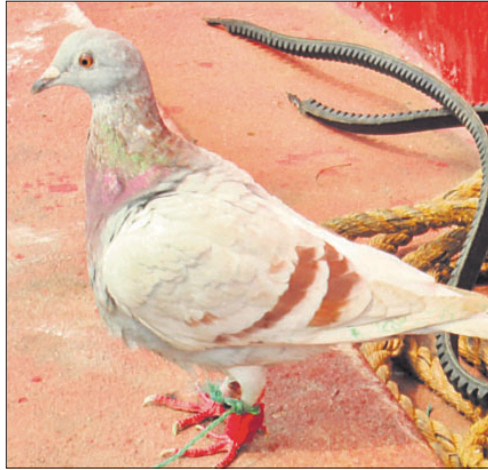
ସମୁଦ୍ରରୁ ଉଦ୍ଧାର ହୋଇଥିବା ପାରା।

■ ଗୋଡ଼ରେ ବନ୍ଧା ହୋଇଛି କ୍ୟାମେରା, ଚିପ୍ ■ ପରୀକ୍ଷା ପାଇଁ ଏସ୍ଏସ୍ଏସ୍ଏଲ୍ ନେଲା ପୋଲିସ ■ ବିଦେଶୀ ଗୋଇନ୍ଦା ବିଭାଗ ପକ୍ଷରୁ ଛଡ଼ା ଯାଇଥିବା ସନ୍ଦେହ