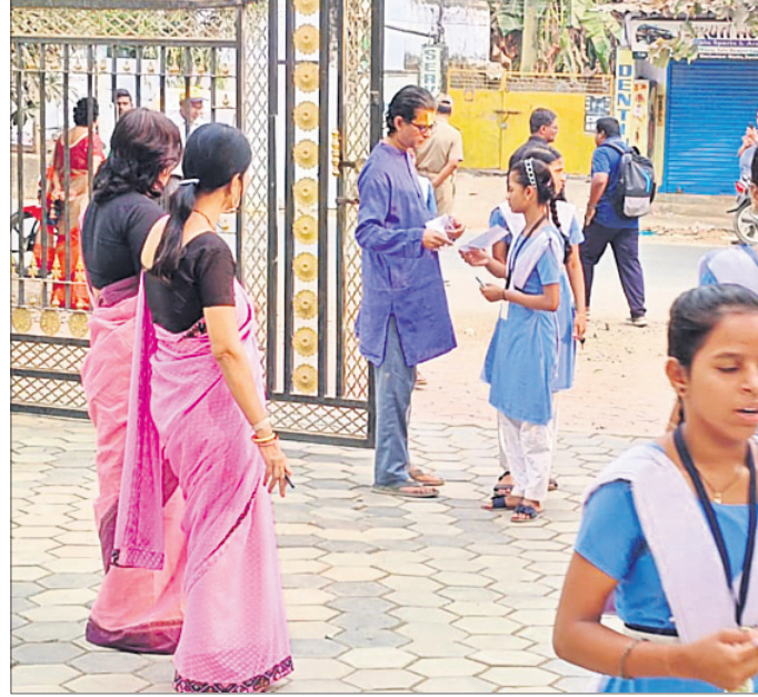
ପରୀକ୍ଷା ପୂର୍ବରୁ ଡି.ଭି.ଗିରି ବାଳିକା ଉଚ୍ଚ ବିଦ୍ୟାଳୟରେ ପରୀକ୍ଷାର୍ଥୀଙ୍କୁ ଯାଞ୍ଚ କରାଯାଇଛି ।