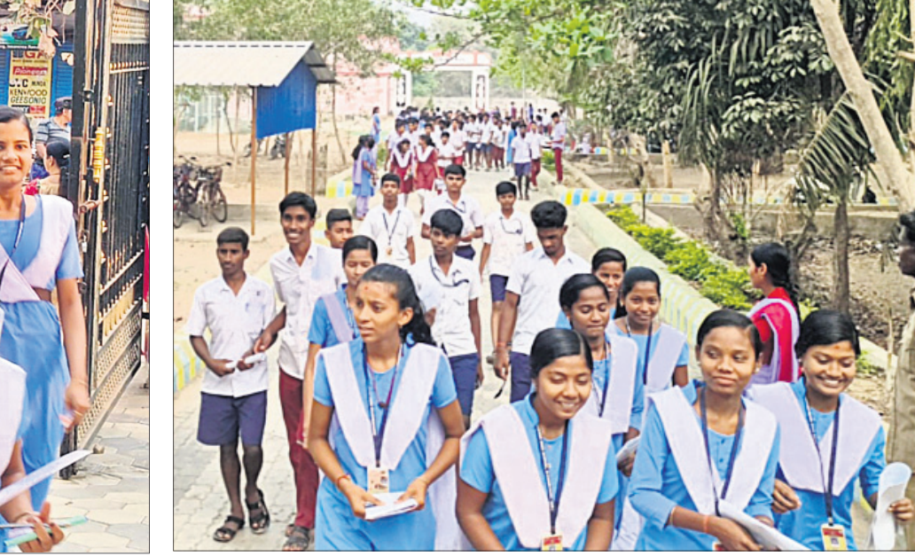
ବେଗୁନିଆପଡ଼ାରେ ପରୀକ୍ଷା କେନ୍ଦ୍ରକୁ ଯାଉଛନ୍ତି ଛାତ୍ରଛାତ୍ରୀ ।