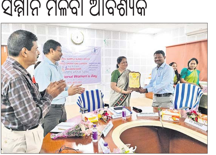
ଭୁବନେଶ୍ୱର, ୧୦ମାର୍ଚ୍ଚ (ବୁଧବୋ)

ଜାତୀୟ ନମୁନା ସର୍ବେକ୍ଷଣ କାର୍ଯ୍ୟାଳୟ ଓ ଭାରତ ସରକାରଙ୍କ କାର୍ଯ୍ୟକ୍ରମ କାର୍ଯ୍ୟାଳୟ ମନୁଶ୍ୟକ କ୍ଷେତ୍ରରେ ପକ୍ଷରୁ ଶୁକ୍ରବାର ଅନ୍ତର୍ଜାତୀୟ ମହିଳା ଦିବସ ପାଳିତ ହୋଇଯାଇଛି।