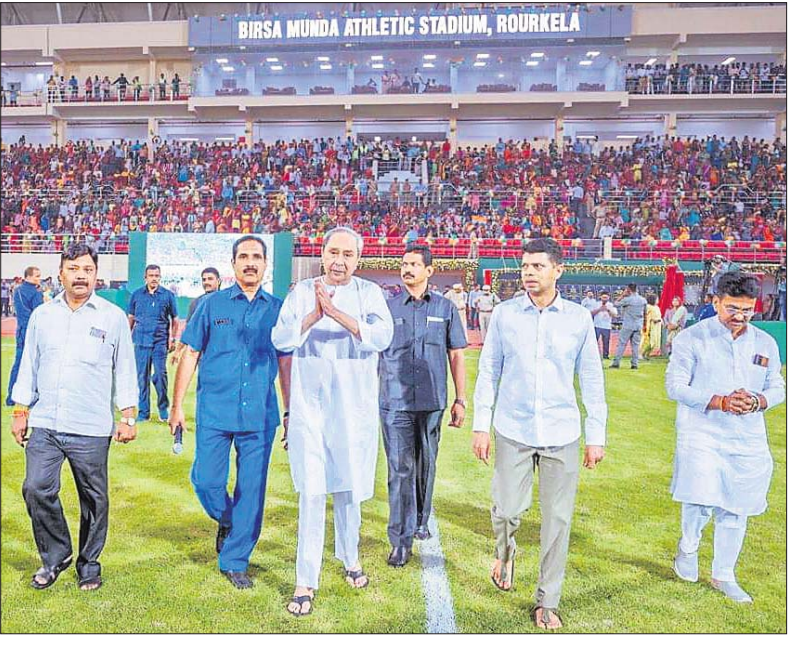
ରାଉରକେଲା ଆଧୁନିକ ଷ୍ଟାଡ଼ିୟମରେ ମୁଖ୍ୟମନ୍ତ୍ରୀ ନବୀନ ପଟ୍ଟନାୟକ, ୫-ଟି ସଭ୍ୟ ଓ ଅନ୍ୟମାନେ।