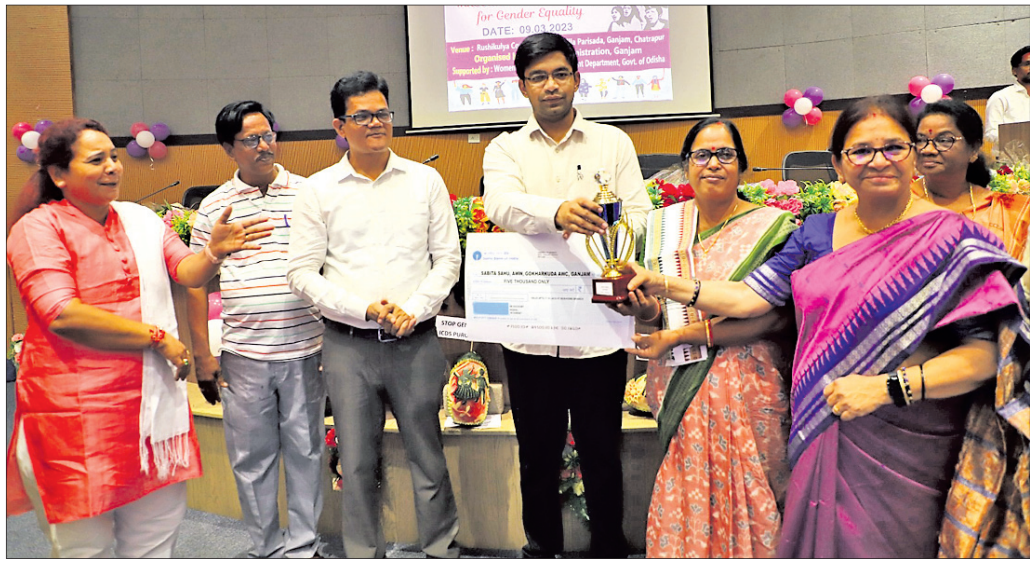
ଜିଲାସ୍ତରାୟ ମହିଳା ଦିବସ ଅବସରରେ ସମ୍ମାନିତ ବ୍ୟକ୍ତିଙ୍କ ସମେତ ଅତିଥିବୃନ୍ଦ