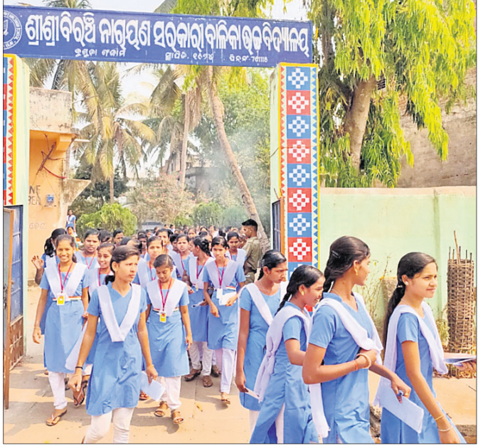
ବୁଢ଼ା ଶ୍ରୀମତୀ ବିରଞ୍ଚି ନାରାୟଣ ଉଚ୍ଚବିଦ୍ୟାଳୟରେ ପରୀକ୍ଷାର୍ଥୀମାନେ କେନ୍ଦ୍ରକୁ ବାହାରୁଛନ୍ତି ।

ବାଳିକା ଉଚ୍ଚ ବିଦ୍ୟାଳୟ ସମେତ ବ୍ଲକ୍ ଅଧୀନ ରାସୁଗିରି, ଗୋକର୍ଣ୍ଣପୁର, ଗୌଡ଼ଗାଁ, ପଦ୍ମନାଭପୁର ନୋଡାଲ୍ ହାଇସ୍କୁଲ ଓ ରାଧା ଦାମୋଦର ବାଳିକା ଉଚ୍ଚ ବିଦ୍ୟାଳୟ, ପାସିଗୁଡ଼ା, ସିଦ୍ଧେଶ୍ୱର, ତଲା ସିଂ, ବନକୋଇ ସ୍ଥିତ ଶିବନନ୍ଦ କୋଷ୍ଠିଷ ବିଶ୍ୱାସପୂର୍ଣ୍ଣ ବର୍ଗିତ ବାଇକୋଇ ବିଦ୍ୟାଳୟ ଗୁଡ଼ିକରେ ବିଦ୍ୟାର୍ଥୀମାନେ ଶାନ୍ତିପୂର୍ଣ୍ଣ ଭାବେ ପରୀକ୍ଷା ଦେଇଥିଲେ । ତେବେ ଦିନପହଣ୍ଡି ବ୍ଲକ୍ରେ ଚଳିତ ବର୍ଷ ଦଶମ ଶ୍ରେଣୀ ମାଟ୍ରିକ ବୋର୍ଡ଼ ପରୀକ୍ଷା ନିମନ୍ତେ ୨୩୦୯ ଜଣ ବିଦ୍ୟାର୍ଥୀଙ୍କ ନାମ ରାଜିକା ପ୍ରକାଶ ପାଇଥିବା ବେଳେ ୩୧ ବିଦ୍ୟାର୍ଥୀ ପରୀକ୍ଷା କେନ୍ଦ୍ରରେ ଅନୁପସ୍ଥିତ ରହିଥିବା ଦିନପହଣ୍ଡି ବ୍ଲକ୍ ଶିକ୍ଷାଧିକାରୀ କୋରେଶ୍ୱେ ସେଠା ସୂଚନା ଦେଇଛନ୍ତି ।