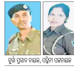
ଦୁଇ ପ୍ରାଧିକାରୀ, ଦୁଇ ନିଲମୟ