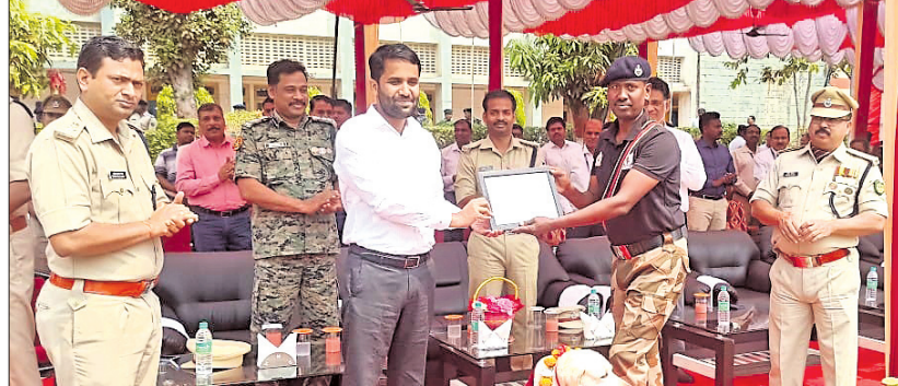
କେନ୍ଦ୍ରୀୟ ଶିଳ୍ପ ସୁରକ୍ଷା ବାହିନୀର ପ୍ରତିଷ୍ଠା ଦିବସ ପ୍ରସଙ୍ଗରେ ଉପକ୍ରମରେ କର୍ମଚାରୀଙ୍କୁ ପୁରସ୍କୃତ କରାଯାଇଛି ।

ଭୁବନେଶ୍ୱରରେ କେନ୍ଦ୍ରୀୟ ଶିଳ୍ପ ସୁରକ୍ଷା ବାହିନୀର ପ୍ରତିଷ୍ଠା ଦିବସ ପ୍ରସଙ୍ଗରେ ଦୁଇଟି ଗାଡ଼ି ଦୁର୍ଘଟଣା ଘଟିଛି । ୩ ଆହତ ହୋଇଛନ୍ତି ।