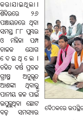
ଉପରକୋଟ ଜିଲ୍ଲାରେ ଲୋକଙ୍କୁ ସେବା ଯୋଗାଇବାକୁ ପରାମର୍ଶ ଦିଆଯାଇଛି।