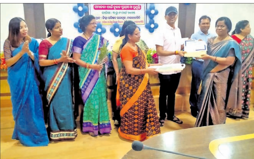
ଅନ୍ତର୍ଜାତୀୟ ମହିଳା ଦିବସ ପ୍ରସଙ୍ଗରେ ମହିଳାଙ୍କୁ ପୁରସ୍କୃତ କରାଯାଇଛି ।