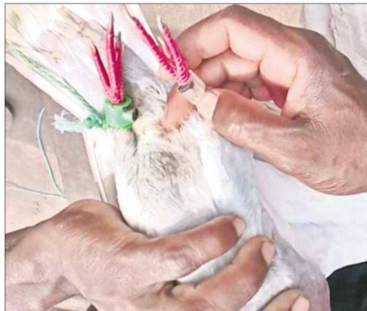
ସମ୍ପୂର୍ଣ୍ଣ ଗୁପ୍ତର ପାଠା ଉଦ୍ଧାର ପ୍ରସଙ୍ଗ

କୋଶାଳ ବେଳାଭୂମି ସିଏଏ ସମ୍ପୂର୍ଣ୍ଣ ସହଯୋଗୀ ଭାବେ ଉଦ୍ଧାର ଧଳା ପାରାର ୨ ଗୋଡ଼ରେ ଲାଗିଥିବା ଇଲେକ୍ଟ୍ରୋନିକ୍ସ ଯନ୍ତ୍ରାଂଶ ଚୁକ୍ତିକାର କରାଯାଇଛି।