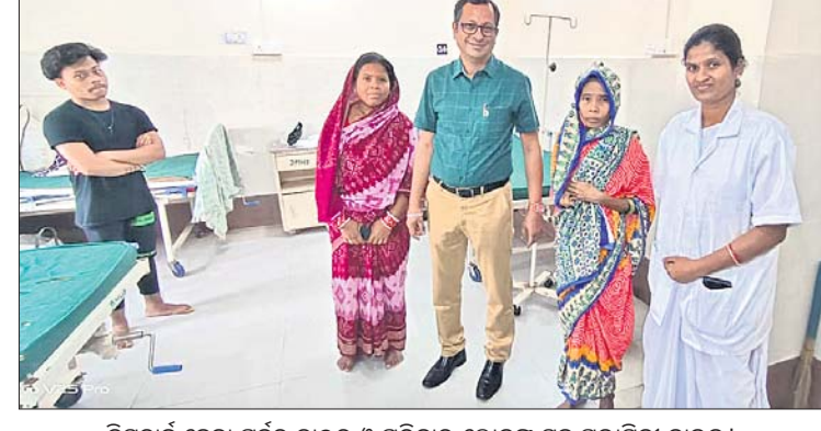
ଡିସ୍ଚାର୍ଜ ହେବା ପୂର୍ବରୁ ଡାକ୍ତର ଓ ପରିବାର ଲୋକଙ୍କ ସହ ପ୍ରତିଷ୍ଠା ନାମକ।

ବିକୃତ ସ୍ୱାସ୍ଥ୍ୟ କଲ୍ୟାଣ ଯୋଜନା (ବିଏସକେଏଲ) ଏବଂ ଗଞ୍ଜାମ ଜିଲ୍ଲା ମାନସିକ ସ୍ୱାସ୍ଥ୍ୟ ଚିକିତ୍ସା କ୍ଷେତ୍ରରେ ଯୋଗୁ କର୍ମଚାରୀଙ୍କ ଦିନକୁ ଦିନ ସୁସ୍ଥ ହୋଇଛନ୍ତି।