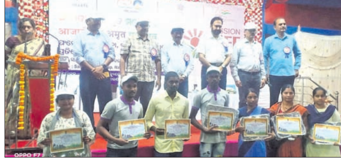
ଫଟୋଟିଭୁ ପ୍ରଦର୍ଶନୀ ଉଦ୍ଘାଟିତ କରାଯାଇଛି।

ନବରଙ୍ଗପୁର ଜିଲ୍ଲାରେ ଫଟୋଟିଭୁ ପ୍ରଦର୍ଶନୀ ଉଦ୍ଘାଟିତ କରାଯାଇଛି।