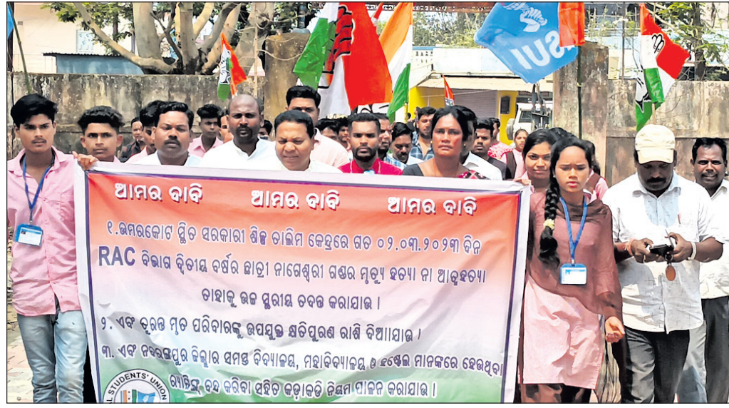
ଜିଲ୍ଲା ଛାତ୍ର କଂଗ୍ରେସ ପକ୍ଷରୁ ନବରଙ୍ଗପୁର ଜିଲ୍ଲା ସଂଯୋଜକ ନିଯୁକ୍ତ ଦାବି କରାଯାଇଛି।

ନବରଙ୍ଗପୁର ଜିଲ୍ଲା ଉପରକୋଟରେ ଥିବା ସରକାରୀ ଶିଳ୍ପ ଚାଳିନୀ କେନ୍ଦ୍ର(ଆଇଟିଆଇ)ରେ ଅଧ୍ୟୟନରତ ଛାତ୍ରୀମାନଙ୍କ ଦ୍ୱାରା ନବରଙ୍ଗପୁର ଜିଲ୍ଲା ସଂଯୋଜକ ନିଯୁକ୍ତ କରାଯାଇଛି।