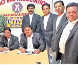
୧୫ ଜଣଙ୍କ ପ୍ରାର୍ଥପତ୍ର କାଏମ ହୋଇଛି।

ନବରଙ୍ଗପୁର ଜିଲ୍ଲାରେ ୧୫ ଜଣଙ୍କ ପ୍ରାର୍ଥପତ୍ର କାଏମ ହୋଇଛି।