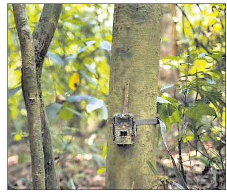
ଗଛରେ ଲାଗିଥିବା ଗ୍ରାମ୍ କ୍ୟାମେରା।

ମହାବଳ ବାଘର ଗତିବିଧି ନିରୀକ୍ଷଣ ପାଇଁ କେନ୍ଦୁଝର ଜିଲ୍ଲା ପାଟଣା ରେଞ୍ଜ ଅଞ୍ଚଳରେ ଲଗାଯାଇଥିବା ୨ ଗ୍ରାମ୍ (ସିଏସିଆଇ) କ୍ୟାମେରା ଚୋରି ହୋଇଯାଇଛି।