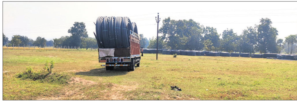
ବିପଦ ସଙ୍କୁଳ ଭାବେ ୧୧ କେଡି ବିନ୍ୟାସ କରାଯାଇଥିବା ଲାଞ୍ଜରୁଟି ରାଜ୍ୟରୁ ବାହାରି ଯିବାକୁ ପଡ଼ିଛି ।

କର୍ମଚାରୀଙ୍କୁ ଉପକ୍ରମରେ ନେତୃତ୍ୱ ଦାନ କରିବା ପାଇଁ ଭାରତୀୟ କର୍ମଚାରୀଙ୍କୁ ନିଯୁକ୍ତ କରାଯାଇଛି । ଶ୍ରୀଲଙ୍କା ଦଳ ୨୭ ଓଭରରେ ୧୨୫ ରନ କରିଥିଲା ।