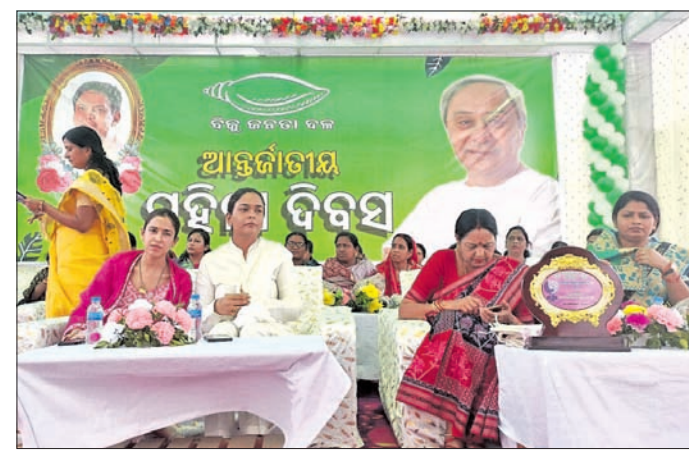
କାର୍ଯ୍ୟକ୍ରମରେ ଅତିଥି ଓ କର୍ମକର୍ତ୍ତା ।