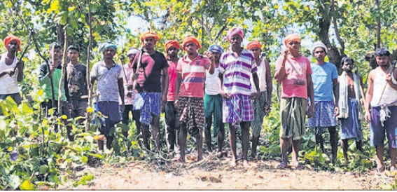
ଜଙ୍ଗଲ ସୁରକ୍ଷା ନେଇ ପହରା ଦେଉଥିବା ଗ୍ରାମବାସୀ।