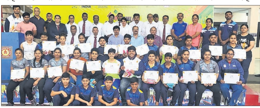
ଖେଲୋ ଇଣ୍ଡିଆ ଦଶ୍ କା ଦମ୍ ଭାରୋଭୋଲନରେ ଭାଗ ନେଇଥିବା ପ୍ରତିଯୋଗୀମାନେ କର୍ମକର୍ତ୍ତାଙ୍କ ସହ।