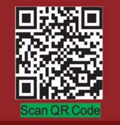
Scan QR Code