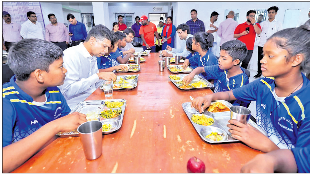
ହେମବିରରେ ୫-ଟି ସଚିବ ଭି.କେ. ପାଠ୍ୟପୁସ୍ତକ ଗ୍ରହଣରେ ଖାଇଛନ୍ତି।

ପୁରୁରଗଡ଼/ରାଜଗାଙ୍ଗପୁର, ୧୨୩୩(ଡି.ଏନ.ଏ.) ୫-ଟି ସଚିବ ଭି.କେ. ପାଠ୍ୟପୁସ୍ତକ ଟିକି ଦିଆଯାଇଥିବା ପରେ ୫-ଟି ସଚିବ ଦିନିଆ ପୁରୁରଗଡ଼ ଜିଲ୍ଲା ଗସ୍ତ କାର୍ଯ୍ୟକ୍ରମରେ ରବିବାର ପୁରୁରଗଡ଼ ଉପଖଣ୍ଡର ୪ଟି ବ୍ଲକ ତଥା ପୁରୁରଗଡ଼ ସହର ପରିବର୍ତ୍ତନ କରି ବିଭିନ୍ନ ଉନ୍ନୟନ କାର୍ଯ୍ୟର ସମାପ୍ତ କରିଛନ୍ତି। ସଚିବ ପାଠ୍ୟପୁସ୍ତକ ସମାପ୍ତ ରାଜନୀତିକୋଇଲୀ ହକି ଭିଲେଜକୁ ବାହାରି ପ୍ରଥମେ ରାଜଗାଙ୍ଗପୁରସ୍ଥିତ ଯୋଗେ ମନ୍ଦିର ପରିବର୍ତ୍ତନ କରିଥିଲେ। ମନ୍ଦିର ପୂଜକ ତଥା ମନ୍ଦିର କମିଟି ସହ ମନ୍ଦିରର ବିକାଶ ସମ୍ପର୍କରେ ଆଲୋଚନା କରିଥିଲେ। ମନ୍ଦିର ପରିସର ଉନ୍ନୟନକରଣ ତଥା ପାର୍ଟି ବ୍ୟବସ୍ଥା, ମନ୍ଦିରରେ ବାସିକ ମେଳା ନିମନ୍ତେ ଆନୁଷ୍ଠାନିକ ବ୍ୟବସ୍ଥା କରିବା ସହିତ ଅଧିକାଂଶସଂଖ୍ୟା ଥିବା ବିଭିନ୍ନ ଦାବି ଯଥା ପାଚେତା ଓ ପୋଲି ନିର୍ମାଣ, ପୁରୁଣା ଧର୍ମଶାଳାର ପୁନରୁଦ୍ଧାର ଆଦି ନେଇ ଏକ ବିସ୍ତୃତ ଯୋଜନା ପ୍ରସ୍ତୁତ କରିବାକୁ ନିର୍ଦ୍ଦେଶ ଦେଇଥିଲେ। ପରେ ଆମ ହସ୍ତିତାଳ ଯୋଜନା ଅନ୍ତର୍ଗତ ରୂପାନ୍ତରଣ ହେବାକୁ ଥିବା ରାଜଗାଙ୍ଗପୁର ଗୋଷ୍ଠୀ ସ୍ୱାସ୍ଥ୍ୟ କେନ୍ଦ୍ର ପରିବର୍ତ୍ତନ କରିଥିଲେ। ଡାକ୍ତର, ଷ୍ଟାଫ୍, ରୋଗୀଙ୍କ ସହ ଆଲୋଚନା କରିଥିଲେ। ଗୋଷ୍ଠୀ ସ୍ୱାସ୍ଥ୍ୟକେନ୍ଦ୍ରରେ ଚାଲିଥିବା ଅନ୍ୟାନ୍ୟ ବିକାଶମୂଳକ କାର୍ଯ୍ୟ ମଧ୍ୟ ପରିବର୍ତ୍ତନ କରିଥିଲେ ଏବଂ କାର୍ଯ୍ୟ ପ୍ରକ୍ରିୟା ଉଦ୍ଘାଟିତ କରି ସମୟରେ ପ୍ରକଳ୍ପ ସମାପ୍ତ କରିବାକୁ ନିର୍ଦ୍ଦେଶ ଦେଇଥିଲେ। ସେହିପରି ରାଜଗାଙ୍ଗପୁର ରେଲୱେ ଓଡ଼ର ବ୍ରିକ କାର୍ଯ୍ୟ ପରିବର୍ତ୍ତନ କରିଥିଲେ। ସମସ୍ତ ହିତାଧିକାରୀଙ୍କ