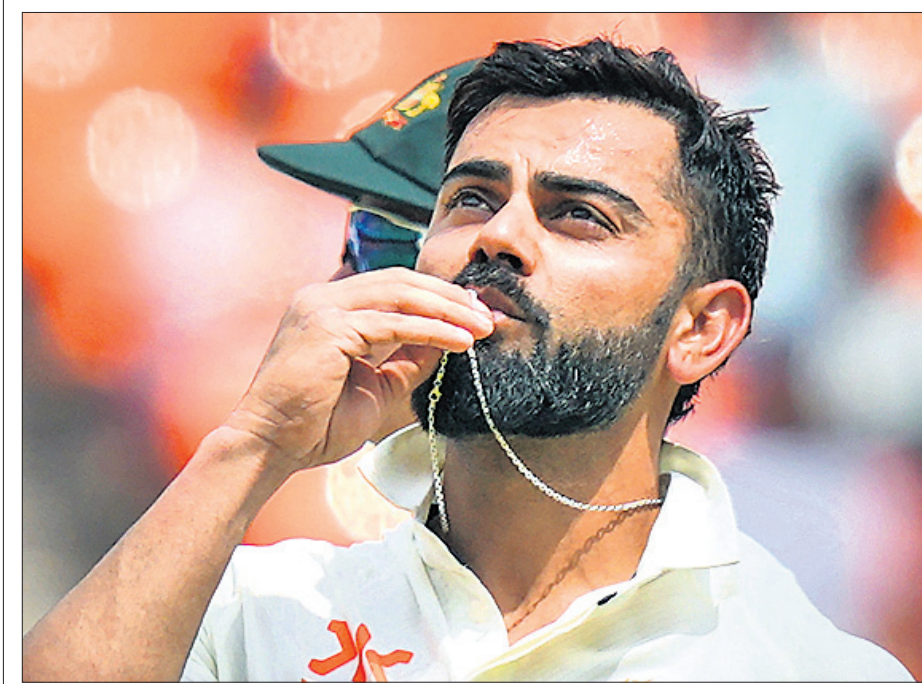
ଫ୍ଲେଟି ରିଜ୍ଜୁ କୁମ୍ଭନ ଦେଉଛନ୍ତି କୋହଲି।

ବିରାଟ କୋହଲିଙ୍କ ବହୁ ପ୍ରତୀକ୍ଷିତ ଚେଷ୍ଟା ଶତକ ସହାୟତାରେ ଭାରତ ଏଠାରେ ଚାଲିଥିବା ଅଷ୍ଟ୍ରେଲିଆ ବିପକ୍ଷ ଚତୁର୍ଥ ତଥା ଅନ୍ତିମ କ୍ରିକେଟ ଟେଷ୍ଟରେ ବଡ଼ ଘୋର କରିବାରେ ସକ୍ଷମ ହୋଇଛି। ଦୀର୍ଘ ୪୦ ମାସ ପ୍ରତୀକ୍ଷାର ଅବସାନ ଘଟାଇ ବିରାଟ ହାସଲ କରିଥିଲେ କ୍ୟାରିୟରର ୨୮ତମ ଟେଷ୍ଟ ଶତକ। ଖେଳିଥିଲେ ୧୮୬ ରନ୍ର ମାରାଥନ ଇନିଂସ୍। ଫଳରେ ଭାରତ ପ୍ରଥମ ଇନିଂସରେ ୫୭୧ ରନ୍ ଘୋର କରିଥିଲା। ଅଷ୍ଟ୍ରେଲିଆ ପ୍ରଥମ ଇନିଂସରେ ୪୮୦ ରନ୍ କରିଥିବାକୁ ଭାରତକୁ ୯୧ ରନ୍ର ଅଗ୍ରଣୀ ମିଳିଥିଲା। ରବିବାର ୪ର୍ଥ ଦିବସରେ ଭାରତକୁ ଅଷ୍ଟ୍ରେଲିଆ ଦ୍ୱିତୀୟ ଇନିଂସରେ ୬ ଓଭର ବୋଲି କରିବାକୁ ସୁଯୋଗ ମିଳିଥିଲା। ରକ୍ଷଣାତ୍ମକ ଖେଳିଥିବା ଅଷ୍ଟ୍ରେଲିଆ ଷ୍ଟୁଣ୍ଟ ବେକକୁ କୌଣସି ଉତ୍ତର କେତ ନ ହରାଇ ୩ ରନ କରିଥିଲା। ଭାରତ ୮୮ ରନ୍ରେ ଅଗ୍ରଣୀଭାବେ କରିଥିବାକୁ ଏବଂ ସୋମବାର ମ୍ୟାଚର ଅନ୍ତିମ ଦିବସ ହୋଇଥିବାକୁ ମ୍ୟାଚ ଡ୍ର ରହିବା ସମ୍ଭାବନା ବଢ଼ିଛି। ଭାରତ ଯଦି ବିଜୟୀ ହୁଏ ତେବେ ସିଧାସଳଖ ବିଶ୍ୱ ଚେଷ୍ଟ ଚାମ୍ପିୟନଶିପ୍ ପାଇନାଲରେ ପ୍ରବେଶ କରିବ। ଏ କ୍ଷେତ୍ରରେ ଆଉ ଶ୍ରୀଲଙ୍କା-ନ୍ୟୁଜିଲାଣ୍ଡ ଚେଷ୍ଟା ସିରିଜର ଫଳାଫଳକୁ