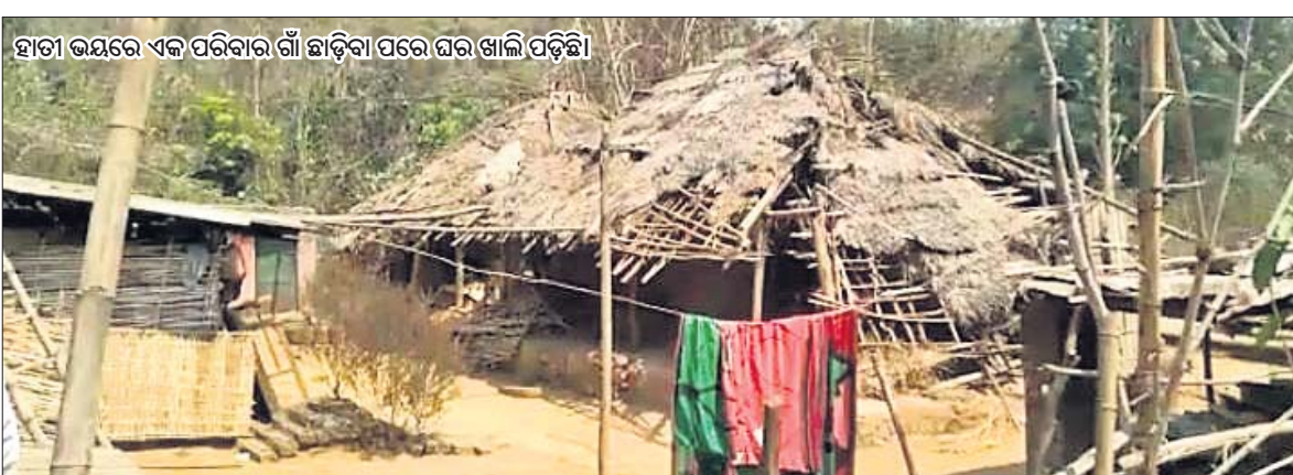
ହାତୀ ଭୟରେ ଏକ ପରିବାର ଗାଁ ଛାଡ଼ିବା ପରେ ଘର ଖାଲି ପଡ଼ିଛି।

ଡେକାନାଲ ଅଫିସ, ୧୨୩ କି ଦିନ କି ରାତି, ଗାଁ ରାସ୍ତାରେ ପଲପଲ ହୋଇ ବୁଲୁଛନ୍ତି ହାତୀ। କେତେବେଳେ ଘର ଭାଙ୍ଗିଛନ୍ତି ତ ଆଉ କେବେ ଶୁଖିରେ ଚେଳି ନେଉଛନ୍ତି ଘରେ ସାଇତି ରଖାଯାଇଥିବା ଧାନ, ଚାଉଳ ବସ୍ତା।