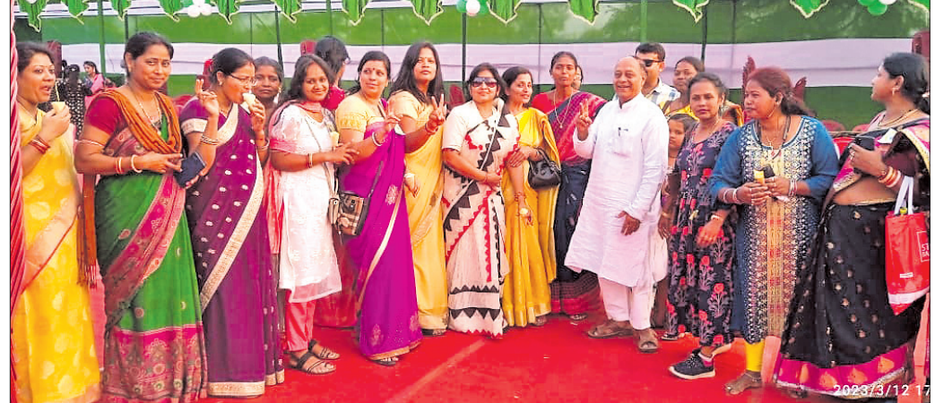
ରାଉରକେଲାରେ ବିଶ୍ୱ ମହିଳା ଦିବସରେ ଉପସ୍ଥିତ ଅତିଥି ।

ଆତ୍ମା ସଦ୍‌ଗତି ନିମନ୍ତେ ବୁଦ୍ଧ ମିନିଟ ନାମକ ପ୍ରାର୍ଥନା କରାଯାଇଥିଲା । ଏହା ପରେ ସଭାକାର୍ଯ୍ୟ ଆରମ୍ଭ ହୋଇଥିଲା । ସଭାରେ ଶିକ୍ଷା, କୃଷି, ଚାଳିତକଣ, ସାମାଜିକ ସମସ୍ୟା ଓ ତାର ସମାଧାନ ଉପରେ ବିସ୍ତୃତ ଆଲୋଚନା ହୋଇଥିଲା । ଝାରସୁଗୁଡ଼ା, ସୁନ୍ଦରଗଡ଼ ଓ ସମ୍ବଲପୁର ଜିଲ୍ଲାର ୨୪ଟି ସାମ୍ବଲପୁର କମିଟି କର୍ମକର୍ତ୍ତାମାନେ ଯୋଗଦେଇ ଉପସ୍ଥାପନ କରିଥିଲେ । ସାମ୍ବଲପୁର କର୍ମକର୍ତ୍ତା ଚୟନ ସହିତ ଗାଦିର ବିଭିନ୍ନ କାର୍ଯ୍ୟକ୍ରମକୁ ବିବରଣୀ ଓ ସମାଧାନ କରି ସମାଧାନ ଉପରେ ଆଲୋଚନା ହୋଇଥିଲା । କାତି ସମାଜର ଉନ୍ନତି, ଏକତା, ସଂସ୍କାର ଉପରେ ବରିଷ୍ଠ