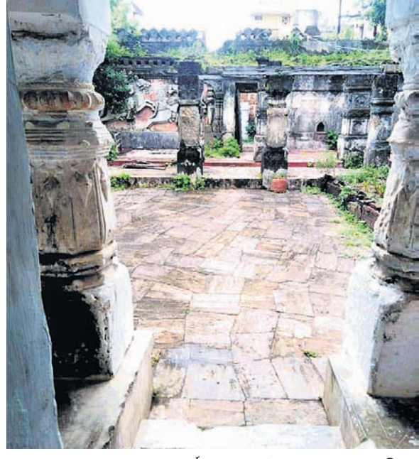
ଚକ୍ରାଳୀନ ଶ୍ରୀଶଙ୍କରାନନ୍ଦ ମଠର ବର୍ତ୍ତମାନ ଦୃଶ୍ୟ।