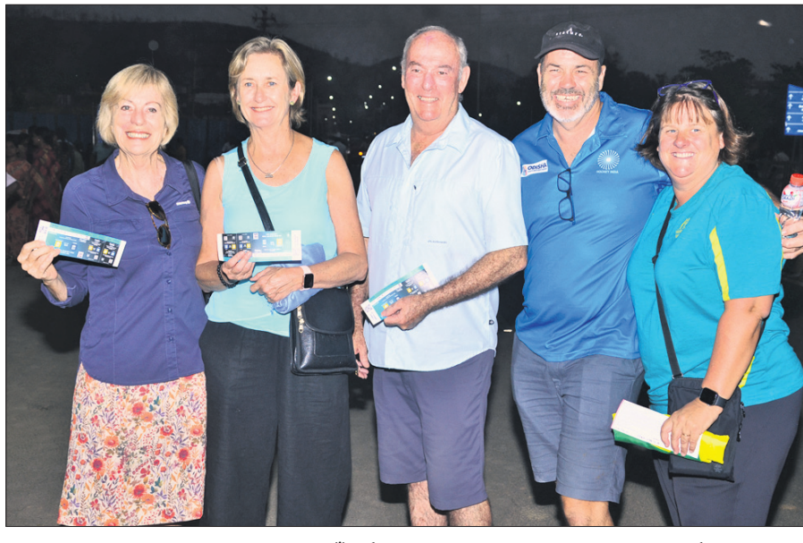
ପ୍ରୋ-ଲିଗ୍ ହକି ମ୍ୟାଚ ଦେଖିବା ପାଇଁ ବିର୍ଯ୍ୟପୁଣ୍ଡା ଷ୍ଟାଡ଼ିୟମରେ ଉପସ୍ଥିତ ଅଷ୍ଟ୍ରେଲିଆ ସମର୍ଥକ।

ପାଇଁ ପ୍ରୟାସ କରିଥିଲେ ହେଁ ପରାଜୟ ସ୍ୱୀକାର କରିଥିଲେ। ଚଳିତ ଲିଗରେ ୨ ମ୍ୟାଚରୁ ଅଷ୍ଟ୍ରେଲିଆର ଏହା ଦ୍ୱିତୀୟ ପରାଜୟ। ନିଜର ପୂର୍ବ ମ୍ୟାଚରେ ଦଳ ବିଶ୍ୱ ଚାମ୍ପିୟନ ଜର୍ମାନୀଠାରୁ ଗୋଟିଏ ଗୋଲରେ ହାରିଥିଲା। ଭାରତ ଏହାର ପରବର୍ତ୍ତୀ ମ୍ୟାଚ ସୋମବାର ଜର୍ମାନୀ ବିପକ୍ଷରେ ଖେଳିବ।