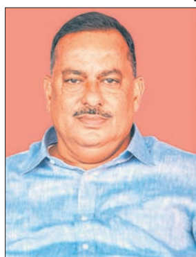
ଭୁବନେଶ୍ୱର, ୧୨୩ (କ୍ରୀଡ଼ା ପ୍ରତିନିଧି) ଫିଫା କଂଗ୍ରେସରେ ୭୩ତମ ସଂଘର ଶାଖାର କିରାଲିଠାରେ ଚଳିତ ମାସ ୧୬ ତାରିଖରେ ଅନୁଷ୍ଠିତ ହେବ।