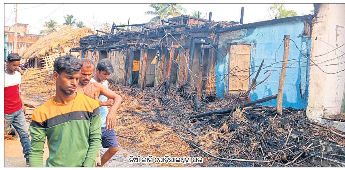
ନିଆଁ ଲାଗି ଯୋଡ଼ିଯାଇଥିବା ଘର

ଉ- ଅବସର ସମୟରେ ପରିବାର ଓ ପରିଚ୍ଛେଦିତ ସହିତ ସମୟ ବିତାଇବା ସହ ବିବେଶ କ୍ରମଣ ଓ ସ୍ୱଦେଶୀ ପର୍ଯ୍ୟଟନସ୍ଥଳ ବୁଲିବାକୁ ଭଲଲାଗେ। ଏପରିକି ବ୍ୟବସାୟରେ କଢ଼ିତ ଥିବାରୁ ବିଭିନ୍ନ ଦିଗ ଓ ସରକାରୀ ନୀତିନିୟମ ସମ୍ପର୍କରେ ଅବଗତ ହେବା ସହ ବ୍ୟବସାୟିକ କାର୍ଯ୍ୟକଳାପ ଉପରେ ଚର୍ଚ୍ଚା, ଆଲୋଚନା କରିବାକୁ ଭଲଲାଗେ।