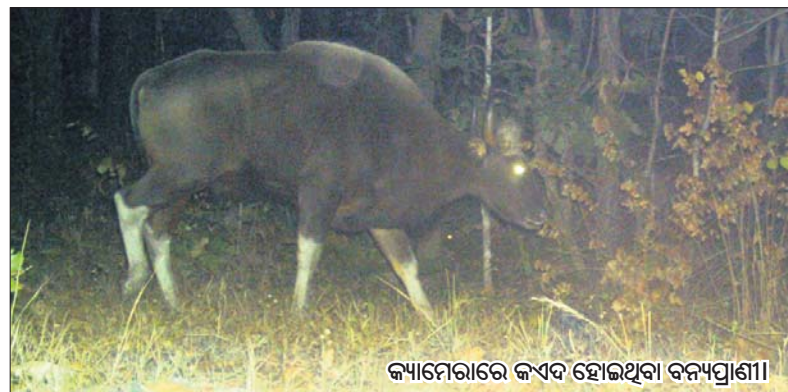
କ୍ୟାମେରାରେ କଏଦ ହୋଇଥିବା ବନ୍ୟପ୍ରାଣୀ।