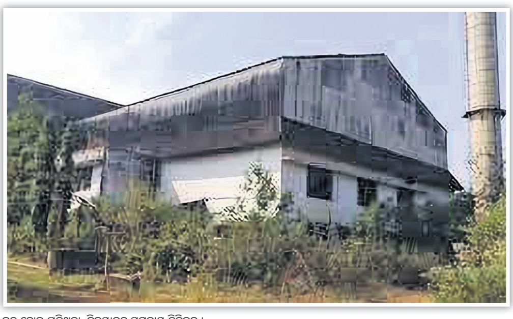
ବନ୍ଦ ହୋଇ ପଡିଥିବା ବିଜୟନଗର ସମବାୟ ତିନିକଳ।