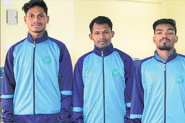
ପୂର୍ବାଞ୍ଚଳରୁ ଖେଳିବା ପାଇଁ ଯୋଗ୍ୟତା ଅର୍ଜନ କରିଥିବା କିସ୍ ଦଳ।

ପ୍ରତିଯୋଗିତାରେ ଅଂଶଗ୍ରହଣ ପାଇଁ କିସ୍ ଦଳ ରବିବାର ଚେନାଇ ଯାତ୍ରା କରିଛି। ଭାରତର ୪ କୋଚ୍ ଇସ୍, ଡେସ୍, ନର୍ଥ ଓ ସାଉଥରୁ ଶ୍ରେଷ୍ଠ ୧୬ଟି ଦଳ ଏହି ପ୍ରତିଯୋଗିତାରେ ଅଂଶଗ୍ରହଣ କରିବେ। କିସ୍ ଓ କିସ୍ ପ୍ରତିଷ୍ଠାତା ତଥା ଏମ୍ପି ଅଧିକାରୀ ସାମନ୍ତ କିସ୍ ଚେଷ୍ଟ ଦଳକୁ ଯାତ୍ରା ଅବସରରେ ଶୁଭେଚ୍ଛା ଜଣାଇଛନ୍ତି।