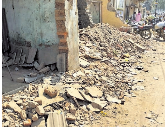
ଉଚ୍ଛେଦ ପରେ ପଡିଥିବା ଭଙ୍ଗା ସାମଗ୍ରୀ।