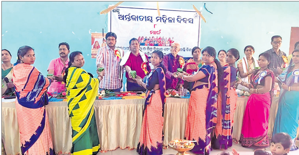
ମହିଳା ଦିବସ ପାଳନ ଅବସରରେ ମଞ୍ଚାଧୀନ ଅତିଥି ।