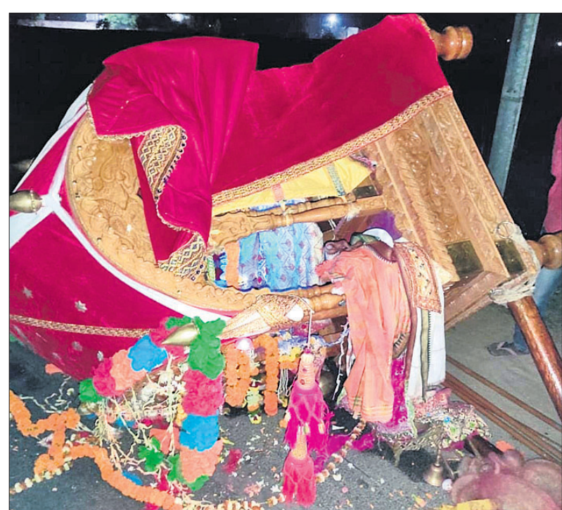
ପିକ୍‌ଅପ୍ ଭ୍ୟାନ୍ ଧକ୍କାରେ ଭାଙ୍ଗି ଯାଇଥିବା ଦୋଳବିମାନ।

ଓମଫୋର୍ଡ଼ ଛକରେ ଶନିବାର ବିଳମ୍ବିତ ରାତିରେ ଏହି ଘଟଣା ଘଟିଛି। କେନ୍ଦ୍ରାପଡ଼ାଠାରୁ ପ୍ରାୟ ୧୦ କିଲୋମିଟର ଦୂର ବାଲିଆ ବଜାରର ବୋଲ ମେଳଣ ଉପରେ ଏହି ଦିନାନ୍ତ ସାମାଜିକ ହୋଇଥିଲା। ଦୁର୍ଘଟଣା ପରେ ବାଲିଆ ବଜାର ପୁଣି ଥରେ ଚଳି ଆସିଛି। ଗତ ନଭେମ୍ବରରେ ବାଲିଆ ବଜାରର କାର୍ତ୍ତିକେଶ୍ୱର ମେଳଣ ଉପରେ ବାଣ ଦୁର୍ଘଟଣାରେ ମୂର୍ଦ୍ଧା-୪