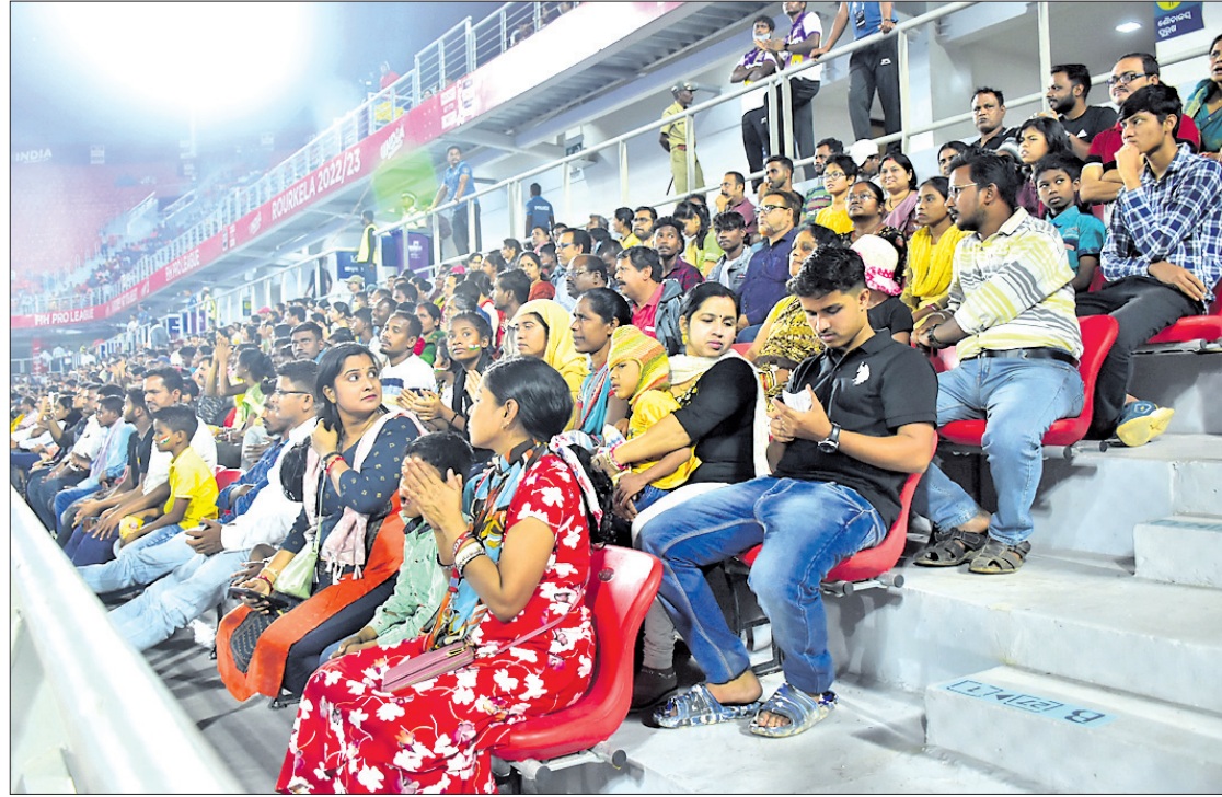
ରାଉରକେଲାରେ ପ୍ରୋ-ଲିଗ ହକି ମ୍ୟାଚରେ ଭାରତୀୟ ଦଳ ସମର୍ଥନରେ ଜଣେ ଶିଶୁ ହାତରେ ତ୍ରିରଙ୍ଗା ପତାକା ଧରି ଯାଉଛନ୍ତି । ଦିବ୍ୟାଙ୍ଗ ବ୍ୟକ୍ତି ସ୍ତ୍ରୋତରରେ ମ୍ୟାଚ ଦେଖିବା ପାଇଁ ଆସିଛନ୍ତି । ସ୍ତ୍ରୋତମାନ ସମୁଦାୟ ଗ୍ୟାଲେରିରେ ଦର୍ଶକଙ୍କ ଭିଡ଼ ।