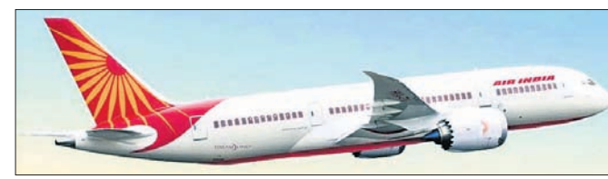
ବିଭିନ୍ନ ଧାରାରେ ମାମଲା ରୁଜୁ ହୋଇଛି। ବିମାନରେ ଧୂଳିପାଳ କିଛି ନାହିଁ। ଅଭିଯୁକ୍ତ ଯାତ୍ରୀ ବିମାନ ବାଧୁମୁଖରେ ସିଗାରେଟ୍ ଲାଗାଇବାକୁ ଆଜ୍ଞା ଦିଆଯାଇଛି। କିନ୍ତୁ ସଦସ୍ୟ ତାଙ୍କୁ ସିଗାରେଟ୍ ଧରିବାକୁ ସମାଜରେ ଦେଖାଇଥିଲେ। ଏଥିସହିତ

୧୧୩ ଦିନରେ ସର୍ବାଧିକ ଦୈନିକ ସଂକ୍ରମଣ ହାଇଡ୍ରାବାଦ, ୧୨ ମାର୍ଚ୍ଚ: ଗତ ୫ ମାସ ହେଲା ପରେ, କୁର, କାଶି ରୋଗ ବଢ଼ିବାରେ ଲାଗିଛି। ଅଧୁନ ୫ ଭୂତାଣୁ ଏହି ସଂକ୍ରମଣର କାରଣ ବୋଲି କୁହାଯାଇଛି। ଗତ ସେପ୍ଟେମ୍ବରରେ ଏଭଳି ରୋଗ ବ୍ୟାପୁଥିବାବେଳେ ଅଧୁନାମ୍ବ ଏହାର ପରୀକ୍ଷା କରାଯାଇ ପାରି ନ ଥିଲା। ଏହିସବୁ ସଂକ୍ରମଣ ପଛରେ ଶାଢ଼ିୟ ଦୁ (ଏସ୍‌ଏନ୍‌୧) ଏବଂ ଏକ୍ସ୍‌୧୯୯୧ (ଏସ୍‌ଏନ୍‌୧୯) ସମ୍ଭବତଃ କାରଣ ହୋଇଥିବାବେଳେ ମୁଖ୍ୟତଃ ୧.୧୯ ପ୍ରତିଶତ ରହିଛି। ବର୍ତ୍ତମାନ ପୂଜା ୨୨୦.୬୪ କୋଟି ଡୋଲର କୋଭିଡ୍ ଟକା ଦିଆଗଲାଣି।