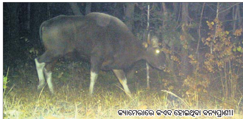
କ୍ୟାମେରାରେ କ୍ୟପ୍ଚର ହୋଇଥିବା ବନ୍ୟପ୍ରାଣୀ।