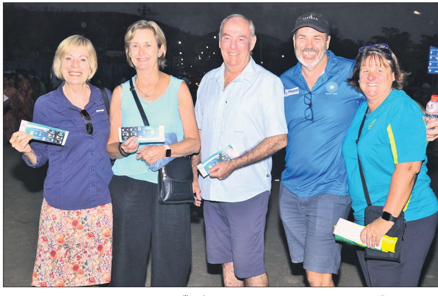
ପ୍ରୋ-ଲିଗ୍ ହକି ମ୍ୟାଚ ଦେଖିବା ପାଇଁ ବିର୍ଯ୍ୟାମୁଖୀ ଷ୍ଟାଡ଼ିୟମରେ ଉପସ୍ଥିତ ଅଷ୍ଟ୍ରେଲିଆ ସମର୍ଥକ।

ପାଇଁ ପ୍ରୟାସ କରିଥିଲେ ହେଁ ପରାଜୟ ସ୍ୱୀକାର କରିଥିଲେ। ଚଳିତ ଲିଗରେ ୨ ମ୍ୟାଚରୁ ଅଷ୍ଟ୍ରେଲିଆର ଏହା ଦ୍ୱିତୀୟ ପରାଜୟ। ନିଜର ପୂର୍ବ ମ୍ୟାଚରେ ଦଳ ବିଶ୍ୱ ଚାମ୍ପିୟନ ଜର୍ମାନୀଠାରୁ ଗୋଟିଏ ଗୋଲରେ ହାରିଥିଲା। ଭାରତ ଏହାର ପରବର୍ତ୍ତୀ ମ୍ୟାଚ ସୋମବାର ଜର୍ମାନୀ ବିପକ୍ଷରେ ଖେଳିବ।