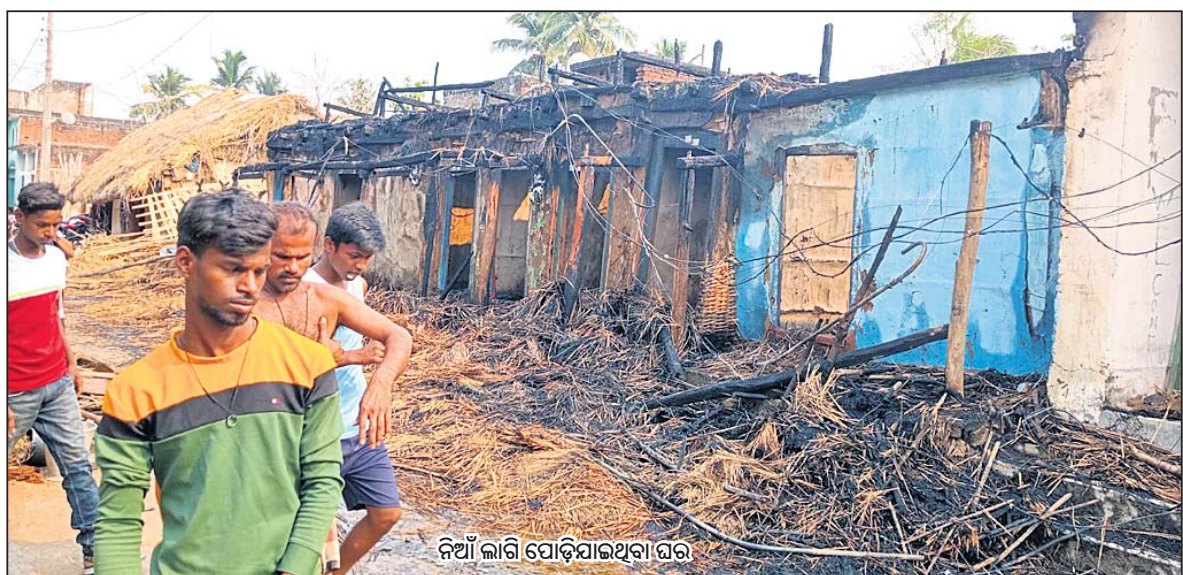
ନିଆଁ ଲାଗି ପୋଡ଼ିଯାଇଥିବା ଘର

ପ୍ର-୬: ଅବସର ସମୟରେ କ'ଣ କରିବାକୁ ଭଲ ପାଆନ୍ତି ? ଉ- ଅବସର ସମୟରେ ପରିବାର ଓ ପରିଜନଙ୍କ ସହିତ ସମୟ ବିତାଇବା ସହ ବିବେଶ ଜୁମ୍‌ମା ଓ ସ୍ୱଦେଶୀ ପର୍ଯ୍ୟଟନସ୍ଥଳ ବୁଲିବାକୁ ଭଲଲାଗେ। ଏପରିକି ବ୍ୟବସାୟରେ କଢ଼ିତ ଥିବାରୁ ବିଭିନ୍ନ ଦିଗ ଓ ସରକାରୀ ନୀତିନିୟମ ସମ୍ପର୍କରେ ଅବଗତ ହେବା ସହ ବ୍ୟବସାୟିକ କାର୍ଯ୍ୟକଳାପ ଉପରେ ଚର୍ଚ୍ଚା, ଆଲୋଚନା କରିବାକୁ ଭଲଲାଗେ।