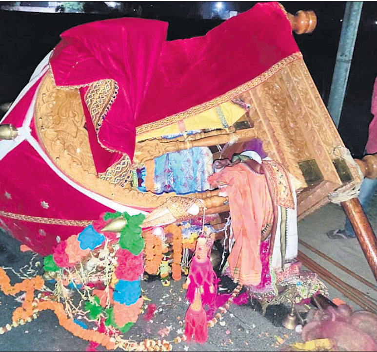
ପିକଅପ୍ ଭ୍ୟାନୁ ଧକ୍କାରେ ଭାଙ୍ଗି ଯାଇଥିବା ଦୋଳବିମାନ।

କେନ୍ଦ୍ରାପଡ଼ା ଅଞ୍ଚଳ, ୧୨/୩ ଦୋଳବିମାନ କାନ୍ଧେ ଯାଉଥିବା ଲୋକଙ୍କ ଉପରକୁ ଏକ ପିକଅପ୍ ଭ୍ୟାନୁ ମାଡ଼ିବା ଯୋଗୁ ୨ଜଣଙ୍କ ମୃତ୍ୟୁ ଘଟିଥିବାବେଳେ ୬ଜଣ ଆହତ ହୋଇଛନ୍ତି। ଆହତଙ୍କ ମଧ୍ୟରୁ ୩ଜଣଙ୍କ ଅବସ୍ଥା ଗୁରୁତର ରହିଛି। ସେମାନଙ୍କୁ କଟକ ବଡ଼ମେଡିକାଲରେ ଚିକିତ୍ସା କରାଯାଉଛି। କେନ୍ଦ୍ରାପଡ଼ା ସଦର ଥାନା ଅନ୍ତର୍ଗତ ମଧ୍ୟଧର