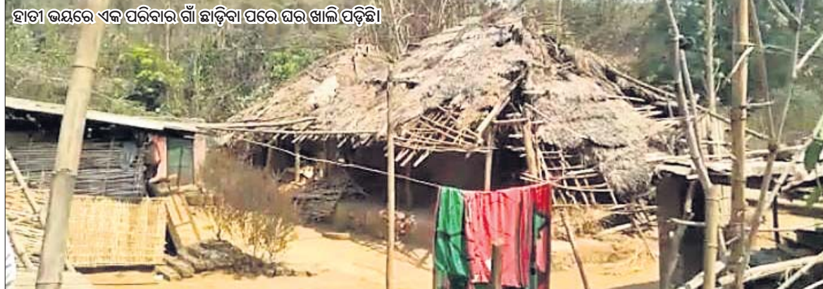
ହାତୀ ଭୟରେ ଏକ ପରିବାର ଗାଁ ଛାଡ଼ିବା ପରେ ଘର ଖାଲି ପଡ଼ିଛି।

ଡେକାନାଲ ଅଫିସ, ୧୨୩ କି ଦିନ କି ରାତି, ଗାଁ ରାସ୍ତାରେ ପଲପଲ ହୋଇ ବୁଲୁଛନ୍ତି ହାତୀ। କେତେବେଳେ ଘର ଭାଙ୍ଗୁଛନ୍ତି ତ ଆଉ କେବେ ଶୁଖିରେ ଚେଳି ନେଉଛନ୍ତି ଘରେ ସାଜି ରଖାଯାଇଥିବା ଧାନ, ଚାଉଳ ବସା। ରୋଷେଇ ଘରେ ହାତୀରେ ଥିବା ପଖାଳ ମଧ୍ୟ ସେମାନଙ୍କ ମୁହଁରେ ବାଦ୍ ପଡ଼ୁନାହିଁ। ବନ ବିଭାଗ ହାତୀ ଘଉଡ଼ାଇବାରେ ବିଫଳ ହୋଇଥିବାବେଳେ ଜୀବନ ବଞ୍ଚାଇବାକୁ ଛାଡ଼ ଉପରେ ଦିନ କାରୁଛନ୍ତି ଡେକାନାଲ ସଦର ରେଞ୍ଜ ଅଧୀନ ବଲାଙ୍ଗିପାଟଣା କୁଆଙ୍ଗ ସାହିବାସୀ। କେବଳ ଏତିକି ନୁହେଁ, ଚାଳଘରେ ରହୁଥିବା ବହୁ ପରିବାର ନିକଟରେ ବିକଳ ନ ଥିବାରୁ ସେମାନେ ଭିତାମାତି ଛାଡ଼ି ନିଜ ସମ୍ପର୍କୀୟଙ୍କ ଘରେ ମୁଣ୍ଡ ଚୁଞ୍ଚିଛନ୍ତି। ଅଞ୍ଚଳବାସୀଙ୍କ କହିବା କଥା, ପ୍ରାୟ ମାସେ ହେଲା