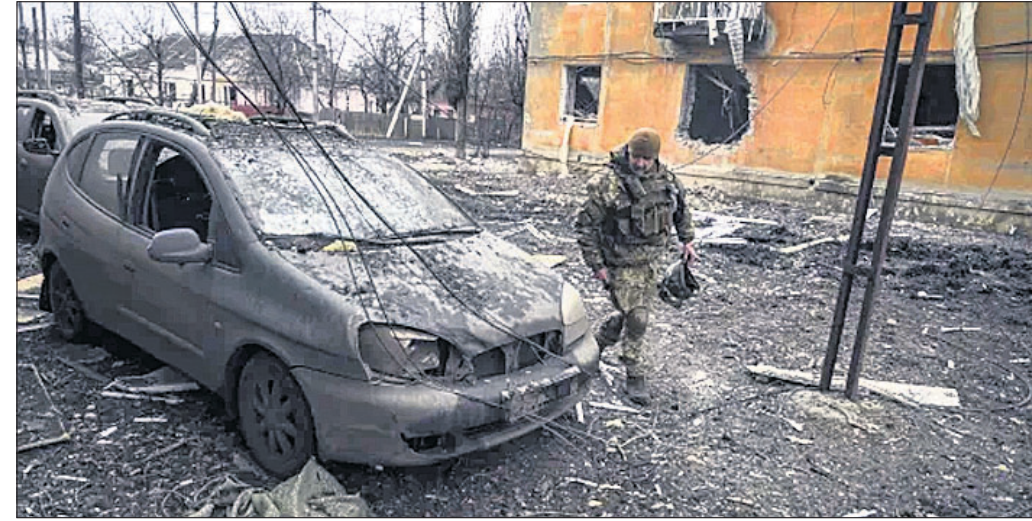
ବାଖମୁର୍ ନିକଟବର୍ତ୍ତୀ ଚପିଲ ଯାଏର ସହରର ଏକ ଗାଁରେ ସେଲ୍ ଫାଡ଼ରେ ନଷ୍ଟ ହୋଇଯାଇଥିବା ବାଖମୁର୍ ୟୁକ୍ରେନ୍‌ର ସୈନ୍ୟଙ୍କ ଦ୍ୱାରା ନିକଟରେ ଉଦ୍‌ଘାଟନ କରାଯାଇଛି।

୨୪ ଘଣ୍ଟା ମଧ୍ୟରେ ରୁଷିଆ ପକ୍ଷରୁ ମୋଟ ୨୨୧ ଆହତ ହୋଇଛନ୍ତି। ୟୁକ୍ରେନ୍‌ରୁ ମୋଟ ୩୦୦ ଆହତ ହୋଇଛନ୍ତି।