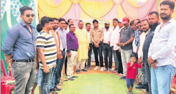
ଭୂମିପୂଜା କାର୍ଯ୍ୟକ୍ରମରେ ଉପସ୍ଥିତ ଖବରଦାତାମାନେ ।