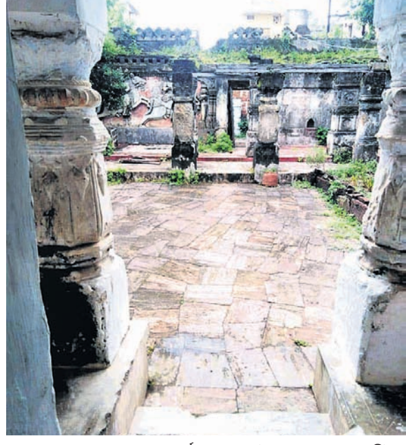
ଚତୁର୍ଦ୍ଧା ଶ୍ରୀଶଙ୍କରାୟନ ମଠର ବର୍ତ୍ତମାନ ଦୃଶ୍ୟ।