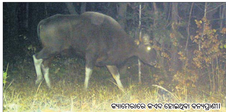
କ୍ୟାମେରାରେ କଏଦ ହୋଇଥିବା ବନ୍ୟପ୍ରାଣୀ।