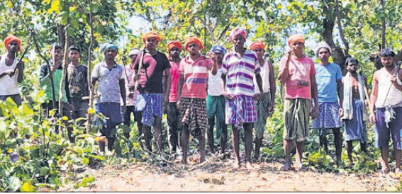
ଜଙ୍ଗଲ ସୁରକ୍ଷା ନେଇ ପହରା ଦେଉଥିବା ଗ୍ରାମବାସୀ।