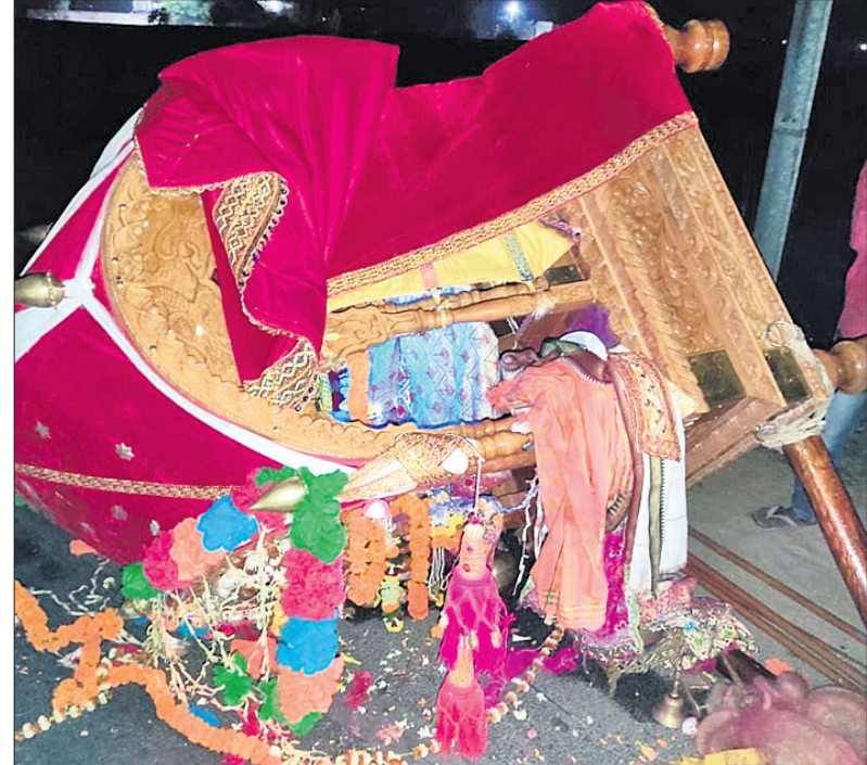
ପିକଅପ୍ ଭ୍ୟାନ୍ ଧକ୍କାରେ ଭାଙ୍ଗି ଯାଇଥିବା ଦୋଳବିମାନ।

ଓମଫୋର୍ଡ଼ ଛକରେ ଶନିବାର ବିଳମ୍ବିତ ରାତିରେ ଏହି ଘଟଣା ଘଟିଛି। କେନ୍ଦ୍ରାପଡ଼ାଠାରୁ ପ୍ରାୟ ୧୦ କିଲୋମିଟର ଦୂର ବାଲିଆ ବଜାରର ଦୋଳ ମେଳଣ ଉତ୍ସବରେ ଏହି ଦିନାନ୍ତ ସାମାଜିକ ହୋଇଥିଲା। ଦୁର୍ଘଟଣା ପରେ ବାଲିଆ ବଜାର ପୂର୍ଣ୍ଣ ଥରେ ଚଳାଣି ଆସିଛି। ଗତ ନଭେମ୍ବରରେ ବାଲିଆ ବଜାରର କାର୍ତ୍ତିକେଶ୍ୱର ମେଳଣ ଉତ୍ସବରେ ବାଣ ଦୁର୍ଘଟଣାରେ ଫ୍ଲୋପ୍-୪