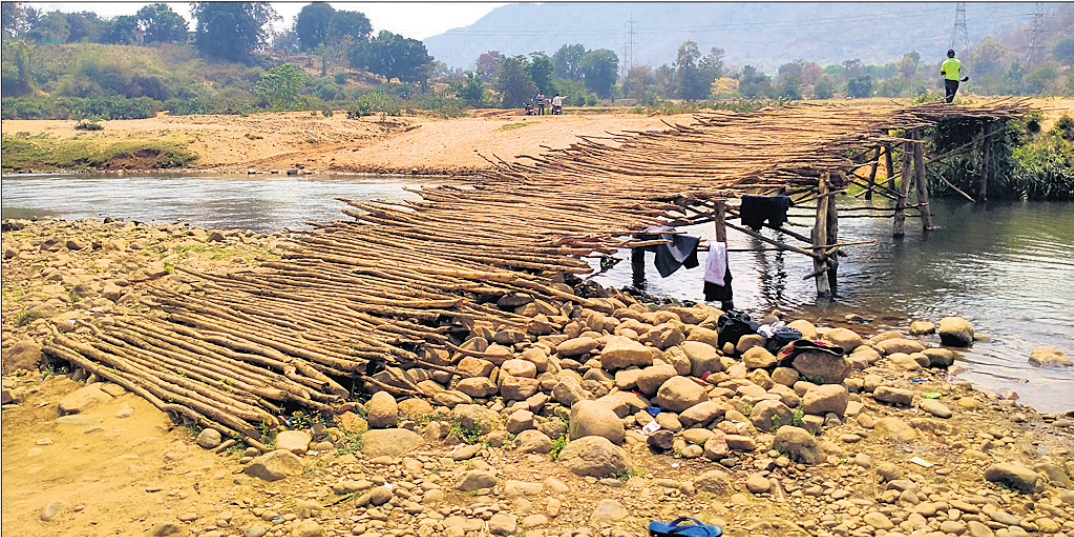
ଗ୍ରାମବାସୀ ନିର୍ମାଣ କରିଥିବା କାଠ ପୋଲ ।

୧୯୯୨ରେ ରାୟଗଡ଼ା ସ୍ୱତନ୍ତ୍ର ଜିଲାର ମାନ୍ୟତା ପାଇଥିଲା। ଏହି ଜିଲ୍ଲାକୁ ଇତିମଧ୍ୟରେ ୩୦ ବର୍ଷ ପୂରିଛି। ହେଲେ ଏବେ ବି ଜିଲାର ବହୁ ଅଞ୍ଚଳକୁ ଗମନାଗମନ ସୁବିଧା ନାହିଁ। ଜିଲାର ଉପାନ୍ତ ଅଞ୍ଚଳରେ ବିକାଶ କେବଳ କାଗଜ କମଳରେ ସିମାନ୍ତ ରହିଛି। ନଦୀ ପାର ହୋଇ ମୁଖ୍ୟ ରାସ୍ତା ସଂଯୋଗ ପଥକୁ ଆସୁଥିବା ଗ୍ରାମବାସୀ ବାରମ୍ବାର ପ୍ରଶ୍ନାସନକୁ ଗୃହାରି କରିବା ପରେ ବି ପୋଲ ନିର୍ମାଣ ହେଲାନି। ତେଣୁ ଗ୍ରାମବାସୀ ନିଜ ଖର୍ଚ୍ଚରେ କାଠ ପୋଲ ନିର୍ମାଣ କରିଛନ୍ତି। ଜିଲାର କଳ୍ୟାଣସିଂହପୁର ବ୍ଲକ୍‌ରେ ଏଭଳି ଦେଖିବାକୁ ମିଳିଛି। କଳ୍ୟାଣସିଂହପୁର ବ୍ଲକ୍ ଅନ୍ତର୍ଗତ ତଳସାକା ଓ ଉପରସାକା ଗ୍ରାମବାସୀ ନାଗାବଳୀ ନଦୀ ଉପରେ ନିଜସ୍ୱ ଖାନକୋଶକରେ କାଠ ପୋଲ ନିର୍ମାଣ କରିଛନ୍ତି। ଆଗକୁ ଏଠାରେ ଘଣ୍ଟା ପୋଲ ନିର୍ମାଣ କରା ନ ଗଲେ ଭୋଟ ବର୍ଜନ କରିବେ ବୋଲି କହିଛନ୍ତି।