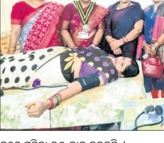
ଜଣେ ମହିଳା ରକ୍ତ ଦାନ କରୁଛନ୍ତି ।

କୃତ ସଦସ୍ୟା ରକ୍ତଦାନ ଶିବିର କରି ମହିଳା ଦିବସ ପାଳନ କରିଛନ୍ତି। ଏହି ରକ୍ତଦାନ ଶିବିରରେ ସ୍ୱତନ୍ତ୍ର ଉନ୍ନୟନ ପରିଷଦ