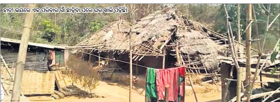
ହାତୀ ଭୟରେ ଏକ ପରିବାର ଗାଁ ଛାଡ଼ିବା ପରେ ଘର ଖାଲି ପଡ଼ିଛି।

ଡେକାନାଲ ଅଫିସ, ୧୨୩ କି ଦିନ କି ରାତି, ଗାଁ ରାସ୍ତାରେ ପଲପଲ ହୋଇ ବୁଲୁଛନ୍ତି ହାତୀ। କେତେବେଳେ ଘର ଭାଙ୍ଗିଛନ୍ତି ତ ଆଉ କେବେ ଶୁଖିରେ ଚେଳି ନେଉଛନ୍ତି ଘରେ ସାଇତି ରଖାଯାଇଥିବା ଧାନ, ଚାଉଳ ବସ୍ତା।