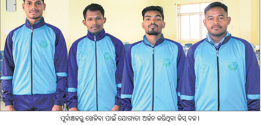
ପୂର୍ବାଞ୍ଚଳରୁ ଖେଳିବା ପାଇଁ ଯୋଗ୍ୟତା ଅର୍ଜନ କରିଥିବା କିସ୍ ଦଳ।