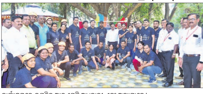
କାର୍ଯ୍ୟକ୍ରମରେ ଉପସ୍ଥିତ ଆରୁଏମ୍‌ସି ଅଧିକାରୀ ଏବଂ ଅନ୍ୟମାନେ । ରାଉରକେଲା ଅଫିସ୍, ୧୪୩୩

ସୁନ୍ଦରଗଡ଼ ଜିଲ୍ଲା କୁଆଁରମୁଣ୍ଡା ଫାକ୍ଟି ଅଞ୍ଚଳରେ ଭାଇବୋହୁଙ୍କୁ ବଳାକ୍ଷୀର କରିବା ଅଭିଯୋଗରେ ପୋଲିସ୍ ଦେଉଶ୍ୱରକୁ ମଙ୍ଗଳବାର ଗିରଫ କରିଛି।