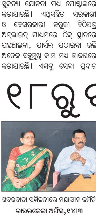
ଖବରଦାତା ସମ୍ମିଳନୀରେ ମଞ୍ଚାଧ୍ୟକ୍ଷ କମିଟି କର୍ମକର୍ତ୍ତାବୃନ୍ଦ ।

ରାଉରକେଲାରେ ସମ୍ପନ୍ନ କଳା ସଂସ୍କୃତି ଅନୁଷ୍ଠାନ ମ୍ୟୁଜିକ୍ ସର୍କଲ ଆନୁକୁଲ୍ୟରେ ଆସନ୍ତା ୧୮ରୁ ୨୨ ତାରିଖ ପର୍ଯ୍ୟନ୍ତ ସୁନ୍ଦରଗଡ଼, ୧୪୩୩(ଡି.ଏନ.ଏ.): ବେଦାନ୍ତର ନୂତନ କାମକାନ୍ଦି କୋଲାଇ ଖଣିରୁ କୋଲାଇ ପରିବହନ କ୍ଷେତ୍ରରେ ଅଗ୍ରାଧିକାର ଦେବା ଦାବି ନେଇ ମଙ୍ଗଳବାର ସୁନ୍ଦରଗଡ଼ର ମିଳିତ କୋଲାଇ ଟ୍ରକ ମାଲିକ ସଂଘ ସମୂହ ପକ୍ଷରୁ ବେଦାନ୍ତ ଖଣି ନିର୍ଦ୍ଦେଶକଙ୍କ ସହିତ ଆଲୋଚନା ହୋଇଛି।