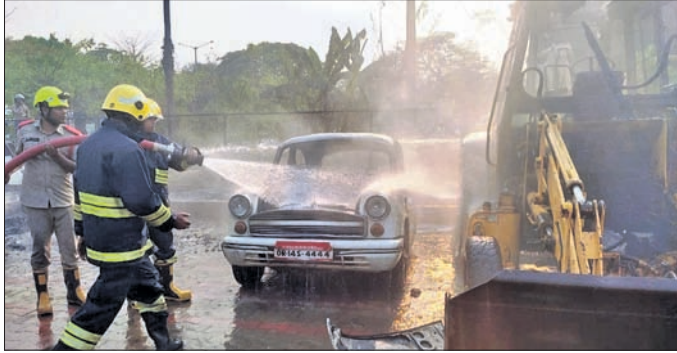
ଅଗ୍ନିଶମ କର୍ମଚାରୀ ନିଆଁ ଲିଭାଇଛନ୍ତି। ରାଉରକେଲା ଅଫିସ୍, ୧୪୩୩

ପୁରୁଣା। ଦୀର୍ଘଦିନ ହେଲା ମରାମତି ହୋଇନାହିଁ। ଏହି ଡାକଘର ଉନ୍ନତକରଣ ପାଇଁ ବିଭାଗୀୟ କର୍ତ୍ତୃପକ୍ଷଙ୍କୁ ବାରମ୍ବାର କୁହାଯାଇଛି। ତେବେ ଉକ୍ତ ପୁରୁଣା ବିନ୍ଦୁକୁ ତୁରନ୍ତ ମରାମତି କରାଯିବ ବୋଲି ବିଭାଗୀୟ ଉଚ୍ଚକର୍ତ୍ତୃପକ୍ଷ ପ୍ରତିଶ୍ରୁତି ଦେଇଥିବା ଶତପଥ କହିଛନ୍ତି।