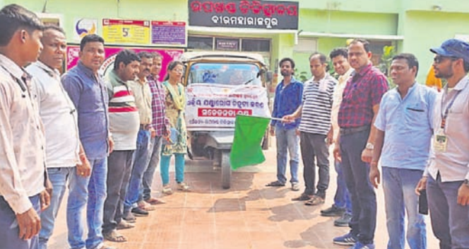
ସଚେତନତା ରଥକୁ ଶୁଭାଭିଷେକ କରାଯାଇଛି।

ସୁବର୍ଣ୍ଣପୁର ଜିଲ୍ଲା ବୀର ମ ହ । । କ ପ ୁ ର ରେ ଉପଖଣ୍ଡପୁରୀୟ ଡାକ୍ତରଖାନାରେ ସକ୍ରିୟ ଯନ୍ତ୍ରାରୋଗୀ ଚିକିତ୍ସା ପାଇଁ ଏକ ସଚେତନତା ରଥକୁ ତାଲୁକଖାନାର ସ୍ତ୍ରା ଓ ପ୍ରସ୍ତୁତି ବିଭାଗ ତାଲୁର.ସପ୍ରେଶ୍ୱର ବେହେରା ସବୁଜ ପତକା ଦେଖାଇ ଶୁଭାଭିଷେକ କରିଛନ୍ତି।