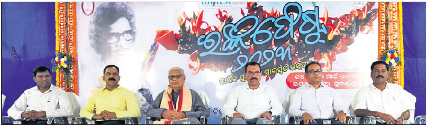
ଉଦ୍ଘାଟନା ଉତ୍ସବରେ ମଞ୍ଚାସୀନ ଅତିଥିବୃନ୍ଦ।

ପଞ୍ଚମ ପୁସ୍ତକପୁର ଜିଲ୍ଲା ବାରିକ ପୁସ୍ତକ ଓ ସାରସ୍ୱତ ମେଳା ଇକ୍ସପୋଷ୍ଟ ୨୦୨୩ ୟାନାୟ ରୟାଲ ପଡ଼ିଆରେ ମଙ୍ଗଳବାର ସମ୍ପନ୍ନରେ ଉଦ୍ଘାଟିତ ହୋଇଯାଇଛି।