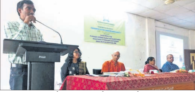
ରାଜେନ୍ଦ୍ର ବିଶ୍ୱବିଦ୍ୟାଳୟ ଦର୍ଶନ ବିଭାଗ ପକ୍ଷରୁ ଦର୍ଶନ ଅଧ୍ୟୟନ କାର୍ଯ୍ୟକ୍ରମରେ ମଞ୍ଚାସୀନ ଅତିଥି।