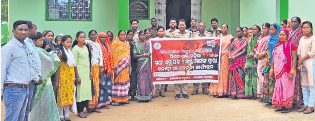
ସଚେତନତା କାର୍ଯ୍ୟକ୍ରମରେ ସାମିଲ ବନ ବିଭାଗ କର୍ମଚାରୀ ଓ ମହିଳାମାନେ।

ଖପ୍ରାଖୋଲ, ୧୪୩(ଡି.ଏନ.ଏ.): ବଲାଙ୍ଗୀର ଜିଲ୍ଲା ଖପ୍ରାଖୋଲ ବନ ରେଞ୍ଜ କାର୍ଯ୍ୟକ୍ରମରେ ବନାଗ୍ନି ସଚେତନତା କାର୍ଯ୍ୟକ୍ରମ ମଙ୍ଗଳବାର ଅନୁଷ୍ଠିତ ହୋଇଯାଇଛି।