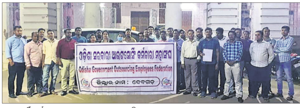
ଆଉଟସୋର୍ସିଂ କର୍ମଚାରୀମାନେ ସ୍ମାରକପତ୍ର ଦେବାକୁ ଯାଉଛନ୍ତି।

ଆଉଟସୋର୍ସିଂ କର୍ମଚାରୀମାନେ ସ୍ମାରକପତ୍ର ଦେବାକୁ ଯାଉଛନ୍ତି। କର୍ମଚାରୀମାନଙ୍କ ନିରୁତ୍ସାହିତ ନିୟମିତ କରାଯିବା, କୌଣସି କର୍ମଚାରୀଙ୍କୁ କାର୍ଯ୍ୟକୁ ଅନ୍ତର ନ କରିବା, ଯେଉଁମାନଙ୍କୁ କାର୍ଯ୍ୟକୁ ଆଗାମୀ ୨୦୨୨ ଜୁଲାଇ ପର୍ଯ୍ୟନ୍ତ ନିୟୋଜିତ କରାଯିବ, ଇପିଏଫ୍ ଓ ଇଏସ୍‌ଆଇ ଅର୍ଥ ନିକ ନିକ କର୍ମାଧିକାର