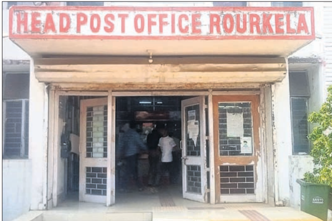
ରାଉରକେଲା ମୁଖ୍ୟ ଡାକଘର ।

ରାଉରକେଲା ସହରର ପ୍ରମୁଖ ତିନି ମୁଖ୍ୟ ଡାକଘର ଏବେ ନାନା ସମସ୍ୟା ଦେଇ ଗତି କରୁଛି। ଫଳରେ ଏହି ସବୁ ଡାକଘରକୁ ଆସୁଥିବା ଲୋକମାନେ ଉପଯୁକ୍ତ ସେବା ପାଇବାକୁ ସଞ୍ଚିତ ହେଉଛନ୍ତି।