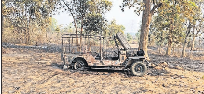
ପୋଡ଼ି ଯାଇଥିବା ଜିପ ।

ଜଙ୍ଗଲରେ ଲାଗିଥିବା ନିଆଁରେ ଜଙ୍ଗଲ ବିଭାଗର ଏକ ଗାଡ଼ି ପୋଡ଼ି ଯାଇଛି। ସୁନ୍ଦରଗଡ଼ ସଦର ରେଞ୍ଜି ଅନ୍ତର୍ଗତ ମେଦିନପୁର ଖେପ୍ରା ଜଙ୍ଗଲରେ ମଙ୍ଗଳବାର ଏହି ଘଟଣା ଘଟିଛି।