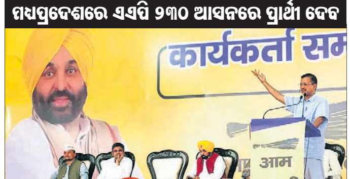
ଭୋପାଳ ଠାରେ ଆୟୋଜିତ ସଭାରେ କେଜ୍ରିୱାଲ ଉଦ୍‌ବୋଧନ ଦେଉଛନ୍ତି ।

ଚଳିତ ବର୍ଷ ଶେଷ ଭାଗରେ ରାଜସ୍ୱାନ ଓ ମଧ୍ୟପ୍ରଦେଶ ନିର୍ବାଚନ ହେବାକୁ ଥିବାବେଳେ ଆମ୍ ଆଦମୀ ପାର୍ଟି (ଏଏପି) ଆବାହକ ତଥା ଦିଲ୍ଲୀ ମୁଖ୍ୟମନ୍ତ୍ରୀ ଅରବିନ୍ଦ କେଜ୍ରିୱାଲ ଏବଂ ତାଙ୍କ ପଞ୍ଜୀବ ପ୍ରତିପକ୍ଷ ଭାଗିଦ୍ୱାରା ମାନ୍ଦ୍ରୁଦିନ ହେଲା ଉକ୍ତ ରାଜ୍ୟରେ ପ୍ରଚାର ତଳାଇଛନ୍ତି ।