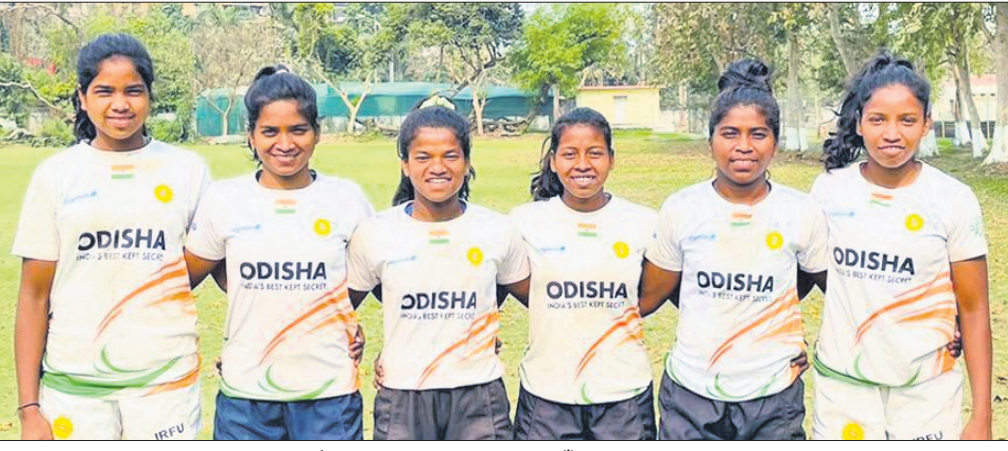
ଇଣ୍ଡୋନେସିଆରେ ହେବାକୁଥିବା ବୋରିଂଓ ସେଭେନ୍‌ ମହିଳା ରତ୍ନବା ପାଇଁ ଭାରତୀୟ ଦଳରେ ସ୍ଥାନ ପାଇଥିବା କିସ୍‌ର ୬ ଖେଳାଳି।

ଭୁବନେଶ୍ୱର, ୧୫ମାର୍ଚ୍ଚ (କ୍ରୀଡ଼ା ପ୍ରତିନିଧି): ହାଇଦ୍ରାବାଦରେ ଚାଲିଥିବା ଦୁର୍ଭିବାଧିକାରୀ ଚିନ୍ତା ଟ୍ରିପ୍‌ରେ ଓଡ଼ିଶା ଓ କର୍ନାଟକ ମଧ୍ୟରେ ମୁକାବିଲା ହେବ।