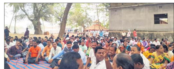
ବୈଠକରେ ଯୋଗଦେଇଥିବା ଗାଁ ସାଥୀମାନେ।

ଅଧିକା ୧୫୩(ଡି.ଏନ.ଏ.) ଗଞ୍ଜାମ ଜିଲ୍ଲା ଗାଁ ସାଥୀ ସଂଘର ଏକ ଜିଲ୍ଲାସ୍ତରୀୟ ବୈଠକ ବୁଧବାର ସହର ଉପକଣ୍ଠ ପୁରୁବେଶ୍ୱର ମନ୍ଦିର ପରିସରରେ ଅନୁଷ୍ଠିତ ହୋଇଥିଲା।