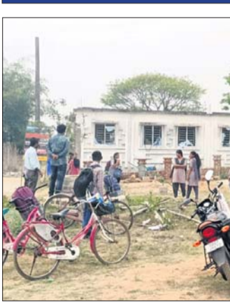
ପ୍ରାଇମା ପବ୍ଲିକ ସ୍କୁଲ।