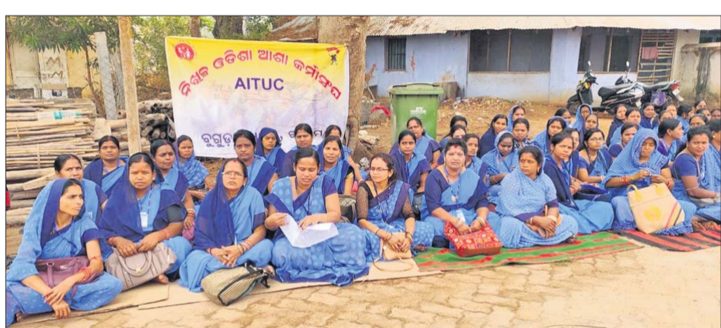
ଧାରଣାରେ ବସିଥିବା ଆଶାକର୍ମୀ।

ରୁରୁଡ଼ା, ୧୫୩(ଡି.ଏନ.ଏ.) ରୁରୁଡ଼ା ଗୋଷ୍ଠୀ ସ୍ୱାସ୍ଥ୍ୟ କେନ୍ଦ୍ର ପରିସରରେ ବିଭିନ୍ନ ଦାବି ନେଇ ନିଖୁଳ ଓଡ଼ିଶା ଆଶାକର୍ମୀ ସଂଘ ରୁରୁଡ଼ା ଶାଖା ପକ୍ଷରୁ ରୁକ୍ମ ସମ୍ପାଦନା ରହିତା ପଞ୍ଚାୟତ ନେତୃତ୍ୱରେ ଆଶାକର୍ମୀମାନେ ବୁଧବାର ଧାରଣାରେ ବସିଥିଲେ।