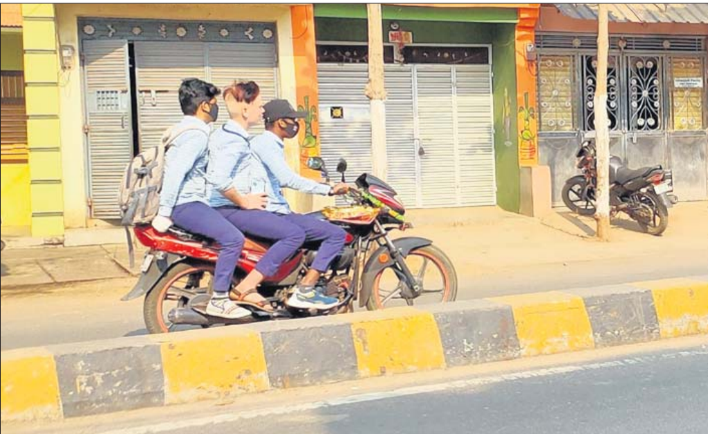
ବିନା ହେଲମେଟରେ ଗାଡ଼ି ଚାଳନା।

ରୁରୁଡ଼ା ଅଞ୍ଚଳରେ ଦିନକୁଦିନ ଜନବସତି ବୃଦ୍ଧି ହେବାରେ ଲାଗିଛି। ଏହି ଅନୁପାତରେ ଯାନବାହନ ମଧ୍ୟ ବୃଦ୍ଧି ପାଇଛି। ବହୁ ସମୟରେ ବେପାରୁଆ ଗାଡ଼ି ଚାଳନା ପାଇଁ ଛୋଟମୋଟ ଦୁର୍ଭିକ୍ଷମାନେ ଘରୁଛି।