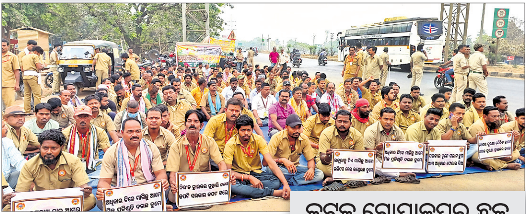
କଟକ ଗୋପାଳପୁର ଛକ