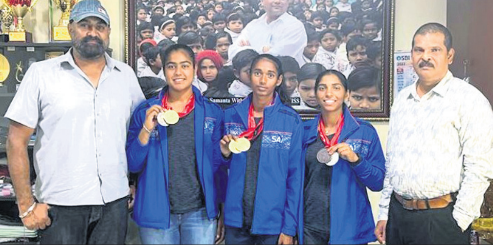
ଚଣ୍ଡିଗଡ଼ରେ ଅନୁଷ୍ଠିତ ସର୍ବଭାରତୀୟ ବିଶ୍ୱବିଦ୍ୟାଳୟ ରୋଲ୍‌ ଚାମ୍ପିୟନଶିପ୍‌ରେ ୨ ସ୍ୱର୍ଣ୍ଣ, ୧ ରୌପ୍ୟ ଓ ୧ ବ୍ରୋଞ୍ଜ ପଦକ ହାସଲ କରିଥିବା କିରୀ ପ୍ରତିଯୋଗୀମାନେ କର୍ମକର୍ତ୍ତାଙ୍କ ଗହଣରେ।