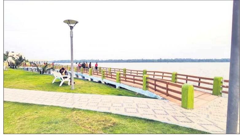
ଡାମରା ଲେକ ଭିମ୍ବ ପାର୍କ