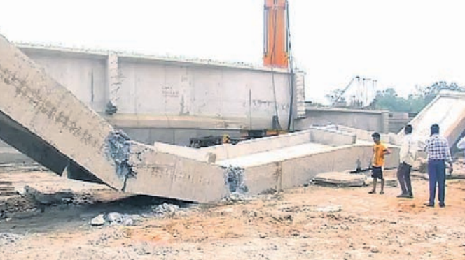
ଗୋବରା ନଦୀର ଦକ୍ଷିଣ ପାର୍ଶ୍ୱ ନିର୍ମାଣାଧୀନ ପୋଲର ଏକ ସ୍ଥାବ ରୁଧିରାଣୁ ଭୁଗୁଡ଼ି ପଡ଼ିଛି।