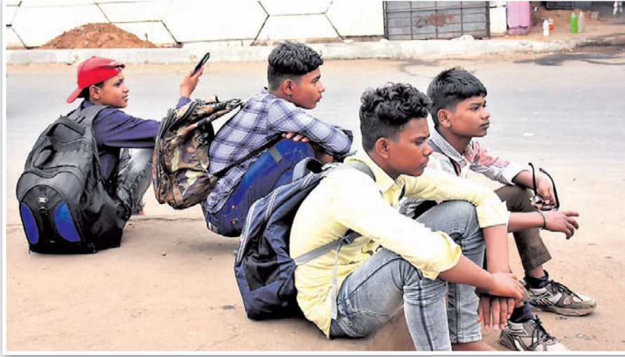
ଭୁବନେଶ୍ୱର ବରପୁଣ୍ଡା ବସ୍ଷାଞ୍ଚ ନିକଟରେ ଅଚଳି ରହିଥିବା ଯାତ୍ରା।