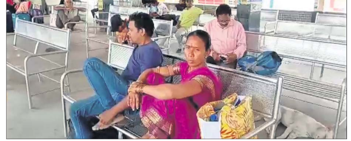
ପାରଳାଖେମୁଣ୍ଡିରେ ଗାଡ଼ି ଚଳାଚଳ ପ୍ରଭାବିତ ହୋଇଥିବାରୁ ଯାତ୍ରୀମାନେ ଦୁର୍ଦ୍ଦଶାର ସମ୍ମୁଖୀନ ।