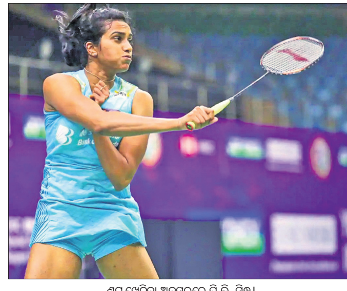
ଶର୍ ଖେଳିବା ଅବସରରେ ପି.ଭି. ସିନ୍ଧୁ।

ଅଲ୍ ଇଂଲଣ୍ଡ ଓପନ୍ ବ୍ୟାଡ୍‌ମିଣ୍ଟନର ପ୍ରଥମ ରାଉଣ୍ଡରୁ ବିଦାୟ ନେଇଛନ୍ତି ଭାରତର ପି ଭି ସିନ୍ଧୁ। ସୁଲୁ ବୁଲ୍ ଥର ଅଲିମ୍ପିକ୍ସ ପଦକ ବିଜୟିନୀ ସିନ୍ଧୁ ପ୍ରଥମ ରାଉଣ୍ଡରେ ଚୀନ୍‌ର ଝାଙ୍ଗ ଯି ମାନ୍‌ଙ୍କ ନିକଟରୁ ପରାଜିତ ହୋଇଛନ୍ତି।