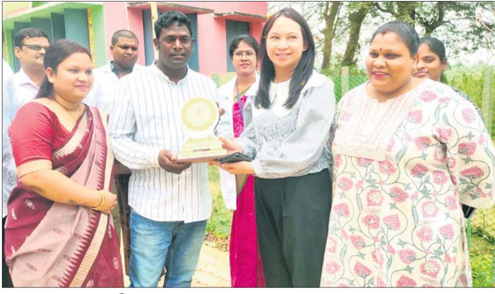
ପରିଦର୍ଶନ କଲେ କଲଂଖଣ୍ଡି ପଞ୍ଚାୟତ ଉପ ସ୍ୱାସ୍ଥ୍ୟକେନ୍ଦ୍ର

ଦିଗପହଣ୍ଡି, ୧୫୩(ଡି.ଏନ.ଏ.) ଇଣ୍ଡୋନେସିଆ ସ୍ୱାସ୍ଥ୍ୟ ମନ୍ତ୍ରଣାଳୟର ଏକ ଚିମ୍ପ ବୁଧବାର ଗଞ୍ଜାମ ଜିଲ୍ଲା ଦିଗପହଣ୍ଡି ବ୍ଲକ ଅନ୍ତର୍ଗତ କଲଂଖଣ୍ଡି ପଞ୍ଚାୟତ ଉପ ସ୍ୱାସ୍ଥ୍ୟକେନ୍ଦ୍ର ପରିଦର୍ଶନ କରି ଫେରିଛନ୍ତି।