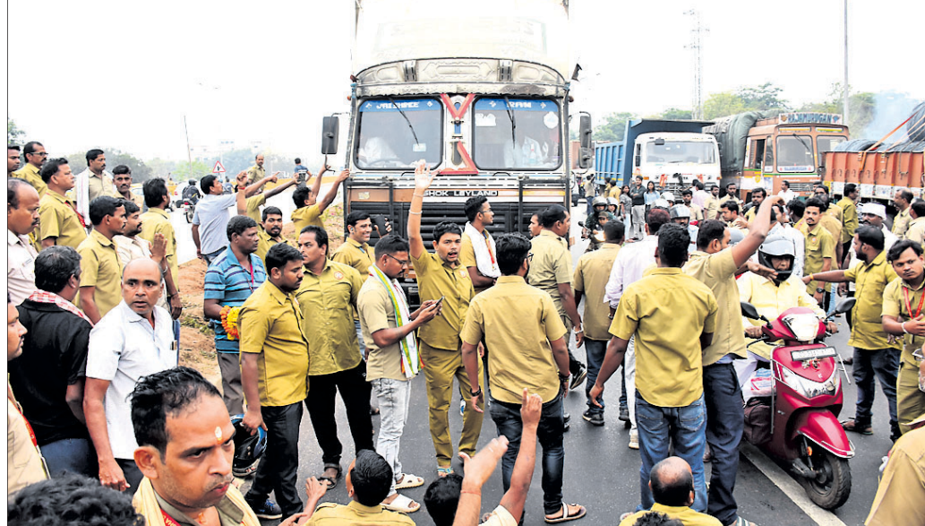
ଭୁବନେଶ୍ୱରରେ ରୁଧିରାଣୁ ଭ୍ରାଜୁରମାନେ ରୁକ୍ ଓ ବସକୁ ଅଟକ ରଖି ବିରୋଧ ପ୍ରଦର୍ଶନ କରୁଛନ୍ତି।

ଶ୍ୱେତ୍ସରୀ ଛାଡ଼ି ରାସ୍ତାକୁ ଓହ୍ଲାଇଛନ୍ତି ଭ୍ରାଜୁରମାନେ। ଏଥିପାଇଁ ସାରା ରାଜ୍ୟରେ ରୁଧିରାଣୁ ଗାଡ଼ି ଚଳାଚଳ ଚଳାଚଳ ଭାବେ ପ୍ରଭାବିତ ହୋଇଛି। ବିଭିନ୍ନ ସ୍ଥାନରେ ଯାତ୍ରୀମାନେ ଅଟକି ରହି ହତସତ ହୋଇଛନ୍ତି। ଭ୍ରାଜୁରମାନେ ବାମା, ପେନ୍‌ସନ, ମୃତ୍ୟୁକାଳୀନ ସୁଧିଆପୁରୋଗ ଆଦି ୧୦ ଦାବି କରୁଛନ୍ତି। ସରକାର ବାରମ୍ବାର ପ୍ରତିଶ୍ରୁତି ଦେଉଥିଲେ ମଧ୍ୟ ଦାବିଗୁଡ଼ିକ ପୂରଣ ହେଉନାହିଁ। ଏହା ବିରୋଧରେ ଭ୍ରାଜୁର ଏକତା ମହାମିତ୍ର ଏହି ଆନ୍ଦୋଳନକୁ କାର୍ଯ୍ୟପଦ୍ଧା ଆପଣାଇଛନ୍ତି। ଅନିର୍ଦ୍ଧିଷ୍ଟ କାଳ ଯାଏ ଆନ୍ଦୋଳନ କରିବାକୁ ମହାମିତ୍ର ତାଙ୍କରା ଦେଇଥିବାବେଳେ ପ୍ରଥମ ଦିନ ହିଁ ରାଜ୍ୟର ପରିବହନ