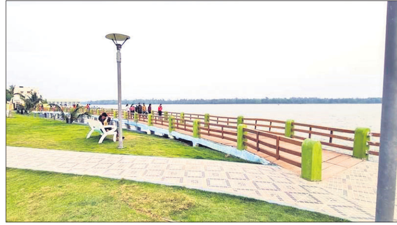
ଡାମ୍ପରା ଲେକ ଭିନ୍ନ ପାର୍କ