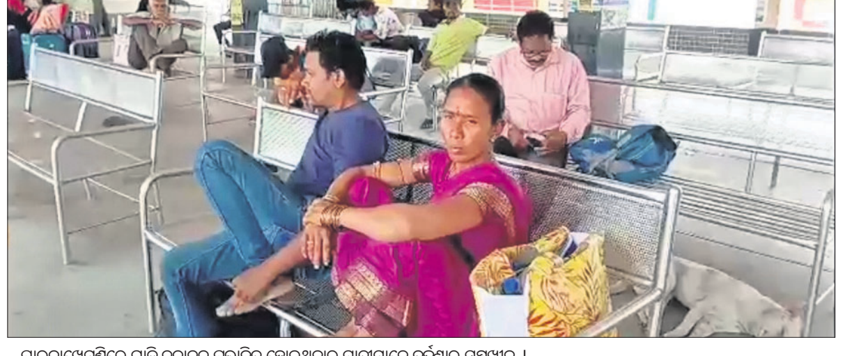
ପାରଳାଖେମୁଣ୍ଡିରେ ଗାଡି ଚଳାଚଳ ପ୍ରଭାବିତ ହୋଇଥିବାରୁ ଯାତ୍ରୀମାନେ ଦୁର୍ଦ୍ଦଶାର ସମ୍ମୁଖୀନ ।