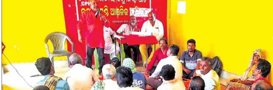
ମଞ୍ଚାଧୀନ ଅତିଥି ବୃନ୍ଦ ।

ଦିନପହଣ୍ଡି, ୧୬୩ (ଡି.ଏନ୍.ଏ.) ଦିନପହଣ୍ଡି ରୁକ୍ଷ ଜକରାପଲ୍ଲୀ ଗ୍ରାମ ନିକଟ କୁରୁକୋଣ୍ଡା ମନ୍ଦିର ପରିସରରେ ଗୁରୁବାର ସିପିଆଇ ବଡ଼ଖେମୁଣ୍ଡି ଜୋନାଲ କମିଟିର ସମ୍ମିଳନୀ ଅନୁଷ୍ଠିତ ହୋଇଯାଇଛି ।