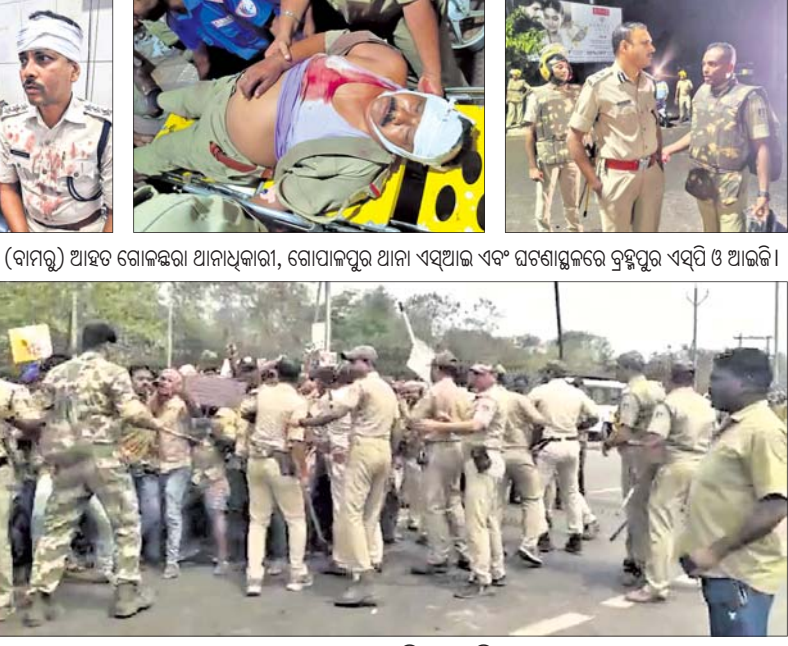
ଆନ୍ଦୋଳନକାରୀଙ୍କୁ ପୋଲିସ୍‌ର ଲାଠି ଚାଳନା।