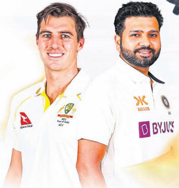
ପ୍ୟାଟ୍ କୁମିନ୍ସ ଓ ରୋହିତ ଶର୍ମା।

ମାତ୍ର ତାହା ବିଶେଷ କାମ ଦେଇ ନ ଥିଲା। ଅଣ୍ଟିନ ସବୁଠାରୁ ଭଲ ବୋଲି କରାଯାଇ, ମାତ୍ର ଜାତେଜା ଫଳପ୍ରସ୍ତ ହୋଇ ନ ଥିଲେ। ଓଭରକାଷ୍ଟିଂ କଣ୍ଟ୍ରୋଲରେ ଲୁକିଲାଇଓ ପ୍ରଭାବୀ ପ୍ରଦର୍ଶନ କରି ଚାମ୍ପିୟନ ହୋଇଥିଲା। ସେଠାରେ ଲୁକିଲାଇଓ ୪ ସ୍ଟେଜିଲିଷ୍ଟ ଫାଷ୍ଟ ବୋଲର ଏବଂ କଲିନ ଡି ଗ୍ରାଣ୍ଡହୋମ୍‌ସ୍‌ଙ୍କ ରୂପରେ ଜଣେ ମିଡିୟମ ପେସରଙ୍କୁ ଖୋଲାଇ ଦେଇ ଦେଖିବାକୁ ଗଲେ ଭାରତ କେବଳ ୩ ଜଣ ପେସ୍ ବୋଲରଙ୍କୁ ନେଇ ଖେଳିଥିଲା। ଏହାପରେ ଇଂଲଣ୍ଡ ମାଟିରେ ଭାରତ ୫ ଟେଷ୍ଟ ଖେଳିଥିଲେ ହେଁ କେବେ ୩-୨ ଫର୍ମାଟରେ ଖେଳି ନ ଥିଲା। ୪-୧ ଭିତ୍ତିରେ କେବଳ ଜଣେ ସ୍କିନର ଜାତେଜାଙ୍କୁ ନେଇ ଭାରତ ପଡ଼ିଆକୁ ଓହ୍ଲାଇଥିଲା। ଅଣ୍ଟିନଙ୍କ ଅପେକ୍ଷା ଜାତେଜା ଭଲ ବ୍ୟାଟର ହୋଇଥିବାରୁ ପ୍ରଥମ ପସନ୍ଦ