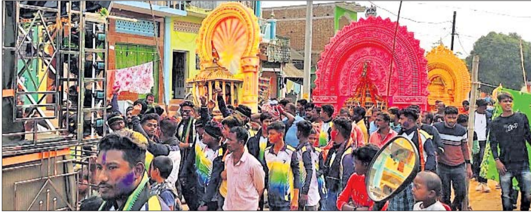
ପଞ୍ଚଦୋଳ ମେଳଣରେ ଶ୍ରଦ୍ଧାଳୁ ।

ପାଞ୍ଚଦିନ ଧରି ଖଣ୍ଡଦେଉଳି ଏବଂ ଆଖପାଖ ଗ୍ରାମଗୁଡ଼ିକ ଉତ୍ସବ ମୁଖର ହୋଇ ଉଠିଥିଲା ।