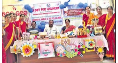
ଦିନପହଣ୍ଡି, ୧୬୩ (ଡି.ଏନ୍.ଏ.)

ଦିନପହଣ୍ଡି ରୁକ୍ଷ ପଦ୍ମନାଭପୁର ପଞ୍ଚାୟତ କାର୍ଯ୍ୟାଳୟରେ ଗୁରୁବାର ବିଲ୍ଲୁ କନ୍ୟାର ଯୋଜନା ଆନୁକୂଲ୍ୟରେ ଶିଶୁ ପାଇଁ ଦିନଟିଏ କାର୍ଯ୍ୟକ୍ରମ ଅନୁଷ୍ଠିତ ହୋଇଯାଇଛି ।