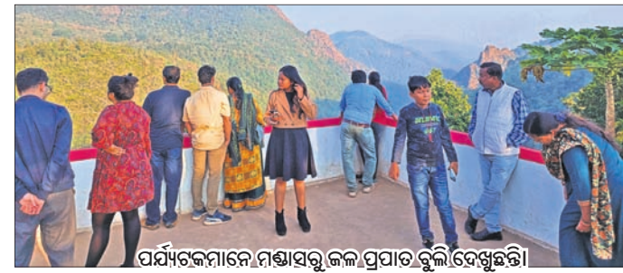
ପର୍ଯ୍ୟଟକମାନେ ମଣ୍ଡାସରୁ ଜଳ ପ୍ରପାତକୁ ବିଶେଷ ଭାବେ ପସନ୍ଦ କରୁଛନ୍ତି।

ଏଠାକୁ ଆସିଥିବା ବେଳେ ଏହି ଜଳ ପ୍ରପାତ ସମସ୍ତଙ୍କୁ ଆକର୍ଷଣ କେନ୍ଦ୍ର ବିନ୍ଦୁ ପାଲଟିଛି। ଏହି ସ୍ଥାନକୁ ନିଜର ସହ ଉପଭୋଗ କରିବା ପାଇଁ ପର୍ଯ୍ୟଟକମାନେ ଆସିଥାନ୍ତି। ଏହା ନିକଟରେ ରହିଛି ଜଳ ପ୍ରପାତ। ୧୫୦ ଫୁଟ ଉଚ୍ଚର ପାଣି ପଡୁଥିବାରୁ ସେଥିପ୍ରତି ମଧ୍ୟ ପର୍ଯ୍ୟଟକ ଆକର୍ଷିତ ହେଉଛନ୍ତି। ପୂର୍ବରୁ ଜଳ ପ୍ରପାତକୁ ରାସ୍ତା ନ ଥିବାରୁ ଏହା ଲୋକଲୋଚନକୁ ଆସି ପାରିନଥିଲା। ଜଙ୍ଗଲ ଓ ପରିବେଶ ବିଭାଗ ଚରଫଠୁ ଏଥିପ୍ରତି ସ୍ୱତନ୍ତ୍ର ଧ୍ୟାନ ଦିଆଯିବା ସହ ରାସ୍ତା ନିର୍ମାଣ କରାଯାଇଥିଲା। ଏହା ନିକଟରେ ଜଳ ପ୍ରପାତ ଦୃଶ୍ୟମାନ ପାଇଁ ଏକ ଘଟ ଭିନ୍ନ ପଦକ୍ଷେପ ନିର୍ମାଣ କରାଯାଇଛି। ଗତ ତିନିବର୍ଷ ମଧ୍ୟ ପ୍ରଥମ ଜୈବ ବିଧିତା ସଂରକ୍ଷଣ ସ୍ଥଳୀ ଭାବରେ ମାନ୍ୟତା ପାଇଛି ଜଙ୍ଗଲ ଓ ପରିବେଶ ବିଭାଗ