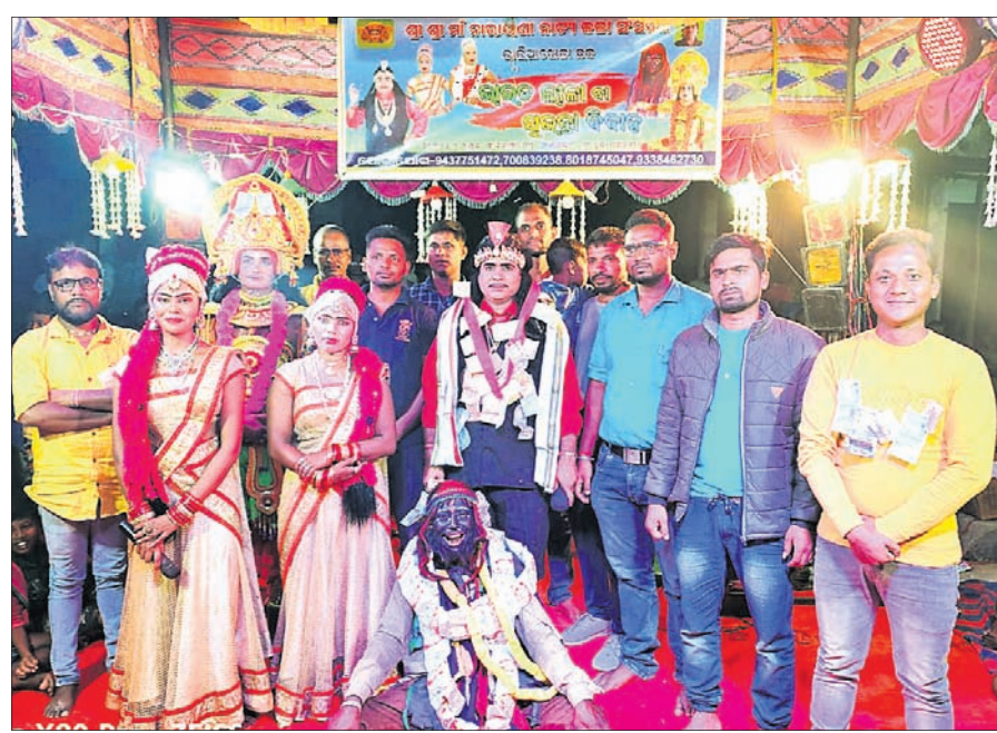
ଭାଲିଆ ଶୋକା ଗାଁରେ ଥିବା 'ଭାରତଲାଳା' ନାଟ୍ୟ ଅନୁଷ୍ଠାନର କଳାକାର ଦ୍ୱୟ ।