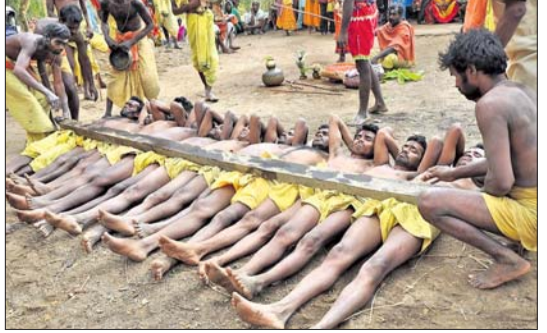
ଦଣ୍ଡନାଟରେ ଭାଗ ନେଉଥିବା ଭୃତ୍ତମାନଙ୍କ ପାଇଲ ଫଟୋ ।

ବ୍ରହ୍ମପୁର ସହରର ପ୍ରସିଦ୍ଧ ଆରାଧ୍ୟ ଇଷ୍ଟଦେବୀ ମା' ବୁଢ଼ୀଠାକୁରାଣୀଙ୍କ ଦ୍ୱିବାସିକ ଯାତ୍ରା ଓ ଦଣ୍ଡନାଟ ଏକତ୍ର ଅନୁଷ୍ଠିତ ହେବ ।