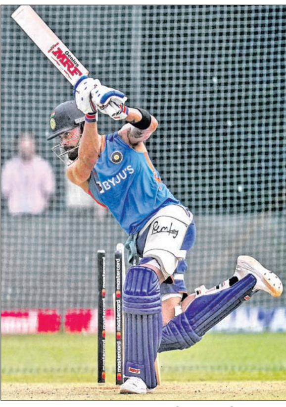
ନେହେରୁ ଅଭ୍ୟାସ ଅବସରରେ ବିରାଟ କୋହଲି।

ପୂର୍ଣ୍ଣା, ୧୬ମାର୍ଚ୍ଚ(ପି.ଟି.) ଅଷ୍ଟ୍ରେଲିଆ ବିପକ୍ଷ ୩ ମ୍ୟାଚ ବିଶିଷ୍ଟ ଦିନିକିଆ ସିରିଜ ଶୁକ୍ରବାର ଆରମ୍ଭ ହେବ। ପୂର୍ଣ୍ଣାରେ ଓଡ଼ିଶାରେ ଖୁବ୍ ଶୀଘ୍ର ଆରମ୍ଭ ହେବ। ପୂର୍ଣ୍ଣାରେ ଓଡ଼ିଶାରେ ଖୁବ୍ ଶୀଘ୍ର ଆରମ୍ଭ ହେବ। ପୂର୍ଣ୍ଣାରେ ଓଡ଼ିଶାରେ ଖୁବ୍ ଶୀଘ୍ର ଆରମ୍ଭ ହେବ।