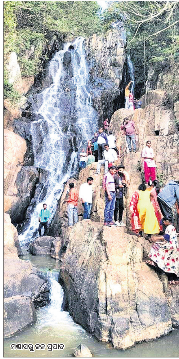
ମଣ୍ଡାସରୁ ଜଳ ପ୍ରପାତ