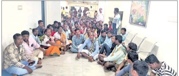
ଅବକୃଷ୍ଟ ରଜକ ସମାଜ ସହ ଚୌର ପ୍ରଶାସନର ଆଲୋଚନା ।

ହିଞ୍ଜିଳିକାଗୁଡ଼ା, ୧୬୩ (ଡି.ଏନ୍.ଏ.): ଶିବ ମନ୍ଦିର ନିକଟରେ କୂଳ କୋଠର ପ୍ରତି ନିର୍ବାଚନ ପୂର୍ବରୁ ସରକାରୀ ଅଧିକାରୀ, ରାଜନୈତିକ ଦଳ ନେତା ଉତ୍ତମ କାର୍ଯ୍ୟ ନିମନ୍ତେ ପ୍ରତିଶ୍ରୁତି ଦେଇଛନ୍ତି ।