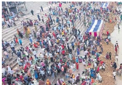
ଶ୍ରଦ୍ଧାଳୁମାନେ ବୁଡ଼ ପକାଇଛନ୍ତି ।