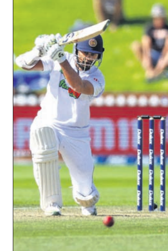
କରଭୋଇଲ ଖେଳୁଛନ୍ତି ଦିମୁଥ କରୁଣାରତ୍ନେ ।

ଫ୍ରେଜିଂଟନ, ୧୯୩୩(ପି.ଟି.) ଫ୍ରେଜିଂଟନରେ ଚଳୁଥିବା ଶ୍ରୀଲଙ୍କା ମଧ୍ୟରେ ଅନୁଷ୍ଠିତ ଦ୍ୱିତୀୟ ଟେଷ୍ଟ ମ୍ୟାଚରେ ଦୃଢ଼ ସ୍ଥିତିରେ ଯରୋଭ ଦଳ। ପ୍ରଥମ ଇନିଂସରେ ୫୮୦ ରନ୍ରେ ବିଶାଳ ଷ୍ଟୋର କରିବା ପରେ ଲୁକ୍‌ମାଣ୍ଡ ୧୬୪ ରନ୍ରେ ଶ୍ରୀଲଙ୍କାକୁ ସୀମିତ ରଖିବା ସହିତ ଫଲୋଅପ୍ ଡାକି ଦେଇଥିଲା। ଉଭୟ ଦଳର ଖେଳାଳିମାନଙ୍କର ଖେଳାଦିନ ଖୁବ୍ ଖରାପ ଥିଲା।