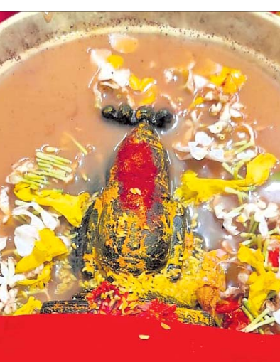
ମାଟିଚଲୁ ଉଦ୍ଧାର ହୋଇଥିବା ଗଞ୍ଜାମାତାଙ୍କ ମୂର୍ତ୍ତି ।

ପୂଜକଙ୍କୁ ସ୍ୱପ୍ନାଦେଶ ବାଲାଙ୍ଗା ମନ୍ଦିର ପରିସରରେ ସ୍ଥାପନ କରିଥିଲେ । ପରେ ଏକ ନିର୍ଦ୍ଦିଷ୍ଟ ସ୍ଥାନ ଚିହ୍ନଟ କରି ଖୋଳା ଆରମ୍ଭ ହୋଇଥିଲା । ୬୦୦ ମାଟି ଖୋଳିବା ପରେ ରାତି ୧୦ଟାରେ ମୂର୍ତ୍ତି କିଛି ଅଂଶ ଦେଖାଗଲା । ଆଉ ଅଳ୍ପ କିଛି ସମୟ ଖୋଳିବା ପରେ ମୂର୍ତ୍ତିର ସମ୍ପୂର୍ଣ୍ଣ ଅଂଶ ଦେଖାଯାଇଥିଲା । ଦଶ ଲକ୍ଷ ବର୍ଷ ସୁଦ୍ଧା ପୂଜା ପାଉଥିବା ମୂର୍ତ୍ତି ବାହାରକୁ ଜଣାଯାଇଥିଲା । ଗଞ୍ଜାମାତାଙ୍କ ଆବିର୍ଭାବ ସମ୍ପର୍କରେ ଖବର ଶୁଣି ବହୁ ଶ୍ରଦ୍ଧାଳୁଙ୍କ ସମାଗମ ମନ୍ଦିର ପରିସରରେ ହୋଇଥିଲା ।