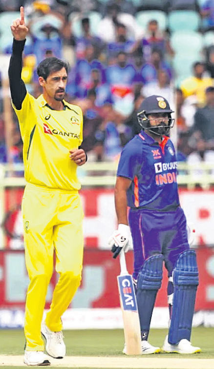
ଅଷ୍ଟ୍ରେଲିଆର ସଫଳ ବୋଲର ମିଚେଲ ଷ୍ଟାର୍କ (ବାମ) ।