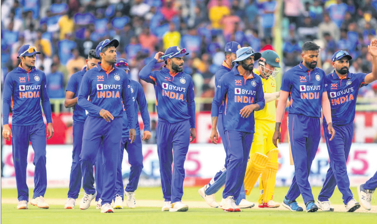
ପରାକ୍ରମ ପରେ ପଢ଼ିଆ ଛାଡ଼ୁଛନ୍ତି ଭାରତୀୟ ଖେଳାଳି ।

ବିଶାଖାପାଟଣା, ୧୯୩୩(ପି.ଟି.) ବିଶାଖାପାଟଣାରେ ଖେଳାଯାଇଥିବା ଚତୁର୍ଥ ଦିନିକିଆ ମ୍ୟାଚରେ ଭାରତକୁ ୧୦ ଉଇକେଟରେ ପରାସ୍ତ କରିଛନ୍ତି ଅଷ୍ଟ୍ରେଲିଆ। ବାମହାତୀ ଯେଉଁ ବୋଲର ମିଚେଲ ଷ୍ଟାର୍କ ଅଗ୍ରବର୍ଷୀ ବୋଲି କରୁଛନ୍ତି ତାହା ଭାରତ ପାଇଁ ଏକ ବଡ଼ ଚ୍ୟାଲେଞ୍ଜ ଥିଲା। ଉଭୟ ଦଳର ଖେଳାଳିମାନଙ୍କର ଖେଳାଦିନ ଖୁବ୍ ଖରାପ ଥିଲା। ଭାରତୀୟ ବ୍ୟାଟରମାନଙ୍କର ଖେଳାଦିନ ଖୁବ୍ ଖରାପ ଥିଲା। ଉଭୟ ଦଳର ଖେଳାଳିମାନଙ୍କର ଖେଳାଦିନ ଖୁବ୍ ଖରାପ ଥିଲା।