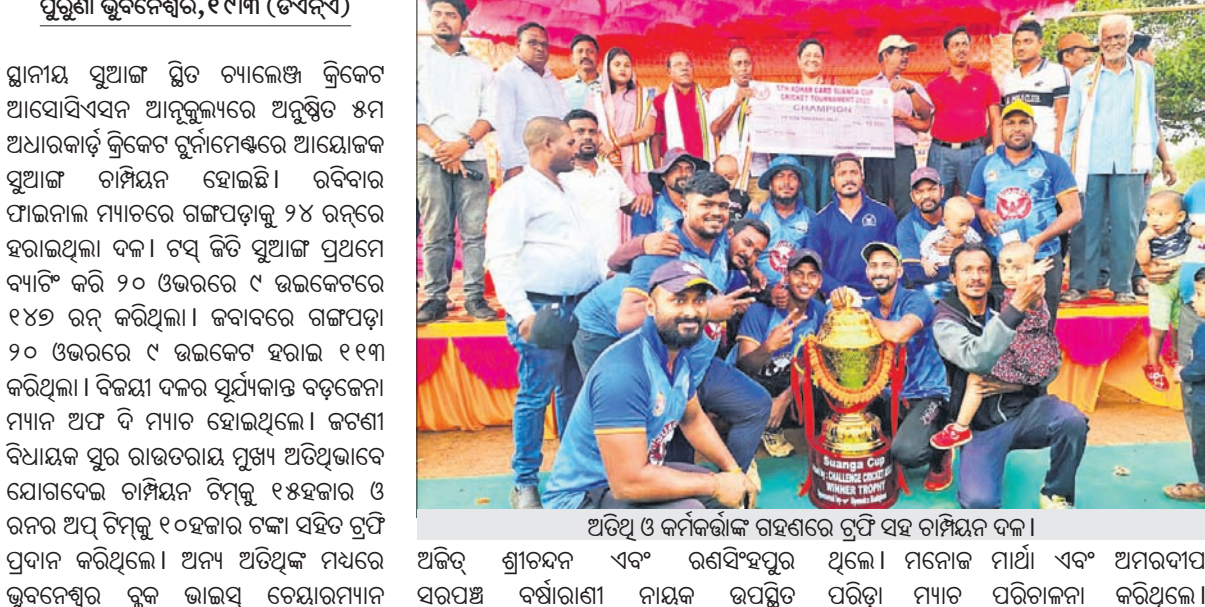
ଅତିଥି ଓ କର୍ମଚାରୀଙ୍କ ସହ ଚାମ୍ପିୟନ ଦଳ।