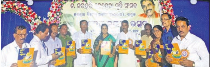
'ଛବିକ ଶିଶୁ ବର୍ଷବୋଧ' ପୁସ୍ତକ ଲୋକାର୍ପଣ କରାଯାଇଛି।

ତିଥିରେ କୁଳ ମଧ୍ୟରୁ ପାଣି ନିଷ୍କାସନ କରାଯାଇ ପୂଜା ଅର୍ଚ୍ଚନା କରାଯାଇ ଥାଏ। ସେଠାରେ ଥିବା ଶିବ ଲିଙ୍ଗକୁ ଉତ୍ସାହୀମାନେ ଦର୍ଶନ କରିଥାନ୍ତି। ରବିବାର କୋହଲା ପାନ ସହେ ପୂର୍ବରୁ ବାବାଙ୍କ ଦର୍ଶନ ପାଇଁ ଭିଡ଼ ଜମିଥିଲା। ସକାଳ ୫ଟାରେ ପୂର୍ଣ୍ଣ ପୂଜା, ସ୍ନାନ ଯାତ୍ରା ଅନୁଷ୍ଠିତ ହୋଇଯାଇଛି।