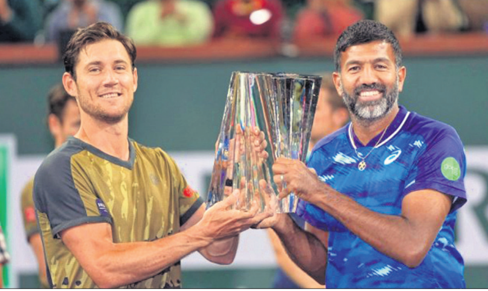
ତ୍ରୁପି ସହ ମ୍ୟାଚ ଇଭିଟିଂ ଓ ରୋହନ ବୋପାନ୍ନା।

ଭାରତର ରୋହନ ବୋପାନ୍ନା ସବୁଠାରୁ ବୟସ୍କ ଖେଳାଳି ଭାବେ ଏହି ଫାଷ୍ଟ ବଲ୍ ଟ୍ୟୁରାମେଣ୍ଟରେ ଉପସ୍ଥିତ ହୋଇଛନ୍ତି।