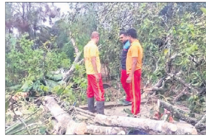
ରାସ୍ତାରେ ପଡ଼ିଥିବା ଗଛକୁ ସଫା କରୁଛନ୍ତି ଦମକ ବାହିନୀ।

ପଶ୍ଚିମା ଝଡ଼ ପ୍ରଭାବରେ ବର୍ଷା ଯୋଗୁ ଭଦ୍ରକ ଜିଲ୍ଲା ଭଞ୍ଜାରିପୋଖରୀ ବ୍ଲକ୍‌ରେ ବିଜିନ ଗ୍ରାମରେ ମଧ୍ୟମ ଧରଣର କ୍ଷୟକ୍ଷତି ହୋଇଛି। ଚାରିଦିନ ଧରି ଅଞ୍ଚଳରେ କୋହଳା ପାଗ ରହିଥିବା ବେଳେ ଶନିବାର ସନ୍ଧ୍ୟାରେ ଘଡ଼ଘଡ଼ି ସାଙ୍ଗକୁ ବର୍ଷା ହୋଇଥିଲା। ବିଷୁବରୁ ଠାକୁ ଆରମ୍ଭ କରି ମଞ୍ଜୁରୀରୋଡ଼ ମଣିନୀଥପୁର ଯାଏ ସମସ୍ତ ସ୍ଥାନରେ ପ୍ରାୟ ଦୁଇଘଣ୍ଟା ଧରି ମଧ୍ୟମ ଧରଣର ବର୍ଷା ହୋଇଥିଲା। କେତେକ ସ୍ଥାନରେ ପବନର ବେଗ ବୃଦ୍ଧି ଯୋଗୁ ଗଛ ତାଳ ଭାଙ୍ଗିଯାଇଥିଲା। ସରସପା, ପିରିପୁର, ନିକୁଣ୍ଡି, ବାରିକପୁର, ନଗୁଆଁ ଆଦି ସ୍ଥାନରେ ଗଛ ଭାଙ୍ଗି ରାସ୍ତା ଅବରୋଧ ହୋଇଥିଲା। ଏପରିକି କଳା ଓ ଛଣ ଛପର ଘର କିଛି ମାତ୍ରାରେ