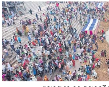
ଶ୍ରଦ୍ଧାଳୁମାନେ ବୁଡ଼ ପକାଇଛନ୍ତି।

୩ ବର୍ଷ ବ୍ୟବଧାନ ପରେ ଯାଜପୁର ଦଶାଶ୍ୱମେଧ ଯାତ୍ରାରେ ବାରୁଣୀ ଯୋଗରେ ଉଦ୍ଦିଷ୍ଟ ଶ୍ରଦ୍ଧାଳୁମାନେ ବୁଡ଼ ପକାଇଛନ୍ତି। ପୂର୍ବରୁ କାରୋନା ପାଇଁ ୩ ବର୍ଷ ବାରୁଣୀ ବୁଡ଼କୁ ପ୍ରଶାସନ ବାରଣ କରିଥିଲା। ଫଳରେ ଶ୍ରଦ୍ଧାଳୁ ବାରୁଣୀ ସ୍ନାନ ଯୋଗ ସମୟରେ ବୁଡ଼ ପକାଇ ପାରୁ ନ ଥିଲେ। ବାରୁଣୀ ସ୍ନାନ ଭିତ୍ତିକୁ ଦୂଷିତ ରଖି ପ୍ରଶାସନ ପକ୍ଷରୁ ବ୍ୟାପକ ପ୍ରସ୍ତୁତି କରାଯାଇଥିଲା। ଯାଜପୁରର ବୈତରଣୀ ନଦୀ କୂଳରେ ଅବସ୍ଥିତ ଦଶାଶ୍ୱମେଧ ଯାତ୍ରା କ୍ଷେତ୍ରର ଅନୁମତି ଡାକ୍ତରୀ ଭାବେ ପ୍ରସିଦ୍ଧ। ଚଳିତ ବର୍ଷ ମହାଯୋଗ ନ ଥିଲେ ମଧ୍ୟ ବିଗତ ୩ ବର୍ଷକାଳ ଏହା ବନ୍ଦ ଥିବା ହେତୁ ବହୁ ଶ୍ରଦ୍ଧାଳୁଙ୍କ ଭିଡ଼ ଜମିଥିଲା। ବିରଳ ପଞ୍ଜିକା ଅନୁଯାୟୀ, ବୈତରଣୀୟ ତ୍ରୟୋଦଶୀ ତିଥିରେ ଶତଭିକ୍ଷା ନକ୍ଷେତ୍ରରେ ପ୍ରାତଃ ୩୩୨ ମଧ୍ୟାହ୍ନ ପର୍ଯ୍ୟନ୍ତ ଓ ଜଗନ୍ନାଥ ପଞ୍ଜିକାରେ ପ୍ରାତଃ ୮୩୨ ୨୦ରୁ ରାତ୍ର ୮ ଘଟିକା ପର୍ଯ୍ୟନ୍ତ ଏଠାରେ ସ୍ନାନ ଯୋଗ୍ୟ। ଯାଜପୁର ପୌରପାଳିକା ପକ୍ଷରୁ ବନ୍ଦ ପରିଧାନ