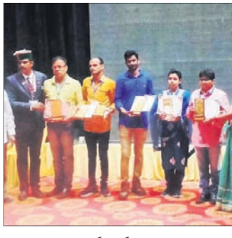
ଅତିଥିଙ୍କଠାରୁ କାର୍ଯ୍ୟକର୍ତ୍ତାମାନେ ମାନପତ୍ର ଗ୍ରହଣ କରୁଛନ୍ତି।