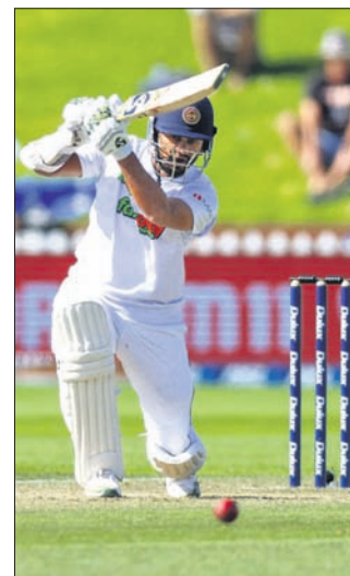
କରୁଣାରତ୍ନେ ଖେଳୁଛନ୍ତି ଦିମୁଥ କରୁଣାରତ୍ନେ, ତୃତୀୟ ଦିନର ସ୍ୱପ୍ନ ଅପସାରଣ ପୂର୍ବରୁ ଦଳ ୨ ଉତ୍ତମକ୍ରମ ହରାଇ ୧୧୩ ରନ୍ କରିଛି।

ଫ୍ରେଲିଂଟନ, ୧୯୩୩(ପି.ଟି.) ଫ୍ରେଲିଂଟନରେ ଚଳିଥିବା ଓ ଶ୍ରୀଲଙ୍କା ମଧ୍ୟରେ ଅନୁଷ୍ଠିତ ଦ୍ୱିତୀୟ ଟେଷ୍ଟ ମ୍ୟାଚରେ ଦୃଢ଼ ସ୍ଥିତିରେ ଘରୋଇ ଦଳ। ପ୍ରଥମ ଇନିଂସରେ ୫୮୦ ରନ୍‌ରେ ବିଶାଳ ସ୍କୋର କରିବା ପରେ ଚଳିଥିବା ୧୬୪ ରନ୍‌ରେ ଶ୍ରୀଲଙ୍କାକୁ ସାମିତ ରଖିବା ସହିତ ଫଲୋଅପ୍‌ ଡାକରା ଦେଇଥିଲା। ଜବାବରେ ତୃତୀୟ ଦିନର ଖେଳ ଶେଷ ହେବା ପୂର୍ବରୁ ଶ୍ରୀଲଙ୍କା ୨ ଉତ୍ତମକ୍ରମ ହରାଇ ୧୧୩ ରନ୍ ସଂଗ୍ରହ କରି ୩୦୩ ରନ୍ ପଛରେ ରହିଛି। ଦ୍ୱିତୀୟ ଦିନର ଅସମାପ୍ତ ସ୍କୋର ୨୬/୨୦୦ ଖେଳ ଆରମ୍ଭ କରି ଶ୍ରୀଲଙ୍କା ନିୟମିତ ବ୍ୟବଧାନରେ ଉତ୍ତମକ୍ରମ ହରାଇଥିଲା। ଅଧିନାୟକ ଦିମୁଥ କରୁଣାରତ୍ନେ ଲକ୍ଷ୍ମୀ ୮୯ ରନ୍ କରିଥିବା ବେଳେ ଅନ୍ୟ ବ୍ୟାଟରଙ୍କ ବିଫଳତା କାରଣରୁ ଦଳ ୧୬୪ ରନ୍‌ରେ ଅଲଆଉଟ ହୋଇଥିଲା। ଅନ୍ୟମାନଙ୍କ ମଧ୍ୟରେ ଦୀନେଶ ରାଜିମାଲ ୩୭ ଓ ନିଶାନ ମଧୁଷା ୧୯ ରନ୍ କରିଥିଲେ। ଚଳିଥିବା ୧୯୯ ରନ୍‌ରେ ଶ୍ରୀଲଙ୍କା ପ୍ରଥମ ଇନିଂସ ୬୬.୫ ଓଭରରେ ୧୬୪/୧୦(ଦିମୁଥ କରୁଣାରତ୍ନେ-୮୯, ଦୀନେଶ ରାଜିମାଲ-୩୭, ନିଶାନ ମଧୁଷା-୧୯, ମ୍ୟାଟ ହେନ୍‌ରୀ-୩/୪୪, ମାଇକେଲ ବ୍ରେସ୍‌ଫିଲ୍ଡ-୩/୫୦)। ଶ୍ରୀଲଙ୍କା ଦ୍ୱିତୀୟ ଇନିଂସ(ଫଲୋଅପ୍‌)-୪୩୩ ଓଭରରେ ୧୧୩/୨(ଦିମୁଥ କରୁଣାରତ୍ନେ-୫୧, କୁଶାଲ ମେଣ୍ଡିସ୍-୫୦*, ଚିମ୍ ସାଉଦି-୧/୯, ଡବ୍‌ ଟ୍ରେସ୍‌ଫିଲ୍ଡ-୧/୨୦)।