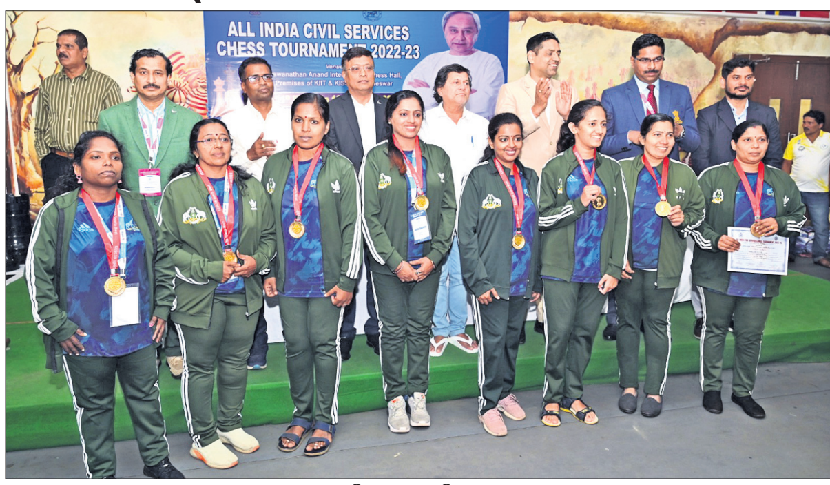
ଚାମ୍ପିୟନ କେରଳ ମହିଳା ଦଳ।

ଭୁବନେଶ୍ୱର, ୧୯୩୩ (ସ୍ପୋର୍ଟ୍ସ୍ ବ୍ୟୁରୋ) କିଂ ଓ କିଂରେ ସର୍ବଭାରତୀୟ ସିଲିଲ ସର୍ଭିସେସ୍ ଟେସ୍ ଉଦ୍‌ଘାଟିତ ହୋଇଛି। ପୁରୁଷ ବର୍ଗରେ ଆରଏସ୍‌ସି ଟେନିସ ଓ ମହିଳା ବର୍ଗରେ କେରଳ ଦଳଗତ ଚାମ୍ପିୟନ ଆଖ୍ୟା ଅର୍ଜନ କରିଛନ୍ତି।