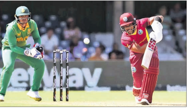
ଶତକୀୟ ଇନିଂସ ଖେଳିବା ଅବସରରେ ସାଇ ହୋପ୍ସ।

ଇଷ୍ଟ ଲଣ୍ଡନ, ୧୯୩୩(ପି.ଟି.) ଚଳିତ ଦିନର ଖେଳରେ ସାଇ ହୋପ୍ସ ଶତକୀୟ ଇନିଂସ ଖେଳିବା ଅବସରରେ ସାଇ ହୋପ୍ସ... ଫ୍ରେଷ୍ଟଲଣ୍ଡ ଦଳର ପ୍ରଦର୍ଶନ ଉତ୍ତମ ରହିଛି।