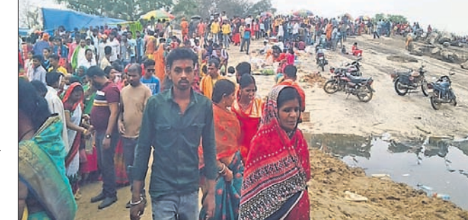
ସ୍ନାନ ଯାତ୍ରାକୁ ଆସିଥିବା ଶ୍ରଦ୍ଧାଳୁ।