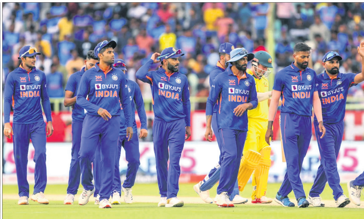
ପରାକ୍ରମ ପରେ ପଢ଼ିଆ ଛାଡ଼ୁଛନ୍ତି ଭାରତୀୟ ଖେଳାଳି ।

ବିଶାଖାପାଟଣା, ୧୯୩୩(ପି.ଟି.) ଭଲ ବୋଲର ଏହା ନିଶ୍ଚୟେହା ବୀର୍ଯ୍ୟ ଦୃଷ୍ଟିରେ ଦିନିକିଆରେ ଭାରତର ପରାକ୍ରମ ପରେ ମୁହଁ ଖୋଲିଛନ୍ତି ଅଧିନାୟକ ରୋହିତ ଶର୍ମା। ସ୍ୱାର୍ଜ୍‌ଙ୍କ ରଣନୀତି ସମ୍ମୁଖରେ ଭାରତୀୟ ବ୍ୟାଟର ଆତ୍ମସମର୍ପଣ କଲେ ବୋଲି ସେ କହିଛନ୍ତି। ଭାରତୀୟ ଖେଳାଳି ନିଜ ସ୍ୱାଭାବିକ ଖେଳ ପ୍ରଦର୍ଶନ କରିବାରେ ବିଫଳ ହେବା ସହିତ ପରାକ୍ରମ ବରଣ କରିଥିଲେ। ବିଶାଖାପାଟଣାର ପିଚ୍ ଆଦୌ ଲୋ ଷ୍ଟୋରିଂ ପିଚ୍ ନ ଥିଲା। ମାତ୍ର ଭାରତୀୟ ଖେଳାଳି ମାନେ ଉପଯୁକ୍ତ ଟେକନିକ୍‌ସ ସହିତ ଖେଳି ନ ପାରି ମାତ୍ର ୧୧୭ ରନ୍‌ରେ ଅଲଆଉଟ ହେଲେ ବୋଲି ରୋହିତ କହିଛନ୍ତି। ସ୍ୱାର୍ଜ୍‌ ଜଣେ