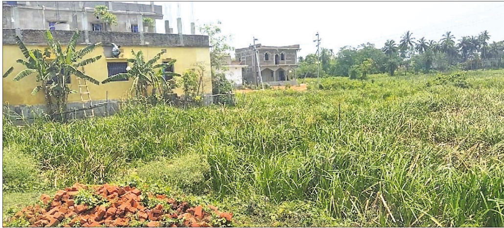
ଗୋବରାନଦୀକୁ ଜବରଦଖଲ କରି ଘର ନିର୍ମାଣ କରାଯାଇଛି ।

କେନ୍ଦ୍ରାପଡ଼ା ଜିଲ୍ଲା ପଞ୍ଚମୁଖାଳ ସହର ପାଖ ଦେଇ ପ୍ରବାହିତ ଗୋବରା ନଦୀ ଶୁଷ୍କ ହୋଇଯିବାରୁ ଜବରଦଖଲକାରୀମାନେ ନଦୀ କିସମ ଜମିକୁ ଜବରଦଖଲ କରି ଘରବାର କରିବାରେ ଲାଗିପଡ଼ିଛନ୍ତି । ଏହି ନଦୀ ୧୫ ଦଶନ୍ଧି ପୂର୍ବରୁ ଚିରସ୍ରୋତା ସହ ନୌକା ଚଳାଚଳ ପାଇଁ ଉଦ୍ଦିଷ୍ଟ ଥିଲା । ମାତ୍ର ବ୍ରାହ୍ମଣୀ ସହ ଗୋବରା ନଦୀର ସଂଯୋଗ ପଥ ବନ୍ଦ ହେବାରୁ ଗୋବରା ନଦୀ କ୍ରମଶଃ ପୋତିହୋଇ ପଡ଼ିବାରୁ ନଦୀ ଜବରଦଖଲକାରୀଙ୍କ କର୍ତ୍ତାକୁ ଚାଲିଯିବାରେ ଲାଗିଛି । ପଞ୍ଚମୁଖାଳ ଏହି ନଦୀ ଉପରେ ନିର୍ଭର କରୁଥିବା ଉଚ୍ଚମପାଣ୍ଠର ଶତାଧିକ ଗ୍ରାମବାସୀ ହଜାରୋ ଲୋକ ଅଛନ୍ତି । ଏଥିସହ ପାଣି ଅଭାବ ଯୋଗୁ ହଜାର ହଜାର ଏକା ଉର୍ବର ଚାଷଜମି ପଡ଼ିଆ ପଡ଼ିଛି, ଯାହାଦ୍ୱାରା ଲୋକମାନଙ୍କ ଅର୍ଥନୈତିକ ଓ ସାମାଜିକ ବିକାଶ ଘଟିପାରୁନାହିଁ । ଏ ନେଇ ସାମାଜିକ କର୍ମୀ ଓ ଅଧିବାସୀମାନେ ଆଇନର ଆଶ୍ରୟ ନେଇଛନ୍ତି । ସରକାର ଏହି ନଦୀ ଭିତରେ ଲନ୍ଦଡୋର ଷ୍ଟିଲିୟମ ନିର୍ମାଣକୁ ନେଇ ଚାଷୀ, ଅଧିବାସୀଙ୍କ ମଧ୍ୟରେ ଅସନ୍ତୋଷ ବଢ଼ିବାର ଲାଗିଛି ।