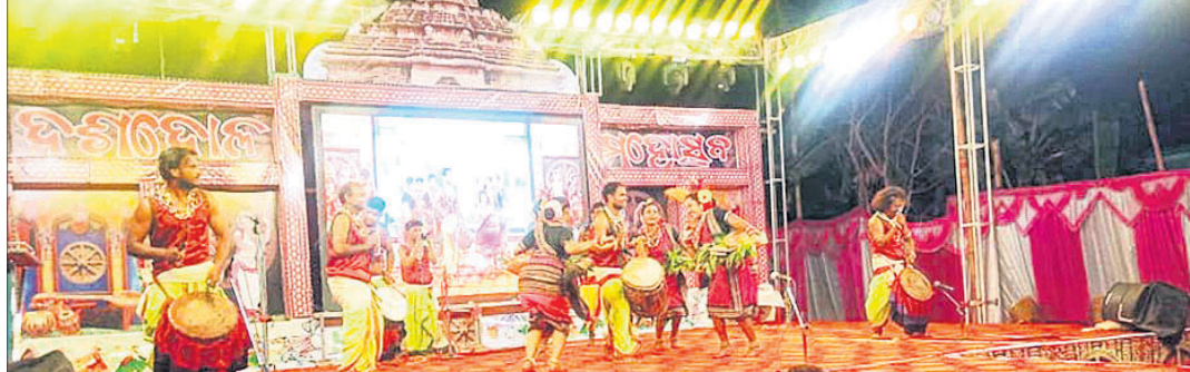
କଳାକାରରୁ ଆସିଥିବା କଳାକାରମାନେ ନୃତ୍ୟ ପରିବେଷଣ କରୁଛନ୍ତି ।