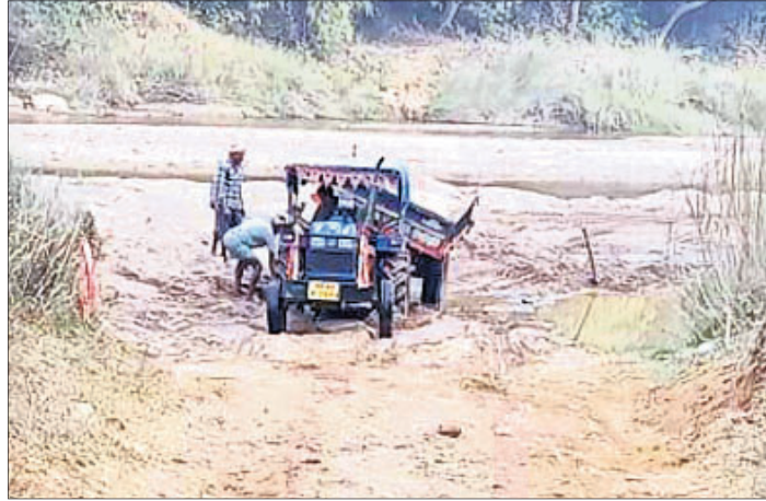
ଚୁଆଁରେ ଥିବା ବେଆଇନ ବାଲିଘାଟକୁ ବାଲି ଚାଲାଣ ହେଉଛି ।

ରହିଛି । ସେହିପରି କୁମୁମା, କୁଆଁରିଆଁ, ଡାହୁଳା, ବୁଢ଼ଙ୍ଗ, କାଳିଗିରି, ଚୁଆଂ, କମେଳ, ମାଧିକନୀ ପରି ନଦୀ ଜିଲ୍ଲା ବିଭିନ୍ନ ଅଞ୍ଚଳ ଦେଇ ପ୍ରବାହିତ ହୋଇଛି । ଏହି ନଦୀଗୁଡ଼ିକରେ ରହିଥିବା ବେଆଇନ ବାଲିଘାଟ ଉପରେ ଚଢ଼ାଉ ନାହିଁ । ଓଡ଼ିଶା ରାଜ୍ୟରେ କୁମୁମା, ଚୁଆଂ ଓ ରଣପୁର ବ୍ଲକ୍ ମାଧିକନୀ ନଦୀରେ ବେଆଇନ ଭାବେ ବାଲିଘାଟ ରହିଥିଲେ ମଧ୍ୟ ଏହାକୁ ନିଲମା ପାଇଁ ପଦକ୍ଷେପ ନିଆଯାଇନାହିଁ । ସେହିଭଳି ଚୁଆଁ ଚହସିଲ ମହିପୁର ଆରମ୍ଭ ହେଉଛି । ସେହିପରି ଡାହୁଳା ନଦୀରୁ ଚୁଆଁ ଓ ଡିମିଟିରୋ ବାଲିଘାଟ ବେଆଇନ ଭାବେ ଚାଲୁ ରହିଛି । ଏହି ବୁଲ ବାଲିଘାଟକୁ ନିଲମା କରାଯାଉନି । ବାଲି ଚୋରମାନେ ସରକାରୀ ବାବୁକୁ ଧରାଧରି କରି ବେଆଇନ ଭାବେ ବାଲିଘାଟକୁ ଚଳାଇ ଆସୁଥିବା ଅଭିଯୋଗ ହୋଇ ଆସୁଛି । ପ୍ରଶାସନିକସ୍ତରରେ