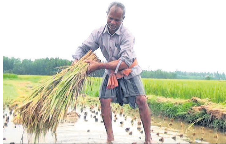
ବ୍ରହ୍ମଗିରି ଅଞ୍ଚଳର ଜଣେ ଚାଷୀ ନଷ୍ଟ ହୋଇଥିବା ଫସଲ ଦେଖାଉଛନ୍ତି।

ଭୁବନେଶ୍ୱର, ୧୯୩୩(ବୁଧବେଳା) ପଶ୍ଚିମ-ଝଡ଼ ପ୍ରଭାବରେ ରାଜ୍ୟର ବିଭିନ୍ନ ସ୍ଥାନରେ ଝଡ଼ତୋଫାନ, କୁଆପଥର ବର୍ଷା ସହ ବଜ୍ରପାତ ହୋଇଛି। ବିଶେଷକରି ଭଉର, ଦକ୍ଷିଣ ଏବଂ ଉପକୂଳ ଓଡ଼ିଶାର ବହୁ ସ୍ଥାନରେ ଶନିବାର ସନ୍ଧ୍ୟାରେ ବର୍ଷା ପବନ ଲାଗି ରହିଥିଲା। ଦୀର୍ଘ ୪ମାସ ପରେ ବର୍ଷା ହୋଇଥିବାରୁ ପାଗରେ ପରିବର୍ତ୍ତନ ଆସିବା ସହ ରାଜ୍ୟବାସୀଙ୍କୁ ଖରାପୁ ଯାମାନ୍ୟ ଆଶ୍ଚର୍ଯ୍ୟ ଦେଇଛି। ହେଲେ ଏହି ଅଦିନିଆ ବର୍ଷା ଚାଷୀର ମେରୁଦଣ୍ଡ ପୁଣି ଥରେ ଦୋହଲାଇ ଦେଇଛି। ବର୍ଷା ଏବଂ କୁଆପଥର ମାଡ଼ରେ ବିଭିନ୍ନ ସ୍ଥାନରେ ୩ କଣକ ମୃତ୍ୟୁ ଘଟିଥିବାବେଳେ ବ୍ୟାପକ ଫସଲ ନଷ୍ଟ ହୋଇଛି। ପୁରୀ ଜିଲ୍ଲା ବ୍ରହ୍ମଗିରି ଅଞ୍ଚଳରେ ବର୍ଷା ଯୋଗୁ ଏକର ଏକର ଧାନ ଚାଷ ନଷ୍ଟ ହୋଇଯାଇଥିବାବେଳେ