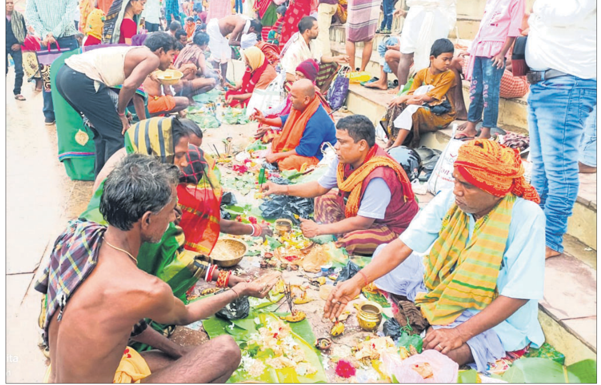
ଯାଜପୁରର ବୈତରଣୀ ନଦୀ କୂଳରେ ଅବସ୍ଥିତ ଦଶଶୁକେୟପାଟଣାରେ ବାଲୁଣୀ ଯୋଗରେ ରବିବାର ଶ୍ରଦ୍ଧାଳୁମାନେ ପିଠି ପକାଇଛନ୍ତି ।