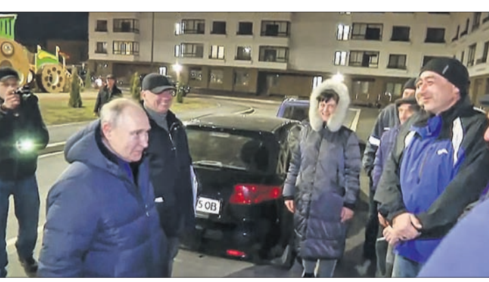
ମାରିଡପୋଲରେ ସ୍ଥାନୀୟ ଲୋକଙ୍କ ସହ କଥା ହେଉଛନ୍ତି ରୁଷିଆ ରାଷ୍ଟ୍ରପତି ଭୁଟିନ୍‌ର ପୁଟିନ୍‌।