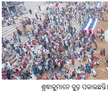
ଶ୍ରଦ୍ଧାଳୁମାନେ ବୁଡ଼ ପକାଇଛନ୍ତି।

୩ ବର୍ଷ ବ୍ୟବଧାନ ପରେ ଯାଜପୁର ଦଶାଶ୍ୱମେଧ ଯାତ୍ରାରେ ବାରୁଣୀ ଯୋଗରେ ଉଦ୍‌ଘୋଷଣା କରାଯାଇଛି। ପୂର୍ବରୁ କାରୋନା ପାଇଁ ୩ ବର୍ଷ ବାରୁଣୀ ବୁଡ଼କୁ ପ୍ରଶାସନ ବାରଣ କରିଥିଲା। ଫଳରେ ଶ୍ରଦ୍ଧାଳୁ ବାରୁଣୀ ସ୍ନାନ ଯୋଗ ସମୟରେ ବୁଡ଼ ପକାଇ ପାରୁ ନ ଥିଲେ। ବାରୁଣୀ ସ୍ନାନ ଭିତ୍ତିକୁ ଦୂଷିତ ରଖି ପ୍ରଶାସନ ପକ୍ଷରୁ ବ୍ୟାପକ ପ୍ରସ୍ତୁତି କରାଯାଇଥିଲା। ଯାଜପୁରର ବୈତରଣୀ ନଦୀ କୂଳରେ ଅବସ୍ଥିତ ଦଶାଶ୍ୱମେଧ ଯାତ୍ରା କେନ୍ଦ୍ରରେ ଅନୁଷ୍ଠାନ ଚାଲିଥିଲା। ଭାବେ ପ୍ରସିଦ୍ଧ। ଚଳିତ ବର୍ଷ ମହାଯୋଗ ନ ଥିଲେ ମଧ୍ୟ ବିଗତ ୩ ବର୍ଷକାଳ ଏହା ବନ୍ଦ ଥିବା ହେତୁ ବହୁ ଶ୍ରଦ୍ଧାଳୁଙ୍କ ଭିଡ଼ ଜମିଥିଲା। ବିରଳ ପଞ୍ଜିକା ଅନୁଯାୟୀ, ବୈତରଣୀ ଯାତ୍ରାରେ ଶତଭିକ୍ଷା ନକ୍ଷେତ୍ରରେ ପ୍ରାତଃ ୩ଟା ୩୩ରୁ ମଧ୍ୟାହ୍ନ ପର୍ଯ୍ୟନ୍ତ ଓ ଜଗନ୍ନାଥ ପଞ୍ଜିକାରେ ପ୍ରାତଃ ୮ଟା ୨୦ରୁ ରାତ୍ର ୮ ଘଟିକା ପର୍ଯ୍ୟନ୍ତ ଏଠାରେ ସ୍ନାନ ଯୋଗଥିଲା। ଯାଜପୁର ପୌରପାଳିକା ପକ୍ଷରୁ ବସ୍ତୁ ପରିଧାନ