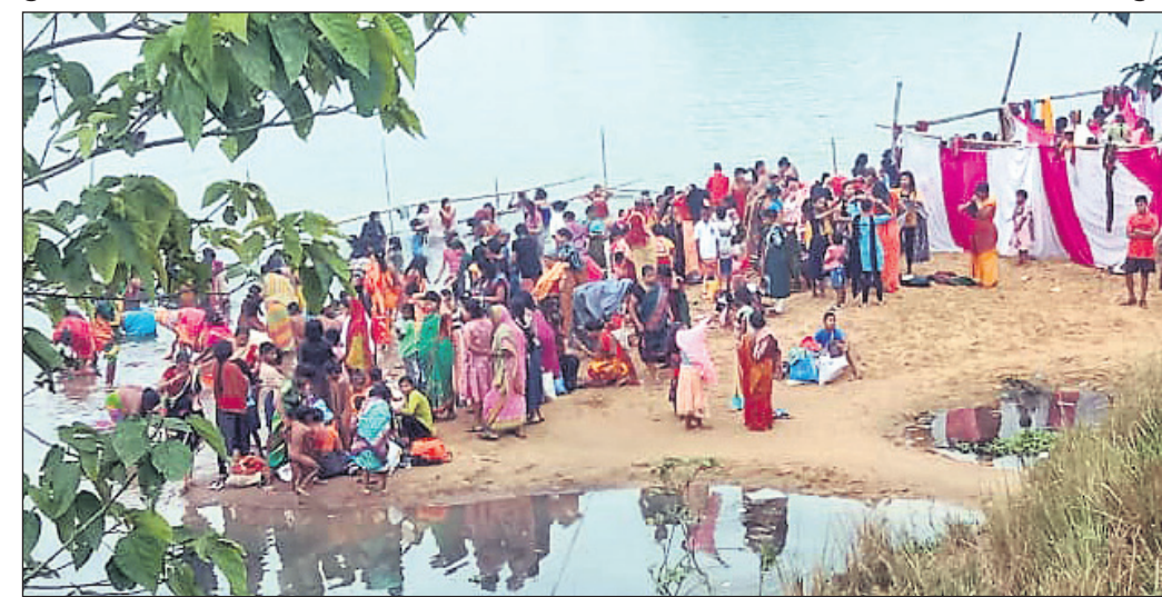
ଇନ୍ଦ୍ରପୁର ଘାଟରେ ଶ୍ରଦ୍ଧାଳୁମାନେ ବାରୁଣୀ ବୁଡ଼ ପକାଇଛନ୍ତି।

ବାରୁଣୀ ତିଥିରେ ବୁଡ଼ ପକାଇଲେ କୋଟିକର୍ମର ପାପକୁ ମୁକ୍ତି ମିଳିଥାଏ ବୋଲି ପ୍ରତ୍ୟେକ ଉଡ଼ିଆଳ ବିଶ୍ୱାସ ରହିଛି। କେନ୍ଦ୍ରାପଡ଼ା ଜିଲ୍ଲା କେନ୍ଦ୍ରାପଡ଼ା ବ୍ଲକ ଅନ୍ତର୍ଗତ ପ୍ରସିଦ୍ଧ ଇନ୍ଦ୍ରପୁର ବାରୁଣୀ ଯାତ୍ରା ରବିବାର ଆରମ୍ଭ ହୋଇଛି। ବିରୁପା, କେଲୁଆ, ବ୍ରାହ୍ମଣୀ ନଦୀର ସଙ୍ଗମସ୍ଥଳରେ ଶନିବାର ରାତି ୪ଟାରୁ ଅନୁଷ୍ଠିତ ହୋଇଥିଲା ବାରୁଣୀ ସ୍ନାନ। ଏଥିପାଇଁ ଜିଲ୍ଲା ସମେତ ବିଭିନ୍ନ ଜିଲାର ଶ୍ରଦ୍ଧାଳୁ ଇନ୍ଦ୍ରପୁର ଘାଟରେ ବୁଡ଼ ପକାଇଥିଲେ। ରବିବାର ସକାଳ ସାଢ଼େ ୬ଟା ପର୍ଯ୍ୟନ୍ତ ୨୦ ହଜାରରୁ ଊର୍ଦ୍ଧ୍ୱ ଶ୍ରଦ୍ଧାଳୁ ଏହି ଘାଟରେ ନିଜର ମାନସିକ ପୂରଣ ପାଇଁ ବୁଡ଼ ପକାଇଥିଲେ। ଏଥିସହ ବିବାହିତା ନବବଧୂକ ବିବାହ ପୁଣ୍ଡ, ପାଞ୍ଚ, ବଉଳପାଟ ନଦୀରେ ବିସର୍ଜନ କରାଯାଇଛି। ଘାଟକୂଳରେ ଭିକ୍ଷୁକମାନେ ପକାଇଥିବା ଚନ୍ଦରରେ ଶ୍ରଦ୍ଧାଳୁମାନଙ୍କ ଦ୍ୱାରା ଅରୁଆ ଚାଉଳ, ବିରି ଓ ଅର୍ଥ ପକାଇବା ପାଇଁ ଏକ ଲକ୍ଷଧାଡ଼ି ଲାଗି ରହିଥିଲା। ବିଶ୍ୱାସ ରହିଛି, ଘର ପରିଷ୍କାର ପୂର୍ଣ୍ଣ ହୁଏ। ନଦୀ ଘାଟରେ ଶ୍ରଦ୍ଧାଳୁଙ୍କ ଭିଡ଼କୁ ଲକ୍ଷ୍ୟକରି ଜଳ