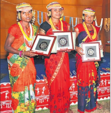
ଭୁବନେଶ୍ୱର, ୧୯ ମାର୍ଚ୍ଚ (ବୁଧବେଳା)

ଜାତୀୟ ଜନଜାତି କଳାବସ୍ତୁ ପ୍ରଦର୍ଶନୀ-୨୦୨୩ ରବିବାର ଆଦିବାସୀ ପ୍ରଦର୍ଶନୀରେ ଭାରତର ଜନଜାତି କଳାବସ୍ତୁ ପ୍ରଦର୍ଶନୀରେ ଭାରତର ବିଭିନ୍ନ ରାଜ୍ୟ ଯଥା ଆନ୍ଧ୍ରପ୍ରଦେଶ, ଅରୁଣାଚଳ ପ୍ରଦେଶ, ଛତିଶଗଡ଼, ଗୁଜୁରାଟ, ଝାରଖଣ୍ଡ, କେରଳ, ମଧ୍ୟପ୍ରଦେଶ, ମହାରାଷ୍ଟ୍ର, ରାଜସ୍ଥାନ, ତାମିଲନାଡୁ, ତେଲଙ୍ଗାନା, ଉତ୍ତରାଖଣ୍ଡ, ଉତ୍ତରପ୍ରଦେଶ ସମେତ ଓଡ଼ିଶାକୁ