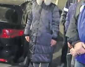
ମାରିଡପୋଲରେ ଗୁମାସ୍ତା ଲୋକଙ୍କ ସହ କଥା ହେଉଛନ୍ତି ସୁକ୍ରେନ୍ ମାତୃତ୍ୱ ଆଶ୍ୱାସନା ପୁଚିନ୍।