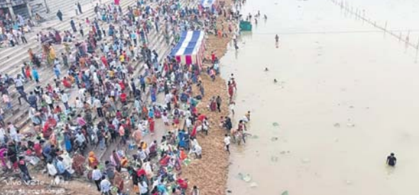
ଶ୍ରଦ୍ଧାଳୁମାନେ ବୁଡ଼ ପକାଇଛନ୍ତି ।