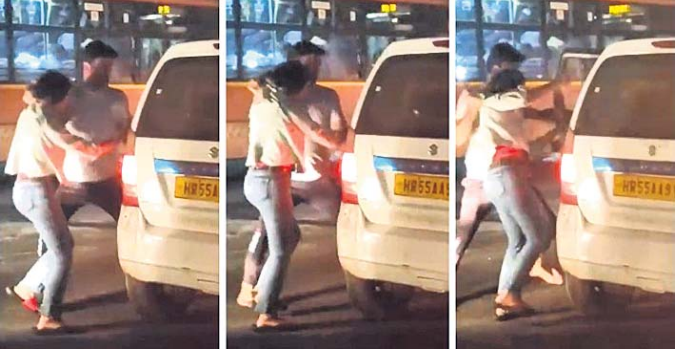
ଲକ୍ଷ୍ମୀ ମାମଲାରୁ ସିବିଆଇ ଧରିଥିଲା

ଲକ୍ଷ୍ମୀ ମାମଲାରୁ ସିବିଆଇ ଧରିଥିଲା ଶ୍ରୀମନ୍ଦିର, ୧୯୩୩: କଳ୍ପ-କଳ୍ପାରେ କଠୁଆ ଲିଲ୍ଲୀରେ ଦୁର୍ଗତ ଅଭିଯୋଗରେ ସିବିଆଇ ଧରିଥିଲା ଶ୍ରୀମନ୍ଦିର କଣେ କନଷ୍ଟେବଲଙ୍କ ମୃତ୍ୟୁ ଘଟିଛି । କଠୁଆ ମହିଳା ଆଗରେ ଅବସ୍ଥାପିତ କନଷ୍ଟେବଲ ମୃତ୍ୟୁପୀ ଅହମଦ କଣେ ଅଭିଯୋଗକାରୀଙ୍କଠାରୁ ସେ ୩,୦୦୦ ଟଙ୍କା ଲକ୍ଷ୍ମୀ ନେଉଥିବାବେଳେ ସିବିଆଇ ଅଧିକାରୀ ତାଙ୍କୁ ଧରିଥିଲେ ।