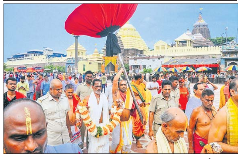
ଶ୍ରୀକରନାଥକ ଆଜ୍ଞାନୀକ ପୂଜାପଣ୍ଡା ପରୁଆରରେ ।