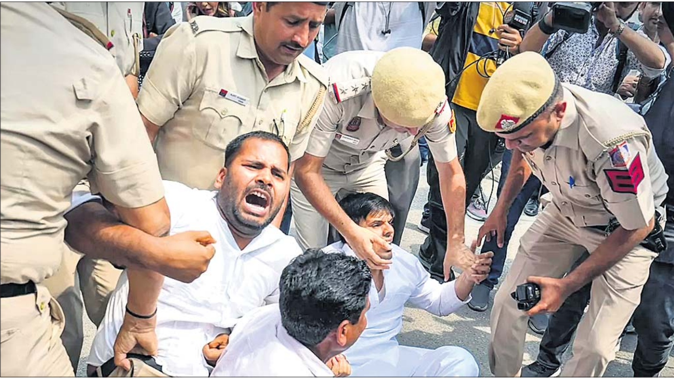
କଂଗ୍ରେସ ନେତା ରାଜୁଲ ଗାନ୍ଧୀଙ୍କ ୧୨ ଚୁରୁଲକ ଲେନ୍ଦ୍ ବାସଭବନରେ ରବିବାର ଦିଲ୍ଲୀ ପୋଲିସ୍ ପହଞ୍ଚିଛି । ଏହାର ପ୍ରତିବାଦରେ ବିଶେଷ କର୍ମୀମାନଙ୍କୁ ପୋଲିସ୍ ଉଠାଇନେଇଛି ।