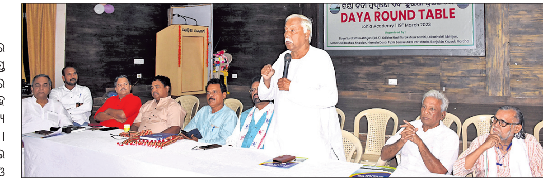
ବୈଠକରେ ଉପସ୍ଥିତ ଅତିଥିମାନେ ।

କିମ୍ବଦନ୍ତୀ ଦୟାନଦୀ ଏବେ ପ୍ରଦୂଷଣରେ ଜଳିପାରେ । ଭୁବନେଶ୍ୱରର ସମସ୍ତ ବର୍ଣ୍ଣବସ୍ତୁ ଗଢ଼ୁଆ ଦ୍ୱାରା ଦୟାନଦୀରେ ମିଶି ଅତ୍ୟନ୍ତ ଦୂଷିତ ହେଉଛି । ଏଥିସହ ଓଡ଼ିଶାର ଅନ୍ୟତମ ପ୍ରାକୃତିକ ସୌନ୍ଦର୍ଯ୍ୟ ରିଲିକାକୁ ମଧ୍ୟ ପ୍ରଦୂଷିତ କରିଚାଲିଛି । ଏହି ସମ୍ବେଦନଶୀଳ ସମସ୍ୟାକୁ ନେଇ ରବିବାର ‘ଦୟାନଦୀର ପ୍ରଦୂଷଣମୁକ୍ତ ଓ ସୁରକ୍ଷା’ ଶୀର୍ଷକ ଏକ ଆଲୋଚନାଚକ୍ର ଦୟା ରାଉଣ୍ଡ ଟେବୁଲ୍ ଅନୁଷ୍ଠିତ ହୋଇଯାଇଛି । ଦୟା ସୁରକ୍ଷା ଅଭିଯାନ, ମହାନଦୀ ବଞ୍ଚା ଅଧିକାର, ଓଡ଼ିଶା ନଦୀ ସୁରକ୍ଷା ସମିତି, ଲୋକଶକ୍ତି ଅଭିଯାନ, ନିର୍ମଳ ଦୟା, ସଂଯୁକ୍ତ କୃଷକ ମଞ୍ଚ, ପିପିଲି ସାଂସ୍କୃତିକ ପରିଷଦ ଏବଂ ଅନ୍ୟାନ୍ୟ ସାମାଜିକ ଅନୁଷ୍ଠାନ ପକ୍ଷରୁ ଲୋହିଆ ଏକାଡେମୀଠାରେ ଏହି ବୈଠକ ଆୟୋଜିତ ହୋଇଥିଲା । ଏଥିରେ ଦୟାନଦୀ ଜଳ ପ୍ରଦୂଷଣ ଓ ଜଳବଦ୍ଧତାକୁ ରୋକିବା ନିମନ୍ତେ ଏକ ସ୍ଥିର କମିଟି ଗଠନ କରିବା, ଆଲୋଚନାଚକ୍ରରେ ପ୍ରସ୍ତୁତ ହୋଇଥିବା ବିଭିନ୍ନ ଦାବିଗୁଡ଼ିକୁ କାର୍ଯ୍ୟକାରୀ କରିବା ନିମନ୍ତେ ବ୍ୟାପକ ଆନ୍ଦୋଳନ, ଧାରଣା, ଧର୍ମଯତ, ଆଇନଗତ ଲଢେଇ