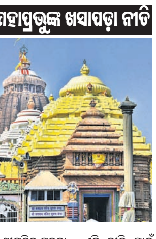
ମହାପ୍ରଭୁଙ୍କ ଖସାପଡ଼ା ନୀତି

ପୁରୀ ଅଫିସ, ୧୯୩୩ ଚୈତ୍ର ମାସ କୃଷ୍ଣ ପକ୍ଷ ଚତୁର୍ଦ୍ଦଶୀ ତିଥି ଅବସରରେ ସୋମବାର ଶ୍ରୀମନ୍ଦିରରେ ମହାପ୍ରଭୁଙ୍କ ଖସାପଡ଼ା ନୀତି ଅନୁଷ୍ଠିତ ହେବ। ମହାପ୍ରଭୁଙ୍କ ଶ୍ରୀଅଙ୍ଗଲୀର ସେବକ ଦଲତାପତିମାନେ ଏହି ନୀତି ସମ୍ପାଦନ କରିବେ। ଏହା ଏକ ଗୁପ୍ତନୀତି। ଦ୍ୱିତୀୟ ଭୋଗମଣ୍ଡପ ପରେ ଏହି ଗୁପ୍ତ ନୀତି ଅନୁଷ୍ଠିତ ହେବ। ତେଣୁ ସୋମବାର ଅପରାହ୍ଣ ୫ଟାକୁ ରାତି ୧୦ଟା ପର୍ଯ୍ୟନ୍ତ ଶ୍ରୀମନ୍ଦିରରେ ସର୍ବସାଧାରଣ ଦର୍ଶନ ବନ୍ଦ ରହିବ ବୋଲି ଶ୍ରୀମନ୍ଦିର ସୂଚନା ଓ ଲୋକ ସମ୍ପର୍କ ବିଭାଗ ପକ୍ଷରୁ ସୂଚନା ଦିଆଯାଇଛି। ଶ୍ରୀମନ୍ଦିରରେ ମଧ୍ୟାହ୍ନ ଧୂପ ସହ ଦ୍ୱିତୀୟ ଭୋଗମଣ୍ଡପ ସମ୍ପନ୍ନ ପରେ ମଇଲମ ନୀତି ସାରି ଜୟବିଜୟ ହାର ବନ୍ଦ କରାଯିବ। ଏହାପରେ ଶ୍ରୀଦେବୀ,