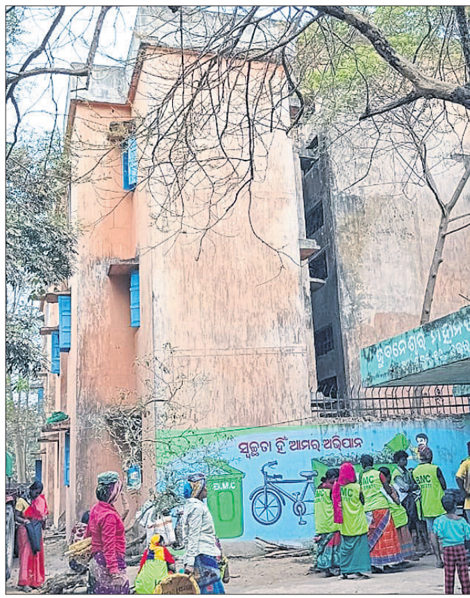
ମଞ୍ଜୁରୀପାତ୍ରରେ ଥିବା ଝାଁଳା ଓମେନ୍ ହସ୍ତେଲ।

ରାଜଧାନୀରେ ଗାଈଗୋରୁ ସାଜକୁ ବୁଲାଇ କୁକୁରଙ୍କ ଦୌରାନ୍ତରେ ଅତିଷ୍ଟ ହୋଇ ପଡିଲେଣି ସହରବାସୀ। ବିଶେଷକରି କୁକୁରମାନେ ହଠାତ୍ ଚଳନ୍ତା ଗାଡ଼ି ସମ୍ମୁଖକୁ ଆସି ଯାଉଥିବାରୁ ଅନେକ ସମୟରେ ଦୁର୍ଘଟଣା ଘଟୁଛି। ଏଥିସହ ଅନେକ କୁକୁର କାମୁଡ଼ାରେ ମଧ୍ୟ ଶିକାର ହେଉଛନ୍ତି। ଏପରିକି ବିଗତ ଦିନରେ କୁକୁର କାମୁଡ଼ାକୁ ନେଇ ଭୁବନେଶ୍ୱରରେ ବହୁ ଅପ୍ରୀତିକର ପରିସ୍ଥିତି ସୃଷ୍ଟି ହୋଇଛି। ଏହି ବିପଦରୁ ସହରବାସୀଙ୍କୁ ସୁରକ୍ଷା ଦେବାକୁ ଭୁବନେଶ୍ୱର ମହାନଗର ନିଗମ (ବିଏମ୍‌ସି) ପକ୍ଷରୁ ଚତୁରତା ପ୍ରକାଶ ପାଇଛି। ଗାଈଭଲାଇନ୍ ଅନୁଯାୟୀ ଗୋରୁଙ୍କ ଭଳି କୁକୁରମାନଙ୍କୁ କୌଣସି ଗୋଟିଏ ଗ୍ଲାନରେ ଆବଦ୍ଧ କରି ରଖାଯାଇ ପାରିବ ନାହିଁ। ସେମାନଙ୍କୁ କେବଳ ଏସିଏ (ଆନିମାଲ ବାସ୍ କମ୍ପେକ୍ସ) ପ୍ରୋଗ୍ରାମ ମାଧ୍ୟମରେ ନିୟନ୍ତ୍ରଣ କରାଯାଇ ପାରିବ। ତେଣୁ ବୁଲାଇ କୁକୁରଙ୍କ ବନ୍ଧ୍ୟାକରଣ ଉପରେ ଗୁରୁତ୍ୱ ଦେଉଛି ବିଏମ୍‌ସି। ମାତ୍ର ଦୈନିକ ଯେତିକି ସଂଖ୍ୟକ କୁକୁରଙ୍କ ଅପ୍ରୀତିକର ହେବା କଥା ଚାହା ହୋଇପାରେ ନାହିଁ। କୁକୁର ବନ୍ଧ୍ୟାକରଣକୁ ବ୍ୟାପକ କରିବା ଲାଗି ଏକ ସ୍ୱତନ୍ତ୍ର ହସ୍ତକାରୀ କରିବା ପାଇଁ ଯୋଜନା କରାଯାଇଛି। ପ୍ରଥମେ ଏହା ଅଗ୍ରାୟୀ ଭାବେ ମଞ୍ଜୁରୀପାତ୍ରରେ ଖୋଲିବ। ସେଠାରେ ଅଧିକାଂଶ ଉପକ୍ରମ ଏବଂ ଆନୁସୂଚିକ ଗତ ୧୦ ବର୍ଷ ଧରି ପରିତ୍ୟକ୍ତ ଅବସ୍ଥାରେ