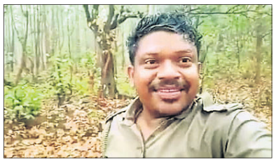
ଭିଡ଼ିଓ କରି ଖୁସି ମନାଉଥିବା ବନରକ୍ଷା ସାମାୟ ସାରେନ।