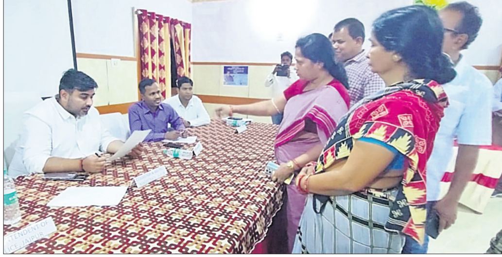
ଶିବିରକୁ ଆସିଥିବା ଲୋକମାନେ ଜିଲ୍ଲାପାଳଙ୍କୁ ଅଭିଯୋଗପତ୍ର ପ୍ରଦାନ କରୁଛନ୍ତି।