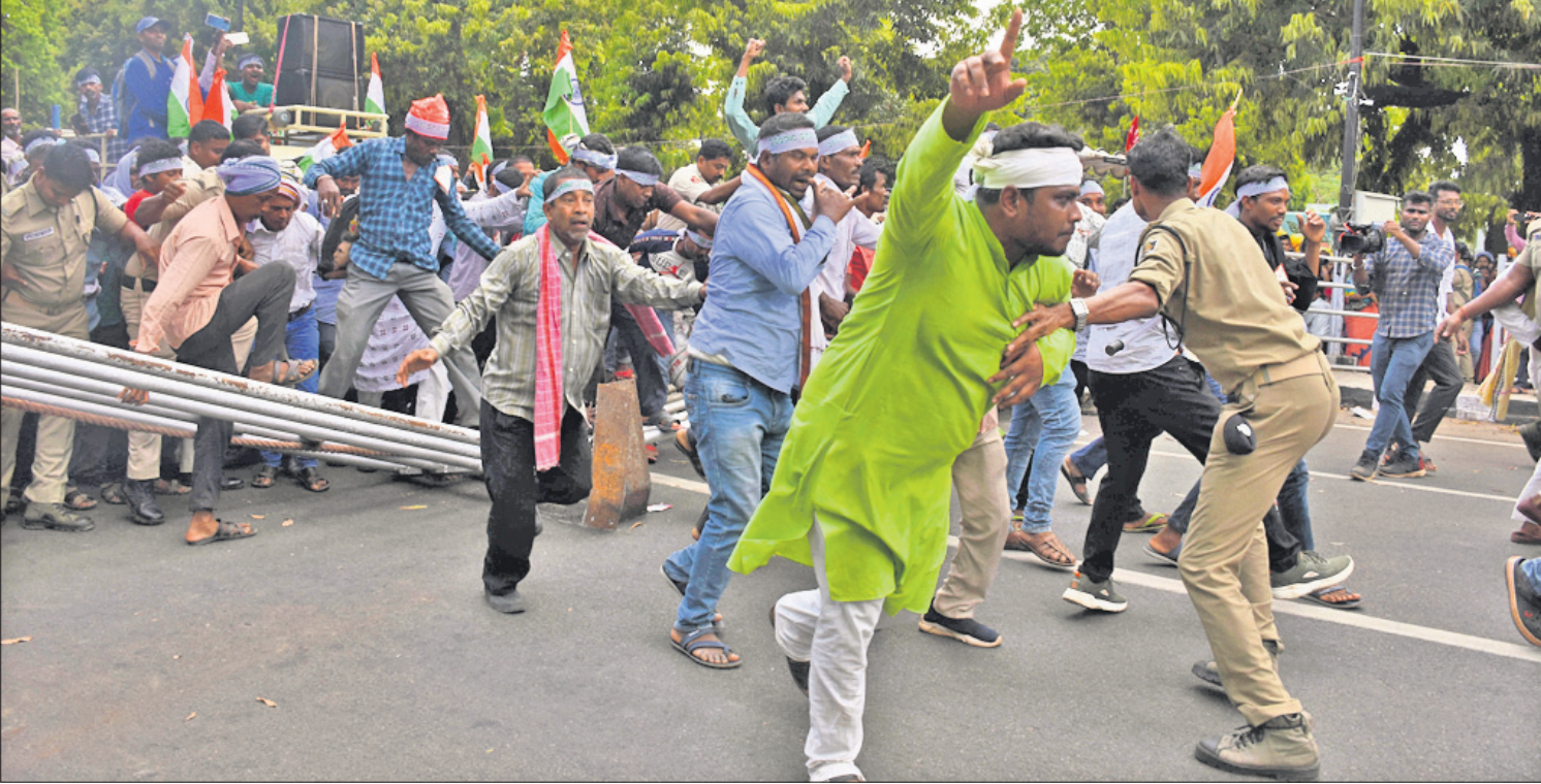
ନବନିର୍ମାଣ କୃଷକ ସଂଗଠନ ପକ୍ଷରୁ ଯୋଗଦାନ କରାଯାଇଥିବା ଭୁବନେଶ୍ୱର ଲୋକସଭା ପରିସରରେ ବ୍ୟାରିକେଡ୍ ଭାଙ୍ଗି ବିଧାନସଭା ଅଭିଯୋଗ ଯିବାକୁ ଉଦ୍ୟମ କରାଯାଇଛି ।