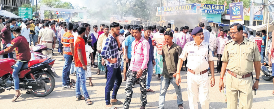
ଧାମନଗର ବିଦ୍ୟୁତ୍ ପକ୍ଷନାୟକ ଛକ ନିକଟ ମୁଖ୍ୟରାସ୍ତାକୁ ଅବରୋଧ କରାଯାଇଛି ।

ଧାମନଗର, ୨୦ ମାର୍ଚ୍ଚ (ସ.ପ୍ର./ଡି.ଏନ.ଏ.) ଭଦ୍ରକ ଜିଲ୍ଲା ଧାମନଗର ଏନ୍.ଏସି ଅଧୀନ ମୁକ୍ତାସାହିରେ ଯୋଗଦାନ ପୂର୍ବରୁ ଘର ପାଖରେ ଖେଳୁଥିବାବେଳେ ବିଦ୍ୟୁତ୍ ଆଘାତରେ ଜଣେ ୩ବର୍ଷର ଶିଶୁମୃତ୍ୟୁ ମୃତ୍ୟୁ ଘଟିଛି । ସେ ହେଲେ ୮ ନଂ. ଖାରବେଳ ସେକ୍ଟର କୁମାରୀ ପୁଅ ସେକ୍ ଅଧୀନ । ଅଧୀନ ଖୋଳିବା ସମୟରେ ଏକ ବିଦ୍ୟୁତ୍ ଖୁଣ୍ଟର ଷ୍ଟେ ଚାରକୁ ଛୁଇଁ ଦେଇଥିଲେ । ଫଳରେ ବିଦ୍ୟୁତ୍ ଆଘାତ ପାଇ ସେ ଅଚେତ ହୋଇଯାଇଥିଲେ । ପରିବାର ଲୋକେ ତାଙ୍କୁ ଧାମନଗର ଗୋଷ୍ଠୀ ସାମ୍ବଲକେନ୍ଦ୍ରକୁ ନେବାପରେ ଭଦ୍ରକ ଜିଲ୍ଲା ମୁଖ୍ୟ ଚିକିତ୍ସାଳୟକୁ ସ୍ଥାନାନ୍ତର କରାଯାଇଥିଲା । ସେଠାରେ ଡାକ୍ତର ତାଙ୍କୁ ମୃତ ଘୋଷଣା କରିଥିଲେ । ଘଟଣାକୁ ନେଇ ସ୍ଥାନୀୟ ଅଞ୍ଚଳରେ ଉତ୍ତେଜନା ପ୍ରକାଶ ପାଇଥିଲା । ଶିଶୁ ମୃତ୍ୟୁ ପାଇଁ ବିଦ୍ୟୁତ୍ ବିଭାଗର ଅବହେଳାକୁ ଦାୟୀ କରି କ୍ଷତିପୂରଣ ଓ କାର୍ଯ୍ୟାନୁଷ୍ଠାନ ଦାବିରେ ପରିବାର ଲୋକଙ୍କ ସମେତ ଗ୍ରାମବାସୀ ଧାମନଗର ବିଦ୍ୟୁତ୍ ପକ୍ଷନାୟକ ଛକ ନିକଟ