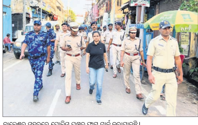
ବାଲେଶ୍ୱର ସହରରେ ପୋଲିସ ପକ୍ଷରୁ ପ୍ୟାଗ ମାର୍ଚ୍ଚ କରାଯାଇଛି।

ବାଲେଶ୍ୱର ସହରରେ ରାମନବମୀ ପର୍ବ ପର୍ବ ପାଳନ କରାଯାଇଛି। ପୋଲିସ ପକ୍ଷରୁ ସୁରକ୍ଷା ଦିଆଯାଇଛି।