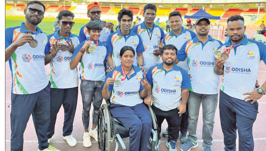
ପୁଣେରେ ଅନୁଷ୍ଠିତ ଜାତୀୟ ପାରା ଆଥଲେଟିକ୍ସ ପଦକ ବିଜୟୀ ଓଡ଼ିଆ ପ୍ରତିଯୋଗୀ ଓ ଅନ୍ୟମାନେ।