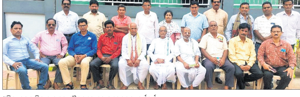
ଓଡ଼ିଶା କୃଷକ ବିକାଶ ମଞ୍ଚର ବୈଠକରେ ଯୋଗଦେଇଥିବା କର୍ମଚାରୀ।

କୃଷକ ବିକାଶ ମଞ୍ଚର ବୈଠକରେ ଯୋଗଦେଇଥିବା କର୍ମଚାରୀ। ଓଡ଼ିଶା କୃଷକ ବିକାଶ ମଞ୍ଚର ବୈଠକରେ ଯୋଗଦେଇଥିବା କର୍ମଚାରୀ।