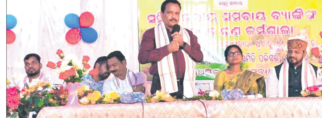
ଦେବାନୀକ ଅଧିକାରୀ, ୨୧୩

ଦେବାନୀକ ଜିଲ୍ଲା ରିପ୍ଟିଆ ବ୍ଲକ୍ ବାଉଁଶିଆ ପ୍ରାଥମିକ କୃଷି ସମବାୟ କେନ୍ଦ୍ର ପରିସରରେ ବ୍ୟାଙ୍କିଙ୍ଗ୍ ସେବା, ରଣ କର୍ମଶାଳା ଅନୁଷ୍ଠିତ