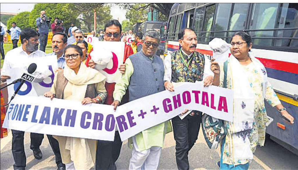
ଆଦମା ମାମଲାରେ ଜେପିସି ଡବ୍ଲ୍ୟୁ ଦାବିରେ ଲୁଚାବିଲ୍ଲୀର ବିକଳଚାଲିକାରେ ଭୃଶମୂଳ କଂଗ୍ରେସ ସମ୍ପ୍ରଦାୟର ସଭାକୁ ଅନୁଗାମୀ କରିଛନ୍ତି।

ଆମ୍ ଆଦମା ପାର୍ଟି ଓ ଅନ୍ୟ ଆନ୍ଧ୍ରକ ଦଳକୁ ନିର୍ବାଚନ ମଧ୍ୟ ସମୟ ମେଣ୍ଟକୁ ନେଇ ଅନୁଧ୍ୟାନ କରାଯାଇଛି, ଯାହା ଏକ ବହୁ-ପକ୍ଷ ଗଠନ ସୃଷ୍ଟି କରିବ। କଂଗ୍ରେସ ବିନା ବିରୋଧୀ ମେଣ୍ଟ ସମ୍ଭବ ନୁହେଁ ବୋଲି ଏହି ଦଳ ସମେତ ସମସ୍ତ ଦଳ ଶିବସେନା-ୟୁନିଟି ପକ୍ଷରୁ କୁହାଯାଇଛି।