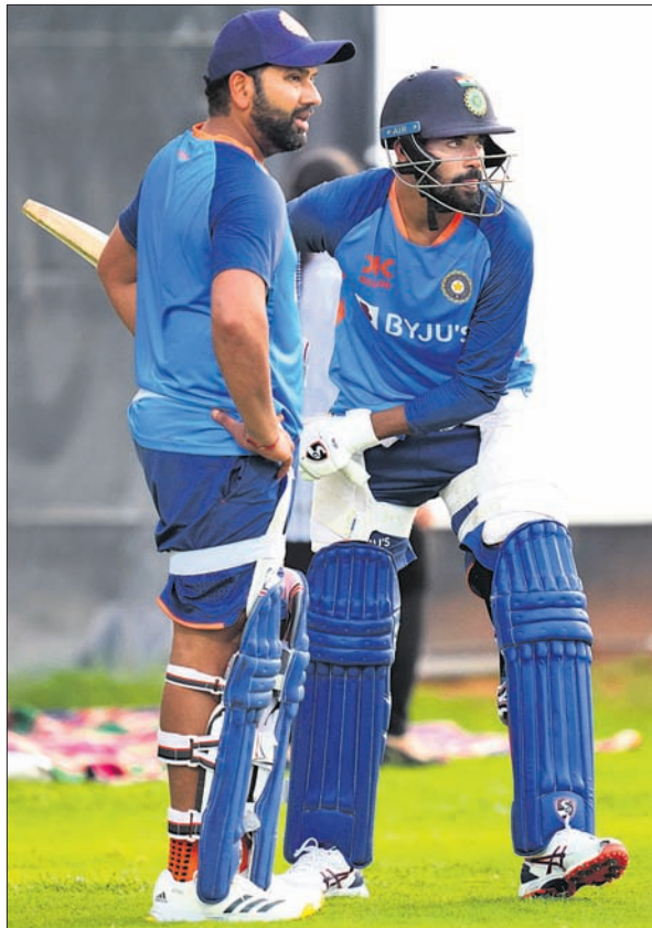
ନେଟ୍ ସେସନ ଅବସରରେ ଅଧିନାୟକ ରୋହିତ ଶର୍ମା ଓ ମହମ୍ମଦ ସିରାଜ ।

ଚେନାଇ, ୨୧ମାର୍ଚ୍ଚ (ପି.ଟି.) ଅଷ୍ଟ୍ରେଲିଆ ବିପକ୍ଷ ଦିନିକିଆ ସିରିଜର ନିର୍ଣ୍ଣାୟକ ମ୍ୟାଚ୍ ରୁଧିବାଦ ଚେନାଇର ଚେପକ୍ ଷ୍ଟାଡିୟମରେ ଖେଳାଯିବ। ଘରୋଇ ପରିବେଶରେ ଖେଳୁଥିବା ଭାରତ ଏହି ମ୍ୟାଚ୍ ଜିତିବା ସହିତ ସିରିଜ ବିଜୟ ହେବାକୁ ପ୍ରୟାସ କରିବ। ପୂର୍ବରୁ ପ୍ରମୁଖରେ ଅନୁଷ୍ଠିତ ପ୍ରଥମ ମ୍ୟାଚ୍ ଭାରତ ଜିତିଥିବା ବେଳେ ଦିଶାଖାପାଟଣାରେ ଅଷ୍ଟ୍ରେଲିଆ ୧୦ ରଜକେଟରେ ବିଜୟୀ ହୋଇଥିଲା। ଅନ୍ତମ ମ୍ୟାଚରେ ଭାରତକୁ ମିଚେଲ୍ ଚ୍ୟାଲେଞ୍ଜର ସାମ୍ନା କରିବାକୁ ପଡିବ। ବୋଲିଂରେ ମିଚେଲ୍ ଷ୍ଟାର୍କ ଓ ବ୍ୟାଟିଂରେ ମିଚେଲ୍ ମାର୍ଣ୍ଟି ଭାରତକୁ ଅସୁବିଧାରେ ପକାଇଛନ୍ତି। ପ୍ରଥମ ଦୁଇ ମ୍ୟାଚରେ ଷ୍ଟାର୍କ ୧୧ ରଜକେଟ ନେଇଥିବା ବେଳେ ମାର୍ଣ୍ଟି ମାରିଛନ୍ତି ୧୧ ଛକ। ଭାରତକୁ ସିରିଜ ବିଜୟୀ ହେବାକୁ ହେଲେ ରୋହିତ ଶର୍ମା, ବିରାଟ କୋହଲି, ଲୋକେଶ ରାହୁଲ ଓ ଶୁବମାନ ବିଲ୍କିନ୍ସ ପରି ଖେଳାଳିଙ୍କୁ ନିଜ ଶ୍ରେଷ୍ଠ ଫର୍ମରେ ଖେଳ ପ୍ରଦର୍ଶନ କରିବାକୁ ପଡିବ। ଷ୍ଟାର୍କ ବୋଲିଂ ସାଧାରଣ ରହିଥିବା ବେଳେ ଭାରତୀୟ ବ୍ୟାଟରମାନେ ଯେଉଁଠି ଦେଖାଇ ନାହାନ୍ତି। ବାମହାତୀ ଯେଉଁଠି ଷ୍ଟାର୍କ ବଲ୍ ସାଧାରଣତଃ ଇନ ପୁଇଜନ୍ ରହିଥାଏ। ମାତ୍ର ଭାରତୀୟ ଖେଳାଳି ନିଜ ଡିଫେନ୍ସ ଉପରେ ଭରସା ନ ଦେଖାଇବା ବଡ଼ ସମସ୍ୟା ପାଇଛି। ଭାରତୀୟ ଖେଳାଳିଙ୍କ ଡିଫେନ୍ସରେ କିଛି ସମସ୍ୟା ନ ଥିବା ବେଳେ ସେମାନଙ୍କୁ ମାନସିକ ଭାବରେ ପ୍ରସ୍ତୁତ ରହିବାକୁ ପଡିବ। ଭାରତୀୟ ପିଚରୁଟିକ ସାଧାରଣତଃ ଫ୍ଲାଟ ରହିଥାଏ। ଚେପକ୍ ପିଚ୍ ସାଧାରଣତଃ ଧିମା ରହିଥାଏ ଓ ମିଡିଲ ଓଭରରେ ରନ୍ ସ୍କୋର କରିବା କଷ୍ଟ ହୋଇଥାଏ। ମାତ୍ର ଚଳିତ