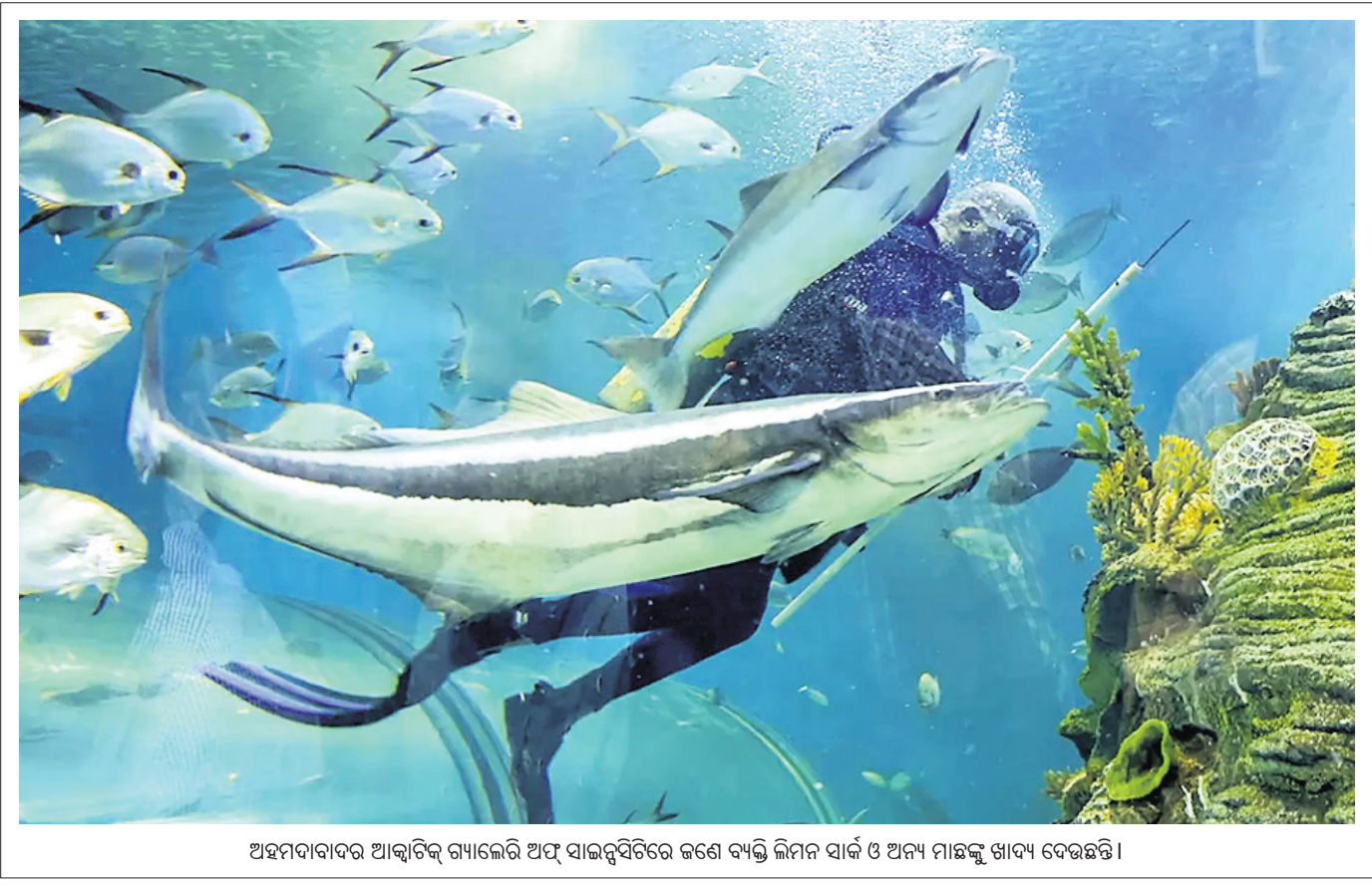
ଅନ୍ତରାନ୍ତରୀଣ ଆକାଶ ଗ୍ୟାଲେକ୍ସି ଅଫ୍ ସାଇଲେନ୍ସରେ ଜଣେ ବ୍ୟକ୍ତି ଲିମନ ସାର୍କ ଓ ଅନ୍ୟ ମାଛକୁ ଖାଦ୍ୟ ବେଉଛନ୍ତି।

ଚଣ୍ଡିଗଡ଼, ୨୧ମା: ଖଲିସ୍ତାନୀ ନେତା ଅମ୍ବିତ୍ତପାଳ ସିଂ ପୋଲିସକୁ ଚକ୍ରମାଳା ଦେଇ ଖସିଯାଇଛନ୍ତି। ସରକାରୀ ପକ୍ଷରେ ପଞ୍ଜାବ ଓ ହରିୟାଣା ହାଇକୋର୍ଟ ଗୋରାନ୍ଦା ବିମୁକ୍ତତାକୁ ନିର୍ବାହ କରିବା ସହ ସରକାରକୁ ଭଣ୍ଡନା କରିଛନ୍ତି। ୮୦,୦୦୦ ପୋଲିସ ଥିଲେ ସମସ୍ତଙ୍କୁ ରିଲିଫ କରାଗଲା ଅଥଚ ଖଲିସ୍ତାନୀ ପଞ୍ଜାବ ଡେଫେନ୍ସ ଆର୍ମି ସହିତ ଅମ୍ବିତ୍ତପାଳ ଖସିଗଲେ। ସିଡି ସବୁଜିଲ୍ଲା ଯୋଜନାବଦ୍ଧ ଭାବେ ହୋଇଥିଲା ତେବେ ସେ ଖସିଯିବାକୁ ସମସ୍ତ ହେଲେ କିପରି ବୋଲି କହିଲେ ଏଠାରେ ପଞ୍ଜାବ ଓ ଆନ୍ଧ୍ରପ୍ରଦେଶ ସରକାରଙ୍କୁ ଅମ୍ବିତ୍ତପାଳଙ୍କୁ ପୁଣି କରିଛନ୍ତି। ଖଲିସ୍ତାନୀ ନେତାଙ୍କ ବିରୋଧରେ ନୀତିମୂଳକ ଅଭିଯୋଗ କରାଯାଇଛି ଏବଂ ଏବେ ମଧ୍ୟ ସରକାର ଆକ୍ରମଣ (ଏନ୍ଏସ୍ଏ) ଲାଗୁ ହୋଇଥିବା ମଙ୍ଗଳବାର ପଞ୍ଜାବ ସରକାର ହାଇକୋର୍ଟକୁ ଜଣାଇଛନ୍ତି। ଅମ୍ବିତ୍ତପାଳଙ୍କୁ ଧରିବା ଲାଗି ଶନିବାର ପଞ୍ଜାବ ପୋଲିସ ପକ୍ଷରୁ ରାଜ୍ୟସୀମା ଦକ୍ଷିଣ ଦିଗରେ ଚଳାଯାଇଥିଲା। ଜଳନ୍ଧର ଜିଲ୍ଲାରେ ତାଙ୍କୁ ଗଢ଼ି ସମସ୍ତଙ୍କୁ ପୋଲିସ ପିଛା କରିବା ସହିତ ସେ ଖସି ଯାଇଥିବାକୁ ସମସ୍ତ ହୋଇଥିଲେ। ଅନ୍ୟପକ୍ଷରେ ଅମ୍ବିତ୍ତପାଳ ପୋଲିସ ହାତରେ ଗୃହ୍ଣିତ ତାଙ୍କ ଆଜନ ଉପଦେଶ ଅଭିଯୋଗ କରିବା ସହ ତାଙ୍କୁ କୋର୍ଟରେ ହାଜର କରାଇବାକୁ ନିର୍ଦ୍ଦେଶ ଦେବା ଲାଗି ହାଇକୋର୍ଟରେ ହାଜିଆଁ କର୍ତ୍ତବ୍ୟ ପିଟିଶନ ଦାଏର କରିଥିଲେ। ଖଲିସ୍ତାନୀ ନେତା ଏବେ ବି ଫେରାର ଥିବା ପଞ୍ଜାବ ପୋଲିସ କହିଛି।