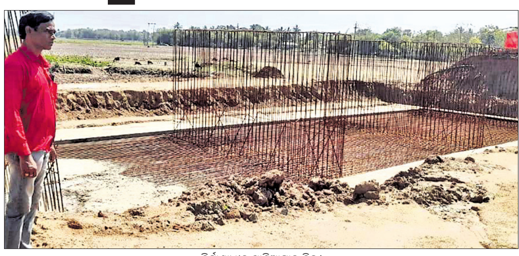
ନିର୍ମାଣାଧୀନ ଖାଣ୍ଡିଆଘାଟ ବ୍ରିଜ ।