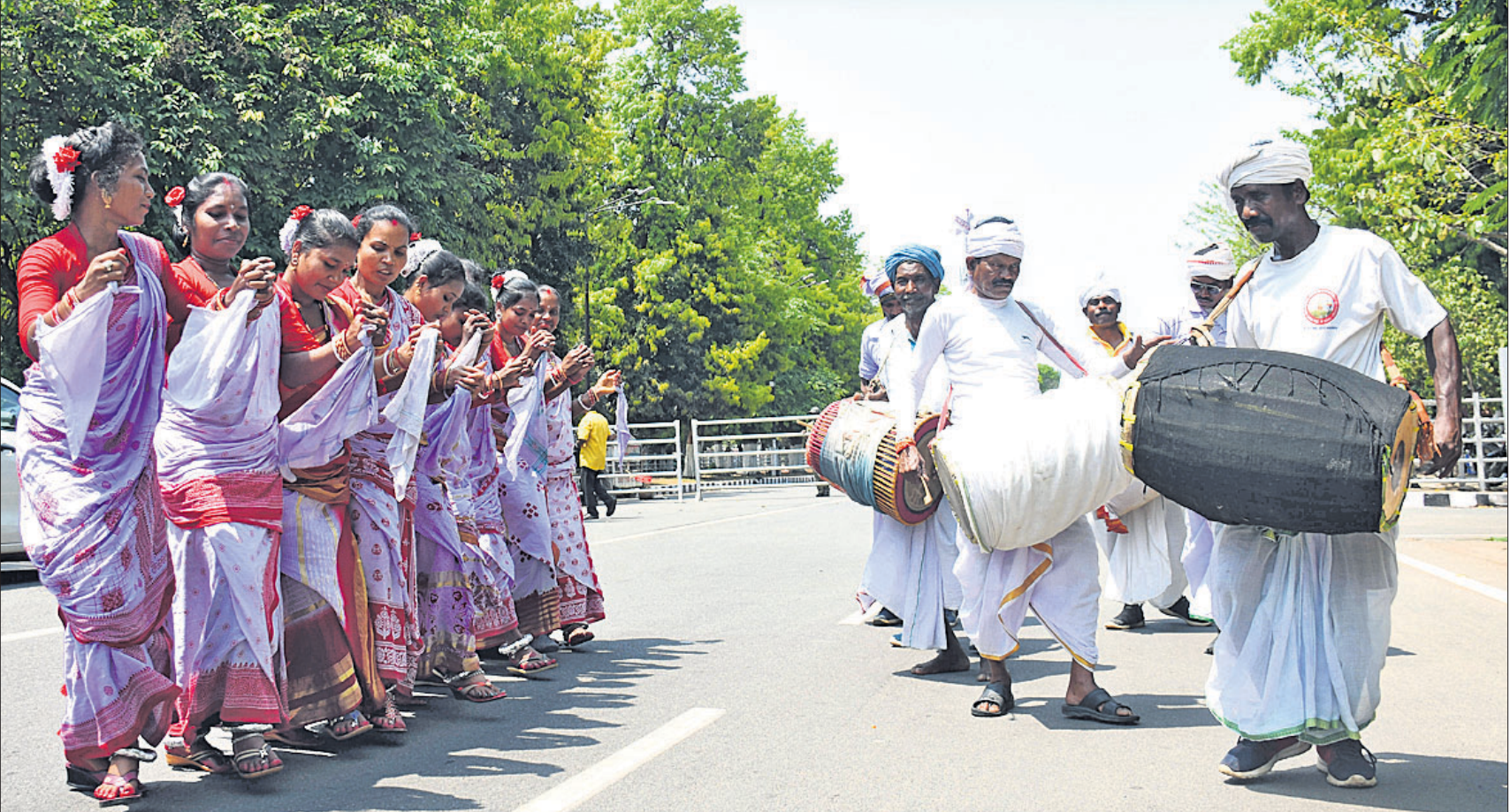
ଓଡ଼ିଶା ଲୋକକଳାର ସର୍ବାଙ୍ଗୀନ ବିକାଶ ସମେତ ୧୭ ଦମ୍ପା ଦାବିରେ ମଙ୍ଗଳବାର ଭୁବନେଶ୍ୱର ଲୋକଙ୍କ ପିଏମ୍‌ଜିରେ ରାଜ୍ୟ ପ୍ରାଚୀନ କଳା ଓ ସଂସ୍କୃତି ପୁନରୁଦ୍ଧାର ପରିଷଦ ପକ୍ଷରୁ ଲୋକନୃତ୍ୟ ପ୍ରଦର୍ଶନ କରାଯାଇଛି ।