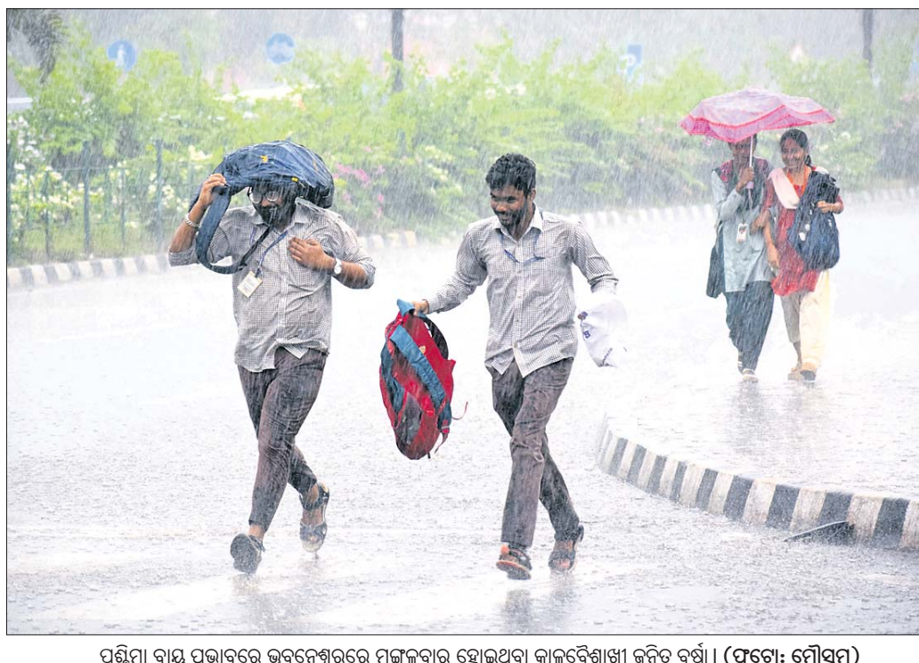
ପଶ୍ଚିମା ବାୟୁ ପ୍ରଭାବରେ ଭୁବନେଶ୍ୱରରେ ମଙ୍ଗଳବାର ହୋଇଥିବା ବାଲୁବେଶାଞ୍ଜୀ ଜନିତ ବର୍ଷା।

ଭାରତୀୟ ସମ୍ବିଧାନର ଅନୁଚ୍ଛେଦ ୩୨୩ଏ କେନ୍ଦ୍ର ସରକାରଙ୍କୁ ରାଜ୍ୟ ଆର୍ଥିକସ୍ଥିତିକୁ ଡ୍ରାମାଟିକ୍ ଭାବେ ଉନ୍ନତ କରିବାକୁ ବାରଣ କରିନାହିଁ। କାରଣ ଏହା କେବଳ ସାମର୍ଥ୍ୟ ପ୍ରଦାନକାରୀ କ୍ଷମତା, ଯାହା କେବଳ କେନ୍ଦ୍ର ସରକାର ରାଜ୍ୟ