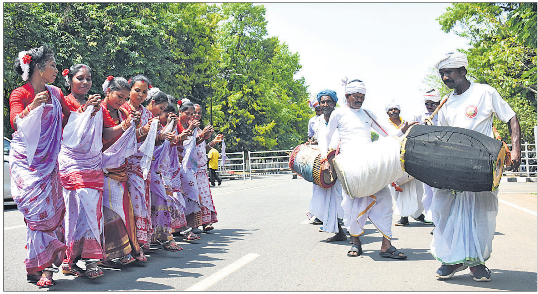
ଓଡ଼ିଶା ଲୋକକଳାର ସର୍ବାଙ୍ଗୀନ ବିକାଶ ସମେତ ୧୭ ଦର୍ପା ଦାବିରେ ମଙ୍ଗଳବାର ଭୁବନେଶ୍ୱର ଲୋକସଭା ପିଏମ୍‌ଜିରେ ରାଜ୍ୟ ପ୍ରାଚୀନ କଳା ଓ ସଂସ୍କୃତି ପୁନରୁଦ୍ଧାର ପରିଷଦ ପକ୍ଷରୁ ଲୋକନୃତ୍ୟ ପ୍ରଦର୍ଶନ କରାଯାଇଛି ।