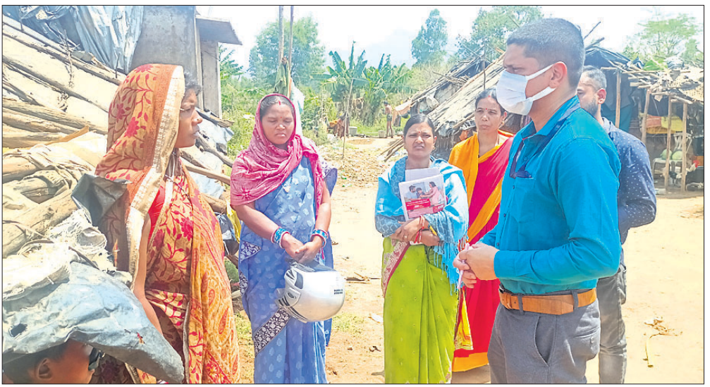
ଲୋକଙ୍କୁ ତାଙ୍କର ସଚେତନ କରୁଛନ୍ତି। କର୍ମୀ ଉପାଦେୟା ବିଦିକା ଏବଂ ଆଶା କର୍ମୀ ଏଲ୍ଲୁଲ ବିଦିକା ପହଞ୍ଚି ଆକ୍ରାନ୍ତଙ୍କୁ ଦେଖିବା ପରେ ସାମ୍ବାୟ ବିଭାଗୀୟ ଆକ୍ରାନ୍ତଙ୍କୁ ଜଣାଇଥିଲେ। ଜିଲା ପୁଞ୍ଜୀ ଚିକିତ୍ସାଳୟରୁ ଏକ ଡାକ୍ତରୀ ଟିମ୍ ସମ୍ପୂର୍ଣ୍ଣ ଦେଖିବା ପରେ ସାମ୍ବାୟ ବିଭାଗୀୟ ଆକ୍ରାନ୍ତଙ୍କୁ ଜଣାଇଥିଲେ। ଜିଲା ପୁଞ୍ଜୀ ଚିକିତ୍ସାଳୟରୁ ଏକ ଡାକ୍ତରୀ ଟିମ୍ ସମ୍ପୂର୍ଣ୍ଣ ଦେଖିବା ପରେ ସାମ୍ବାୟ ବିଭାଗୀୟ ଆକ୍ରାନ୍ତଙ୍କୁ ଜଣାଇଥିଲେ। ଜିଲା ପୁଞ୍ଜୀ ଚିକିତ୍ସାଳୟରୁ ଏକ ଡାକ୍ତରୀ ଟିମ୍ ସମ୍ପୂର୍ଣ୍ଣ ଦେଖିବା ପରେ ସାମ୍ବାୟ ବିଭାଗୀୟ ଆକ୍ରାନ୍ତଙ୍କୁ ଜଣାଇଥିଲେ।

୧୨ ଆକ୍ରାନ୍ତ ହେଲେଣି, ଦେଶୀ ଚିକିତ୍ସା ଓ ଗୁଣିଗାରେଡ଼ି ଭରସା