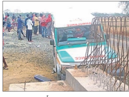
ଦୁର୍ଘଟଣାଗ୍ରସ୍ତ ଆୟୁଲାର୍ ।