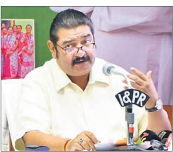
ଶିଳ୍ପମନ୍ତ୍ରୀ ପ୍ରତାପ କେଶରୀ ଦେବ

ଭୁବନେଶ୍ୱର, ୨୧ମାର୍ଚ୍ଚ(ବୁଧବୋ) ରାଜ୍ୟରେ ବିଶ୍ୱପ୍ରସିଦ୍ଧ ଲକ୍ଷ୍ମଣ ବ୍ୟାଙ୍କ ପ୍ରତିଷ୍ଠା, ଶିଳ୍ପ ଏବଂ ସମର୍ଥନ ଭିତ୍ତିଭୂମି ଓ ପୁଞ୍ଜିନିବେଶ ପାଇଁ ୨୦୨୩-୨୪ ଆର୍ଥିକ ବର୍ଷରେ ଶିଳ୍ପ ବିଭାଗକୁ ୨୧୦.୦୦ କୋଟି ଟଙ୍କାର ବଜେଟ୍ ଦିଆଯାଇଛି। ଶିଳ୍ପ ପ୍ରଭୃତି ଭିତ୍ତିଭୂମିର ଉନ୍ନତି ଲାଗି ୫୫୬ କୋଟି ଟଙ୍କାର ଅଧିକ ବ୍ୟୟବ୍ୟୟ କରାଯାଇଛି। ଏହା ୨୦୨୨-୨୩ ଆର୍ଥିକ ବର୍ଷର ବଜେଟ୍ ତୁଳନାରେ ୨୫ ପ୍ରତିଶତ ଅଧିକ ବୋଲି ଶିଳ୍ପମନ୍ତ୍ରୀ ପ୍ରତାପ କେଶରୀ ଦେବ କହିଛନ୍ତି।