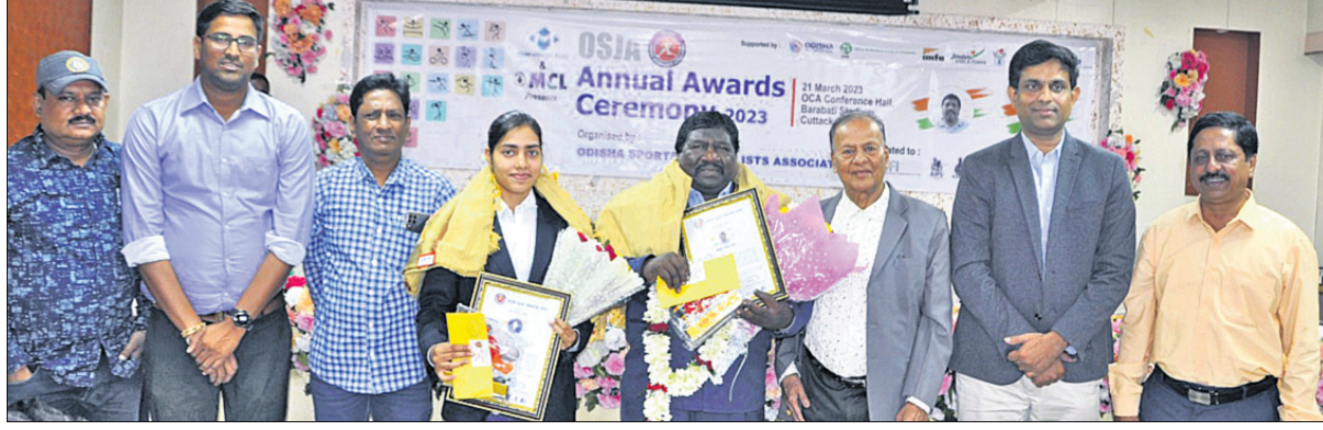
ପୁରସ୍କୃତ କ୍ରୀଡ଼ାବିତ୍ ଓ ଅତିଥିକ ଗହଣରେ ଓସ୍‌ଜା କର୍ମକର୍ତ୍ତା।

ଭାରତୀୟ ଅତିତ ଓ ଆକାଶକୁ ପୂର୍ଣ୍ଣାଙ୍ଗ ହକି ଉଦ୍‌ସାପିତ ପଶ୍ଚିମବଙ୍ଗ ଚାମ୍ପିୟନ, ଓଡ଼ିଶା ରନରଥ ପ୍ରତିଷ୍ଠା ତଥା ଓଡ଼ିଶା ଭଲିବଲ୍ ଇତିହାସରେ ଏପରି ଅନୁତ ପ୍ରଥମ ଥର ପ୍ରଥମ ପାଇଁ ବୁଲ ଖେଳାଳି ଖେଳାଳି ଅଲିମ୍ପିକ୍ ଫ୍ଲୋର ସମର ଗେମ୍ ପାଇଁ ମନୋନୀତ ହୋଇଛନ୍ତି। ଗତବର୍ଷ ଗୋଟିଏ କ୍ୟାଲେଣ୍ଡର ବର୍ଷରେ ଓଡ଼ିଶା ୬ ଜଣ ଅଭିନେତା ଭଲିବଲ୍ ଖେଳାଳି ସୃଷ୍ଟି କରିଥିଲେ। କିର୍ ଓ କିର୍ ପ୍ରତିଷ୍ଠା ତଥା