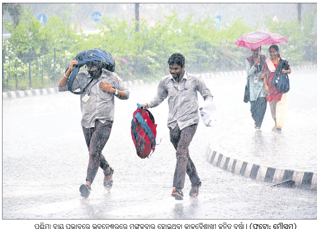
ପଶ୍ଚିମା ବାୟୁ ପ୍ରଭାବରେ ଭୁବନେଶ୍ୱରରେ ମଙ୍ଗଳବାର ହୋଇଥିବା ବାଲୁବିଶାଳା ଜନିତ ବର୍ଷା।

ଭାରତୀୟ ସମ୍ବିଧାନର ଅନୁଚ୍ଛେଦ ୩୨୩ଏ କେନ୍ଦ୍ର ସରକାରଙ୍କୁ ରାଜ୍ୟ ଆର୍ଥିକସ୍ଥିତିକୁ ଡ୍ରାମାଟିକ୍ ଭାବରେ ଉନ୍ନତ କରିବାକୁ ବାରଣ କରିନାହିଁ। କାରଣ ଏହା କେବଳ ସ୍ୱାସ୍ଥ୍ୟ ସେବା ଉପାଦାନର ସ୍ୱାସ୍ଥ୍ୟ ଉଲ୍ଲେଦ ନିଷ୍ପତ୍ତିକୁ ବୈଧ କରିବାକୁ ଉପାଦାନର ସ୍ୱାସ୍ଥ୍ୟ ଉଲ୍ଲେଦ ନିଷ୍ପତ୍ତିକୁ ବୈଧ କରିବାକୁ ଚାହୁଁଥିଲେ।