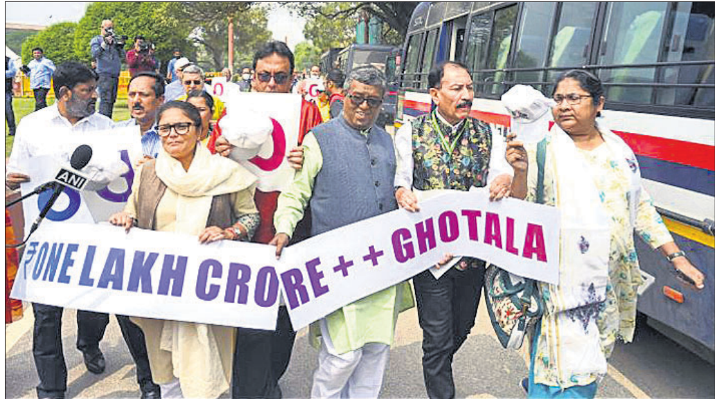
ଆଦାମୀ ମାମଲାରେ କେପିଏ ଡକ୍ଟର ଦାବିରେ ନୂଆଦିଲ୍ଲୀର ବିଜୟଶେଖରୀଠାରେ ଦୁର୍ଗମ୍‌ଜୀ କଂଗ୍ରେସ ଏମ୍‌ପିମାନଙ୍କ ବିରୋଧ।

ଆମ୍ ଆଦମା ପାର୍ଟି ଓ ଅନ୍ୟ ଆଞ୍ଚଳିକ ଦଳଗୁଡ଼ିକ ମଧ୍ୟ ସମାପ୍ୟ ମେଣ୍ଟକୁ ନେଇ ଅନୁଧ୍ୟାନ ଚଳାଇଛନ୍ତି, ଯାହା ଏକ ବହୁମୁଖୀ ଛୁଟି ସୃଷ୍ଟି କରିଛି। କଂଗ୍ରେସ ବିନା ବିରୋଧୀ ମେଣ୍ଟ ସମ୍ଭବ ନୁହେଁ ବୋଲି ଏହି ଦଳ ସମେତ ଏନ୍‌ସିପି ଏବଂ ଶିବସେନା-ଭୁବିଟି ପକ୍ଷରୁ କୁହାଯାଇଛି। ଦେଶରେ ଏପର୍ଯ୍ୟନ୍ତ ଭାଙ୍ଗିବା ବିରୋଧୀ ହାତୀ ଆସି ନ ଥିବା ସେନା-ଭୁବିଟି ନେତା ସ୍ୱାକାର କରିଥିବାବେଳେ ଖୁବ୍‌ଶୀଘ୍ର ଲୋକଙ୍କ ମାନସିକତାରେ ପରିବର୍ତ୍ତନ ଆସିବ ବୋଲି କହିଛନ୍ତି।