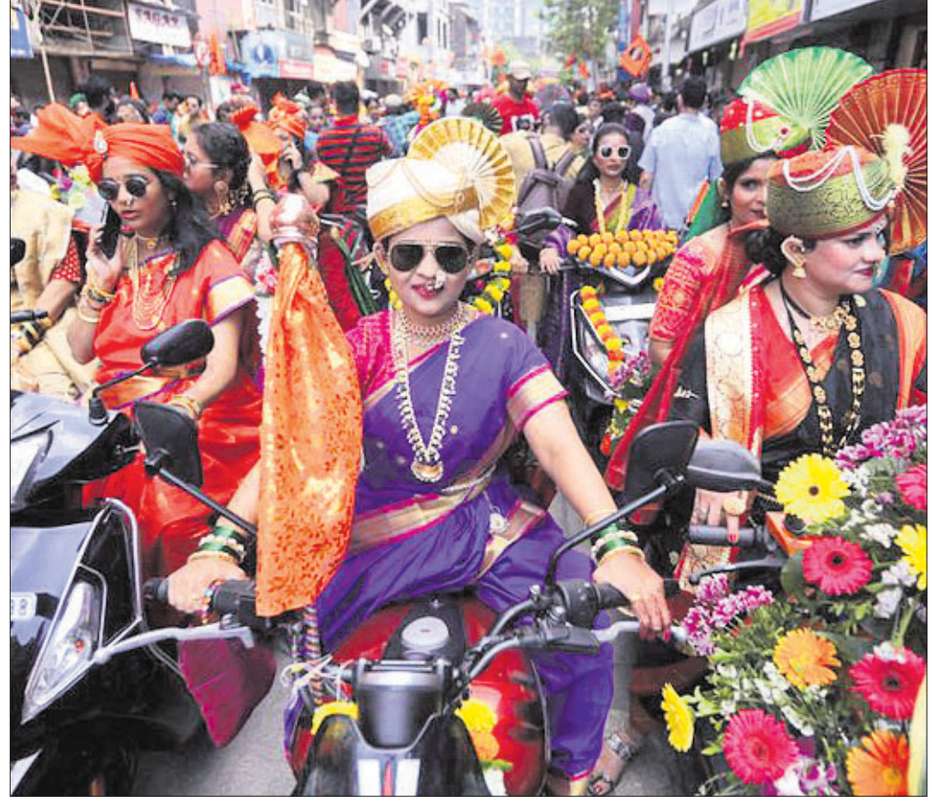
ମହାରାଷ୍ଟ୍ରର ନବବର୍ଷ ଆରମ୍ଭରେ ବୁଧବାର ମୁମ୍ବାଇରେ ଆୟୋଜିତ ଚୁଡ଼ି ପଡ଼ଖା ଉତ୍ସବରେ ମହିଳାମାନେ ପାରମ୍ପରିକ ପୋଷାକରେ ଶୋଭାଯାତ୍ରାରେ ବାହାରିଛନ୍ତି।

ଭୋପାଳରେ ଚାଲିଥିବା ଆଇଏସଏସଏଫ୍ ଶୁକ୍ଳ ବିଶ୍ୱକପରେ ସ୍ୱର୍ଣ୍ଣ ପଦକ ଜିତିଛନ୍ତି ଭାରତର ସରକାର ଓ ସିଏ।