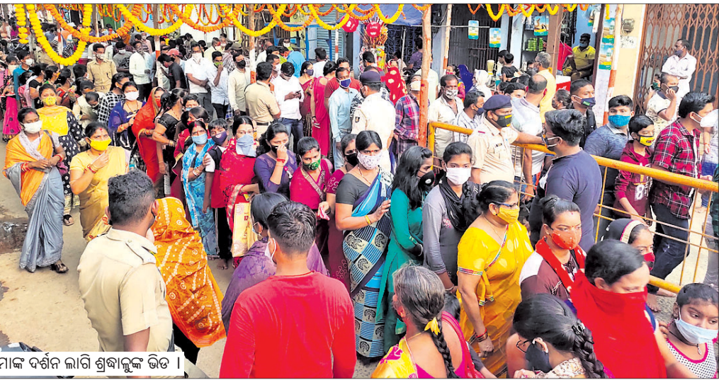
ମା'ଙ୍କ ଦର୍ଶନ କରି ଶ୍ରଦ୍ଧାଳୁଙ୍କ ଭିଡ଼ ।

ସେହିପରି ତେରାମାନଙ୍କ ଦ୍ୱାରା ଠାକୁରାଣୀଙ୍କୁ ଆଣି କଂସାରି ସାହି