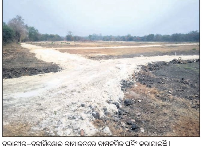
ବଲାଙ୍ଗୀର-ବୁଡ଼ାସିନ୍ଧିଆ ରାସ୍ତାକଡ଼ରେ ଚାଷଜମିକୁ ଫୁଟି କରାଯାଇଛି।

ଝକ ପର୍ଯ୍ୟନ୍ତ, ସମ୍ବଲପୁର ରାସ୍ତାରେ ୧୦/୧୨ କିଲୋମିଟର ଦୁର୍ଗାପାଲି, ଫାସଡ଼ ପର୍ଯ୍ୟନ୍ତ, ପାଟଣାଗଡ଼ ରାସ୍ତାରେ ୧୪ କିଲୋମିଟର ହଡ଼ିଗାଳ ପର୍ଯ୍ୟନ୍ତ ଏବଂ ଚିଟିଲାଗଡ଼ ରାସ୍ତା ସିନ୍ଧୁଖମନ ଯାଏ ବିଭିନ୍ନ ସ୍ଥାନର ଶତାଧିକ ଏକର ଜମିକୁ ଏବେ ଧନୀ, ବିଲ୍ଡିଂ ଏବଂ ଜମି ବେପାରୀ ନିଜ କବ୍ଜାକୁ ନେଇଗଲେଣି।