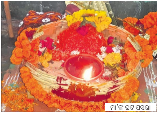
ମା'ଙ୍କ ଘଟ ପସରା

ବାପାଘରୁ ଆସିବା ଓ ଯାତ୍ରା କରାଯିବାର ବିଧି ରହିଛି । ଠାକୁରାଣୀ ଯାତ୍ରାର ପ୍ରାଚୀନ ପରମ୍ପରା ଅଛି । ଯାତ୍ରା ଆରମ୍ଭର ଦ୍ୱିତୀୟ ଦିବସରେ ଘଟ ହାଣ୍ଡି ଦେଖା ବେହେରାଙ୍କ ନିକଟରେ ମନ୍ଦିର ନିର୍ମାଣ କରି ବିଗ୍ରହ ସ୍ଥାପନ କରାଯାଇଥିଲା ।