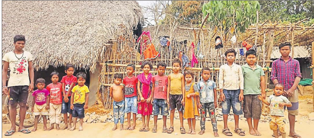
ସ୍କୁଲ ବାରଣ୍ଡା ମାଡ଼ିନାହାଡ଼ି ଶିଶୁ ।

‘ସବିଏ ପଢ଼ିବେ, ସବିଏ ବଢ଼ିବେ’ର ଘୋଷାଦାନ ଏବେ ବୁରୁଡ଼ା ଅଞ୍ଚଳରେ ଫେଲ୍ ମାରିଥିବା ଦେଖିବାକୁ ମିଳିଛି। ୩ ରୁ ୧୪ ବର୍ଷ ପିଲାଙ୍କ ପାଇଁ ଶିକ୍ଷା ବାଧ୍ୟତାମୂଳକ କରାଯାଇଛି। ଗୋଟିଏ ଦି ଶିଶୁ ଯେମିତି ବିଦ୍ୟାଳୟ ଯିବାକୁ ବଞ୍ଚିତ ନହେବେ ସେଥିପ୍ରତି ବିଭିନ୍ନ ଅଧିକାରୀଙ୍କୁ ନିୟୋଜିତ କରାଯାଇଛି। ହେଲେ ଏତେ ସବୁ ବ୍ୟବସ୍ଥା ସତ୍ତ୍ୱେ ବି ସବୁ ଫେଲ୍ ମାଡ଼ିଛି, ଯାହାର ନିଜ୍ଜଳ ଚିତ୍ର ଦେଖିବାକୁ ମିଳିଛି ଗଞ୍ଜାମ ଜିଲ୍ଲା ବୁରୁଡ଼ା ବ୍ଲକ୍ କରକ୍ଷା ପଞ୍ଚାୟତ ଅନ୍ତର୍ଗତ ମାଧପଲ୍ଲୀ ଆଦିବାସୀ ଗ୍ରାମରେ। ଏହି ଗ୍ରାମର ୨ଟି ପିଲାଙ୍କୁ ଛାଡ଼ି ଦେଲେ ଅନ୍ୟମାନେ ସ୍କୁଲ କି ଅଜ୍ଞାନତା କେନ୍ଦ୍ର ଦେଖିନାହାନ୍ତି। କାରଣ ବୁଝିବାରେ ଲାଗିପଡ଼ିଲା ଗାଁରେ ଅଜ୍ଞାନତା କେନ୍ଦ୍ର ନାହିଁ କି ସ୍କୁଲ ନାହିଁ। ଫଳରେ ଶିଶୁଙ୍କୁ ୩ କିଲୋମିଟର ଦୂର କରକ୍ଷା କିମ୍ବା କେ-ଏକ ଗ୍ରାମକୁ ଯିବାକୁ ପଡ଼େ। ହେଲେ ମାଟି ରାସ୍ତା ସାଙ୍ଗକୁ ରାସ୍ତାରେ ହାତୀ ଭୟ ଯୋଗୁଁ ଏତେ ବାଟ ଚାଲି ଚାଲି ଯିବା ଶିଶୁମାନଙ୍କ ପକ୍ଷେ କଷ୍ଟସାଧ୍ୟ ହେଉଥିବାରୁ ଏହି ଗ୍ରାମର ଅଜ୍ଞାନତା କେନ୍ଦ୍ର ଦେଖିନଥିବା ବେଳେ କିଛି ପିଲା ସ୍କୁଲ ମଧ୍ୟ ଦେଖିନାହାନ୍ତି। ଏହି ଗ୍ରାମରେ ରହୁଛନ୍ତି ସପ୍ତଦାୟ ୧୮