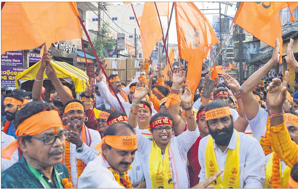
ହିନ୍ଦୁ ନବବର୍ଷ ଅବସରରେ ରୁଧିବାର କଟକ ପିଠାପୁରଠାରୁ ବିଜୁ ଅନୁଷ୍ଠାନ ପକ୍ଷରୁ ବାହାରିଥିବା ଶୋଭାଯାତ୍ରା ।