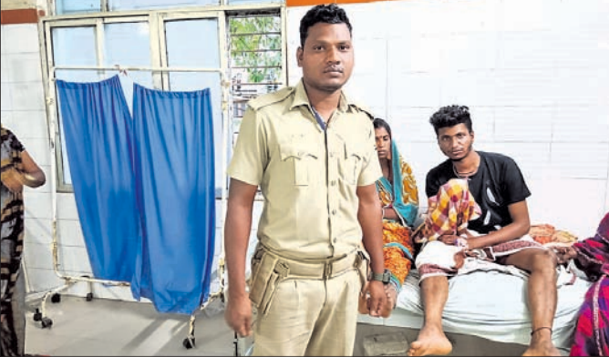
ଅଭିଯୁକ୍ତଙ୍କୁ ଜରିଆ ପୋଲିସ୍