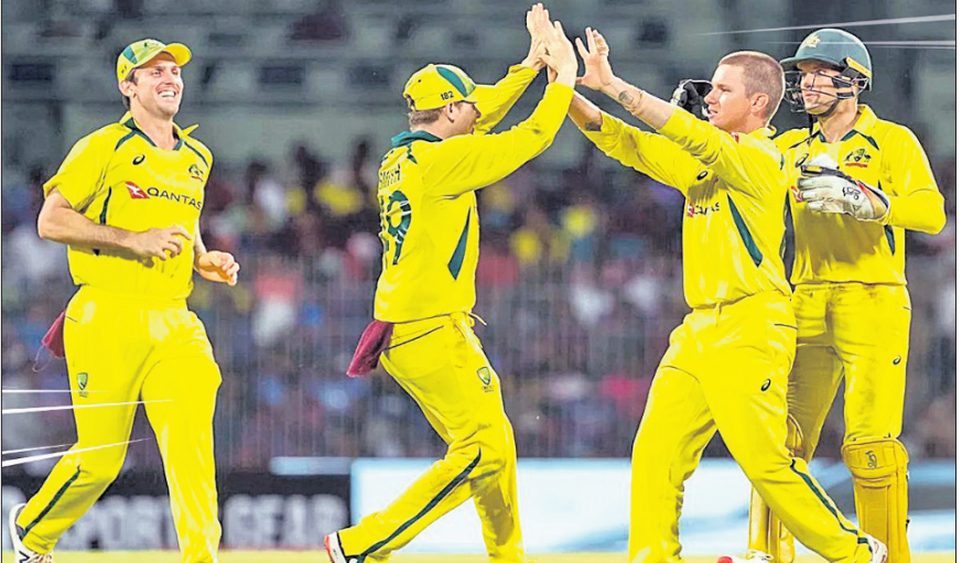
ଉଇକେଟ ନେବା ପରେ ଆତମ ଜାମ୍ପାକୁ ଯାଆ ଖେଳାଳିଙ୍କ ବ୍ୟୟାମ।

ଚେନ୍ନାଇ, ୨୨ମାର୍ଚ୍ଚ ସ୍ଥାନୀୟ ଟେପଲ୍ ଷ୍ଟୁଡିଓମରେ ରୁଧିରାଣୀ ଅଷ୍ଟ୍ରେଲିଆ ଦ୍ୱାରା ପରାସ୍ତ ହେବାର ସମ୍ଭାବନା ଥିବା ବେଳେ ଟେପଲ୍ ଷ୍ଟୁଡିଓମରେ ଶ୍ରୀଲଙ୍କା ଦଳ ୩ ମ୍ୟାଚ ବିଶିଷ୍ଟ ସିରିଜକୁ ୨-୧ରେ ଜିତିବା ସହ ଟେପଲ୍ ସିରିଜ ପରାଜୟର ମଧୁର ପ୍ରତିଶୋଧ ନେଇଛି। ପ୍ରଥମେ ବ୍ୟାଟି କରିଥିବା ଅଷ୍ଟ୍ରେଲିଆ ୪୯ ଓଭରରେ ୨୬୯ ରନ କରି ଅଧିଆରଣ ହୋଇଥିବାବେଳେ ଭାରତ ୪୯.୧ ଓଭରରେ ୨୪୮ ରନ କରି ସମସ୍ତ ଉଇକେଟ ହରାଇଥିଲା।