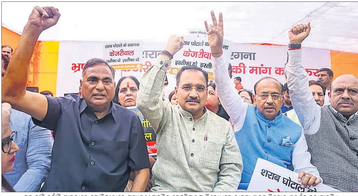
ମଦ ନୀତି ଦୁର୍ଗାଟି ମାମଲାରେ ନୂଆଦିଲ୍ଲୀଠାରେ ମୁଖ୍ୟମନ୍ତ୍ରୀ ଅରବିନ୍ଦ କେଜ୍‌ରିୱାଲଙ୍କ ବିରୋଧରେ ଭାଜପା ପକ୍ଷରୁ ବିରୋଧ ପ୍ରଦର୍ଶନ କରାଯାଇଛି।

ବିଧାନସଭା ଭାବରେ ଶପଥ ଗ୍ରହଣ କରିଥିଲେ ସେତେବେଳେ ରାଜ୍ୟରେ ଦୁଇଟି ସମ୍ପର୍କ ପୂର୍ଣ୍ଣ ଥିଲା, ଗୋଟିଏ କୃଷ୍ଣ କଂଗ୍ରେସର ଏବଂ ଅନ୍ୟଟି ଭାରତର। ଏହା ମୋ ପକ୍ଷରୁ ଏକ ନିର୍ଦ୍ଦେଶ ନିଶ୍ଚୟ ହୋଇପାରେ, କିନ୍ତୁ ଏହା ମୋ ପାଇଁ ଅତ୍ୟନ୍ତ ଭାବପ୍ରବଣ ବିଷୟ। ଅନ୍ୟପକ୍ଷରେ, ନିର୍ବାଚନକୁ ନେଇ ମେହରୁବା କହିଛନ୍ତି, ନିର୍ବାଚନ ନିଶ୍ଚୟ ନିର୍ବାଚନ ଆୟୋଗଙ୍କ ଦ୍ୱାରା ନୁହେଁ ବରଂ ଭାଜପା ଦ୍ୱାରା ନିଆଯିବ। ଭାଜପା ପାଇଁ ପରିସ୍ଥିତି ଅନୁକୂଳ ହେଲେ ସେମାନେ ଏହି ନିର୍ବାଚନ କରିବେ।