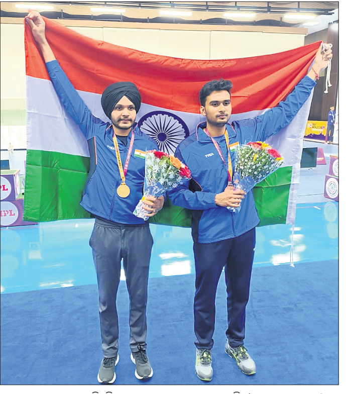
ଆଇସିଏସ୍ ଟାଇଟଲ ବିଜେତା ପଦକ ସହ ସମ୍ମାନିତ କରାଯାଇଛନ୍ତି।

ଭୁବନେଶ୍ୱର, ୨୨ ମାର୍ଚ୍ଚ (ପି.ଟି.) ଆଇଟିଏଫ୍ ଟାଇଟଲ ରାଜ୍ୟରେ ପ୍ରଥମ ପ୍ରବର୍ତ୍ତନ ସହ ବର୍ଷ ଆରମ୍ଭ କରିଛନ୍ତି। ଓଡ଼ିଶାର ପ୍ରଥମ ଶ୍ରେଣୀରେ କବିର ଉତ୍ତୀର୍ଣ୍ଣ ହେବା ଏକ ଐତିହାସିକ କ୍ଷଣ।