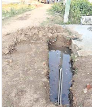
ପାଇପ ଫାଟି ପାଣି ଚାଲୁଥିବା ଭବିଷ୍ୟତ ।

ବିଶ୍ୱ ଜଳ ଦିବସ ବୁଧବାର ପାଳିତ ହୋଇଛି। ଏହି ଦିବସ ପାଳନର ମୁଖ୍ୟ ଉଦ୍ଦେଶ୍ୟ ହେଲା ଜଳର ଅପତୟକୁ ରୋକିବା ଏବଂ ବିଶ୍ୱରୁ ପାଣି ବ୍ୟବହାର କରିବା। କିନ୍ତୁ ଭଞ୍ଜନଗର ସହରରେ ଏହାର ଓଳଟା ଚିତ୍ର ଦେଖିବାକୁ ମିଳିଛି। ସହରରେ ପାନୀୟଜଳ ବନ୍ଧନ ବ୍ୟବସ୍ଥା ଦିଗର କିଛି ମାସ ହେବ ବିପର୍ଯ୍ୟୟ ହୋଇପାରେ। କେଉଁଠି ପାଣି ପାଇପ୍ ଫାଟି ଚାଲୁ ଉପରେ ଭାବୁଛି ତ ଆଉ କେଉଁଠି ଫଟା ପାଇପ ଦେଇ ଡ୍ରେନର ମଲ୍ଲା ପାଣି ସହରକୁ ଆସୁଥିବ। ଏନେଇ ଖୋଦ ଜନସ୍ୱାସ୍ଥ୍ୟ ବିଭାଗ ଯତ୍ନ ଏବଂ ଅନ୍ୟ କର୍ମଚାରୀଙ୍କୁ ମଧ୍ୟ ଜଣାଯାଇଛି। ଏ ନେଇ ସହରବାସିକ