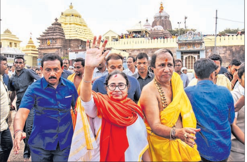
ପଶ୍ଚିମବଙ୍ଗ ମୁଖ୍ୟମନ୍ତ୍ରୀ ମମତା ବାନାର୍ଜୀ ବୁଧବାର ଶ୍ରୀମନ୍ଦିରରେ ମହାପ୍ରଭୁଙ୍କୁ ଦର୍ଶନ କରି ଫେରିଛନ୍ତି।