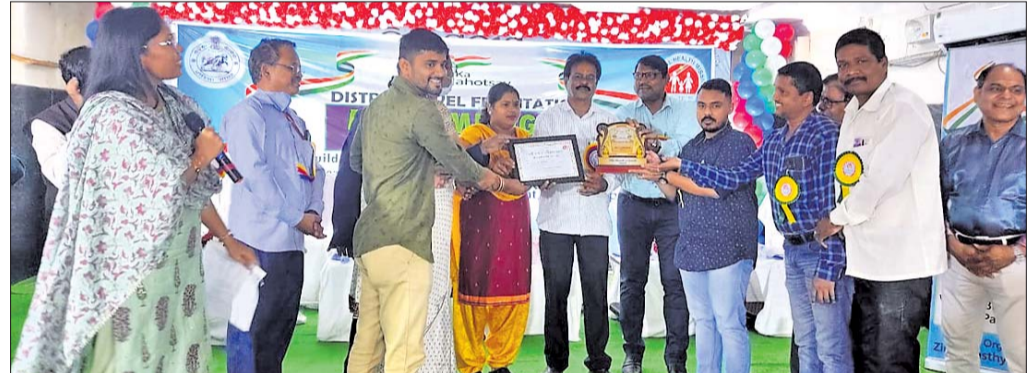
ମେଡିକାଲ ଅଫିସରଙ୍କୁ ପୁରସ୍କାର ପ୍ରଦାନ କରାଯାଇଛି ।