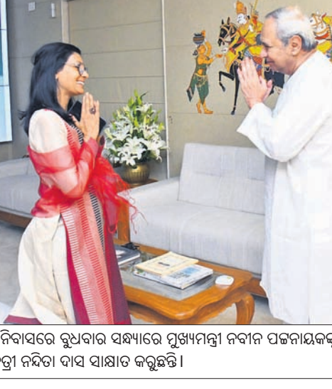
ନବୀନ ନିବାସରେ ବୁଧବାର ସନ୍ଧ୍ୟାରେ ମୁଖ୍ୟମନ୍ତ୍ରୀ ନବୀନ ପଟ୍ଟନାୟକଙ୍କୁ ଅଭିନେତ୍ରୀ ନନ୍ଦିତା ଦାସ ସାକ୍ଷାତ କରୁଛନ୍ତି।

ପ୍ରଖ୍ୟାତ ଅଭିନେତ୍ରୀ ନନ୍ଦିତା ଦାସଙ୍କ ନିର୍ଦ୍ଦେଶିତ ତଥା ଅଭିନେତା କପିଳ ଶର୍ମାଙ୍କ ଅଭିନୀତ 'ଜିଗାଟୋ' ଫିଲ୍ମ ଉପରୁ ରାଜ୍ୟ ସରକାର ପ୍ରମୋଦ କରି ଛାଡ଼ି କରିଛନ୍ତି। ଏ ସଂକ୍ରାନ୍ତୀୟ ପ୍ରସ୍ତାବକୁ ମୁଖ୍ୟମନ୍ତ୍ରୀ ନବୀନ ପଟ୍ଟନାୟକ ଅନୁମୋଦନ କରିଛନ୍ତି। ମୁଖ୍ୟମନ୍ତ୍ରୀ ବୁଧବାର ସନ୍ଧ୍ୟାରେ ନବୀନ ନିବାସଠାରେ ଜିଗାଟୋ ଚଳଚ୍ଚିତ୍ରର ସ୍ୱତନ୍ତ୍ର ଉପସ୍ଥାପନା କାର୍ଯ୍ୟକ୍ରମରେ ଯୋଗଦେଇଛନ୍ତି। ହିନ୍ଦୀଭାଷାରେ ପ୍ରସ୍ତୁତ ଏହି ଫିଲ୍ମଟି ସମ୍ପୂର୍ଣ୍ଣ ଭାବେ ଭୁବନେଶ୍ୱରରେ ହିଁ ଶୁଟି କରାଯାଇଛି। ଅଭିନେତା କପିଳ ଶର୍ମା ଓ ଅଭିନେତ୍ରୀ ସାହାନା ଗୋସ୍ୱାମୀ ଏଥିରେ ପ୍ରମୁଖ ଭୂମିକାରେ ଅଭିନୟ କରିଛନ୍ତି। ସମାଜର ଅତ୍ୟନ୍ତ ସାଧାରଣ ଲୋକଙ୍କ ସଂଘର୍ଷପୂର୍ଣ୍ଣ ଜୀବନକୁ ଏହି ଚଳଚ୍ଚିତ୍ରରେ ସଫଳ ଭାବେ ଉପସ୍ଥାପିତ କରାଯିବା ସହ କଳାତ୍ମକ ଦିଗ ପ୍ରତି ଉଚିତ ଧ୍ୟାନ ଦିଆଯାଇଥିବାରୁ ମୁଖ୍ୟମନ୍ତ୍ରୀ