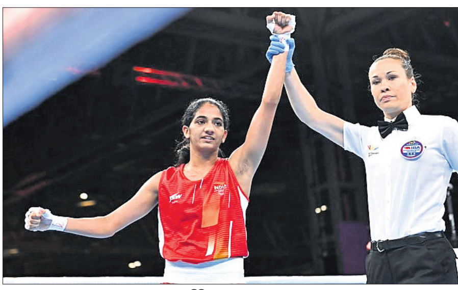
ଫାଇଟ ଜିତିବା ପରେ ନୀତୁ ଘଂଘାଏ।

ଭଲ ଆରମ୍ଭ କରିଥିଲେ ମଧ୍ୟ ତାହାକୁ ବଡ଼ ଷ୍ଟ୍ରିକ୍ଟର ପରିଣତ କରିପାରି ନ ଥିଲେ। ତେବେ ଛୋଟ ଛୋଟ ପାର୍ଟନରସ୍ଥିତ ସହାୟତାରେ ଦଳ ସମ୍ମାନଜନକ ଷ୍ଟ୍ରିକ୍ଟର ଦିଗରେ ଅଗ୍ରସର ହୋଇଥିଲା। ତେବେ ନିୟମିତ ବ୍ୟବଧାନରେ ଉଇକେଟ ପଡ଼ି ଯୋଗୁ ଉପକ୍ରମକାରୀ ଦଳ ୪୯ ଓଭରରେ ୨୬୯ ରନ କରି ଅଧିଆରଣ ହୋଇ ଯାଇଥିଲା। ମିଟେଲ ମାର୍ଶ ଦଳ ପକ୍ଷରୁ ସର୍ବଧିକ ୪୭, ଆଲେକ୍ସ କାରେ ୩୮, ମାର୍ଣସ ଲାହୁସେନ ୨୮, ସିଅନ ଆବଟ ୨୭, ମାର୍ଣସ୍ ଷ୍ଟ୍ରିକ୍ଟର ୨୫ ଓ ଡେଭିଡ୍ ଖ୍ରେନ ୨୩ ରନର ଉପଯୋଗୀ ଅବଦାନ ରଖିଥିଲେ। ଭାରତ ପକ୍ଷରୁ ହାର୍ଦ୍ଦିକ ପାଖାପାଖି ୩୨, ରୋହିତ ଶର୍ମା-୩୦, ଆତମ ଜାମ୍ପା-୪/୪୫, ଅକ୍ଷର ଅଗର-୨/୪୧, ସିଅନ ଆବଟ-୧/୫୦, ମାର୍ଣସ୍ ଷ୍ଟ୍ରିକ୍ଟର-୧/୪୩।