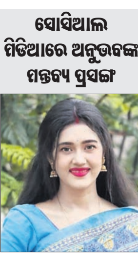
ସୋସିଆଲ ନିତିଆରେ ଅନୁଭବ ମତ୍ତବ୍ୟ ପ୍ରସଙ୍ଗ