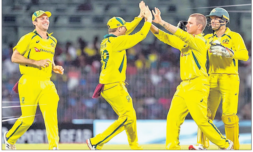
ଉଇକେଟ ନେବା ପରେ ଆତାମ ଜାମ୍ପାକୁ ଯାଆ ଖେଳାଳିଙ୍କ ବଧୂଳା।

ଚେନ୍ନାଇ, ୨୨ମାର୍ଚ୍ଚ ସ୍ଥାନୀୟ ଟେପଲ୍ ଷ୍ଟୁଡିଓରେ କୁସୁବାର ଅନୁଷ୍ଠିତ ହୁଡ଼ାୟ ତଥା ଅନ୍ଧିମ ଦିନିକିଆ କ୍ରିକେଟ ମ୍ୟାଚରେ ଅଷ୍ଟ୍ରେଲିଆ ୨୧ ରନରେ ଭାରତକୁ ପରାସ୍ତ କରିଛି। ଏଥିସହ ଭ୍ରମଣକାରୀ ଦଳ ୩ ମ୍ୟାଚ ବିଶିଷ୍ଟ ସିରିଜକୁ ୨-୧ରେ ଜିତିବା ସହ ଚେଷ୍ଟା ସିରିଜ ପରାଜୟର ମଧୁର ପ୍ରତିଶୋଧ ନେଇଛି। ପ୍ରଥମେ ବ୍ୟାଟି କରିଥିବା ଅଷ୍ଟ୍ରେଲିଆ ୪୯ ଓଭରରେ ୨୬୯ ରନକରି ଅଧିଆରଣ ହୋଇଥିବାବେଳେ ଭାରତ ୪୯.୧ ଓଭରରେ ୨୪୮ ରନକରି ସମସ୍ତ ଉଇକେଟ ହରାଇଥିଲା।