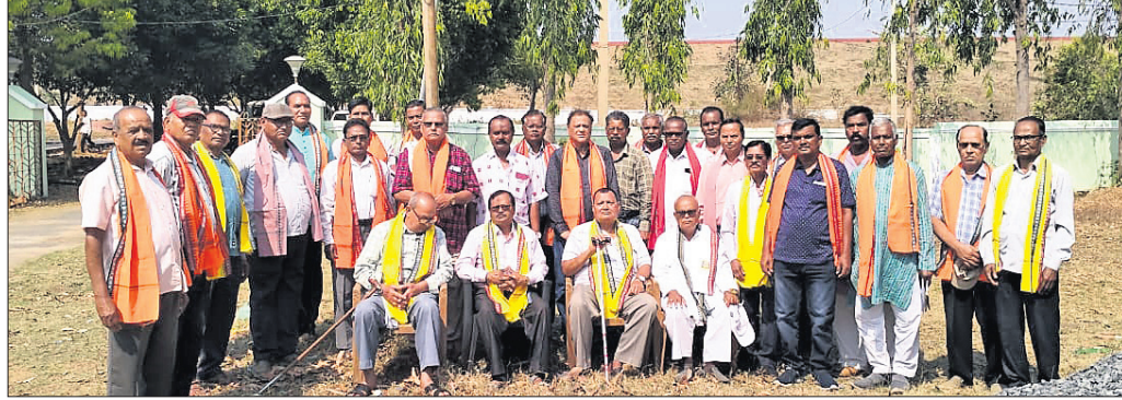
ବୈଠକରେ ଉପସ୍ଥିତ ଅବସରପ୍ରାପ୍ତ କର୍ମଚାରୀମାନେ।