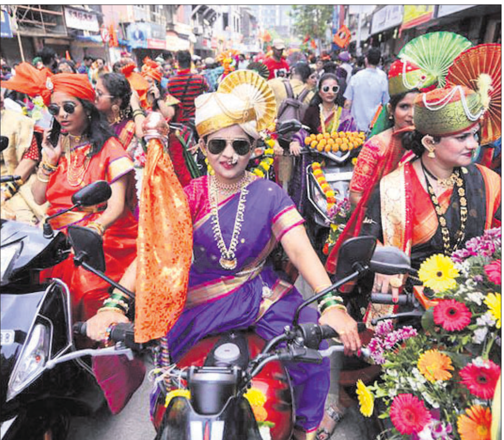
ମହାରାଷ୍ଟ୍ର ନବବର୍ଷ ଆରମ୍ଭରେ ବୁଧବାର ମୁମ୍ବାଇରେ ଆୟୋଜିତ ରୁଡ୍ ପଡ଼ିଆ ଉତ୍ସବରେ ମହିଳାମାନେ ପାରମ୍ପରିକ ପୋଷାକରେ ଶୋଭାଯାତ୍ରାରେ ବାହାରିଛନ୍ତି।