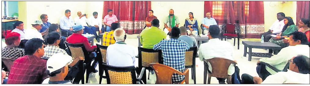
ବୈଠକରେ ଜନପ୍ରତିନିଧି, ପ୍ରଶାସନିକ ଅଧିକାରୀଙ୍କ ସହ ଅନ୍ୟମାନେ।