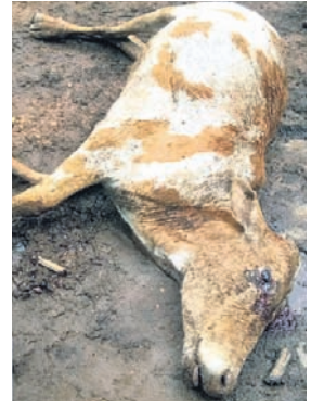
ବାଘ ଖାଇଥିବା ମୃତ ବାଛୁରି ।