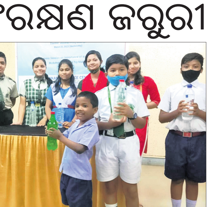
ବିଶ୍ୱ ଜଳ ଦିବସରେ ଛାତ୍ରଛାତ୍ରୀମାନେ ।

ଗଞ୍ଜ କାଟି ଲଣ୍ଡା କରିଦେଲେଣି । ଦେଶାନ୍ତ ନିଜ ଓଡ଼ିଆପଢ଼ା ବୁକ ଉଦ୍‌ଘାଟନ କୃଷି ସମବାୟ ସମିତି ଆନୁକୁଲ୍ୟରେ ରୁଧିରା ଚଳାଉଥିବା ଅନୁଷ୍ଠାନକୁ ଆହ୍ୱାନ କରିଛନ୍ତି ।