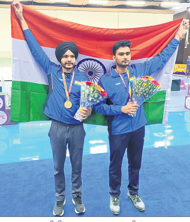
ଆଇସିସି ଦିନିକିଆ ବୋଲର ରାଜ୍ୟରେ ପ୍ରଥମ ସ୍ଥାନକୁ ଖସିଛନ୍ତି ।

ବିପକ୍ଷ ଦିନିକିଆ ସିରିଜକୁ ବାଦ ପଡ଼ିଥିବା ହେତୁ ଆଇସିସି ଦିନିକିଆ ବୋଲର ରାଜ୍ୟରେ ପ୍ରଥମ ସ୍ଥାନକୁ ଖସିଛନ୍ତି ।