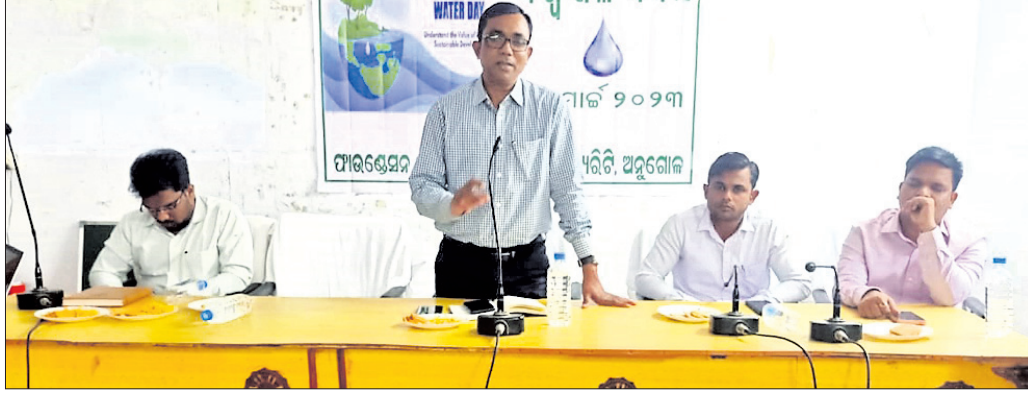
କାର୍ଯ୍ୟକ୍ରମରେ ମହାଧୀନ ଅତିଥିମାନେ।

ଆଠମାଲିକ, ୨୨୩ (ଡି.ଏନ.ଏ.) ଆଠମାଲିକ ପଞ୍ଚାୟତ ସମିତି କାର୍ଯ୍ୟାଳୟ, ନିକଟସ୍ଥ ସତ୍ୟଗୁହରେ ବିଶ୍ୱ ଜଳ ଦିବସ ଉପଲକ୍ଷେ ଏକ ବୈଠକ ଅନୁଷ୍ଠିତ ହୋଇଯାଇଛି। ପାଞ୍ଚୋଟିୟ ଫର ଇକୋଲୋଜିକାଲ ସିକ୍ୟୁରିଟି ଅନୁଗୋଳ ଓ ଉପଖଣ୍ଡ ପ୍ରଶାସନ ମିଳିତ ଆନୁକୂଲ୍ୟରେ ଅନୁଷ୍ଠିତ ଉକ୍ତ ବୈଠକରେ ମୁଖ୍ୟ ଅତିଥି