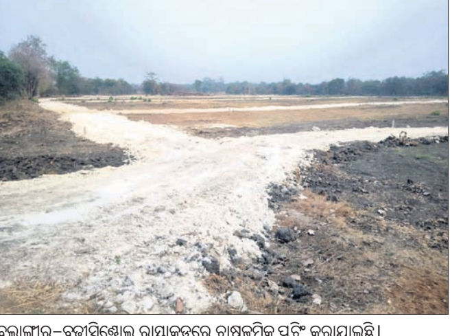
ବଲାଙ୍ଗୀର-ବୁଢ଼ାସିଂହା ରାସ୍ତାକଡ଼ରେ ଚାଷଜମିକୁ ପୁଟି କରାଯାଇଛି।

■ ବଲାଙ୍ଗୀର, ପୁରୀ, ଲୋକସିଂହା ତହସିଲ ଅଧିକର ବଡ଼ଧରଣର କାରବାର ■ ଅନୁସୂଚିତ ବର୍ଗଙ୍କ ଜମି ହତୁପ କରୁଛନ୍ତି ଧନୀଦଲାଲ, ଜମି ଦଲାଲ ■ ଓରେରା ନିୟମକୁ ଅଣବେଶା କରି ଚାଲିଛି କାରବାର ଖାଲି ପୁଖ୍ୟରାସ୍ତା ରୁହେଁ ଖୁବେକମ୍ପାଲି, ଆଚରୀ, ଭୁବନେଶ୍ୱର, ଖାରପାଲି, ବୁଢ଼ାସିଂହା, ବିଲେଇସର୍ତ୍ତ, ବନ୍ଦୁଗାଡ଼ି, ବୈଦିପାଲି, ଶିବତଳା ରାସ୍ତାପାର୍ଶ୍ୱରେ ଥିବା ଜମି କିଣାବିକା ସରିଯାଇଛି। ସହର ଚାରିପଟେ ଜମି ଭିତରେ ପୁଟି କରାଯାଇ ପୁର୍ ଫର୍ ସେଲ୍‌ର ବୋର୍ଡ୍ ଏବଂ ଲେଖା ଲଗାଯାଇଛି। ଏହି ଜମି କାରବାରରେ ବଲାଙ୍ଗୀର, ପୁରୀ ଏବଂ ଲୋକସିଂହା ତହସିଲ ଅଧିକର ଅଧିକାରୀ ଏବଂ କର୍ମଚାରୀଙ୍କ ସମ୍ପୃକ୍ତି ରହିଛି। ଏଥିରେ କୋଟି କୋଟି ଟଙ୍କାର କାରବାର ହେଉଛି। ଜମି ଦଲାଲଙ୍କଠାରୁ କମିଶନ୍ ନେଇ ଏହି ଅଧିକାରୀ ଏବଂ ଚଳୁଛି-୪