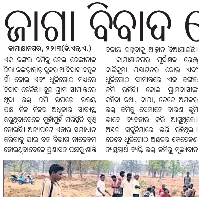
ବିବାଦୀ ଜଙ୍ଗଲ ଜମିରେ ପୋଖରୀ ଖନନକୁ ବିରୋଧ କରି କୋଇ ଗ୍ରାମବାସୀ ଏକାଠି ହୋଇଛନ୍ତି ।