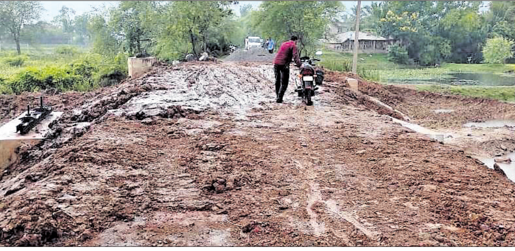
ମହାନଦୀକୂଳରୁ କରାଯାଇଥିବା ରାସ୍ତା କାର୍ଯ୍ୟରେ ଭର୍ତ୍ତି।

କେନ୍ଦ୍ରାପଡ଼ା ଜିଲ୍ଲାରେ ଶୀଘ୍ର ଧର୍ମ ପରିଚାଳନା ଉପରେ ଗୁରୁତ୍ୱ ଦେବାକୁ ନିର୍ଦ୍ଦେଶ ଦିଆଯାଇଛି... ଗୁରୁତ୍ୱ ଦେବାକୁ ନିର୍ଦ୍ଦେଶ ଦିଆଯାଇଛି