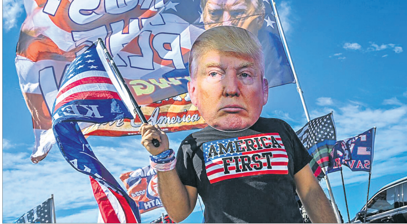
ଆମେରିକାର ପୂର୍ବତନ ରାଷ୍ଟ୍ରପତି ଡୋନାଲ୍ଡ ଟ୍ରମ୍ପଙ୍କ ସମାବ୍ୟ ଗିରଫଦାରି ପୂର୍ବରୁ ଫ୍ଲୋରିଡା ପାଫ୍ ବିସ୍ମିତ ମାର୍-ଏ-ଲାରୋ କ୍ଲବ୍ ନିକଟରେ ତାଙ୍କ ସମର୍ଥକଙ୍କ ବିଶୋଭ।

ବେଲାର, ୨୨୩: ଚାମିଲନାଡୁର କାଷ୍ଠପୁରମ୍ ନିଲା ପାଲାର ନଦୀକୂଳ ନିକଟ କୃତ୍ରିମଭାଗରେ ଥିବା ଏକ ଘରୋଇ ବାଣି ଫ୍ୟାକ୍ଟିରେ ବିଚ୍ଛାରଣ ଘଟିଛି। ଏଥିରେ ୮ ଜଣଙ୍କ ମୃତ୍ୟୁ ଘଟିଥିବାବେଳେ ଅନେକ ଆହତ ହୋଇଛନ୍ତି। ରୁଧିର ସକାଳେ ଉଲ୍ଲ କାରଖାନାରେ ପ୍ରାୟ ୨୫ ଶ୍ରମିକ କାମ କରୁଥିଲେ। ସେମାନେ ବାଣି ଫ୍ୟାକ୍ଟିର ପାଇଁ ଆବଶ୍ୟକ କାଷ୍ଠମାଲକୁ ଖରାରେ ଶୁଖାଇଥିଲେ। ପୂର୍ବାହ୍ନ ୧୧ଟାରେ ଗାଁ ଲୋକେ ହଠାତ୍ ବିଚ୍ଛାରଣର ଶବ୍ଦ ଶୁଣି ପାଡ଼ିତମାନଙ୍କୁ ସାହାଯ୍ୟ କରିବାକୁ ଧାଇଥିଲେ। ୨୦ ଜଣ ଉଦ୍ଧାରକାରୀ ଘଟଣାସ୍ଥଳକୁ ଯାଇ ଉଦ୍ଧାର କାର୍ଯ୍ୟ ଆରମ୍ଭ କରିଥିଲେ। ୩ ମିନିଟ୍ କାଳ ସମେତ ୮ ଜଣଙ୍କ ମୃତଦେହ ଠାବ ହୋଇଛି। ୧୩ ଆହତଙ୍କୁ ବିଭିନ୍ନ ହସ୍ପିଟାଲରେ ଭର୍ତ୍ତି କରାଯାଇଛି। ମୃତ୍ୟୁସଂଖ୍ୟା ବଢ଼ିବା ଆଶଙ୍କା କରାଯାଉଛି।