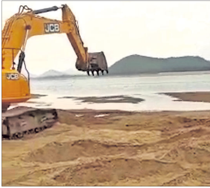
ପ୍ରକଳ୍ପ ପାଇଁ ଜିଏଚ୍‌ସି ଉଦ୍ୟମ ଚାଲିଛି ।

ସହରକୁ ପାଣି ଯୋଗାଇବାକୁ ହେଲେ ପାଣିପିନ୍ଧି ପାଇଁ ପ୍ରକଳ୍ପ ପାଇଁ ଜିଏଚ୍‌ସି ଉଦ୍ୟମ ଚାଲିଛି ।