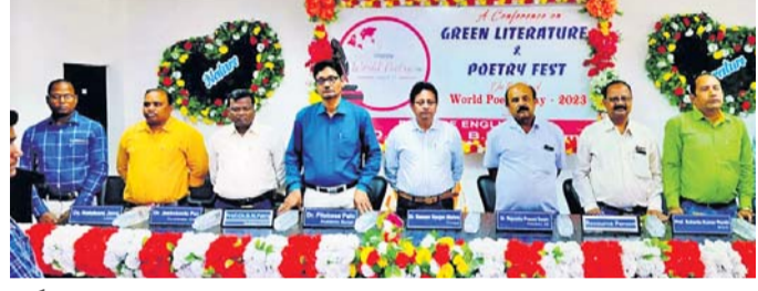
କର୍ମଶାଳାରେ ଉପସ୍ଥିତ ଅତିଥି ବୃନ୍ଦ ।