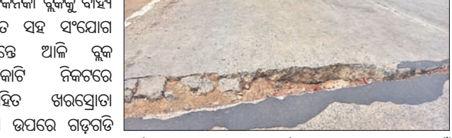
ଯାତାୟତରେ ଲୋକେ ହତ୍ତବସ୍ତ