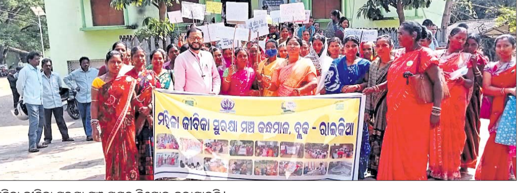
ମହିଳା ଜାବିକା ସୁରକ୍ଷା ମଞ୍ଚ ପକ୍ଷରୁ ବିକ୍ଷୋଭ କରାଯାଇଛି ।

ରାଜନିଆ, ୨୨୩(ଡି.ଏନ.ଏ.) କରମାଳ ଜିଲା ରାଜନିଆ ଜାବିକା ସୁରକ୍ଷା ମଞ୍ଚ ତରଫରୁ ବୁଧବାର ବିଷ୍ଣୁ ଜଳ ଦିବସ ଅବସରରେ ବିଶୁଦ୍ଧ ପାନୀୟ ଜଳ ଯୋଗାଣ ଓ ଶିଶୁ, କିଶୋର, ବାଳିକା, ପ୍ରସୂତି ମହିଳାଙ୍କ ସୁରକ୍ଷା ଅଧିକାରକୁ ସୁନିଶ୍ଚିତ କରିବା ପାଇଁ ମୁଖ୍ୟମନ୍ତ୍ରୀଙ୍କ ଉଦ୍ଦେଶ୍ୟରେ ଦାବିପତ୍ର ଓ ରାଲି ଅନୁଷ୍ଠିତ ହୋଇଯାଇଛି ।