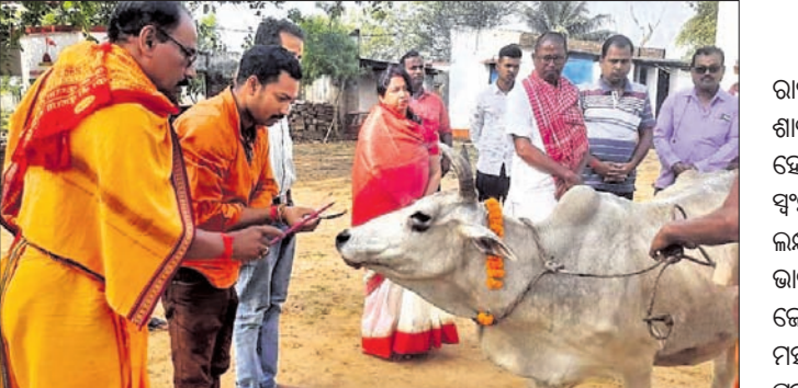
ହିନ୍ଦୁ ନବବର୍ଷ ଉପଲକ୍ଷେ ଗୋପୂଜନ କରାଯାଇଛି।

କେନ୍ଦ୍ରାପଡ଼ା ଜିଲ୍ଲାର ସାମାଜିକ ଓ ସଂସ୍କୃତିକ ଅନୁଷ୍ଠାନ ଜୟରାଷ୍ଟ୍ର ପକ୍ଷରୁ ସୃଷ୍ଟି ଆରମ୍ଭ ଦିବସ ଓ ହିନ୍ଦୁ ନବବର୍ଷ