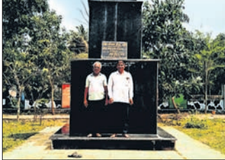
ରାଜକନିକା, ୨୨୩୩ (ଡି.ଏନ.ଏ.): ରାଜକନିକା କୁଳର କର୍ତ୍ତୃତ୍ୱରେ ପ୍ରତିଷ୍ଠା କରାଯାଇଥିବା ବିଜୁ ସ୍ମାର୍ତ ପାର୍କର

କେନ୍ଦ୍ରାପଡ଼ା କୁଳ ଗୁଳନଗର ପଞ୍ଚାୟତ ଗୋପାଳାୟତ ପାଟଣା ନୋକାରେ କେନ୍ଦ୍ରାପଡ଼ା ପୌରସଂସ୍ଥା