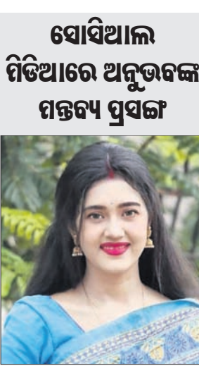
ସୋସିଆଲ ନିତିଆରେ ଅନୁଭବଙ୍କ ମତ୍ତବ୍ୟ ପ୍ରସଙ୍ଗ