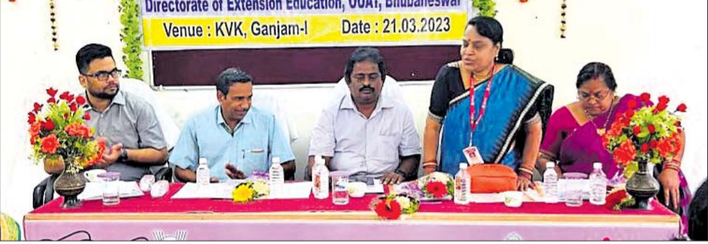
ବୈଠକରେ ଉପସ୍ଥିତ ଅତିଥିମାନେ ।

ଭଞ୍ଜନଗର, ୨୨୩(ଡି.ଏନ.ଏ) ଭଞ୍ଜନଗର କୃଷି ବିଜ୍ଞାନ କେନ୍ଦ୍ର ଏବଂ ଓୟୁଏଚିର ମିଳିତ ସହଯୋଗରେ ମଙ୍ଗଳବାର ସ୍ଥାନୀୟ କୃଷି ବିଜ୍ଞାନ କେନ୍ଦ୍ର ପରିସରରେ ଲିଙ୍ଗଭିତ୍ତିକ ସମାନତା ଉପରେ ଏକ କର୍ମଶାଳା ଅନୁଷ୍ଠିତ ହୋଇଥିଲା ।