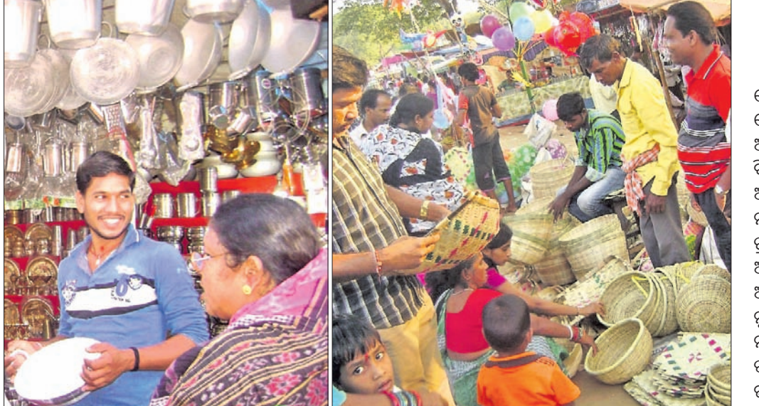
ମେଳାରେ ଲୋକମାନେ ଘରକରଣା ସାମଗ୍ରୀ କିଣୁଛନ୍ତି।