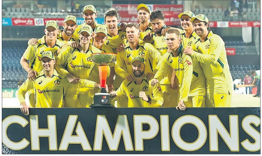
ପ୍ରଥମ ସହ ଅଷ୍ଟ୍ରେଲିଆ ଦଳ।

ଚେନାଇ, ୨୨ମାର୍ଚ୍ଚ ସ୍ଥାନୀୟ ଟେପ୍ ଷ୍ଟୁଡିଓରେ କ୍ରୀଡ଼ା ଖବର ପ୍ରକାଶ କରିବା ପାଇଁ ଉଦ୍ଦିଷ୍ଟ ଅଟେ ଏହି ପତ୍ରିକା ପତ୍ରଟିର ମୁଦ୍ରିତ ସମସ୍ତ ସମ୍ପାଦକ କାର୍ଯ୍ୟକ୍ରମ ପ୍ରକାଶକ ଶ୍ରୀ କାମାକ୍ଷୀ ଚନ୍ଦ୍ର ପ୍ରକାଶନ ପ୍ରାଇଭେଟ ଲିମିଟେଡ୍, ଚେନାଇ ୨୨୦୦୧୫, ଇଣ୍ଡିଆ