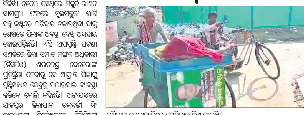
ମହିଳାଙ୍କୁ ଠେଙ୍ଗାଗାଡ଼ିରେ ମେଡିକାଲ ନିଆଯାଉଛି।