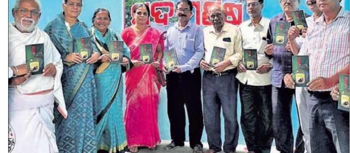
ମଦ ମଣିଷ ପୁସ୍ତକର ଅତିଥିମାନେ ଉନ୍ମୋଚନ କରୁଛନ୍ତି ।

ନୟାଗଡ଼ ଦର୍ପଣ ପବ୍ଲିକେଶନର ନୂତନ କାର୍ଯ୍ୟାଳୟ ମଙ୍ଗଳବାର ଦର୍ପଣ କ୍ୟାମ୍ପସରେ ଉଦ୍‌ଘାଟିତ ହୋଇଯାଇଛି ।