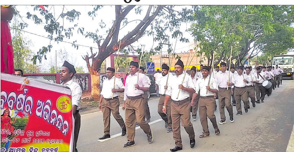
ଆରବସ୍ୱର୍ଣ୍ଣ କର୍ମମାନେ ଶୋଭାଯାତ୍ରାରେ ଯାଉଛନ୍ତି ।

ରାଷ୍ଟ୍ରୀୟ ହିନ୍ଦୁ ନବବର୍ଷ ପାଳନ ଅବସରରେ ଖଣ୍ଡପଡ଼ା ସରସ୍ୱତୀ ଶିଶୁ ମନ୍ଦିରର ଛାତ୍ରାଛାତ୍ରମାନେ ଏକ ଶୋଭାଯାତ୍ରାରେ ସହର ପରିକ୍ରମା କରି ସହରବାସୀଙ୍କୁ ଶୁଭେଚ୍ଛା ଜଣାଇଥିଲେ ।