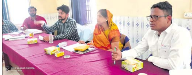
କାର୍ଯ୍ୟକ୍ରମ ବୈଠକରେ ଆଲୋଚନା କରାଯାଇଛି ।

କରିବାକୁ କାର୍ଯ୍ୟକ୍ରମରେ ଦାବି କରିଥିଲେ । ଭେଣ୍ଟି ଜୋନ ପାଇଥିବା ବାବାନାମାନେ ୧୫ ହକ୍ତାର ବଦଳରେ ୧୦ ହକ୍ତାର ଟଙ୍କା ଡିପୋଜିଟ କରିବାକୁ ଆଲୋଚନା ହୋଇଥିଲା ।