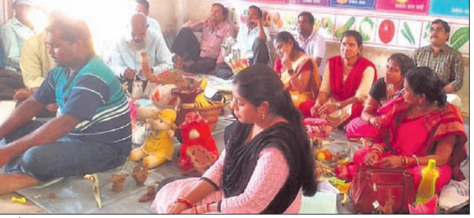
କର୍ମଶାଳାରେ ଶିକ୍ଷୟିତ୍ରୀଶିକ୍ଷକମାନେ କଣ୍ଠେଇ ପ୍ରସ୍ତୁତ କରୁଛନ୍ତି।

ରାଜକନିକାରେ ଭାରତୀୟ ଷ୍ଟେଟ୍ ବ୍ୟାଙ୍କ ଶାଖାରେ ରଣ ମେଳା ଅନୁଷ୍ଠିତ ହୋଇପାରିବ