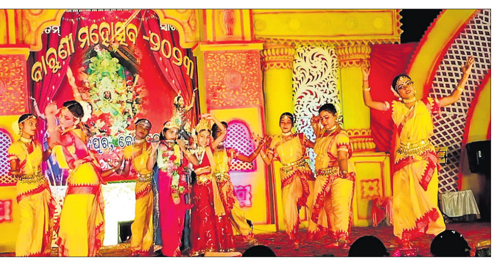
ମହୋତ୍ସବର କଳାକାରମାନଙ୍କ ଦ୍ୱାରା ନୃତ୍ୟ ପରିବେଷଣ କରାଯାଇଛି।

କେନ୍ଦ୍ରାପଡ଼ା ଜିଲ୍ଲାର ପ୍ରସିଦ୍ଧ ବାଉଁଶୀ ଯାତ୍ରା କେନ୍ଦ୍ରାପଡ଼ା କୁଳ ଅଧୀନ ଲକ୍ଷ୍ମୀପୁରରେ ଆରମ୍ଭ ହୋଇଛି। ଏହି