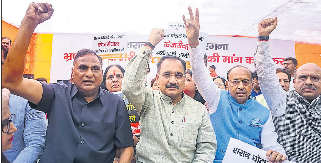
ମତ ନୀତି ଦୁର୍ଗତି ମାମଲାରେ ନୂଆଦିଲ୍ଲୀରେ ମୁଖ୍ୟମନ୍ତ୍ରୀ ଅରବିନ୍ଦ କେଜ୍ରିୱାଲଙ୍କ ବିରୋଧରେ ଭାଜପା ପକ୍ଷରୁ ବିରୋଧ ପ୍ରଦର୍ଶନ କରାଯାଇଛି।