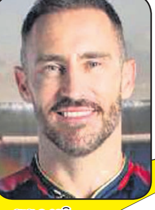
ଫାଟ୍ ଡୁ ଟ୍ରେସି