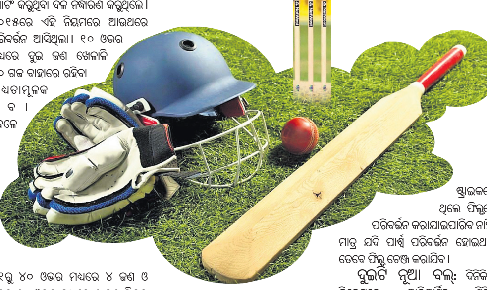
ଷ୍ଟାଇଲରେ ଥିଲେ ପିଲ୍ଲୁର