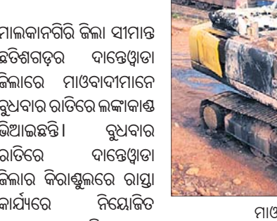
ମାଓବାଦୀମାନେ ପୋଡ଼ିଥିବା ପ୍ରୋକ୍ଲିନ ।

ମାଲକାନଗିରି ଜିଲ୍ଲା ସୀମାନ୍ତ ଛତିଶଗଡ଼ର ଦାନ୍ତେଓଡ଼ା ଜିଲ୍ଲାରେ ମାଓବାଦୀମାନେ ରୁଧିରାତୀର ଗାଡ଼ିରେ ଲୋକାକାଣ୍ଡ ଭିଆଇଛନ୍ତି । ଗୁରୁବାର ରାତିରେ ଦାନ୍ତେଓଡ଼ା ଜିଲ୍ଲାର କିରାଣ୍ଡୁଲରେ ରାସ୍ତା କାର୍ଯ୍ୟରେ ନିୟୋଜିତ ଏକ ପୋକ୍ଲିନ ଓ ବଟେଲିରେ ଗୋଟିଏ ଟ୍ରକ୍ ପୋଡ଼ି ଦେଇଛନ୍ତି । ମାଓବାଦୀମାନେ ସେଠାରେ ପୋଷ୍ଟର ଛାଡ଼ି ଦେଇଛନ୍ତି । ସେଥିରେ ସେମାନେ ସ୍ୱରାଷ୍ଟ୍ର ମନ୍ତ୍ରୀଙ୍କ ଛତିଶଗଡ଼ ଗସ୍ତକୁ ବିରୋଧ କରୁଥିବା ଦର୍ଶାଇଛନ୍ତି । ଏଥିସହ ବିଭିନ୍ନ ଅଞ୍ଚଳରେ ସଭାସମିତି କରି ଉଭୟ କେନ୍ଦ୍ର ଓ ରାଜ୍ୟ ସରକାରଙ୍କୁ ସହଯୋଗ ନ କରିବା ପାଇଁ ଲୋକଙ୍କୁ ପ୍ରବର୍ତ୍ତାଉଥିବା ଜଣାପଡ଼ିଛି ।