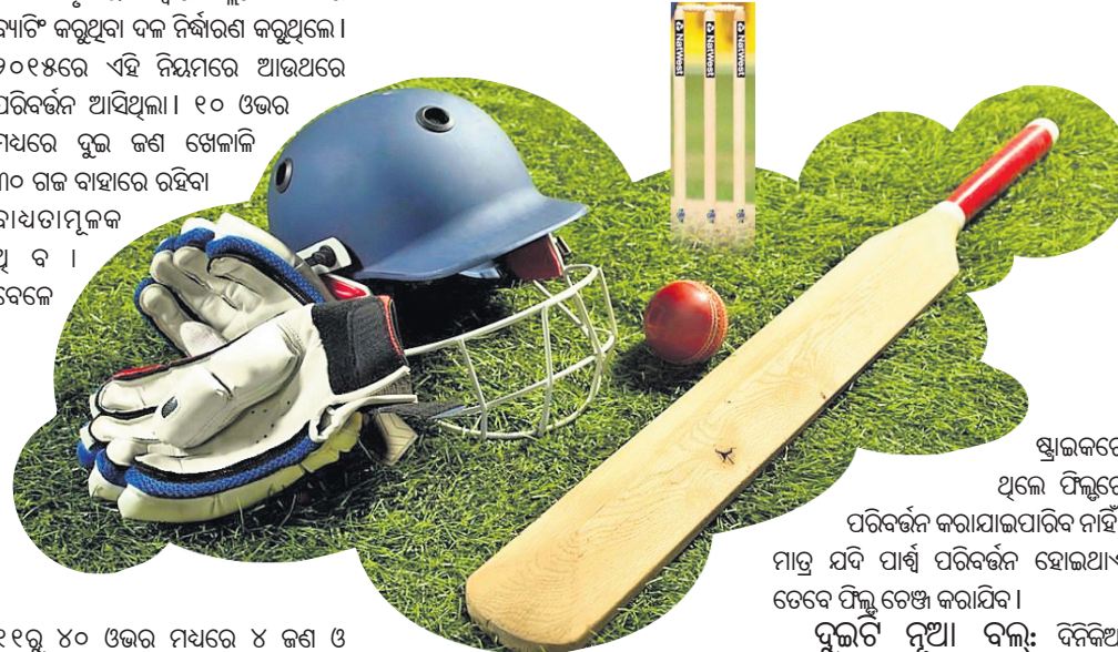
ଷ୍ଟାଇଲରେ ଥିଲେ ପିଲ୍ଲୁର