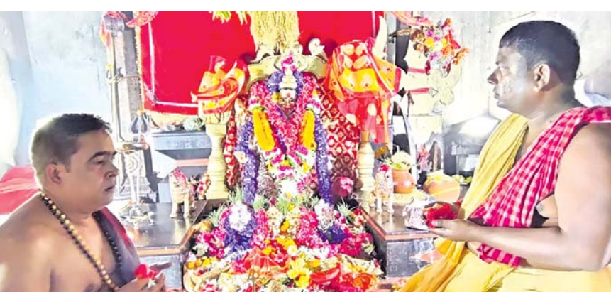
ମୁଖ୍ୟ ପୁରୋହିତ ମା' ତାରାତାରିଣୀଙ୍କୁ ପୂଜାର୍ଚନା କରୁଛନ୍ତି।