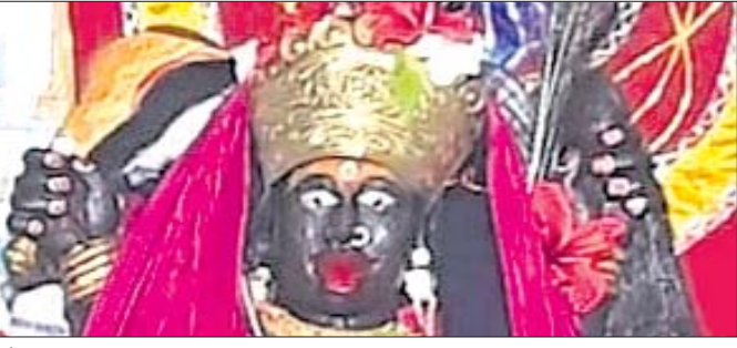
ମା' ଚାମୁଣ୍ଡା ।