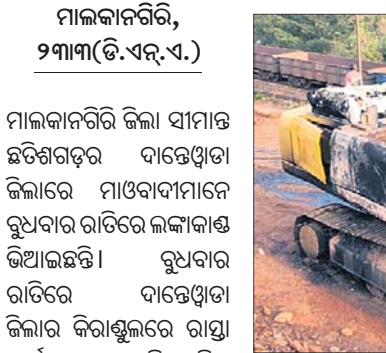
ମାଓବାଦୀମାନେ ପୋଡ଼ିଥିବା ପୋକ୍ଲିନ ।

ଭୁବନେଶ୍ୱରରେ ମେଟ୍ରୋ ରେଲ୍ ପ୍ରକଳ୍ପ ଲାଗି ଓଡ଼ିଶା ସରକାରଙ୍କ ତରଫରୁ କୌଣସି ପ୍ରସ୍ତାବ ମିଳି ନ ଥିବା କେନ୍ଦ୍ର ଗୃହନିର୍ମାଣ ଓ ସହରାଞ୍ଚଳ ବ୍ୟାପାର ମନ୍ତ୍ରାଳୟ ପକ୍ଷରୁ କୁହାଯାଇଛି ।