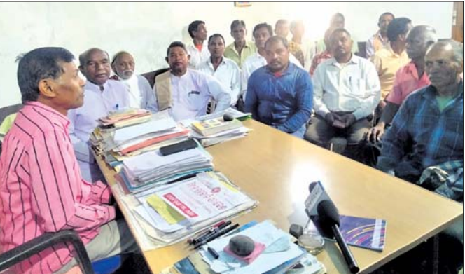
ଖବରଦାତା ସମ୍ମିଳନୀରେ ସଂଘ କର୍ମକର୍ତ୍ତା ।

ଆସକା ୨୪ରେ ଭୁବନେଶ୍ୱରରେ ଓଡ଼ିଶା ଜନଜାତି ସୁରକ୍ଷାମଣ୍ଡଳ ପକ୍ଷରୁ ଏକ ବିଶାଳ ସମାବେଶ ହେବାକୁ ଯାଉଛି । ଏଥିରେ ପ୍ରାୟ ୧୦୦୦ ପକ୍ଷରୁ ବିଭିନ୍ନ ସ୍ଥାନରେ ପୋଷ୍ଟର ଲଗାଯାଇଛି । ଏଥିରେ ଓଡ଼ିଶାର ଧର୍ମାନ୍ତରାତଳ ଜନଜାତି ସଂରକ୍ଷଣରୁ ବାଦ ଦେବା ଦାବି ବୋଲି ଲେଖାଯାଇଛି । ଏହି ସଂଗଠନ ଏବଂ ଏହାର କର୍ମକର୍ତ୍ତାଙ୍କୁ ଓଡ଼ିଶା ଆଦିବାସୀ ସମନ୍ୱୟ ସମିତି କନ୍ୟାମାନଙ୍କୁ ବିରୋଧ କରିଛି । ଆଦିବାସୀଙ୍କ ମଧ୍ୟରେ ଶତ୍ରୁତା, ଲଢ଼େଇ କରିବାକୁ ଏଭଳି ହାନି ପ୍ରୟାସ କରାଯାଉଛି ବୋଲି ସଂଘ କର୍ମକର୍ତ୍ତା କହିବା ସହ ଅନୁଷ୍ଠିତ ହେବାକୁ ଥିବା ସମାବେଶରେ କେହି ଯୋଗ ନ ଦେବାକୁ କହିଛନ୍ତି । ଓଡ଼ିଶା ଆଦିବାସୀ ସମନ୍ୱୟ ସମିତି କନ୍ୟାମାନଙ୍କୁ ଶାଖା ସଂଘ ପକ୍ଷରୁ ଗୁରୁବାର ଅଧିକାଂଶ ଖବରଦାତା ସମ୍ମିଳନୀରେ ସଂଘ କର୍ମକର୍ତ୍ତା ।