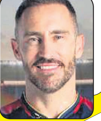
ଫାଟ୍ ଟୁ ଟୁ