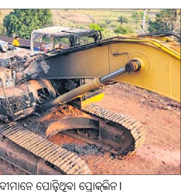
ମାଓବାଦୀମାନେ ପୋଡ଼ିଥିବା ପ୍ରୋକ୍ଲିନ ।

ମାଲକାନଗିରି ଜିଲ୍ଲା ସାମାନ୍ତ ଛତିଶଗଡ଼ର ଦାନ୍ତେଓଡ଼ା ଜିଲ୍ଲାରେ ମାଓବାଦୀମାନେ ରୁଧିରାତୀର ଗଣାକାଣ୍ଡ କିଆଇଛନ୍ତି । ଗୁରୁବାର ରାତିରେ ଦାନ୍ତେଓଡ଼ା ଜିଲ୍ଲାର କିରାଣ୍ଡୁଲରେ ରାସ୍ତା କାର୍ଯ୍ୟରେ ନିୟୋଜିତ ଏକ ପୋକ୍ଲିନ ଓ ବଟେଲିରେ ଗୋଟିଏ ଟ୍ରକ୍ ପୋଡି ଦେଇଛନ୍ତି । ମାଓବାଦୀମାନେ ସେଠାରେ ପୋଷ୍ଟର ଛାଡ଼ି ରଖିଛନ୍ତି । ସେଥିରେ ସେମାନେ ସ୍ୱରାଷ୍ଟ୍ର ମନ୍ତ୍ରୀଙ୍କ ଛତିଶଗଡ଼ ଗସ୍ତକୁ ବିରୋଧ କରୁଥିବା ଦର୍ଶାଇଛନ୍ତି । ଏଥିସହ ବିଭିନ୍ନ ଅଞ୍ଚଳରେ ସଭାସମିତି କରି ଉଭୟ କେନ୍ଦ୍ର ଓ ରାଜ୍ୟ ସରକାରଙ୍କୁ ସହଯୋଗ ନ କରିବା ପାଇଁ ଲୋକଙ୍କୁ ପ୍ରବର୍ତ୍ତାଇଥିବା ଜଣାପଡିଛି ।