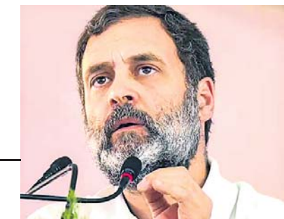
ସତ୍ୟ ଓ ଅହିଂସା ଉପରେ ମୋ ଧର୍ମ ପର୍ଯ୍ୟବସିତ।

ପ୍ରଧାନମନ୍ତ୍ରୀ ନରେନ୍ଦ୍ର ମୋଦିଙ୍କ ସାଙ୍ଗକୁ ନେଇ ଆପତ୍ତିଜନକ ମନ୍ତବ୍ୟ ଦେବା କଂଗ୍ରେସ ନେତା ରାହୁଲ ଗାନ୍ଧୀଙ୍କୁ ମନ୍ତବ୍ୟ ପଢ଼ିଛି। ୨୦୧୯ର ‘ସବୁ ମୋଦି ଚୋର’ ବୟାନକୁ ନେଇ ଆପତ୍ତ୍ୟୁକ ମାନସାହି ମାମଲାରେ ଗୁରୁବାର ଉଚ୍ଚାଦାଲତର ସୁରକ୍ଷିତ ଏକ କୋର୍ଟରୁ ୨ ବର୍ଷ ଜେଲ ଦଣ୍ଡାଦେଶ ଦେଇଛନ୍ତି। ତେବେ ରାହୁଲଙ୍କୁ ଚଳାଣି କାମିନି ପ୍ରଦାନ ସହ ଦଣ୍ଡାଦେଶ ବିରୋଧରେ ଉପର କୋର୍ଟରେ ଅପିଲ ପାଇଁ ୩୦ ଦିନ ସମୟ ଦିଆଯାଇଛି। ଅର୍ଥାତ୍ ସେ ମାସକ ମଧ୍ୟରେ ଜେଲ ଯିବେ ନାହିଁ। ୨୦୧୯ ଲୋକ ସଭା ନିର୍ବାଚନ ପୂର୍ବରୁ କର୍ମଚରଙ୍କୁ ପ୍ରଚାର ବେଳେ କୋଲାରଠାରେ ଏକ ସଭାକୁ ସମୋଧିତ କରି ପ୍ଲାୟନାଡ଼୍ ଏମ୍ପି ରାହୁଲ ଗାନ୍ଧୀ ପ୍ରଧାନମନ୍ତ୍ରୀ ମୋଦିଙ୍କ ସାଙ୍ଗକୁ ନେଇ ଚାର୍ଟରଟ କରୁଥିଲେ। ରାହୁଲ କହିଥିଲେ, ପଳାତକ