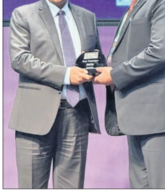
ଏଏସ୍ଏଫ୍ କଂଗ୍ରେସରେ ପୁରସ୍କାର ଗ୍ରହଣ କରୁଛନ୍ତି ହକି ଇଣ୍ଡିଆ ମହାସଚିବ ଭୋକାନାଥ ସିଂ।

ପୂର୍ବରୁ ୨୦୧୮ ବିଶ୍ୱକପ ମଧ୍ୟ ଭାରତରେ ଅନୁଷ୍ଠିତ ହୋଇଥିଲା। ୨୦୧୮ରେ କେବଳ କଳିଙ୍ଗ ଷ୍ଟାଡିୟମରେ ସମସ୍ତ ମ୍ୟାଚ ଖେଳା ଯାଇଥିଲା। ତେବେ ୨୦୨୩ରେ ନବନିର୍ମିତ ବିଶ୍ୱର ସର୍ବ୍ୱହସ୍ତ ବିର୍ଯ୍ୟା ମୁଖା ହକି ଷ୍ଟାଡିୟମରେ ଖେଳାଯାଇଥିଲା। ବିର୍ଯ୍ୟା ମୁଖା ହକି ଷ୍ଟାଡିୟମରେ ଅଲିମ୍ପିକ୍ ଭିଲେଜ୍ ଷ୍ଟାଲରେ ହକି ଭିଲେଜ୍ ରହିଥିବା ବେଳେ ଏହାକୁ ସମସ୍ତ