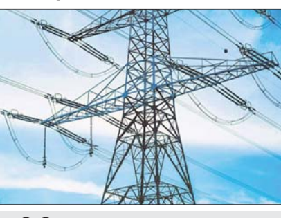
ଓଇଆରସି ପକ୍ଷରୁ ଦିଆଯାଇଥିବା ସୂଚନା ଅନୁଯାୟୀ ପୂର୍ବଭଳି ଶୁନରୁ ୫୦ ଯୁନିଟ୍ ପାଇଁ ଯୁନିଟ୍ ପିଛା ୩ ଟଙ୍କା ରହିଥିବାବେଳେ ୫୦ରୁ ୨୦୦ ଯୁନିଟ୍ ପାଇଁ ୪ ଟଙ୍କା ୮୦ ପଇସା ଓ ୨୦୦ରୁ ୪୦୦ ଯୁନିଟ୍ ପାଇଁ ୫ ଟଙ୍କା ୮୦ ପଇସା ଧାର୍ଯ୍ୟ କରାଯାଇଛି।

୨୦୨୩-୨୪ ଆର୍ଥିକବର୍ଷ ପାଇଁ ବିଦ୍ୟୁତ୍ ଦର ବଢ଼ିବ ନାହିଁ। ବିଦ୍ୟୁତ୍ ନିୟାମକ ଆୟୋଗ(ଓଇଆରସି)ଙ୍କ ପକ୍ଷରୁ ଗୁରୁବାର ଏ ନେଇ ସୂଚନା ଦିଆଯାଇଛି। ଦର ଅପରିବର୍ତ୍ତିତ ରହିଥିବା ଯୋଗୁଁ ବିଦ୍ୟୁତ୍ ଉପଭୋକ୍ତାଙ୍କ ପାଇଁ ପୂର୍ବଭଳି ଦର ଅପରିବର୍ତ୍ତିତ ରହିଛି। ଓଇଆରସି ପକ୍ଷରୁ ଦିଆଯାଇଥିବା ସୂଚନା ଅନୁଯାୟୀ ପୂର୍ବଭଳି ଶୁନରୁ ୫୦ ଯୁନିଟ୍ ପାଇଁ ଯୁନିଟ୍ ପିଛା ୩ ଟଙ୍କା ରହିଥିବାବେଳେ ୫୦ରୁ ୨୦୦ ଯୁନିଟ୍ ପାଇଁ ୪ ଟଙ୍କା ୮୦ ପଇସା ଓ ୨୦୦ରୁ ୪୦୦ ଯୁନିଟ୍ ପାଇଁ ୫ ଟଙ୍କା ୮୦ ପଇସା ଧାର୍ଯ୍ୟ କରାଯାଇଛି। ସେହିପରି ୪୦୦ ଯୁନିଟ୍ ଅଧିକ ପାଇଁ ଯୁନିଟ୍ ପିଛା ୬ ଟଙ୍କା ୨୦ ପଇସା ଧାର୍ଯ୍ୟ କରାଯାଇଛି।