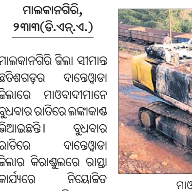
ମାଓବାଦୀମାନେ ପୋଡ଼ିଥିବା ପ୍ରୋକ୍ଲିନ ।