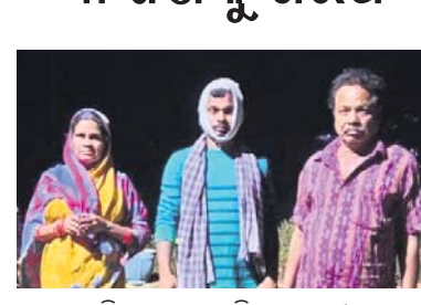
ଗିରଫ ହତ୍ୟା ଅଭିଯୁକ୍ତମାନେ।

ବେହେରା ମାମଲାର ଅଧିକ ତଦନ୍ତ କରୁଛନ୍ତି ପୋଲିସ୍ ସ୍ୱତନ୍ତ୍ର ପ୍ରକାଶ, ବଡ଼ହୁଅଁସର ଗ୍ରାମର ନବୀନ ଓ ରଘୁନାଥଙ୍କ ପରିବାର ମଧ୍ୟରେ