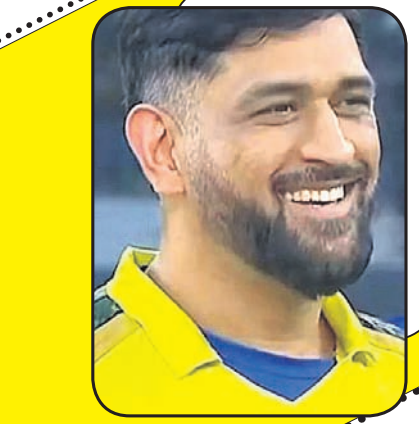
ସିଦ୍ଧେନ୍ତ୍ର ବି. ଧୋନୀ