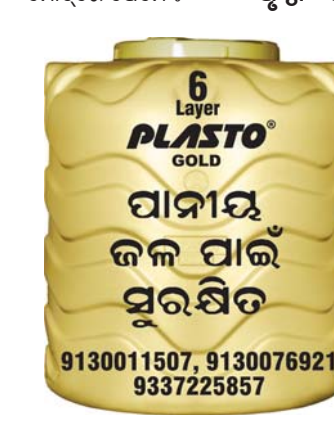
୬ Layer PLASTO GOLD ପାନୀୟ ଜଳ ପାଇଁ ସୁରକ୍ଷିତ 9130011507, 9130076921 9337225857

ବିଦ୍ୟୁତ୍ ଉପଭୋକ୍ତାଙ୍କୁ ପ୍ରତି ଯୁନିଟ୍ ପିଛା ୨୦ ପଇସା ରିହାତି ସୁବିଧା ଦିଆଯାଇଛି। ସେହିପରି ସବୁଜ ଶକ୍ତି ସାଫ୍ଟିକେଟ୍ ପ୍ରମିୟମ ଯୁନିଟ୍ ପିଛା ୫୦ ପଇସାରୁ ୨୫ ପଇସାକୁ କମାଇ ଦିଆଯାଇଛି। ରେକର୍ଡ଼ ଷ୍ଟେଡ଼ରେ ୨୫ ପ୍ରତିଶତ ରିହାତିକୁ ମଧ୍ୟ ମଞ୍ଜୁର କରାଯାଇଛି। ଗ୍ରାମାଞ୍ଚଳ ଉପଭୋକ୍ତା ଠିକ୍ ସମୟରେ ବିଦ୍ୟୁତ୍ ବିଲ୍ ପୈଠ କଲେ ଯୁନିଟ୍ ପିଛା ୧୦ ପଇସା ରିହାତି ପାଇବେ। ବିଦ୍ୟୁତ୍ ବିଲ୍ ଡିଜିଟାଲ ଗୋଡ଼ରେ ପେମେଣ୍ଟ ପୂର୍ଣ୍ଣା-୪