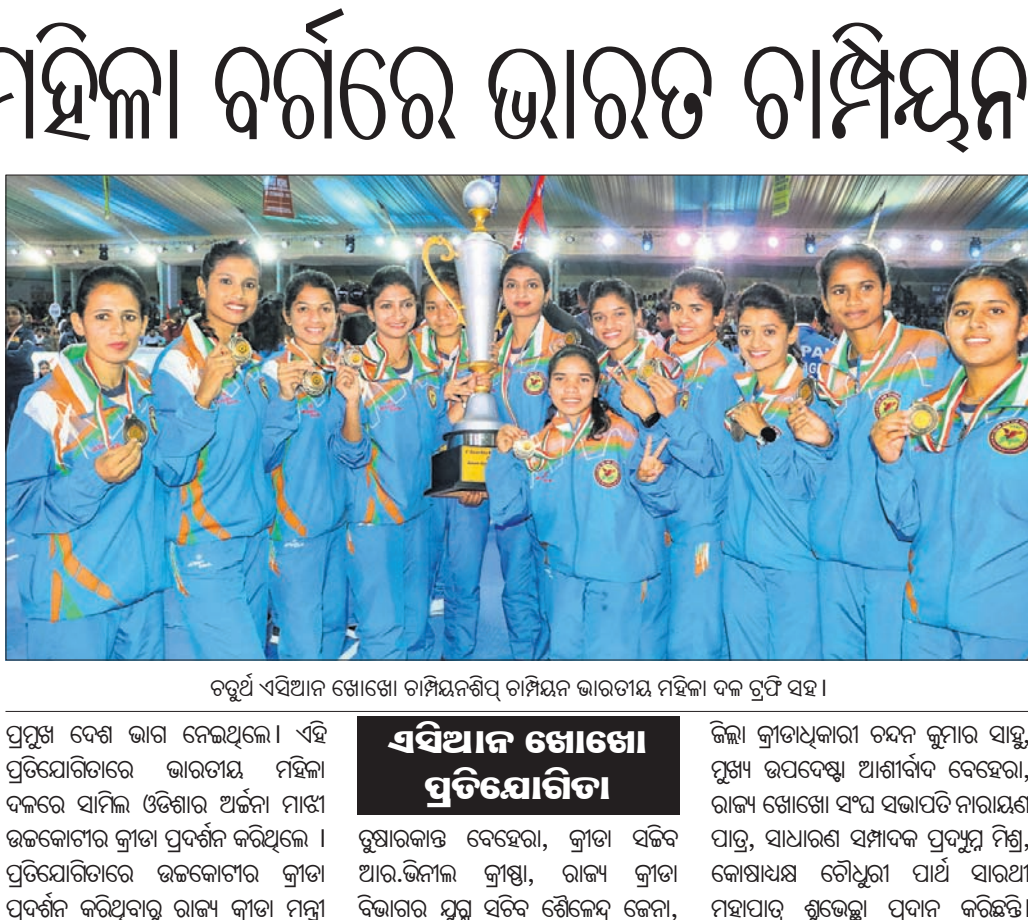
ଚତୁର୍ଥ ଏସିଆନ୍ ଖୋଖୋ ଚାମ୍ପିୟନଶିପ୍ ଚାମ୍ପିୟନ ଭାରତୀୟ ମହିଳା ଦଳ ଟ୍ରଫି ସହ।

ମିଡଫିଲ୍ଡର ପଲ୍ ରାମାଙ୍ଗଜାଉଡାଙ୍କ ସହିତ ଓଡ଼ିଶା ଏଏସ୍ଏଫ୍ (ଏଏସ୍ଏଫ୍) ଏହାର ଚୁକ୍ତିନାମା ଦୁଇ ବର୍ଷ ବୁଦ୍ଧି କରିଛି। ମିଳେନାମା ପଲ୍ ରାମାଙ୍ଗଜାଉଡା ୨୦୨୧ରେ ଓଏଫ୍‌ସି ସହିତ ରୁକ୍ତି କରିଥିଲେ। ୨୨ ବର୍ଷୀୟ ଏହି ପ୍ରତିଭାବାନ ଖେଳାଳି ଜଗତ ପ୍ରଥମେ ଆଇକ୍ୱାଲ ଏଏସ୍ଏଫ୍ ପାଇଁ ଖେଳିଥିଲେ। ମିଡଫିଲ୍ଡରେ ନିଜର କ୍ଷାପ୍ରତା ପାଇଁ ପ୍ରସିଦ୍ଧି ହାସଲ କରିବା ପରେ ବିଗତ ସିଜନରେ ସେ ଓଏସ୍ଏଫ୍ ପାଇଁ ୨୦ ମ୍ୟାଚ ଖେଳିଥିଲେ। ଏହା ମଧ୍ୟରେ ସେ ୩ଟି ଗୋଲ ଖେଳ କରିଥିଲେ। ଆସନ୍ତା ୨୦୨୫ ସିଜନ ପର୍ଯ୍ୟନ୍ତ ପଲ୍ ରାମାଙ୍ଗଜାଉଡାଙ୍କ ସହିତ ରୁକ୍ତି ବୁଦ୍ଧି କରାଯାଇଛି। ଏହା ସହିତ ପୁର ପ୍ରତିଭା ମାନଙ୍କୁ ଆଗକୁ ବଢିବାର ସୁଯୋଗ ଦେବା କୁବର ପ୍ରାଥମିକତା ବୋଲି ମଧ୍ୟ ସ୍ପଷ୍ଟ ହୋଇଛି। ନିୟମିତ ଭାବରେ କୁବ୍ ମୁଦ ଖେଳାଳିଙ୍କୁ ସୁଯୋଗ ଦେଉଥିବା ବେଳେ ପଲ୍ ଏହା ମଧ୍ୟରୁ ଅନ୍ୟତମ। ଆସନ୍ତା ହିରୋ ସୁପର୍ କପ୍‌ରେ ସେ ଓଏସ୍ଏଫ୍ ଅନ୍ୟତମ ପ୍ରମୁଖ ଖେଳାଳି ରହିବେ।