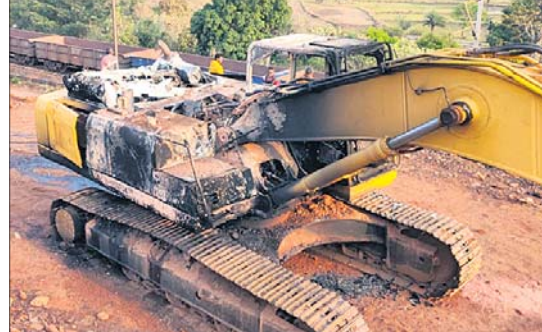
ମାଓବାଦୀମାନେ ପୋଡ଼ିଥିବା ପ୍ରୋକ୍ଲିନ ।

ମାଲକାନଗିରି ଜିଲ୍ଲା ସୀମାନ୍ତ କ୍ଷେତ୍ରରେ ଦାନ୍ତେଓଡ଼ା ଜିଲ୍ଲାରେ ମାଓବାଦୀମାନେ ରୁଧିରାତ ରାତିରେ ଲାକାକାଣ୍ଡ ଭିଆଇଛନ୍ତି । ଗୁରୁବାର ରାତିରେ ଦାନ୍ତେଓଡ଼ା ଜିଲ୍ଲାର କିରାଖୁଲରେ ରାସ୍ତା କାର୍ଯ୍ୟରେ ନିୟୋଜିତ ଏକ ପୋକ୍ଲିନ ଓ ବଟେଲିରେ ଗୋଟିଏ ଟ୍ରକ୍ ପୋଡ଼ି ଦେଇଛନ୍ତି । ମାଓବାଦୀମାନେ ସେଠାରେ ପୋଷ୍ଟର ଛାଡ଼ି ରଖିଛନ୍ତି । ସେଥିରେ ସେମାନେ ସ୍ୱରାଷ୍ଟ୍ର ମନ୍ତ୍ରୀଙ୍କ ଛତ୍ତଶଗଡ଼ ଗପ୍ତକୁ ବିରୋଧ କରୁଥିବା ଦର୍ଶାଇଛନ୍ତି । ଏଥିସହ ବିଭିନ୍ନ ଅଞ୍ଚଳରେ ସଭାସମିତି କରି ଉଭୟ କେନ୍ଦ୍ର ଓ ରାଜ୍ୟ ସରକାରଙ୍କୁ ସହଯୋଗ ନ କରିବା ପାଇଁ ଲୋକଙ୍କୁ ପ୍ରବର୍ତ୍ତାଉଥିବା ଜଣାପଡ଼ିଛି ।