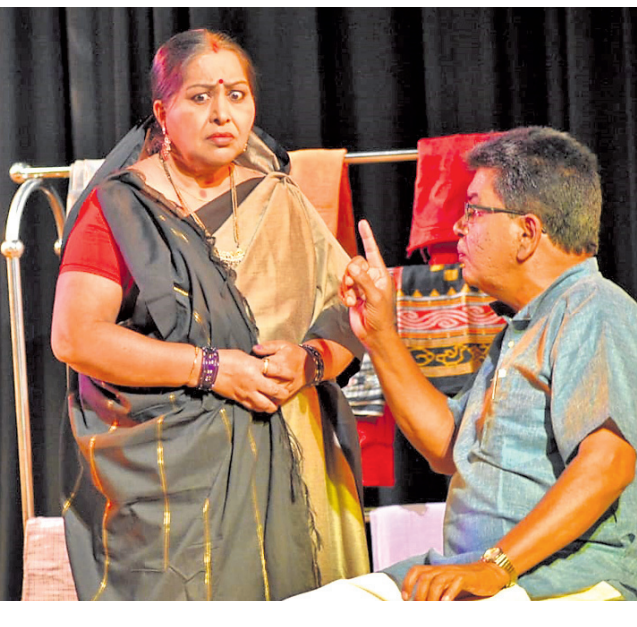
ଓଡ଼ିଆ ନାଟକ 'ଅବସର'ର ଏକ ଦୃଶ୍ୟ ।