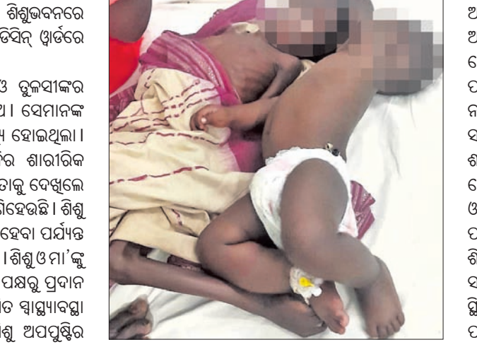
କଟକ ଅଫିସ୍, ୨୩ମାର୍ଚ୍ଚ(ଡି.ଏନ.ଏ.):