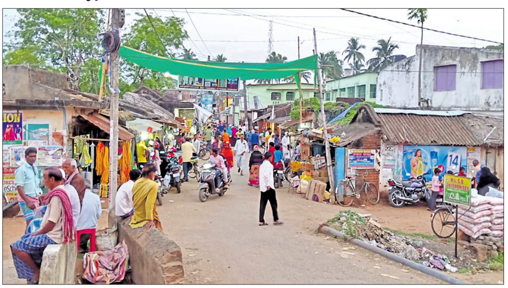
ଚାରିନଙ୍ଗଳ ବଜାରରେ ଭିଡ଼ ଜମିଛି।

ବାଲିଚନ୍ଦ୍ରପୁର, ୨୩ମାର୍ଚ୍ଚ(ସ.ପ୍ର.): ବଡ଼ଚଣା ବ୍ଲକ୍ ଅଧୀନ ଚାରିନଙ୍ଗଳ, ନଳାପୁର, କଟକଟା, ଝରକ୍ଳୁକା ଓ ଛତାବର ଆଦି ଅଞ୍ଚଳରେ ବହୁ ସଂଖ୍ୟାଲଘୁ ପରିବାର ବସବାସ କରନ୍ତି। ଶୁକ୍ରବାରଠାରୁ ରମଜାନ୍ ରୋଜା ଆରମ୍ଭ ହେଉଥିବାରୁ ଏହି ସବୁ ଅଞ୍ଚଳ ଚଳଚଞ୍ଚଳ ହୋଇଉଠିଛି। ବାହାରେ ରହୁଥିବା ଗ୍ରାମୀଣ ଅଞ୍ଚଳର ଅଧିବାସୀମାନେ ଓଷା ପାଇଁ ଗାଁକୁ ଫେରୁଥିବା ପରିଲକ୍ଷିତ ହେଉଛି। ଚାରିନଙ୍ଗଳ ବଜାରରେ ଗ୍ରାମୀଣ ସେମାନଙ୍କ ବ୍ୟବସାୟ ପ୍ରତିଷ୍ଠାନ ସଜାଜ ସାଜିଲେଣି। ସନ୍ଧ୍ୟାରେ ବଜାରରେ ପ୍ରବଳ ଭିଡ଼ ପରିଲକ୍ଷିତ ହେଉଛି। ଏହି ରମଜାନ୍ ବ୍ରତ ଆବାଳବୁଦ୍ଧବନୀତା ସମୟେ ଆଦି ବଜାର ଭିଡ଼ ମଧ୍ୟରେ ଗାଡ଼ିମଟର ବୁଟଗଡ଼ିରେ ଚଳାଇ ଜନସାଧାରଣଙ୍କୁ ଅଧିକାଂଶ ସୁବିଧାରେ ପକାଇଥିବା ଦେଖାଯାଇଛି। ଏଥିପ୍ରତି ପୋଲିସ୍ ଦୃଷ୍ଟିଦେବାକୁ ସାଧାରଣରେ ଦାବି ହୋଇଛି।