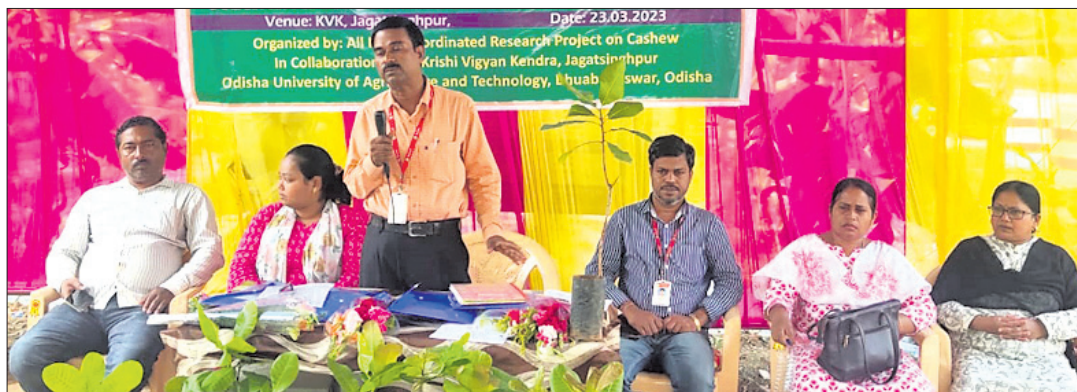
କାଳୁଚାଷ ପାଇଁ ସମସ୍ତାୟ ପ୍ରଶିକ୍ଷଣ ଶିବିରରେ ଯୋଗ ଦେଇଥିବା ଅତିଥିମାନେ ।