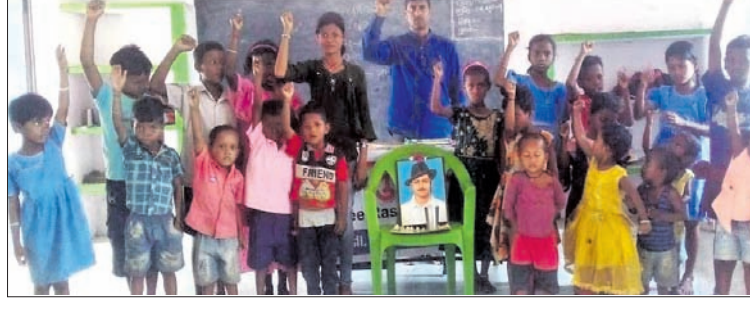
ପିଲାମାନେ ଶହୀଦ ଦିବସ ପାଳନ କରୁଛନ୍ତି।