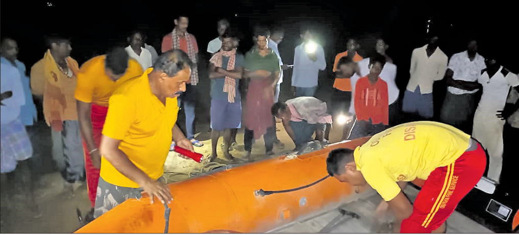
ମହିଳାଙ୍କୁ ଖୋଜିବାକୁ ଆସିଥିବା ଅଗ୍ନିଶମ କର୍ମଚାରୀ ପ୍ରସ୍ତୁତ ହେଉଛନ୍ତି।

ଝିଅଙ୍କୁ ନେଇ ନଦୀକୁ ଗାଧୋଇବାକୁ ଯାଇଥିଲେ। ଝିଅ ଦୁଇଜଣ ନଦୀ କୂଳରେ ଛିଡ଼ା ହୋଇଥିବାବେଳେ ମହିଳା ପାଣିକୁ ପଶିଥିଲେ। ହଠାତ୍ ପୋଲି ତଳେ ଥିବା ଗଭୀର ଗଣ୍ଡକୁ ମହିଳାଙ୍କ ଗୋଡ଼ ଖସି ଯିବାକୁ ସେ ସନ୍ଦାନ ମିଳି ପାରିନାହିଁ। ଅନ୍ୟପକ୍ଷରେ ପୋଲିସର ଏଭଳି ଆଚରଣକୁ ନେଇ ସ୍ଥାନୀୟ ଅଞ୍ଚଳର ଜନସାଧାରଣଙ୍କ ମଧ୍ୟରେ ଉତ୍ତେଜନା ପ୍ରକାଶ ପାଇଛି। ଅଗ୍ନିଶମ ବିଭାଗ ପକ୍ଷରୁ ଖୋଜାଖୋଜି ଜାରି ରହିଛି।