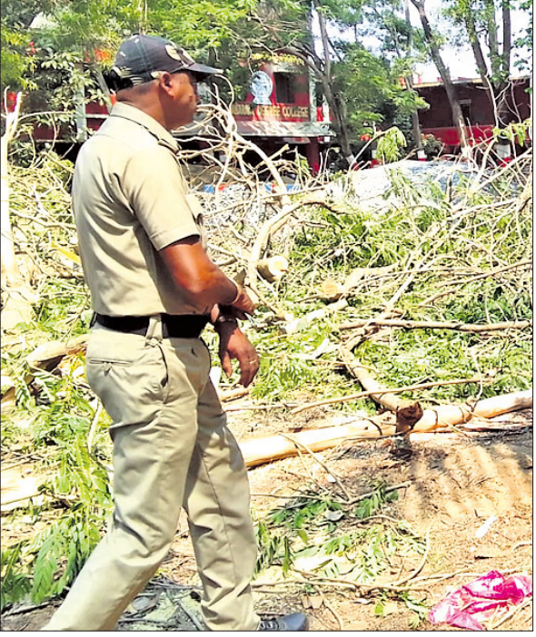
ବ୍ରହ୍ମବରଦା ମହାବିଦ୍ୟାଳୟ ପରିସରରୁ ଗଛ କଟାଯାଇଛି।

ଆର୍ଟିଓଙ୍କ ନିର୍ଦ୍ଦେଶ ଅନୁସାରେ ଶିକ୍ଷା ଅଧିକାରୀଙ୍କୁ ନିର୍ଦ୍ଦେଶ ଦିଆଯାଇଛି ଯେଉଁମାନେ ମାସିକ ବଡ଼ି ଆଦାୟକୁ ଅଧିକ ଗୁରୁତ୍ୱ ଦେଉଛନ୍ତି। ଏହି ଅଞ୍ଚଳରେ ମାଲ୍ ପରିବହନ ଗାଡ଼ି ସର୍ବାଧିକ ଚଳାଚଳ କରୁଛି। ଏଠାରେ ଆରଟିଓ ଭାବେ ସମ୍ପଦ କୁମ୍ଭୀର ଏକେଣ୍ଟ ଏବଂ ଦୁର୍ଗତିଖୋର ପୋଲିସ ଆଦାୟ କରାଯାଉଛି। ଏହି ମର୍ମରେ