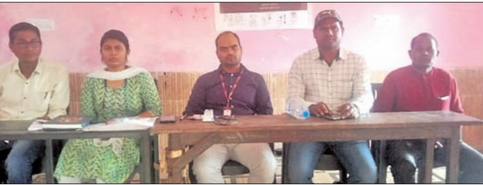
କରଣ, ୨୪ମାର୍ଚ୍ଚ(ଡି.ଏନ.ଏ.) କଣେ ହିତାଧିକାରୀଙ୍କୁ ୫୦ ଟଙ୍କା ଲେଖାଏ ଆଦାନ କରାଯାଇଥିଲା।