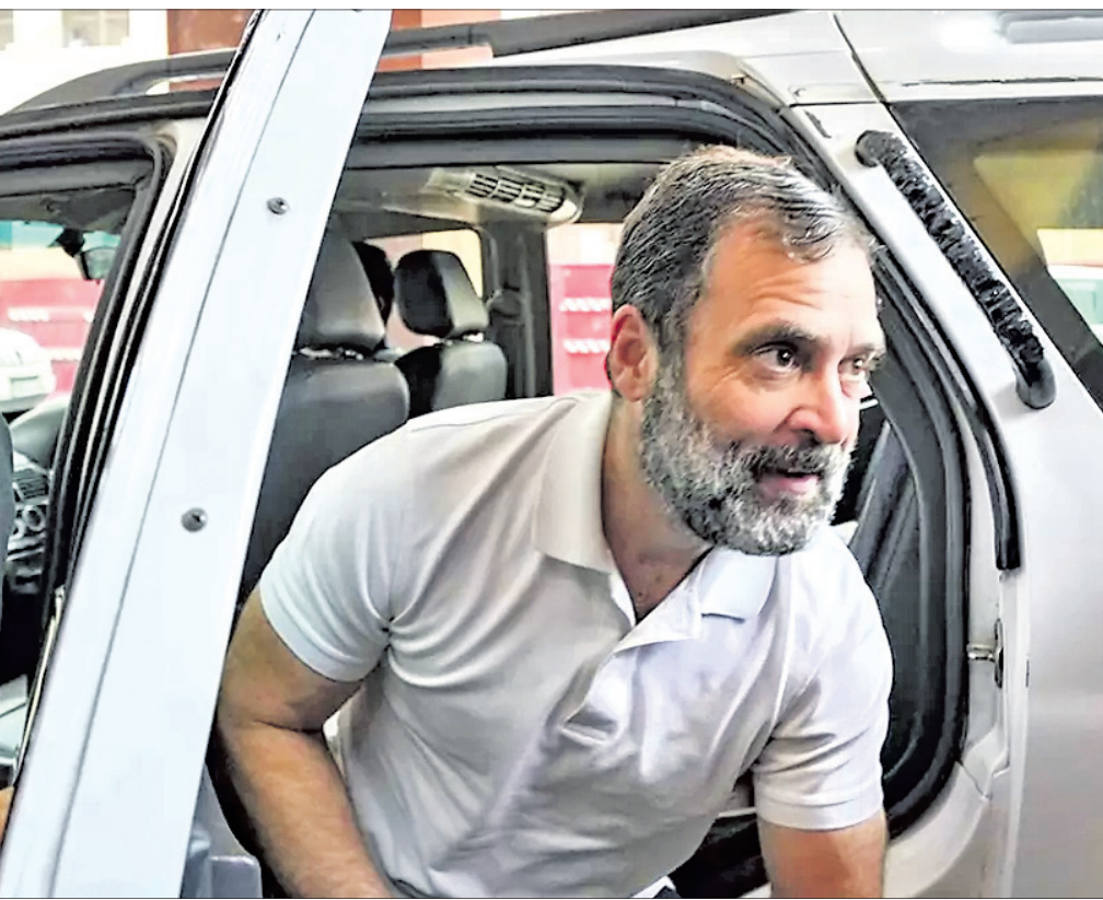
ପାର୍ଲିମେଣ୍ଟର ବଜେଟ୍ ଅଧିବେଶନରେ ଯୋଗଦେବା ପାଇଁ ଯାଉଛନ୍ତି କଂଗ୍ରେସ ନେତା ରାହୁଲ ଗାନ୍ଧୀ।

କଂଗ୍ରେସ ନେତା ରାହୁଲ ଗାନ୍ଧୀ 'ସବୁ ମୋଦି ଚୋର' ମନ୍ତବ୍ୟ ସମ୍ପର୍କିତ ଆପରାଧିକ ମାମଲାରେ ଦୋଷୀ ସାବ୍ୟସ୍ତ ହୋଇ ୨ ବର୍ଷ ଜେଲ ଦଣ୍ଡାଦେଶ ପାଇଛନ୍ତି। ଏହାର ଦିନକ ପରେ ଶୁଭ୍ରାଚାର ଲୋକ ସଭା ସେକ୍ରେଟାରିଏଟ୍ ତାଙ୍କ ସଦସ୍ୟ ପଦ ରଦ୍ଦ କରିଛି।