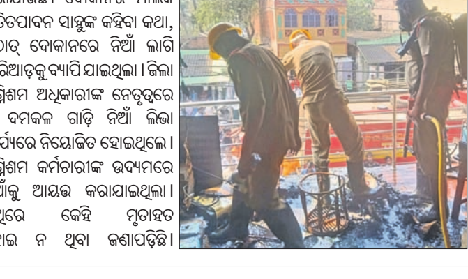
କରାଯାଉଛି। ଦୋକାନର ମାଲିକ ପରିତପାଦନ ସାହୁଙ୍କୁ

ତେଜାନାଳ କାଞ୍ଚିନବକାରସ୍ଥିତ 'ମହାଲକ୍ଷ୍ମୀ କୃଷି ଭେଣ୍ଡର'ରେ