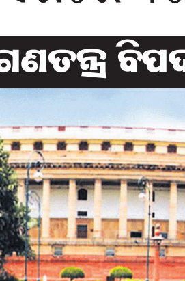
'ଗଣତନ୍ତ୍ର ବିପଦରେ' ଅଭିଯୋଗ

ନୂଆଦିଲ୍ଲୀ, ୨୪ମାର୍ଚ୍ଚ(ପି.ଟି.): ଗଣତନ୍ତ୍ର ବିପଦରେ ଥିବା ଅଭିଯୋଗ କରି ଏବଂ ଆଦାନୀ ଗ୍ରୁପ୍ ପ୍ରସଙ୍ଗରେ କେପିସି ତଦନ୍ତ ଦାବିରେ ବିରୋଧୀ ଦଳଗୁଡ଼ିକ ପକ୍ଷରୁ ଶୁଭ୍ରାଚାର ପାର୍ଲିମେଣ୍ଟ ଭବନ ପରିସରରେ ବିକ୍ଷୋଭ ଶୋଭାଯାତ୍ରା କରାଯାଇଛି।