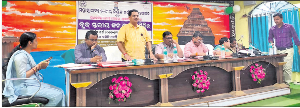
ବୃକ୍ଷରୋଧ କର୍ମଶୃଙ୍ଖଳାରେ ଉପସ୍ଥିତ ଜନପ୍ରତିନିଧି ଓ ଅଧିକାରୀମାନେ ।

ଅନୁଗୋଳ ଜିଲା ଛେଡ଼ିପଦା ବ୍ଲକ୍ ସଭାଗୃହରେ ବୃକ୍ଷରୋଧ ମହାପାତ୍ର ଗାନ୍ଧୀ କାର୍ଯ୍ୟକ୍ରମ ନିର୍ବହଣ ଯୋଜନା ଓ ଆବାସ ଯୋଜନା ୨୦୨୨-୨୩ ବର୍ଷର