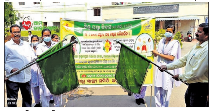
ସହର ପରିକ୍ରମା କରୁଛି ସଚେତନତା ଯାତ୍ରା ।

ଯଶ୍ନା ଚିକିତ୍ସା ପୂର୍ଣ୍ଣ ଭାବରେ ଗଠନ କରିବା ଉପରେ ସେ ଗୁରୁତ୍ୱରୋପ କରିଥିଲେ ।