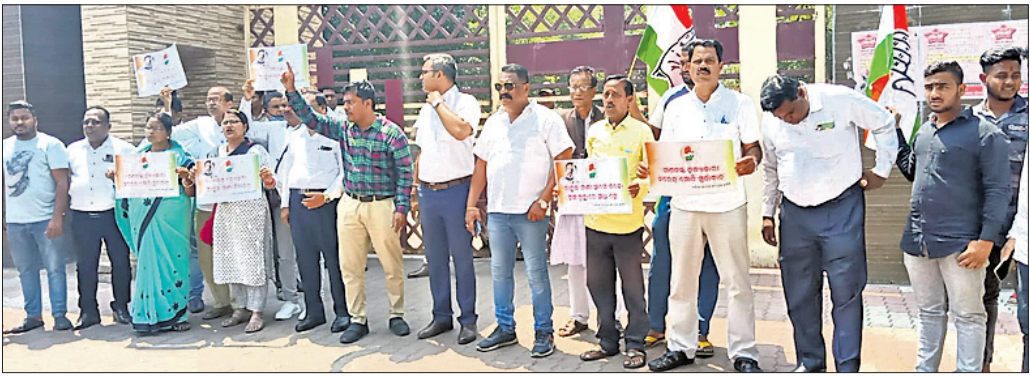
ଜିଲା କାର୍ଯ୍ୟାଳୟ ସମ୍ମୁଖରେ କଂଗ୍ରେସ ପକ୍ଷରୁ ବିରୋଧ କରାଯାଇଛି ।