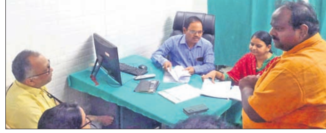
ଦିଶା ଚିକିତ୍ସାଳୟରେ ସ୍ୱାସ୍ଥ୍ୟ ବିଭାଗର ତଦାୟନ।

ତେଜାନାଳ ଜିଲ୍ଲାରେ ବିଭିନ୍ନ ସ୍ୱାସ୍ଥ୍ୟ କଲ୍ୟାଣ ଯୋଜନା ବିଏସ୍‌କେଫୁଲରେ ଗୋଟିଏ