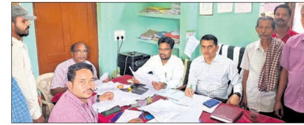
କରଣ, ୨୪ମାର୍ଚ୍ଚ(ଡି.ଏନ.ଏ.) ବିଚାର କରିଥିଲେ। ଏଥିରେ ୬୨ଟି ଆଠମାସିକ ରୁକ୍ଷ ପାଇକସାହି ରାଜସ୍ୱ ମାମଲା