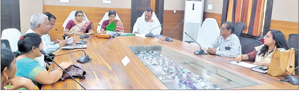
ଜିଲା ସର୍ବିଟ ହାଉସ୍ ଠାରେ ସମୀକ୍ଷା ବୈଠକରେ ଉପଦେଷ୍ଟାଙ୍କ ସହ ଅଧିକାରୀମାନେ ।

ଅନୁଗୋଳ ଜିଲାରେ ଓଡ଼ିଶା ସରକାରଙ୍କ ପାମାନ୍ୟ ଜଳ ବିଭାଗର ବିଭିନ୍ନ କାର୍ଯ୍ୟକ୍ରମ, ବସୁଧା ଯୋଜନାର କାର୍ଯ୍ୟକାରୀତା ଓ