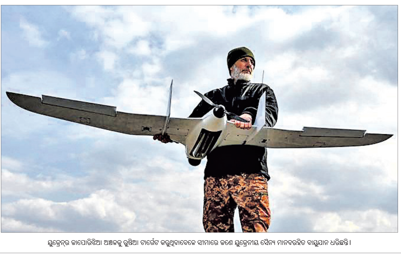
ସୁକେନ୍ଦ୍ର କାପୋରିଝିଆ ଅଞ୍ଚଳକୁ ବୁଝିଆ ଚାର୍ଟର କରୁଥିବାବେଳେ ସାମାଜିକ କର୍ମୀ ସୁକେନ୍ଦ୍ର ସୈନ୍ୟ ମାନବସମ୍ବଳ ବାହୁଡ଼ା ଧରିଛନ୍ତି।

ଭଦ୍ରକ, ୨୪ମାର୍ଚ୍ଚ: ଖଲିପ୍ରାଣ ନେତା ଅଗ୍ରଗତି ପାଇଁ ସଂପୂର୍ଣ୍ଣ ପଞ୍ଜୀକରଣ ହାତକୁ ଖସି ପଳାଇଯିବା ପୂର୍ବରୁ ୧୦ ଦିନରେ ୫ଟି କାର୍ଯ୍ୟକ୍ରମରେ ଯୋଗଦେଇଥିଲେ।