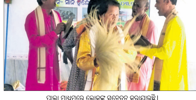
ପାଲା ମାଧ୍ୟମରେ ଲୋକଙ୍କୁ ସତେଇ କରାଯାଇଛି।

ସାତମାଇଲ, ୨୪ମାର୍ଚ୍ଚ(ଡି.ଏନ.ଏ.) ତେଜାନାଳ ଜିଲ୍ଲା ହିସୋଲ ବ୍ଲକ୍