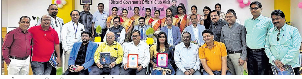
କାର୍ଯ୍ୟକ୍ରମରେ ଉପସ୍ଥିତ ଅତିଥିଙ୍କ ସହ କୁଳ କର୍ମଚାରୀମାନେ ।

ଏହି ସମୟରେ ଆବୁତୁବ୍ ସୁବ୍ ସ୍ ବିଭାଗର କର୍ତ୍ତୃପକ୍ଷ ଓ ଏନ୍‌ସିଏ କମ୍ପାନୀର କର୍ମଚାରୀମାନେ ଉପସ୍ଥିତ ଥିଲେ ।