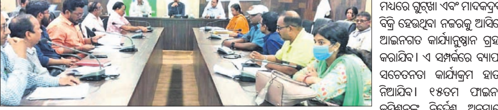
ବୈଠକରେ ଜିଲ୍ଲାପାଳଙ୍କ ଜିଲ୍ଲା ପ୍ରଶାସନ ଏବଂ ସ୍ୱାସ୍ଥ୍ୟ ବିଭାଗର ଅଧିକାରୀମାନେ।

ତେଜାନାଳ ଜିଲ୍ଲା ସ୍ୱାସ୍ଥ୍ୟ ମିଶନ ଏବଂ କାର୍ଯ୍ୟକାରୀତା ବୈଠକ