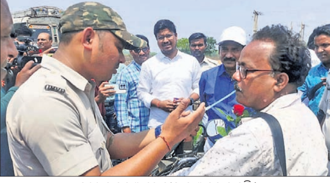
ଜଣେ ବାଙ୍କୁ ଆରୋହୀଙ୍କୁ ସାଥୀ କରି ଦେଖାଯାଇଛି।

ତେଜାନାଳ ଅଫିସ୍, ୨୪ମାର୍ଚ୍ଚ ତେଜାନାଳରେ ଗତ ଅତ୍ୟଧିକ ମାସରେ ସଡ଼କ ଦୁର୍ଘଟଣାରେ ୩୮ ଜଣଙ୍କର ମୃତ୍ୟୁ ହୋଇଥିଲା।