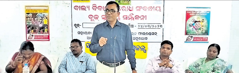
କାର୍ଯ୍ୟକ୍ରମରେ ମହାସାଥୀ ଅତିଥିମାନେ ।

ଆଠମଲିକ ୨୪୩୩(ଡି.ଏନ.ଏ.) ଚରଣୀ ସୁନା ମୁଖ୍ୟ ଅତିଥି ଭାବେ ଯୋଗଦାନ କରି କାର୍ଯ୍ୟକ୍ରମକୁ