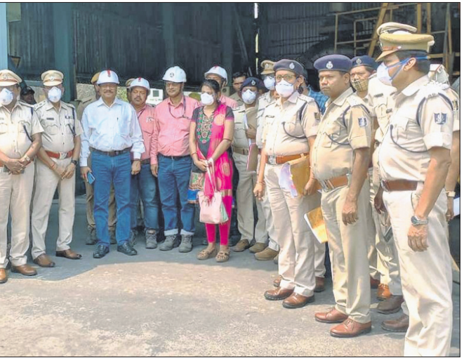
ତେଜାନାଳ ଅଫିସ୍, ୨୪ମାର୍ଚ୍ଚ

ତେଜାନାଳ ଜିଲ୍ଲା ପୋଲିସ୍ ଏବଂ ଡେଇଁସିଆର ଉଦ୍‌ଘୋଷଣା କରିଛନ୍ତି।