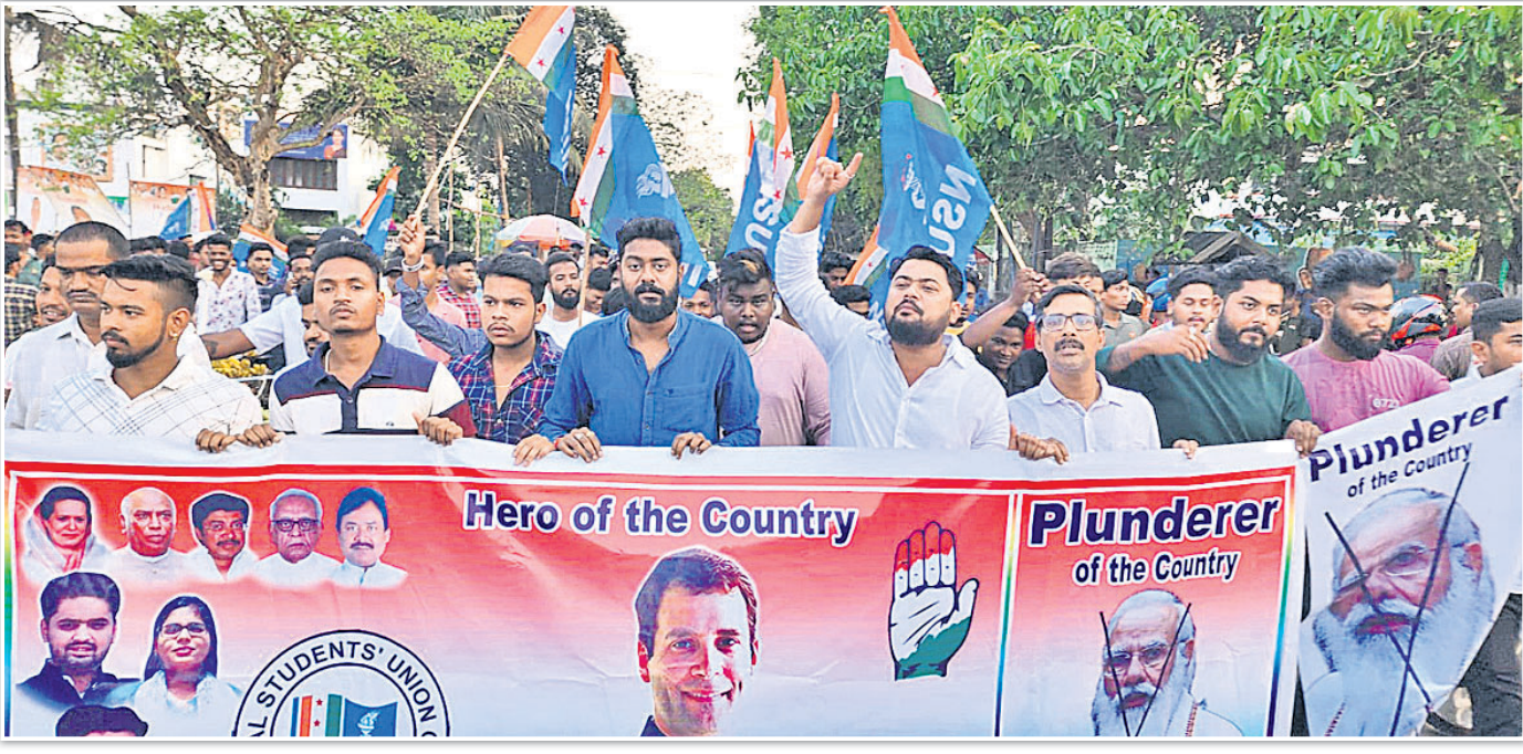
ରାହୁଲ ଗାନ୍ଧୀଙ୍କୁ ୨ ବର୍ଷ କେଲ ଓ ଏମ୍ପି ପଦ ରଦ୍ଦ ପ୍ରତିବାଦରେ ଶନିବାର ପ୍ରଦେଶ ଛାତ୍ର କଂଗ୍ରେସ ପକ୍ଷରୁ ଭୁବନେଶ୍ୱର ମାଷ୍ଟରକ୍ୟାଣ୍ଟିନ ଛକରେ ବିକ୍ଷୋଭ କରାଯାଇଛି ।