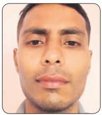
କିଶୋର ପାଣି, ଭୁବନେଶ୍ୱର