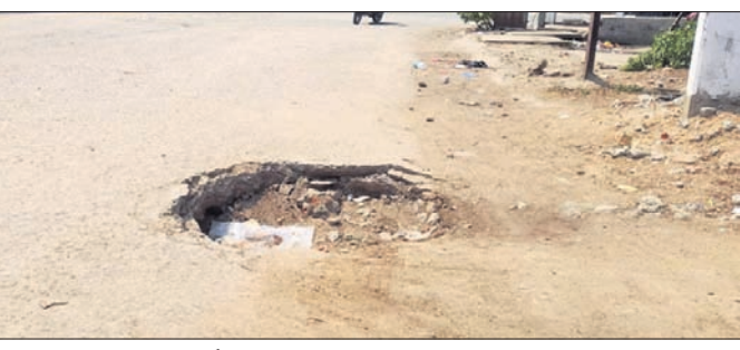
ରାସ୍ତାରେ ତିନି ଫୁଟର ଗର୍ଭ ହୋଇଛି। ଖଡ଼ିଆଳ, ୨୫ମାର୍ଚ୍ଚ(ଡି.ଏନ.ଏ.)

ନୂଆପଡ଼ା ଜିଲ୍ଲା ଖଡ଼ିଆଳ ବ୍ଲକ ଛକ ସ୍ଥିତ ଚନାବେଡ଼ା ରାସ୍ତା କଂଗ୍ରେସ କାର୍ଯ୍ୟାଳୟ ସମ୍ମୁଖରେ ତିନି ଫୁଟର ଏକ ଗର୍ଭ ହୋଇଛି। ମୁଖ୍ୟତଃ ଏହି ରାସ୍ତା ଦେଇ ଖଡ଼ିଆଳ ଉପଖଣ୍ଡ ସାଲ୍ଲାସାଧୁ, ତଦ୍ୱରତା କାର୍ଯ୍ୟାଳୟ, କୋର୍ଟ, ବନବିଭାଗ, ଉପକାରାଗାର, ଦମକଳ କେନ୍ଦ୍ର, ବସଷ୍ଟାଣ୍ଡ ଥିବା ହେତୁ