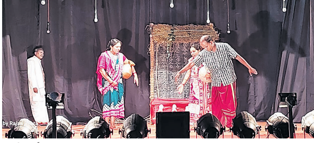
ସାଂସ୍କୃତିକ କାର୍ଯ୍ୟକ୍ରମ 'ଉତ୍ସବ'ରେ ମଞ୍ଚସ୍ଥ ନାଟକର ଏକ ଦୃଶ୍ୟ ।

ଚୈତ୍ର ବାସନ୍ତୀକ ଦୁର୍ଗାପୂଜା ଅବସରରେ ବରଗଡ଼ ଜିଲ୍ଲା ସୋହେଲାରେ ଚାଲିଥିବା ସାଂସ୍କୃତିକ କାର୍ଯ୍ୟକ୍ରମ 'ଉତ୍ସବ'ର ଶନିବାର ଚତୁର୍ଥ ସନ୍ଧ୍ୟାରେ ସମାଜ ସଂସ୍କାର ଧର୍ମା ଭୁକ୍ତି ନାଟକ ମଞ୍ଚସ୍ଥ ହୋଇଥିଲା। ଭୋଇବନ୍ଧୁ ସଚେତନ ହେମାର କଳାକାରଙ୍କ ଦ୍ୱାରା ନାଟକ 'ଜାଏତ ଭିନ୍ ଭିନ୍ ମୁନୁଷ ଏକ' ନାଟକ ପ୍ରଥମେ ପରିବେଷିତ ହୋଇଥିଲା। ବ୍ୟାଞ୍ଜ ବାଜା, ଡିଜେ, ମେଲୋଡି ଯୁଗରେ ଗଣ୍ୟବାନୀ ପ୍ରାଚୀର ହୋଇ ବାଧା ସୃଷ୍ଟି କରେ। ହେଲେ ବାଧା। ଦୁଃଖିଲୋକବାଦ୍ୟ ନାଟକ ଝୁରେ। ତାର ପୁଅ ଚନ୍ଦର ଭଲ ପାଠ ପଢ଼େ। ସେ ଆୟୋଡ଼କରବାଦୀ। ଗାଁ ଗୋଡ଼ିଆର ଝିଅ ଚନ୍ଦରକୁ ଭଲ ପାଇବସେ। କଣେ ଭକ୍ତକାଚିତ ଗୋଡ଼ିଆ ଘର ଝିଅ ଏବଂ