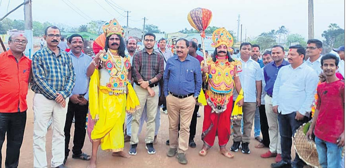
ଭୁବନେଶ୍ୱର, (ବୁଧବେ)/ଭୁବନ, ୨୫ମାର୍ଚ୍ଚ (ବି.ଏ.ଏ.)