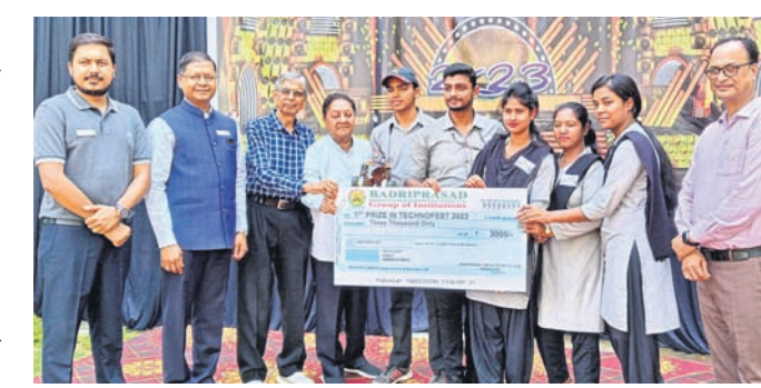
କ୍ଷାତ୍ରାକ୍ରମେଷୁ ପୁରସ୍କାର ପ୍ରଦାନ କରାଯାଇଛି।