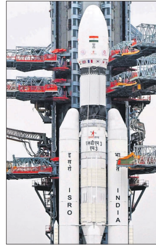
ଉତ୍ତ୍ରେପଣ କରାଯିବ। ଏହା ୫,୮୦୫ କିଲୋଗ୍ରାମ ଓଜନର ୩୬ଟି କେନ୍ଦ୍ର ସାଟେଲାଇଟକୁ ନେଇ ପୃଥିବୀର ନିମ୍ନ କକ୍ଷପଥରେ ସ୍ଥାପନ କରିବ।

ଚେନାଇ, ୨୫ମୀ ଏଲ୍‌ଡିଏମ୍‌ଏ ରକେଟ ଉତ୍ତ୍ରେପଣ ଲାଗି ଭାରତୀୟ ମହାକାଶ ଗବେଷଣା ସଂସ୍ଥା (ଇସ୍ରୋ) ଶନିବାର ସକାଳ ୮ଟା ୩୦ରୁ ଅବଗଣନା ଆରମ୍ଭ କରିଛି। ଏହି ରକେଟ ରବିବାର ବ୍ରିଟେନର ନେଟ୍‌ହେର୍ଣ୍ଣ ଆକ୍ସେସ୍ ଆସୋସିଏଟେଡ୍ ଲିଃ (ଫ୍ଲାନଡ୍‌ସ୍)ର ୩୬ଟି ସାଟେଲାଇଟକୁ ବହନ କରି କକ୍ଷପଥରେ ଅବସ୍ଥାପିତ କରିବ। କାର୍ତ୍ତବ୍ୟତାଉନ୍ ସମୟରେ ରକେଟ ଏବଂ ସାଟେଲାଇଟ୍ ସିଷ୍ଟମକୁ ଯାଞ୍ଚ କରାଯିବ। ସହ ରକେଟରେ ଲକ୍ଷଣ ଭର୍ତ୍ତି କରାଯାଇଛି। ୪୩.୫ ମିଟର ଉଚ୍ଚ ଏବଂ ୬୪୩ ଟନ୍ ଓଜନ ବିଶିଷ୍ଟ ଏଲ୍‌ଡିଏମ୍‌ଏ ରକେଟ ଆକ୍ସେସ୍ ଶ୍ରୀହରିକୋଟ୍ଟାରେ ରକେଟ ପୋର୍ଟର ଦ୍ୱିତୀୟ ଲଞ୍ଚ ପ୍ୟାଡ୍‌ରୁ ରବିବାର ସକାଳ ୯ଟାରେ