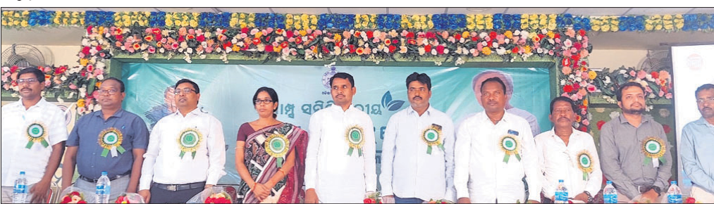
କର୍ମଶାଳାରେ ଯୋଗଦେଇଥିବା ଅତିଥିମାନେ।