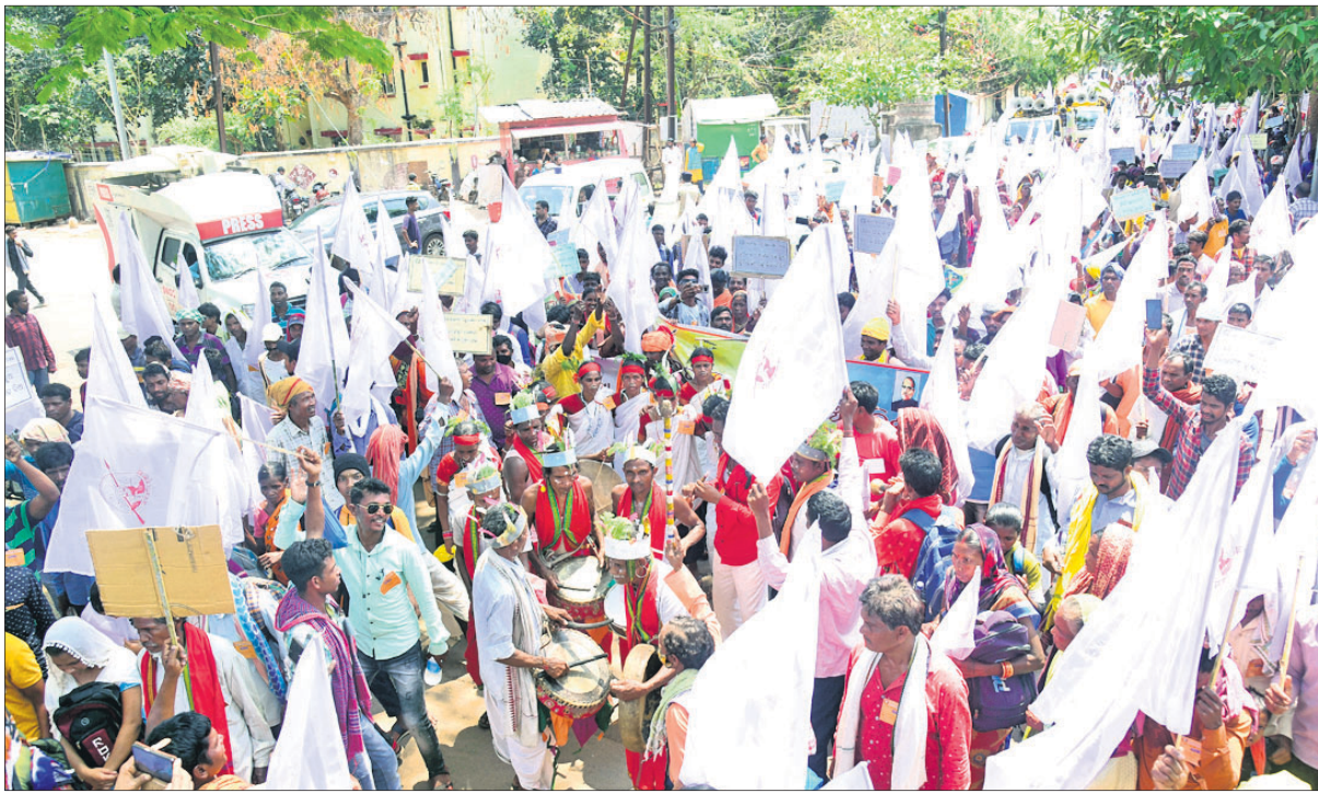
ଧର୍ମାନ୍ତରିତ ବ୍ୟକ୍ତିଙ୍କୁ ଅନୁସୂଚିତ ଜନଜାତିରୁ ବାଦ୍ ଦେବା ଆଦି ଦାବି ନେଇ ଜନଜାତି ସୁରକ୍ଷା ମଞ୍ଚ ପକ୍ଷରୁ ଶନିବାର ଭୁବନେଶ୍ୱର ଜନତା ମଇଦାନଠାରେ ଅନୁଷ୍ଠିତ ସମାବେଶରେ ଯୋଗଦେବା ପୂର୍ବରୁ ଜନଜାତି ସମ୍ପ୍ରଦାୟ ଲୋକେ ଶୋଭାଯାତ୍ରାରେ ସହର ପରିକ୍ରମା କରୁଛନ୍ତି।

ଭୁବନେଶ୍ୱର, ୨୫ମାର୍ଚ୍ଚ(ବୁଧବେଳା) ଧର୍ମାନ୍ତରିତ ବ୍ୟକ୍ତିମାନଙ୍କୁ ଅନୁସୂଚିତ ଜନଜାତିରୁ ବାଦ୍ ଦେବା ଦାବିକୁ କୋରଦାର କରିଛି ଜନଜାତି ସୁରକ୍ଷା ମଞ୍ଚ। ଏହାକୁ ନେଇ ଶନିବାର ମଞ୍ଚ ପକ୍ଷରୁ ରାଜଧାନୀ ଭୁବନେଶ୍ୱରରେ ବଡ଼ସଭାରେ ଜନଜାତି ସମାବେଶର ଆୟୋଜନ କରାଯାଇଥିଲା। ଏଥିରେ ରାଜ୍ୟର ୨୬ ଜିଲ୍ଲାକୁ ୬୨ ସମ୍ପ୍ରଦାୟର ୧୦୦ହଜାରରୁ ଊର୍ଦ୍ଧ୍ୱ ଜନଜାତି ଭଗ୍ନଶାସକ ଯୋଗଦେଇଥିଲେ। ଶହାଦନରର ଦୁର୍ଗାମଣ୍ଡପ, ନୟାପଲ୍ଲୀ ଓ ରାମମନ୍ଦିର ଛକ ନିକଟରୁ ମଞ୍ଚ ଶୋଭାଯାତ୍ରା ବାହାରି ସ୍ଥାନୀୟ ଜନତା ମୁକ୍ତିସଭାରେ ପହଞ୍ଚିଥିଲା। କେନ୍ଦ୍ରମନ୍ତ୍ରୀ ବିଶେଷରୁ ରୁକ୍ମି ଚୁପାଲି ଛକରେ ଏହି ଶୋଭାଯାତ୍ରାରେ ସାମିଲ ହୋଇ ଜନଜାତି ଭଗ୍ନଶାସକଙ୍କ ପଦ ବିଚାର ଆଲୋଚନା କରି କିଛି ବାଚ ପଦଯାତ୍ରାରେ ଯାଇଥିଲେ। ଏହି