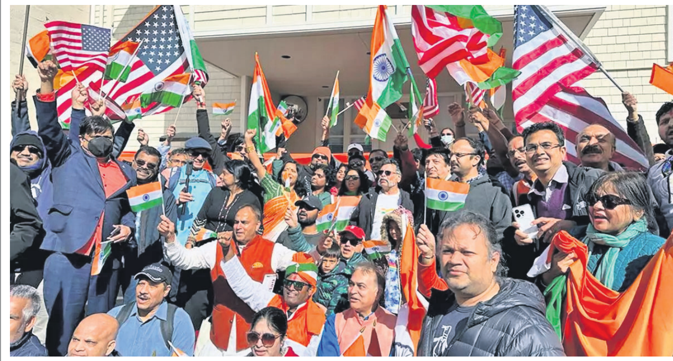
ଆମେରିକାର ସାନ ପ୍ରାନ୍ତବିଷୟରେ ଥିବା ଭାରତୀୟ ବାଣିଜ୍ୟିକ ଦୂତାବାସରେ ଖଲିସ୍ତାନୀ ସମର୍ଥକଙ୍କ ଉତ୍ସାହପୂର୍ଣ୍ଣ ପ୍ରତିବାଦରେ ଭାରତୀୟ-ଆମେରିକୀୟମାନେ ଉକ୍ତ କାର୍ଯ୍ୟକ୍ରମ ବାହାରେ ଶନିବାର ବିରୋଧ କରୁଛନ୍ତି।

ଫ୍ଲୋରିଡ଼ା, ୨୫ମୀ: ଆମେରିକାର ନିସିଦିପରେ ଶୁକ୍ରବାର ରାତିରେ ଝଡ଼, ଟୋଫାନ ଫଳରେ ୨୩ ଜଣଙ୍କ ମୃତ୍ୟୁ ଘଟିଛି। ୧୨ରୁ ଉର୍ଦ୍ଧ୍ୱ ଲୋକ ଆହତ ହୋଇଥିବାବେଳେ ୧୦୦ ମାଲିଆ ଅଞ୍ଚଳ ଏହା ଦ୍ୱାରା ପ୍ରଭାବିତ ହୋଇଥିବା ଷ୍ଟେଟ୍ ଡିପାର୍ଟମେଣ୍ଟ ପ୍ରଶମନ ବିଭାଗ ପକ୍ଷରୁ ସୂଚନା ଦିଆଯାଇଛି। ନିସିଦିପର ପଶ୍ଚିମାଞ୍ଚଳରେ ଥିବା ସିଲଭର ସହର ଅଧିକ ପ୍ରଭାବିତ ହୋଇଛି। ସ୍ଥାନୀୟ ଅଞ୍ଚଳରୁ ୪ ଜଣ ନିଖୋଜ ଥିବାବେଳେ ପ୍ରଶମନ ପକ୍ଷରୁ ଉଦ୍ଧାର ଓ ସର୍ଚ୍ଚ ଅପରେଶନ୍ ଜାରି ରହିଛି। ପ୍ରଭାବିତ ଲୋକଙ୍କୁ ଆବଶ୍ୟକ ସୁବିଧା ଯୋଗାଇ ଦିଆଯାଉଥିବାବେଳେ ମୃତକଙ୍କ ସଂଖ୍ୟା ବଢ଼ିବା ନେଇ ପ୍ରଶମନ ଆଶଙ୍କା ବ୍ୟକ୍ତ କରିଛି।