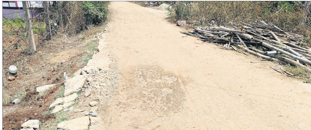
ଲୋଇସିଂହା କୃଷି ଓ ଉଦ୍ୟାନ ବିଭାଗ ରାସ୍ତା ଦବି ଯାଇଛି।