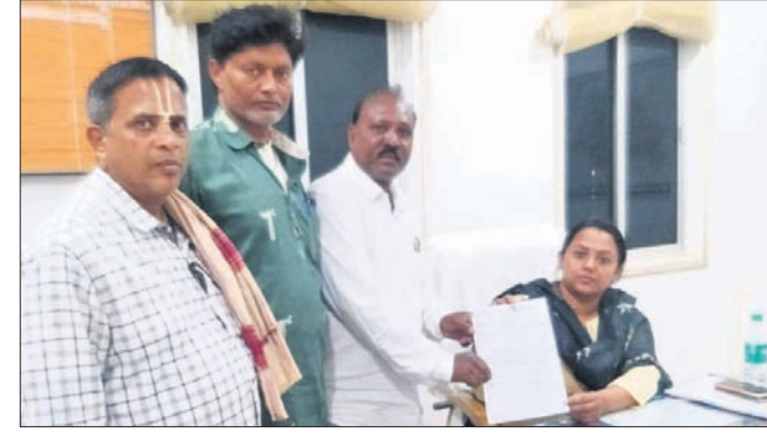
କଳାକାରମାନେ ଜିଲ୍ଲାପାଳଙ୍କୁ ସ୍ଥାନକପତ୍ର ପ୍ରଦାନ କରୁଛନ୍ତି।