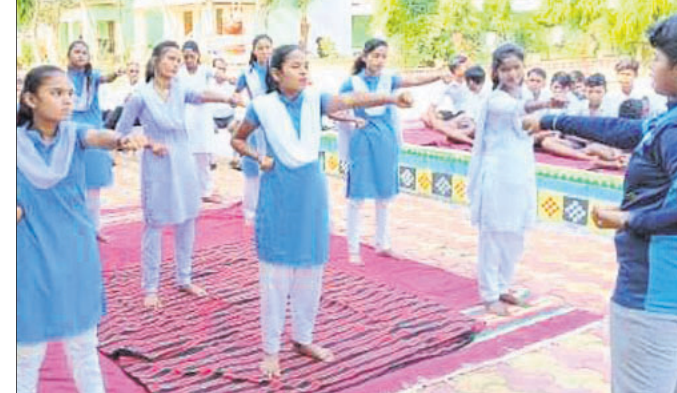
ଛାତ୍ରୀମାନେ ଆମ୍ ସୁରକ୍ଷା ତାଲିମ ନେଉଛନ୍ତି।