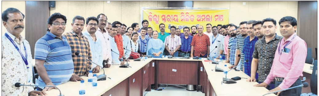
ଅମଲା ମଞ୍ଚର ବୈଠକରେ କର୍ମକର୍ତ୍ତା ।