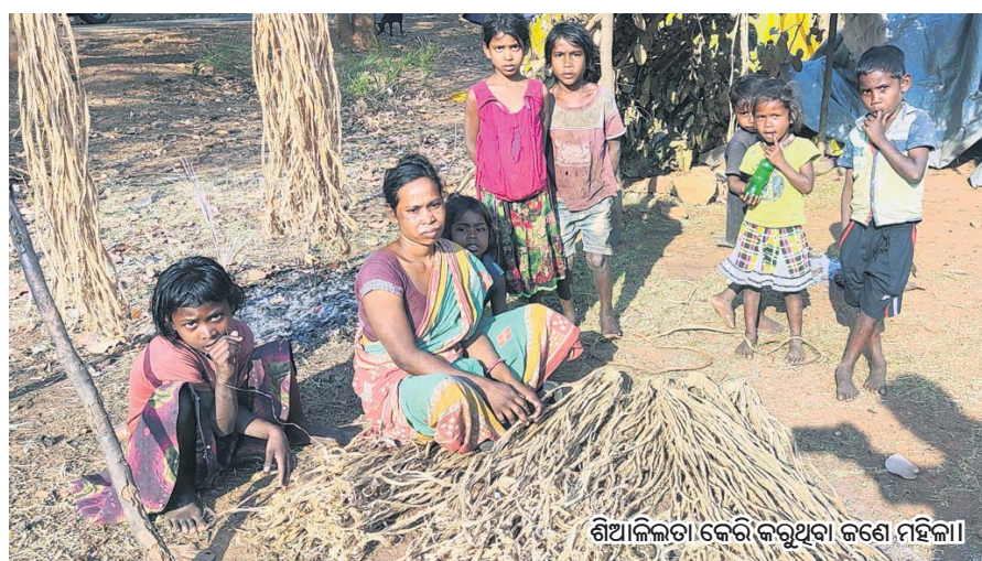
ଶିଖାଲିଳତା କେରିକରୁଥିବା ଜଣେ ମହିଳା।

ସମ୍ବଲପୁର, ୨୫ମାର୍ଚ୍ଚ(ବୁଧବେ) ରୋଜଗାର ପାଇଁ ପୂରା ପରିବାର ଅନନ୍ତ କାମ କରିବାକୁ ଯାଉଛନ୍ତି। ଫଳରେ ପିଲାମାନଙ୍କ ଭବିଷ୍ୟତ ଅନ୍ଧକାର ଆଡ଼କୁ ଠେଲି ହୋଇଯାଇଛି। ମଉଳିପାଠିଆ ହୁଏ ପିଲାଙ୍କ ଆଖି। ଫାଡ଼ିଘରେ ବିଦୁଛି ଶୈଶବ। ପାଠ ପଢ଼ାରେ ଲାଗୁଛି ତୋର। ଏଭଳି ଚିତ୍ର ଦେଖିବାକୁ ମିଳିଛି ସମ୍ବଲପୁର ସହରଠାରୁ ପ୍ରାୟ ୫୫କି.ମି. ଦୂର ମୁଝୁରା କେନ୍ଦ୍ରପଡ଼ା ବିଭାଗ ଅଧୀନରେ ଥିବା ଜଗନ୍ନାଥ ଗ୍ରାମର ଫାଡ଼ିଘରେ କାର୍ଯ୍ୟରେ ଶ୍ରମିକଙ୍କ ଶ୍ରେଣୀରେ। ପ୍ରତିବର୍ଷ ପ୍ରାୟ ୩୩୩ ଶ୍ରମିକମାନେ ପରିବାର ସହ ଆସି ଶିଖାଲିଳତା ସଂଗ୍ରହ କରିଥାନ୍ତି। ଏହି ସମୟରେ ସେମାନଙ୍କ ପିଲାମାନେ ମଧ୍ୟ ଏହି ଫାଡ଼ିଘରେ ସମୟ ବିତାଇଥାନ୍ତି। ମୁଝୁରା ବ୍ଲକ୍ ଖାଲିପାଲି ପଞ୍ଚାୟତ ବାବୁପାଲି ଜଙ୍ଗଲ ନିକଟରେ ବସବାସ କରୁଥିବା ଏହି ପରିବାର ସଦସ୍ୟଙ୍କୁ ଭେଟିବା ପରେ ସେମାନେ କହିଥିଲେ, ପ୍ରତିବର୍ଷ ସପ୍ତରବାର ପ୍ରାୟ ୪୦କି.ମି. ଦୂର ଏହି ଫାଡ଼ିଘକୁ କାମ କରିବାକୁ ଆସିଥାନ୍ତି। ଘରେ କେହି ରନ୍ଧୁ ନ ଥିବାରୁ ପିଲାମାନଙ୍କୁ ସାଙ୍ଗରେ ନେଇଆସି। ଫାଡ଼ିଘ ନିକଟରେ ଗଛତାଳ ପଡ଼ିଥିବା ଚମ୍ପୁରେ ରହି ପ୍ରତିଦିନ ଶିଖାଲିଳତା ସଂଗ୍ରହ କରିବାକୁ ଜଙ୍ଗଲକୁ ଯିବାକୁ ପଡ଼େ। ପିଲାମାନଙ୍କୁ ମଧ୍ୟ ସାଙ୍ଗରେ ନେଇଥାନ୍ତି। ନଚେତ୍ ଚମ୍ପୁରେ ଜଣେ ବୟସ୍କ ଲୋକ ସବୁ ପିଲାଙ୍କୁ ରଖିଥାନ୍ତି। ଖାଇବାପିଇବା ସାଙ୍ଗରେ ନେଇ ପ୍ରଭାତରୁ ଜଙ୍ଗଲକୁ ବାହାରି ଯାଆନ୍ତି।