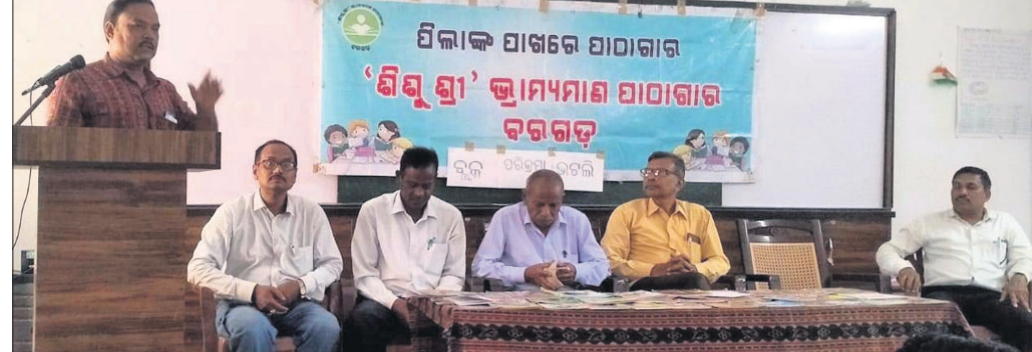
ପିଲାଙ୍କ ପାଖରେ ପାଠାଗାର କାର୍ଯ୍ୟକ୍ରମରେ ମଞ୍ଚାସୀନ ଅତିଥିବୃନ୍ଦ।

ପୁସ୍ତକ ବ୍ୟକ୍ତିର ଉଚ୍ଚାରଣ ଶୁଦ୍ଧ କରିଥାଏ। ଜ୍ଞାନ ଆହରଣର ଏକ ଅପୂର୍ବ ସୁଯୋଗ ସୃଷ୍ଟି କରି ବ୍ୟକ୍ତିକୁ ଚରିତ୍ରବାନ୍ କରି ଗଠିତୋଳିଥାଏ। ସାମ୍ପ୍ରତିକ ସମୟରେ ଏପରି କାର୍ଯ୍ୟକ୍ରମର ଯଥେଷ୍ଟ ଆବଶ୍ୟକତା ରହିଛି ବୋଲି 'ଶିଶୁଶ୍ରୀ' ଭ୍ରାମ୍ୟମାଣ ପାଠାଗାରର ବୁକ୍ ପରିକ୍ରମା ଅବସରରେ ବରଗଡ଼ ଜିଲ୍ଲା ଭଗଲି ଛିଡ଼ ସରକାରୀ ଉଚ୍ଚ ବିଦ୍ୟାଳୟରେ ଆୟୋଜିତ 'ପିଲାଙ୍କ ପାଖରେ ପାଠାଗାର' କାର୍ଯ୍ୟକ୍ରମରେ ମତପ୍ରକାଶ ପାଇଛି।