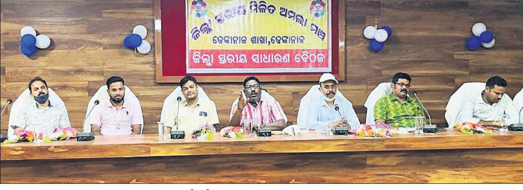
ବୈଠକରେ ଜିଲ୍ଲାସ୍ତରୀୟ ମିଳିତ ଅମଳା ମଞ୍ଚର କର୍ମକର୍ମୀମାନେ।