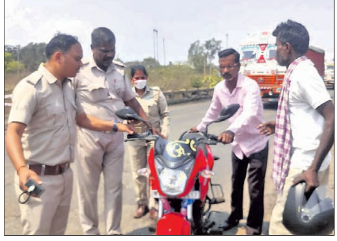
ପରିବହନ ବିଭାଗ ପକ୍ଷରୁ ଗାଡ଼ି ଯାଞ୍ଚ କରାଯାଇଛି।

ଗାଡ଼ିଚାଳକ ଫୁଲ୍ କରିଦେଉଛନ୍ତି ଗ୍ରାମିକ ନିୟମ। ଗ୍ରାମିକ ପୋଲିସ୍ରେ ଲାଇସେନ୍ସ ରଦ୍ଦ କରାଯାଇଛି।