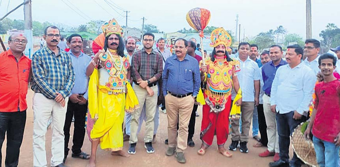
ଭୁବନେଶ୍ୱର, (ବୁଧୋ)/ଭୁବନ, ୨୫ମାର୍ଚ୍ଚ (ବି.ଏ.ଏ.)