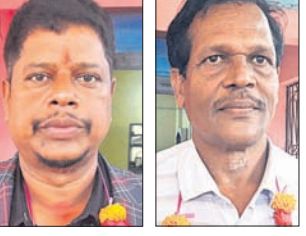
କାମାକ୍ଷାନଗର ବାର୍ଡ ଆସୋସିଏଟନ ସଭାପତି ଏବଂ ସମ୍ପାଦକ।

ଅଧିକାଂଶ କାମାକ୍ଷା ପ୍ରସାଦ ବାର୍ଡ ଜଣାଛନ୍ତି। ସୋମବାର ସଂଘ କାର୍ଯ୍ୟାଳୟ ପରିସରରେ ଶପଥ ଗ୍ରହଣ ଉତ୍ସବ ଅନୁଷ୍ଠିତ ହେବ ବୋଲି ସୂଚନା ଦିଆଯାଇଛି।