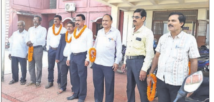
ଭୁବନ ଓକିଲ ସଂଘର ନବ ନିର୍ବାଚିତ କର୍ମକର୍ମୀମାନେ।