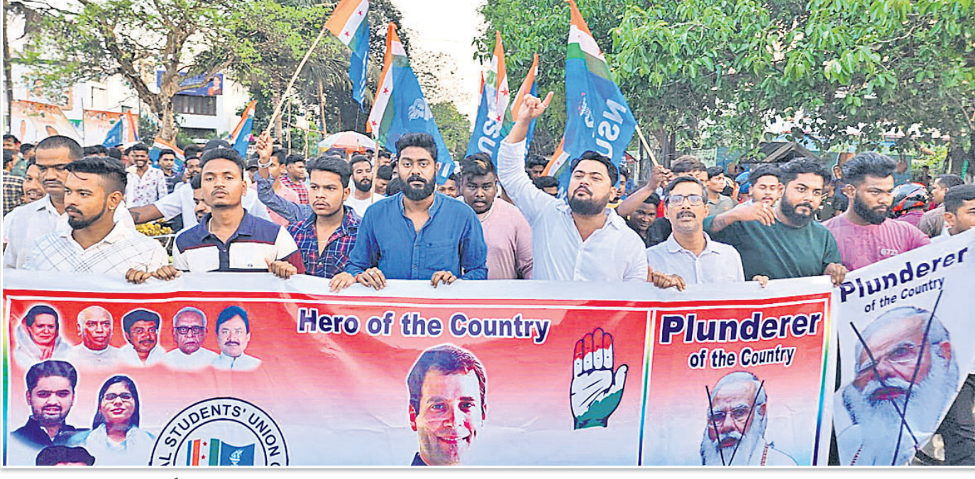
ରାହୁଲ ଗାନ୍ଧୀଙ୍କୁ ୨ ବର୍ଷ ଜେଲ ଓ ଏମ୍ପି ପଦ ରଦ୍ଦ ପ୍ରତିବାଦରେ ଶନିବାର ପ୍ରଦେଶ ଛାତ୍ର କଂଗ୍ରେସ ପକ୍ଷରୁ ଭୁବନେଶ୍ୱର ମାଷ୍ଟରକ୍ୟାଣ୍ଟିନ ଛକରେ ବିକ୍ଷୋଭ କରାଯାଇଛି।