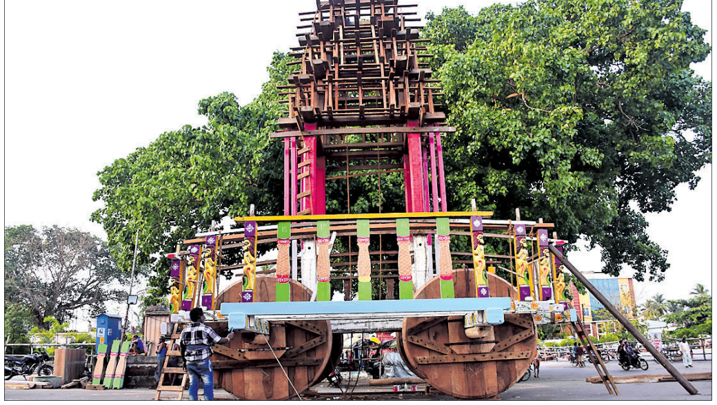
ପୁରୁଣା ଭୁବନେଶ୍ୱର, ୨୫.୩.୨୩ (ବି.ଏନ୍.ଏ.)

ଶ୍ରୀ ଲିଙ୍ଗରାଜଙ୍କ ରୁକୁଣା ରଥଯାତ୍ରା ଆସନ୍ତା ୨୯ ତାରିଖରେ ଅନୁଷ୍ଠିତ ହେବ।