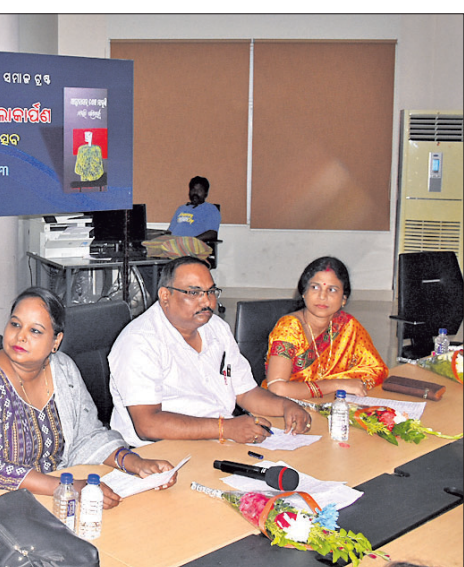
ଭୁବନେଶ୍ୱର ସାହିତ୍ୟ ସମାଜ ଟ୍ରଷ୍ଟ ପକ୍ଷରୁ ଶନିବାର ଗଣ୍ଠ ପୁସ୍ତକ ଲୋକାର୍ପଣ ଓ ଲେଖା ପାଠୋତ୍ସବରେ ଉପସ୍ଥିତ ଅତିଥିମାନେ।

ସେହିପରି ଛାତ୍ରୀମାନେ ସ୍ୱପ୍ନ ଦେଖିବାକୁ ପାରିବେ। ନିଜ ଜୀବନ ପରିବର୍ତ୍ତନ ପାଇଁ ସମସ୍ତଙ୍କ ସାମର୍ଥ୍ୟ ଅଛି, ଆମ ଜାତିର ଭବିଷ୍ୟତକୁ ଛାତ୍ରୀମାନେ ହିଁ ପରିବର୍ତ୍ତନ କରିପାରିବେ ବୋଲି ନବୀନ କହିଥିଲେ।