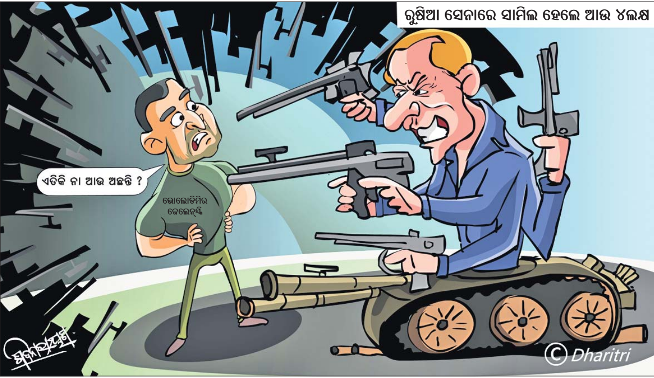
ରୁଷିଆ ସେନାରେ ସାମିଲ ହେଲେ ଆଉ ୪ଲକ୍ଷ