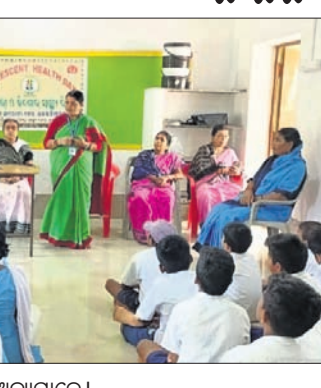
କାର୍ଯ୍ୟକ୍ରମରେ ସାମ୍ଲ୍ୟକର୍ମୀ, ଛାତ୍ରଛାତ୍ରଣୀ ସହ ଅନ୍ୟମାନେ।