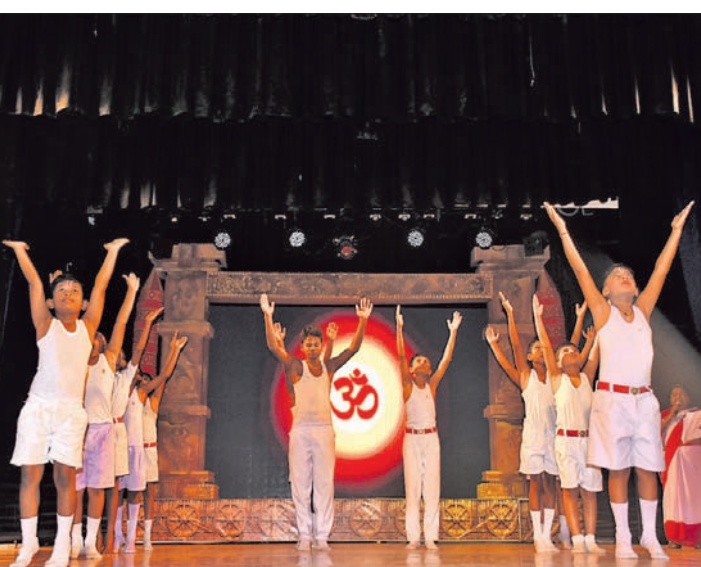
ଭୁବନେଶ୍ୱର ଭଞ୍ଜକଳା ମଣ୍ଡପରେ ଶନିବାର ଅନୁଷ୍ଠିତ ଚରଣାକାଶ୍ ପାଠୋତ୍ସବର ସରସ୍ୱତୀ ଶିଶୁ ବିଦ୍ୟା ମନ୍ଦିରର ବାର୍ଷିକ ଉତ୍ସବରେ ପିଲାମାନେ ନୃତ୍ୟ ପରିବେଷଣ କରୁଛନ୍ତି।