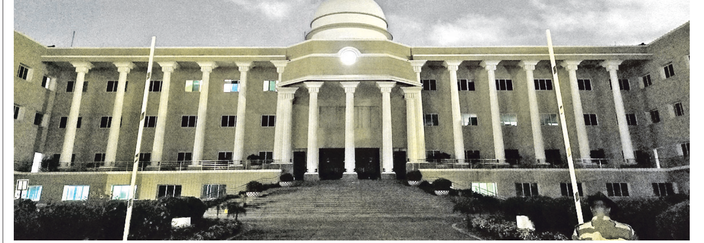
'ଆର୍ଥ ଆଞ୍ଚାର' ଅବସରରେ ଶନିବାର ରାତି ସାଢ଼େ ୮ଟାକୁ ସାଢ଼େ ୯ଟା ପର୍ଯ୍ୟନ୍ତ ଭୁବନେଶ୍ୱରସ୍ଥିତ କମିଶନରେଟ ପୋଲିସ ପୁଖ୍ୟାଳୟରେ ବିଦ୍ୟୁତ୍ ଆଲୋକ ବନ୍ଦ କରାଯାଇଛି।