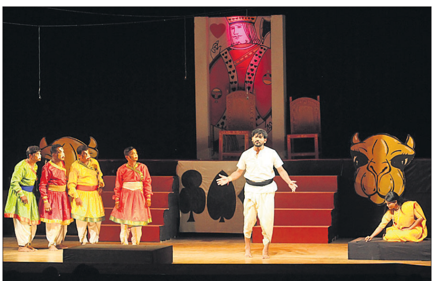
ବିଶ୍ୱ ନାଟ୍ୟ ଦିବସର ଶନିବାର ଭୁବନେଶ୍ୱର ରାଜ୍ୟ ମଣ୍ଡପରେ ପରିବେଷିତ ନାଟକ 'ଜଣେ ରାଜା ଥିଲେ'ର ଏକ ଦୃଶ୍ୟ।