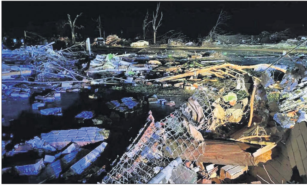
ବାତ୍ୟା ଯୋଗୁ ମିସିସିପିର ରୋଲିଙ୍ଗ ଫର୍ଟ ସହର ଧ୍ୱସ୍ତବିଧ୍ୱସ୍ତ ହୋଇଯାଇଛି।