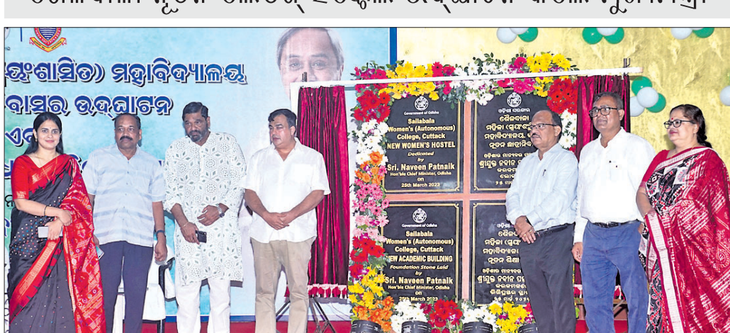
ଶୈଳବାଳା ନୂତନ ଲେଡିଜ୍ ହଷ୍ଟେଲର ଉଦ୍ଘାଟନ କାର୍ଯ୍ୟକ୍ରମରେ ଉପସ୍ଥିତ ଅତିଥିମଣ୍ଡଳ।

ଶୈଳବାଳା ସ୍ୱୟଂସାଧିତ ମହିଳା ମହାବିଦ୍ୟାଳୟରେ ୪୦୦ ସିଟ୍ ବିଶିଷ୍ଟ ଲେଡିଜ୍ ହଷ୍ଟେଲକୁ ଅନୁଲାଇନ୍ରେ ଶନିବାର ପୁଖ୍ୟମନ୍ତ୍ରୀ ଉଦ୍ଘାଟନ କରିଛନ୍ତି।