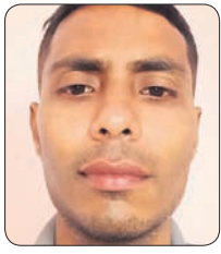
କିଶୋର ପାଣି, ଭୁବନେଶ୍ୱର