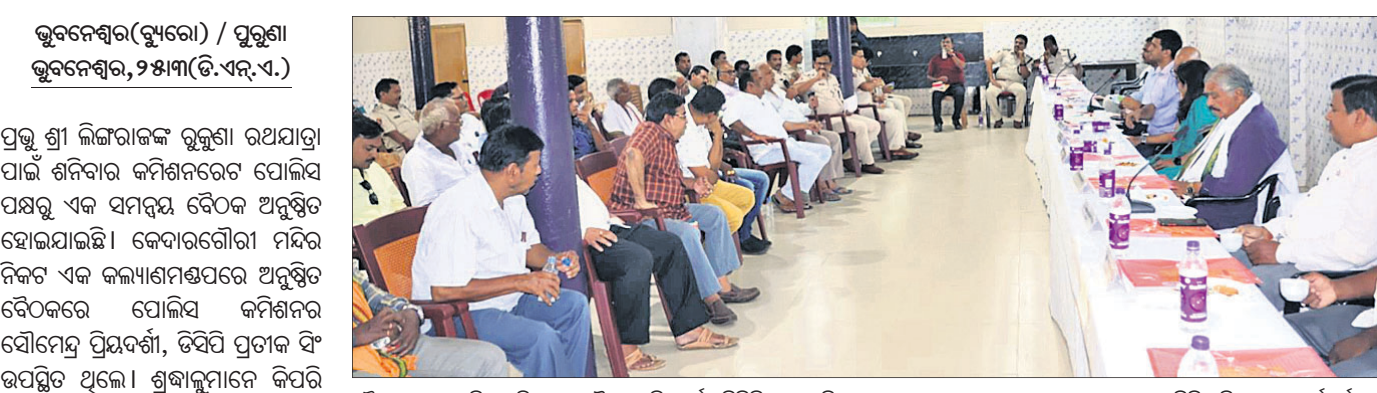
ଭୁବନେଶ୍ୱର(ବୁଧବେଳା) / ପୁରୁଣା ଭୁବନେଶ୍ୱର, ୨୫.୩.୨୩(ବି.ଏନ୍.ଏ.)

ଶ୍ରୀ ଲିଙ୍ଗରାଜଙ୍କ ରୁକୁଣା ରଥଯାତ୍ରା ଆସନ୍ତା ୨୯ ତାରିଖରେ ଅନୁଷ୍ଠିତ ହେବ।