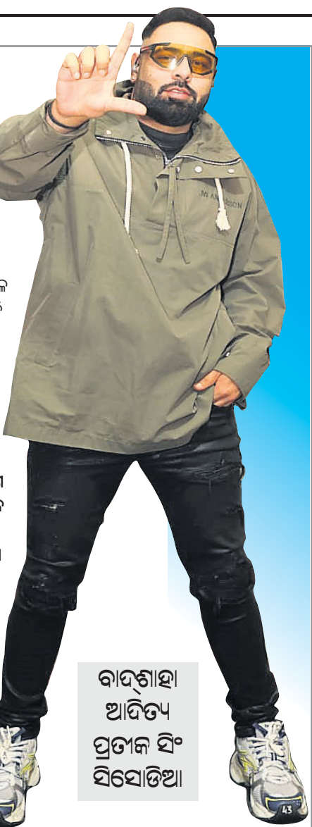
ବାଦ୍‌ଶାହା ଆଦିତ୍ୟ ପ୍ରତାପ ସିଂହ ସିଂହାଦିଆ

ନିକଟତର ହୋଇପାରିବ? କ୍ୟାକଲିନିକ ସହ କୋଲୋବରେଶନ ସବୁବେଳେ ବ୍ୟକ୍ତ ହେଉଛି।