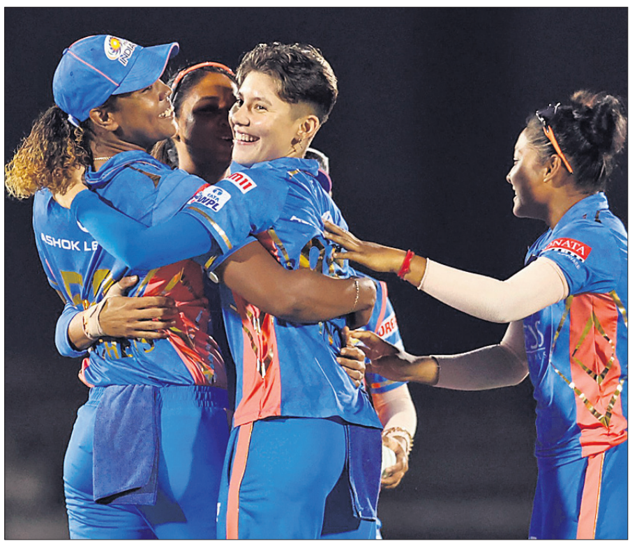
ଉତ୍ତମ ଲେଖକଙ୍କ ଦେବା ପରେ ଇସି ଓଇଟି ମାଧ୍ୟମରେ ଚାମ୍ପିୟନ ହେବା ପରେ ମୁମ୍ବାଇ ଇଣ୍ଡିଆନ୍ସ ଟୀମର ଖେଳାଳିମାନଙ୍କର ପ୍ରତିମା।

ମୁମ୍ବାଇ, ୨୬ତମ ମହିଳା ପ୍ରିମିୟର ଲିଗ୍ (ଡବ୍ଲ୍ୟୁପିଏଲ୍)ର ପ୍ରଥମ ସଂସ୍କରଣରେ ମୁମ୍ବାଇ ଇଣ୍ଡିଆନ୍ସ ଚାମ୍ପିୟନ ହୋଇଛି। ଇସି ଓଇଟି ମାଧ୍ୟମରେ ଚମତ୍କାର ବୋଲି ଏବଂ ନାଟାଲି ଷ୍ଟିଭର-ବ୍ରଣ୍ଡଙ୍କ ଯୋଗ୍ୟତାକୁ ଅର୍ଦ୍ଧଶତକ ସହାୟତାରେ ଏହି ଦଳ ରବିବାର ଅନୁଷ୍ଠିତ ଫାଇନାଲରେ ଦିଲ୍ଲୀ କ୍ୟାପିଟାଲ୍ସକୁ ୬ ରନରେ ହରାଇ ପରାସ୍ତ କରିଛି। ଦିଲ୍ଲୀ କ୍ୟାପିଟାଲ୍ସ ୨୦ ଓଭରରେ ୯ ରନରେ ହରାଇ ୧୩୧