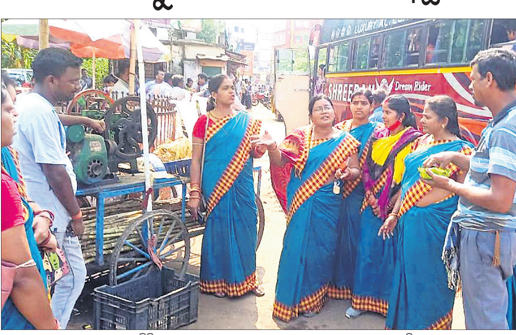
ଆଖୁରସ ବିକ୍ରି କରୁଥିବା ଜଣେ ବ୍ୟବସାୟୀଙ୍କୁ ସ୍ୱଚ୍ଛସାଥୀମାନେ ସଚେତନ କରାଉଛନ୍ତି।