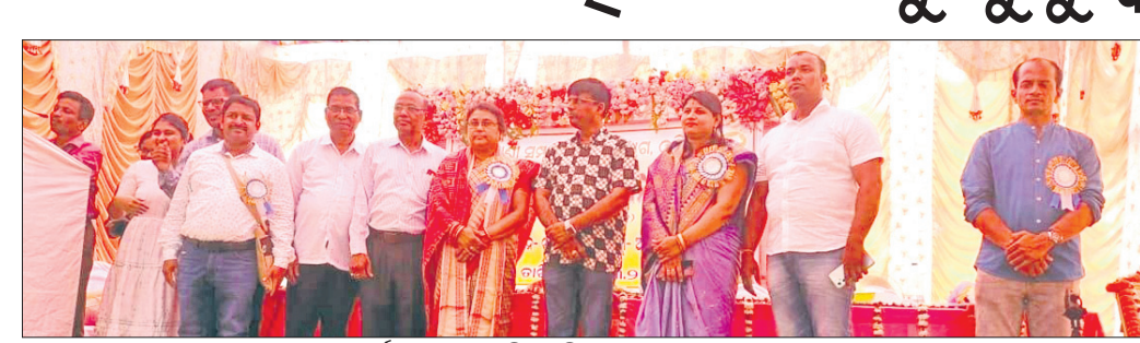
କାର୍ଯ୍ୟକ୍ରମରେ ଉପସ୍ଥିତ ଅତିଥିଙ୍କ ସମେତ ଅନ୍ୟମାନେ।