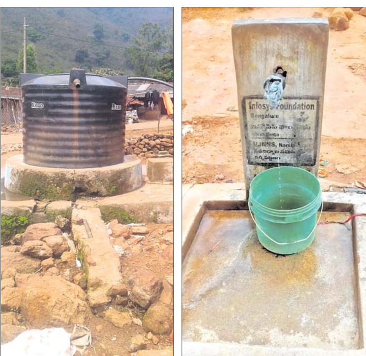
ନନ୍ଦପୁର ବ୍ଲକ୍ ଗୋଲୁର ପଞ୍ଚାୟତର ରାଜପାଡ଼ ଗ୍ରାମରେ ଆନ୍ତର ଅନୁପ୍ରବେଶ ପାନୀୟ ଜଳ ପ୍ରକଳ୍ପ।