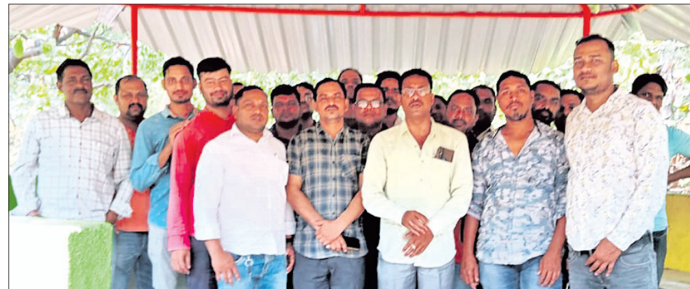
ବୈଠକରେ ଏଲ୍ଏପି କ୍ଷତିଗ୍ରସ୍ତ ପ୍ରଜାସଂଘର ସଦସ୍ୟମାନେ।

ନବରତ୍ନ କମ୍ପାନୀ ନାଲକୋ ବିରୋଧରେ ପୁନର୍ବାର ଅସନ୍ତୋଷ ଝାଡ଼ିଲେ ନାଲକୋ ସୋନୁପୁରୀ ଆଇଟିଆଇ (ଏଲ୍ଏପି) କ୍ଷତିଗ୍ରସ୍ତ ପ୍ରଜାସଂଘ। କମ୍ପାନୀ କର୍ତ୍ତୃପକ୍ଷ ନିୟୁତ୍ ପ୍ରତିଷ୍ଠିତ ଦେଇ ଦିନ ଗଢ଼ାଇ ଚାଲିଛନ୍ତି। ଫଳରେ ୧୯୮ କ୍ଷତିଗ୍ରସ୍ତଙ୍କ ଭବିଷ୍ୟତ ଅନ୍ଧକାର ଆଡ଼କୁ ଠେଲି ହୋଇଯାଇଛି। ଦାଦି ପୁରଣ ନ ହେଲେ କମ୍ପାନୀକୁ ବୋଇଲାଇ, ପାଣି ବନ୍ଦ କରାଯିବ। ୩୯ ଗ୍ରାମର କ୍ଷତିଗ୍ରସ୍ତ ପରିବାର କାରଖାନାର ସମସ୍ତ ପ୍ରବେଶ ପଥରେ ଗୋରୁ ବାନ୍ଧି ପ୍ରତିବାଦ କରିବେ ବୋଲି ଚେତାବନୀ ଦେଇଛନ୍ତି।