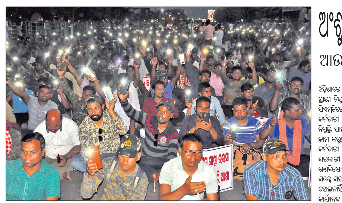
ଆନ୍ଦୋଳନର ସ୍ୱତନ୍ତ୍ର ଦିନରେ ମୋବାଇଲ୍ ଫୋନ୍ ଚଳାଇ ଲାଇଟ୍ ଜଳାଇ ପ୍ରତିବାଦ କରୁଛନ୍ତି ଆନ୍ଦୋଳନର କର୍ମଚାରୀ।