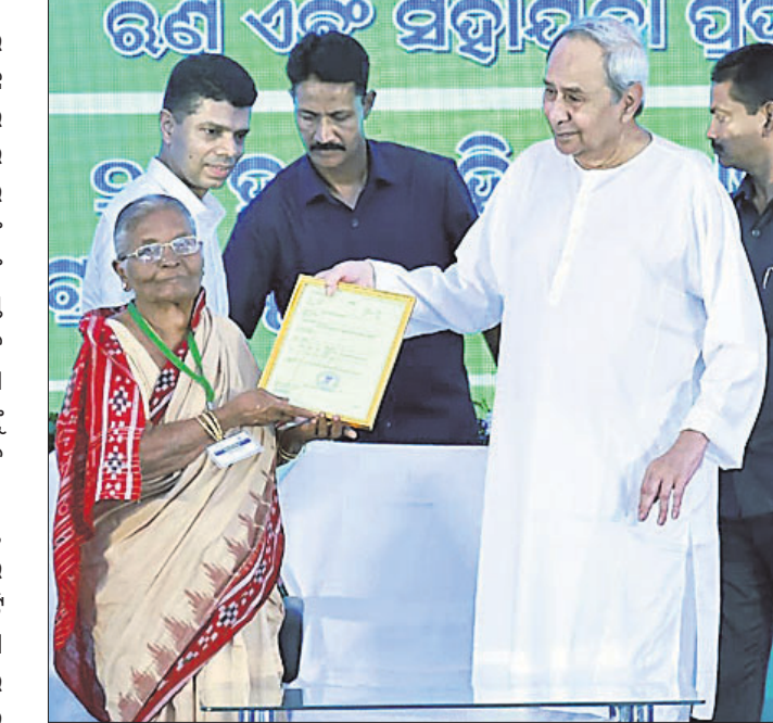
ଛତ୍ରପୁରଠାରେ ଜଣେ ମହିଳାଙ୍କୁ ମୁଖ୍ୟମନ୍ତ୍ରୀ ନବୀନ ପଟ୍ଟନାୟକ ରବିବାର ଜମି ପଞ୍ଚା ପ୍ରଦାନ କରୁଛନ୍ତି।

ମୁଖ୍ୟମନ୍ତ୍ରୀ କବିସୂର୍ଯ୍ୟନଗର, ହିତାଧିକାରୀଙ୍କୁ ଓ ଛତ୍ରପୁର ଆଦି ସ୍ଥାନରେ ୨୦୦୦ କୋଟି ଟଙ୍କାର ୮୨୫ଟି ବିଭିନ୍ନ ପ୍ରକଳ୍ପର ଶୁଭାରମ୍ଭ କରିଥିଲେ। ଛତ୍ରପୁରରେ ୧୦୦୦ କୋଟି, ହିତାଧିକାରୀରେ ୫୯୦ କୋଟି ଓ କବିସୂର୍ଯ୍ୟନଗରରେ ୩୧୬ କୋଟିରୁ ଅଧିକ ଟଙ୍କାର ପ୍ରକଳ୍ପ ଶୁଭାରମ୍ଭ କରାଯାଇଛି। ଗଞ୍ଜାମରେ ପ୍ରାୟ ୨୦୫୦ କୋଟିରୁ ଅଧିକ ଟଙ୍କାର ଉଦ୍ଘାଟନ ପଞ୍ଚା ପ୍ରଦାନ କରାଯାଇଛି। ଛତ୍ରପୁରରେ ୩୫୦୦ ପଞ୍ଚା, ହିତାଧିକାରୀରେ ୪୫୦୦ ପଞ୍ଚା ଓ କବିସୂର୍ଯ୍ୟନଗରରେ ୧୧ ହଜାରରୁ ଅଧିକ ପଞ୍ଚା ବନ୍ଧାଯାଇଛି। ୨୨ହଜାର