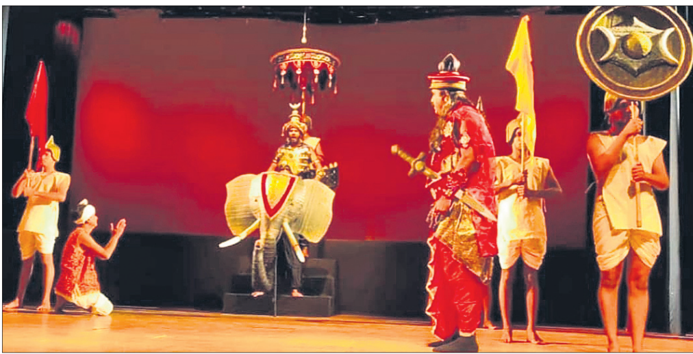
'ଆରୁତାର' ପକ୍ଷରୁ ମଞ୍ଚକୁ ନାଟକ 'ପୌରଣ'ର ଏକ ଦୃଶ୍ୟ।