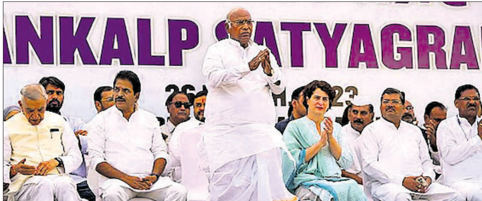
ନୂଆଦିଲ୍ଲୀର ରାଜ୍ୟପାଳ ପରିସର ବାହାରେ ରବିବାର କଂଗ୍ରେସ ପକ୍ଷରୁ କରାଯାଇଥିବା ସଂକଳ୍ପ ସତ୍ୟାଗ୍ରହରେ ଉପସ୍ଥିତ ବଳର ନେତୃ ମଣ୍ଡଳ।