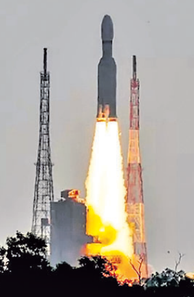
ନିମ୍ନ କକ୍ଷପଥ (ଏଲ୍‌ଭିଏମ୍)ରେ ୩୬ ସାଟେଲାଇଟ୍ ସ୍ଥାପନ କରିବା ପାଇଁ ଇଣ୍ଡିଆନ୍ ସ୍ପେସ୍ ଟ୍ରାକ୍ଟର ଟ୍ରାକ୍ଟର-୨