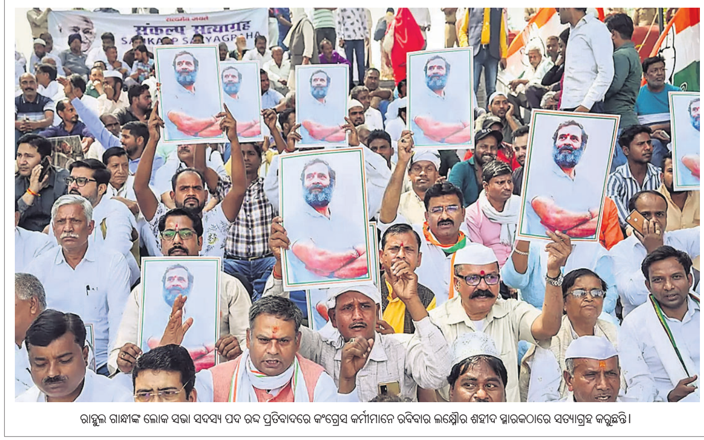
ରାହୁଲ ଗାନ୍ଧୀଙ୍କ ଲୋକ ସଭା ସଦସ୍ୟ ପଦ ରଦ୍ଦ ପ୍ରତିବାଦରେ କଂଗ୍ରେସ କର୍ମୀମାନେ ରବିବାର ଲକ୍ଷ୍ନୌର ଶହାଦ ସ୍ମାରକଠାରେ ସତ୍ୟାଗ୍ରହ କରୁଛନ୍ତି।

ବାରାଣସୀ, ୨୬ମାର୍ଚ୍ଚ: ବାରାଣସୀର ଏକ ହୋଟେଲରେ ରବିବାର ଭୋଜପୁରି ଅଭିନେତ୍ରୀ ଆକାଂକ୍ଷା ଦୁବେଙ୍କ ମୃତଦେହ ଯୋଗ୍ୟତା ନିର୍ଦ୍ଧାରିତ। ମୃତଦେହ ଅଭିନେତ୍ରୀ ସାହିଥିବା ଏହି ୨୫ ବର୍ଷୀୟା ଆତ୍ମହତ୍ୟା କରିଥିବା ପୋଲିସ୍ ସମେତ କରୁଛି। ଘଟଣାର ପ୍ରାଥମିକ ତତ୍ତ୍ୱ ଜାରି ଥିବାବେଳେ ମୃତଦେହକୁ ପୋଷ୍ଟମର୍ଟମ୍ ପାଇଁ ପଠାଇ ଦିଆଯାଇଛି। ଗୁମ୍ଫରେ ଆକାଂକ୍ଷାଙ୍କ ଝୁଲଣା ମୃତଦେହ ଦେଖି ହୋଟେଲ କର୍ମଚାରୀ ପୋଲିସ୍‌କୁ ସୂଚନା ଦେଇଥିଲେ। ଆକାଂକ୍ଷା ଅନେକ ଭୋଜପୁରି ଫିଲ୍ମ, ମ୍ୟୁଜିକ୍ ଭିଡିଓରେ କାମ କରିଛନ୍ତି।