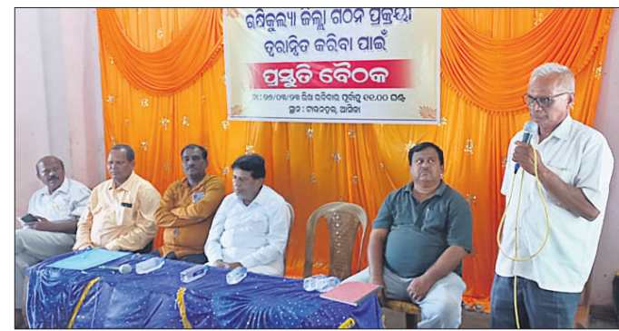
କାର୍ଯ୍ୟକ୍ରମରେ ମହାସାଧନ ଅତିଥି।