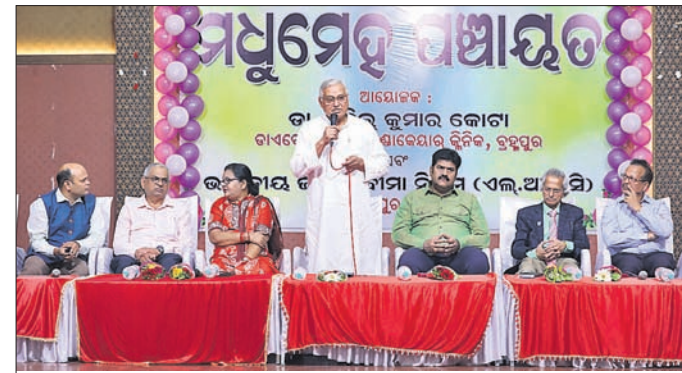
କାର୍ଯ୍ୟକ୍ରମରେ ଉପସ୍ଥିତ ଅତିଥି କୁ।

ଖଲିକୋଟ ବିଜ୍ଞାପିତ ଅଞ୍ଚଳ ପରିଷଦ, ଶଙ୍କର ଚନ୍ଦ୍ର ଚିକିତ୍ସାଳୟ ସମରକ୍ଷୋଳ