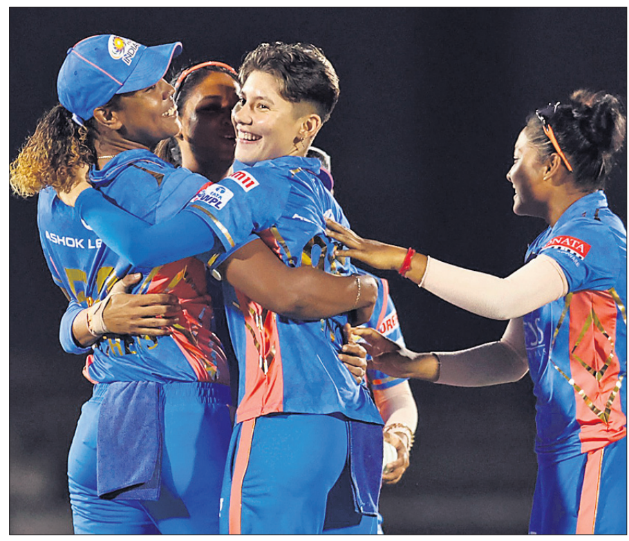
ଇଲକେଟ ନେବା ପରେ ଇସି ଓଫ୍ କ୍ୟାପିଟାଲ୍ସ ପାଇଁ ଖେଳାଳିଙ୍କ ବ୍ୟବସ୍ଥା।

ମୁମ୍ବାଇ, ୨୬ତମ ମହିଳା ପ୍ରିମିୟର ଲିଗ୍ (ତନ୍ୟାପିଏଲ୍)ର ପ୍ରଥମ ସଂସ୍କରଣରେ ମୁମ୍ବାଇ ଇଣ୍ଡିଆନ୍ସ ଚାମ୍ପିୟନ ହୋଇଛି। ଇସି ଓଫ୍ ଓ ହିଲି ମାଧୁସୂଦନ ଚମ୍ପକାର ବୋଲି ଏବଂ ନାତାଲି ସିଭର-ବ୍ରହ୍ମଙ୍କ ଯୋଗ୍ୟପୂର୍ଣ୍ଣ ଅର୍ଦ୍ଧଶତକ ସହାୟତାରେ ଏହି ଦଳ ରବିବାର ଅନୁଷ୍ଠିତ ଫାଇନାଲରେ ଦିଲ୍ଲୀ କ୍ୟାପିଟାଲ୍ସକୁ ୬ ରନରେ ପରାସ୍ତ କରିଛି। ଦିଲ୍ଲୀ କ୍ୟାପିଟାଲ୍ସ ୨୦ ଓଭରରେ ୯ ରନରେ ହରାଇ ୧୩୧