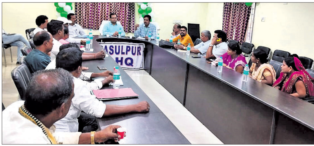
ସୌର ଶୀତଳ କକ୍ଷ ସ୍ଥାପନ ପାଇଁ ଅନୁଷ୍ଠିତ ସମୀକ୍ଷା ବୈଠକ।

୨୦୨୨ ବର୍ଷରେ ରାଜ୍ୟରେ ପ୍ରଥମ ବର୍ଷରେ ୧୦୦୦ଟି ସୌରଗାଳିତ ଶୀତଳ କକ୍ଷ ସ୍ଥାପନ ପାଇଁ ଲକ୍ଷ୍ୟ ରଖାଯାଇଥିଲା।