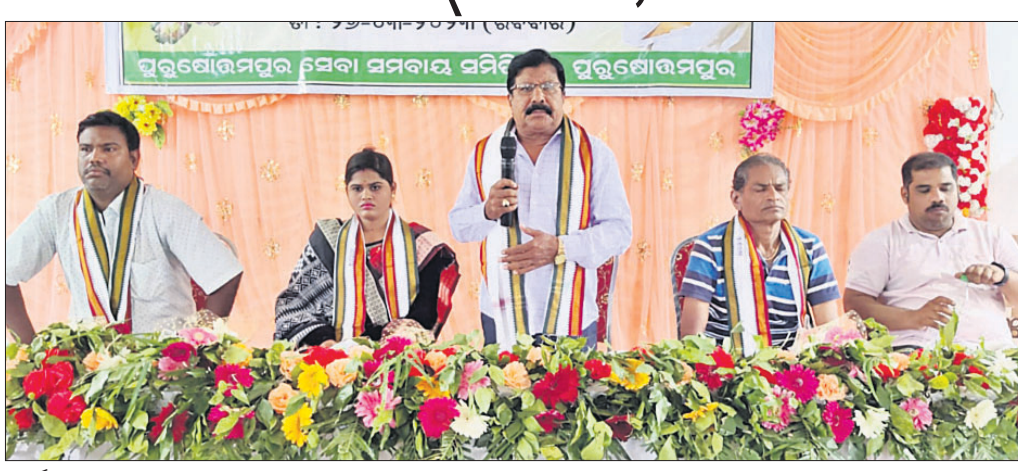
କାର୍ଯ୍ୟକ୍ରମରେ ଉପସ୍ଥିତ ଅତିଥି।