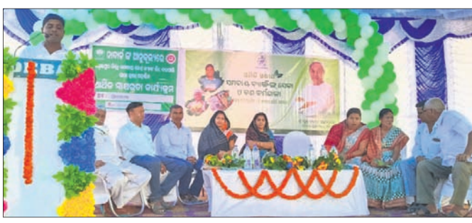
କାର୍ଯ୍ୟକ୍ରମରେ ମଞ୍ଚାସୀନ ଅତିଥିବୃନ୍ଦ ।