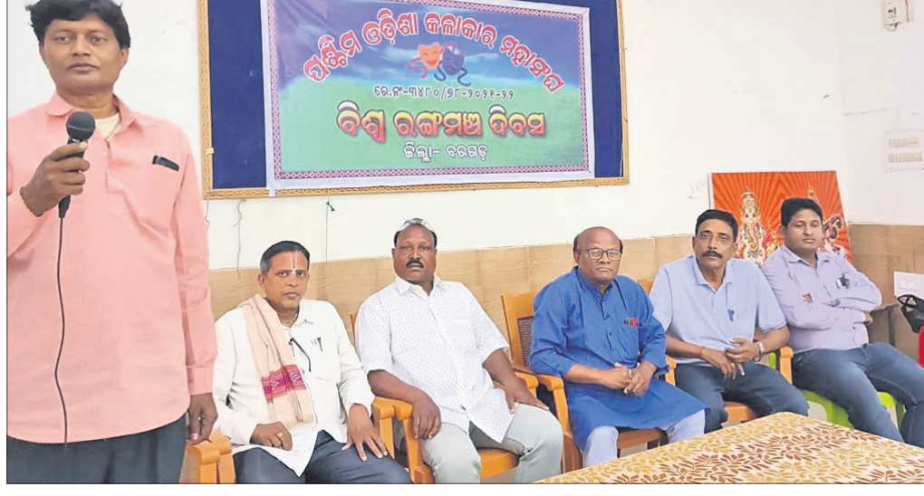
ବିଶ୍ୱ ରଙ୍ଗମଞ୍ଚ ଦିବସ ପାଳନ କାର୍ଯ୍ୟକ୍ରମରେ ମଞ୍ଚାସୀନ ଅତିଥିବୃନ୍ଦ ।

ଜଣେ ଅଭିନେତା ପାଇଁ ନିଶ୍ଚୟ ଅଭିନୟ କରିବାର ପ୍ରକୃଷ୍ଟ ମଞ୍ଚ ହେଉଛି ରଙ୍ଗମଞ୍ଚ । ରଙ୍ଗମଞ୍ଚର ଦର୍ଶକଙ୍କ ରଚିତ, ଅନୁଭୂତି ଭିନ୍ନ ଦର୍ଶକଙ୍କ ରଚିତ, ଅନୁଭୂତିକୁ ସମ୍ମାନ ଜଣାଇ ନିଶ୍ଚୟ ଅଭିନୟର ଆବଶ୍ୟକତା ରହିଥିବା ବେଳେ ମଞ୍ଚ କଳାକାର ବଞ୍ଚେଲେ ରଙ୍ଗମଞ୍ଚ ବଞ୍ଚିବ ବୋଲି ପଶ୍ଚିମ ଓଡ଼ିଶା କଳାକାର ମହାସଂଘ ଆନୁକୂଲ୍ୟରେ ଅନୁଷ୍ଠିତ ବିଶ୍ୱ ରଙ୍ଗମଞ୍ଚ ଦିବସ ପାଳନ ଅବସରରେ ମତପ୍ରକାଶ ପାଇଛି ।