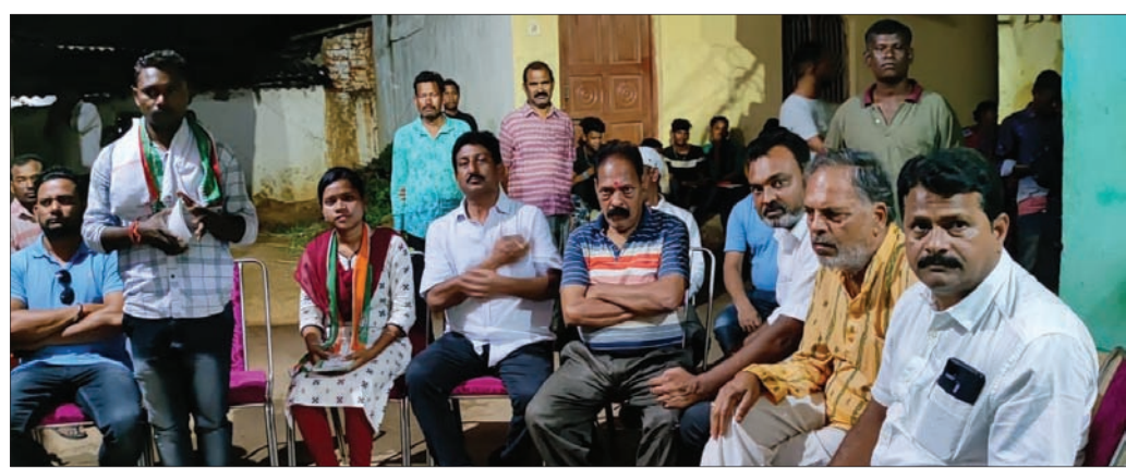
କଂଗ୍ରେସ ପ୍ରାର୍ଥୀ ସଭା କରି ପ୍ରଚାର କରୁଛନ୍ତି ।