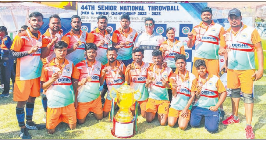
ଜାତୀୟ ସିନିୟର ଥ୍ରୋ ବଲ୍ରେ ବ୍ରୋଞ୍ଜ ପଦକ ଜିତିଥିବା ଓଡ଼ିଶା ପୁରୁଷ ଦଳ।

ଭୁବନେଶ୍ୱର, ୨୮ମାର୍ଚ୍ଚ (କ୍ରୀଡା ପ୍ରତିନିଧି) ବିହାରର ଗୋପାଳଗଞ୍ଜଠାରେ ଅନୁଷ୍ଠିତ ୪୪ତମ ଜାତୀୟ ସିନିୟର ଥ୍ରୋ ବଲ୍ ଚାମ୍ପିୟନଶିପରେ ଓଡ଼ିଶା ପୁରୁଷ ଦଳ ବ୍ରୋଞ୍ଜ ପଦକ ହାସଲ କରିଛି। ନିଜ ପୁଲ୍‌ରେ ସମଗ୍ର ମ୍ୟାଚ