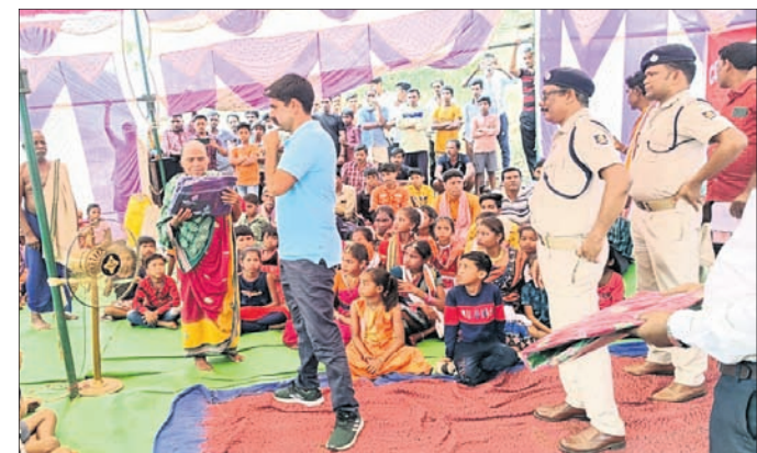
ଜୟପୁରଠାରେ ବରଗଡ଼ ଏସ୍‌ପି ଗ୍ରାମବାସୀଙ୍କୁ ଉପକରଣ ବାଣ୍ଟୁଛନ୍ତି ।

ବରଗଡ଼ ଜିଲ୍ଲା ପଦ୍ମପୁର ବୁଡେନ ଥାନା ଅଧୀନ ମାଠବାଦୀ ଉପତ୍ରୁତ ଅଞ୍ଚଳ ଜୟପୁର, ବରପାପାଲି ଗ୍ରାମବାସୀଙ୍କୁ ନେଇ ଜୟପୁରଠାରେ ପୋଲିସ ପକ୍ଷରୁ ନୂଆ ମନ, ନୂଆ ସପନ କାର୍ଯ୍ୟକ୍ରମ ମଙ୍ଗଳବାର ଅନୁଷ୍ଠିତ ହୋଇଥିଲା ।