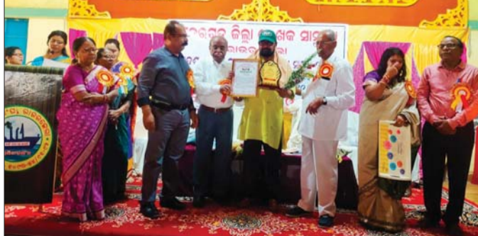
କବି ପ୍ରଶାନ୍ତ ମିଶ୍ରଙ୍କୁ ସମ୍ମାନିତ କରୁଛନ୍ତି ଅତିଥି।