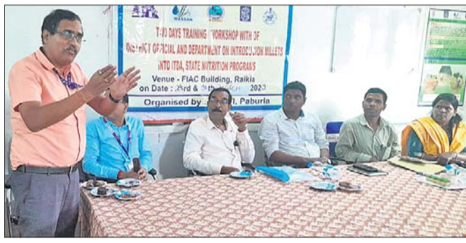
କର୍ମଶାଳାରେ ଉପସ୍ଥିତ ଅତିଥି।

ରାଜକିଆ ବ୍ଲକ୍ କୃଷି ବିଭାଗ ପ୍ରଶିକ୍ଷକ କେନ୍ଦ୍ରର ସ୍ୱାଗତ ପକ୍ଷରୁ କ୍ଷୁଦ୍ର ଦାନା ଶସ୍ୟ ଓ ପୋଷଣ ସମ୍ବନ୍ଧୀୟ କର୍ମଶାଳା ଆରମ୍ଭ ହୋଇଛି।