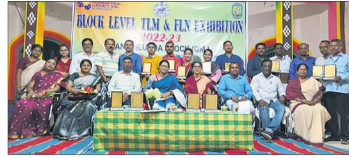
କାର୍ଯ୍ୟକ୍ରମରେ ଉପସ୍ଥିତ ଅତିଥି ଓ ପୁରସ୍କୃତ ପ୍ରତିଭା।