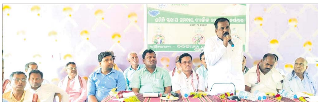
ପୋଲସରାଠାରେ ଅନୁଷ୍ଠିତ ରଣ ମେଳାରେ ଉପସ୍ଥିତ ଅତିଥି।

ପୋଲସରା/ କବିସୂର୍ଯ୍ୟନଗର/ ରମ୍ଭା, ୨୯ମାର୍ଚ୍ଚ(ଡି.ଏନ.ଏ.)