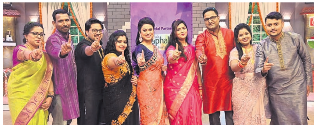
'ଦିନି ନ-୧'ର ସିଜନ୍-୨'ର ଏକ ଦୃଶ୍ୟ