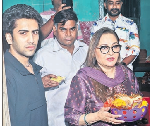
କଟକଚଣ୍ଡୀଙ୍କ ଦର୍ଶନ ପାଇଁ ଆସିଥିବା ଅଭିନେତ୍ରୀ ଜୟାପ୍ରଦା ।