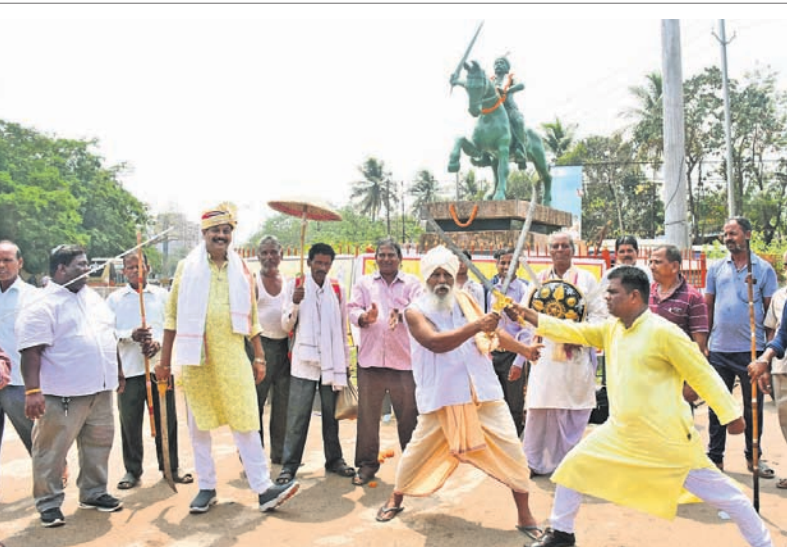
ଭୁବନେଶ୍ୱର ମୁଖିୟମ ହଳଠାରେ ରୁଧିରୀର ନିଷ୍ଠା ଓଡ଼ିଶା ପାଇକ ମହାସଂଘ ପକ୍ଷରୁ ପାଇକ ବିବସ ପାଳନ ଅବସରରେ ସମର କଳା ପ୍ରଦର୍ଶନ କରାଯାଉଛି ।

ସେଲ୍ଫି ପଠାଇବା ସମୟରେ ନିଜର ନାମ ଏବଂ ମୋବାଇଲ ନମ୍ବର ଦେବାକୁ ଭୁଲନ୍ତୁ ନାହିଁ। ଯୋଗ୍ୟ ବିବେଚିତ ଫଟୋ ପ୍ରକାଶ ପାଇବ।