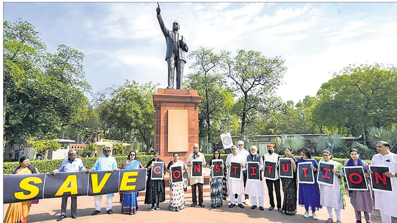
ନୂଆଦିଲ୍ଲୀର ପାଲୀମେଝ ପରିସରରେ ରୁଧିରୀ କଂଗ୍ରେସ ଏମ୍ପିମାନେ 'ସେଭ୍ କନଷ୍ଟିଚ୍ୟୁଶନ୍' ପ୍ଲାକାର୍ଡ ଧରି ବିରୋଧ ପ୍ରଦର୍ଶନ କରୁଛନ୍ତି ।