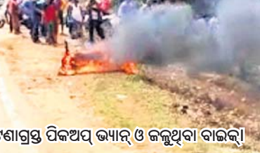
ଦୁର୍ଘଟଣାଗ୍ରସ୍ତ ପିକଅପ୍ ଭ୍ୟାନୁ ଓ ଜଳୁଥିବା ବାଇକ୍।

ବାଲେଶ୍ୱର ଆସୁଥିବା ଏକ ପିକଅପ୍ ଭ୍ୟାନୁ (ନଂ. ଓଡ଼ିଂ୧୭୩-୨୨୪୨) ସେମାନଙ୍କୁ ସାମ୍ବାପରୁ ଧକ୍କା ଦେଇଥିଲା। ବାଇକ୍ରେ କେତେଜଣ ସ୍ୱେଚ୍ଛାସେବୀ ଘଟଣାସ୍ଥଳରେ ପହଞ୍ଚି ମୃତକଙ୍କ ପରିବାର ଲୋକଙ୍କୁ ଖବର ଦେବା ସହ ଶିବ ଦୀପାଳୟ କିପରି ହେବ ଏବଂ ଦୁର୍ଘଟଣାଜନିତ କ୍ଷତିପୂରଣ କିପରି ଚିକିତ୍ସାକର୍ମକୁ ଆଣିଥିଲା। ଚିକିତ୍ସାଧାନ