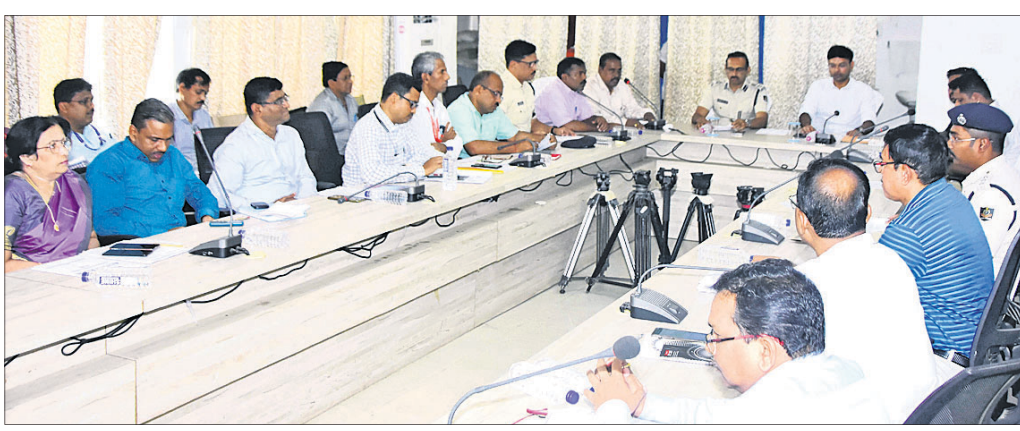
ସର୍କର ହାତସମ୍ପର୍କ ଅନୁଷ୍ଠିତ ରଥଯାତ୍ରା ପ୍ରସ୍ତୁତି ବୈଠକରେ ଉପସ୍ଥିତ ଜିଲାପାଳ, ଏସ୍ପି ଓ ବିଭିନ୍ନ ବିଭାଗର ଅଧିକାରୀ।