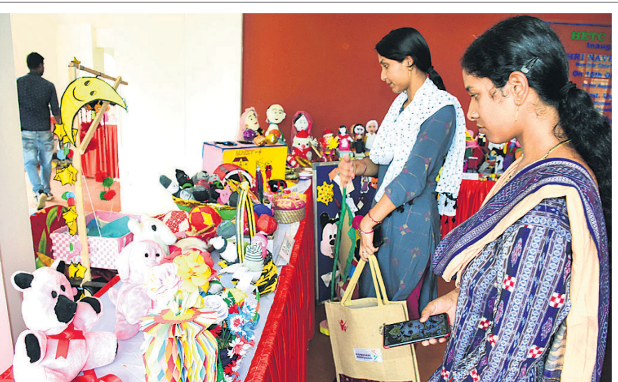
ରାଜ୍ୟପ୍ରଭାସ ପୋଷଣ ପ୍ରକାଶ (ପୁସ୍ତକ ପକ୍ଷ) ପାଳନ ଅବସରରେ ରୁଧିରୀର ଭୁବନେଶ୍ୱର ଲକ୍ଷ୍ମୀସାଗରସ୍ଥିତ ହୋମି ଇକୋନୋମିକ ଟ୍ରେନିଂ ସେଣ୍ଟର (ଏଇଟିସି)ଠାରେ ମହିଳା ଓ ଶିଶୁ ବିକାଶ ବିଭାଗ ପକ୍ଷରୁ ଆୟୋଜିତ ପ୍ରଦର୍ଶନୀକୁ କାର୍ଯ୍ୟକ୍ରମରେ ମହିଳାମାନେ ରୁଚି ଦେଖୁଛନ୍ତି ।