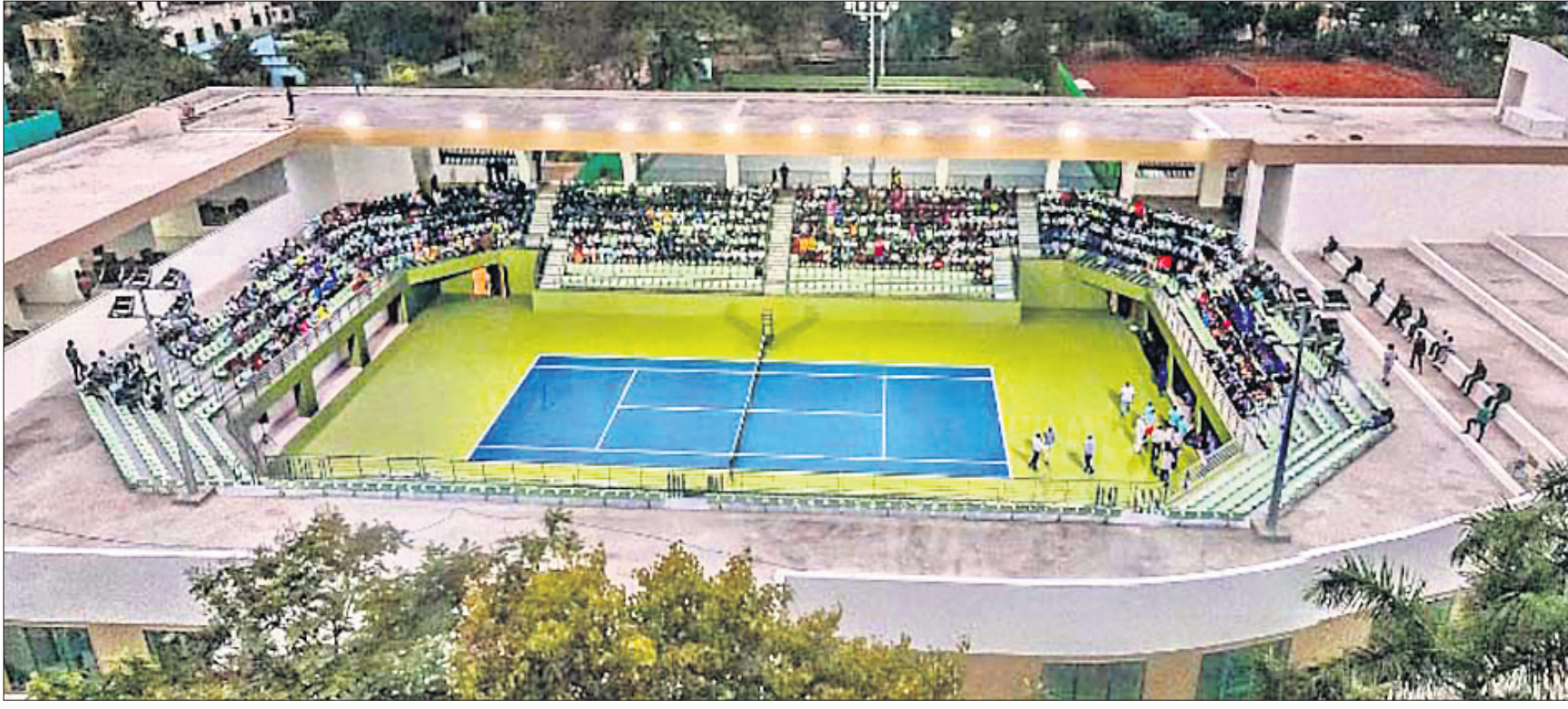
ଉଦ୍‌ଘାଟିତ ଚେନିସ ସେଣ୍ଟର।