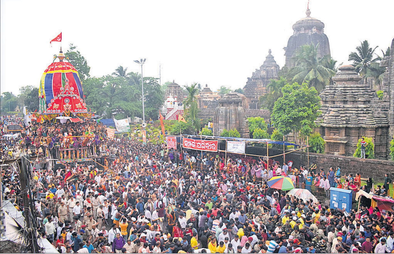
ପବିତ୍ର ଅଶୋକାଷ୍ଟମୀରେ ରୂପବାର ପ୍ରଭୁ ଶ୍ରୀଲିଙ୍ଗରାଜଙ୍କୁ ଭୁକ୍ତ କରିବା ପାଇଁ ଶ୍ରଦ୍ଧାଳୁମାନେ ଚାଣି ମାଉସୀମା ମନ୍ଦିରକୁ ନେଇଛନ୍ତି।

ବଲିଉଡ୍ ଅଭିନେତ୍ରୀ ଅନନ୍ୟା ପାଣ୍ଡେ ବର୍ତ୍ତମାନ ଅଭିନେତା ଆଦିତ୍ୟ ରୟ କପୁରଙ୍କୁ ଡେବି କରୁଥିବା ନେଇ ଚର୍ଚ୍ଚା ଜୋର ଧରିଛି।