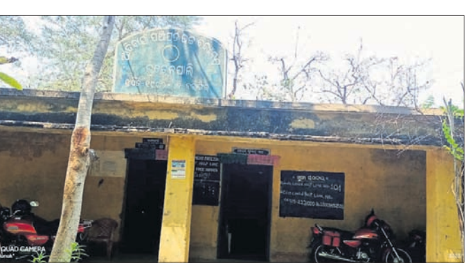
କୁଚେନପାଲି ଆଦିବାସୀ ପଞ୍ଚାୟତ ଉଚ୍ଚ ବିଦ୍ୟାଳୟ।

ବଲାଙ୍ଗୀର ଜିଲ୍ଲା ଲୋଇସିଂହା ବ୍ଲକ ଅନ୍ତର୍ଗତ କୁଚେନପାଲି ଆଦିବାସୀ ପଞ୍ଚାୟତ ଉଚ୍ଚ ବିଦ୍ୟାଳୟ ୨୦୧୬ ମସିହାରୁ ଶତପ୍ରତିଶତ ଅନୁଦାନ ଲାଭ କରି ସାରିଛି। ଇତିମଧ୍ୟରେ ଶିକ୍ଷାନୁଷ୍ଠାନକୁ ୨୭ ବର୍ଷ ହେଲାଣି। ହେଲେ ପ୍ରଶାସନିକ ଓ ରାଜନୈତିକ ଲଘୁଶକ୍ତି ଅଭାବକୁ ବିଦ୍ୟାଳୟକୁ ଅଦ୍ୟାବଧି ବିଦ୍ୟୁତ୍ ସଂଯୋଗ ହୋଇପାରିନାହିଁ। ଅପରପକ୍ଷେ ଛାତ୍ରଛାତ୍ରୀଙ୍କୁ ବୈଷୟିକ ଶିକ୍ଷା ଉପରେ ସରକାର ଗୁରୁତ୍ୱରୋପ କରୁଛନ୍ତି। କିନ୍ତୁ ବିଦ୍ୟୁତ୍ ସେବା ନ ଥିବାରୁ ବିଦ୍ୟାଳୟର ଛାତ୍ରଛାତ୍ରୀମାନେ କମ୍ପ୍ୟୁଟର ଶିକ୍ଷାକୁ ବଞ୍ଚିତ ହେଉଛନ୍ତି। ଏହାକୁ ନେଇ ଅଭିଭାବକ ମହଲରେ ଅସନ୍ତୋଷ ପ୍ରକାଶ ପାଇଛି। କୁଚେନପାଲି