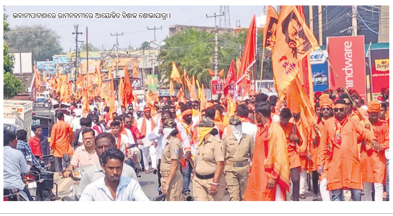
ଭବାନୀପାଟଣାରେ ରାମନବମୀରେ ଆୟୋଜିତ ବିଶାଳ ଶୋଭାଯାତ୍ରା।

ରାମସାମୀ ମନ୍ଦିରରେ ପହଞ୍ଚି ଭଜନ ସମାବେଶ ଅନୁଷ୍ଠିତ ହୋଇଥିଲା। କେବଳ ଯେ ଭବାନୀପାଟଣା ରୁହେଁ କୁନାଗଡ଼, ଧର୍ମଗଡ଼ ଆଦି ଜିଲାର ବିଭିନ୍ନ ସହର ଓ ଗାଁରେ ପାଳନ କରାଯାଇଛି। ସେହିପରି କୋକସରା ଗୁଡ଼ହାଣ୍ଡି ତୋକରି ଚଞ୍ଚରୀରେ ଥିବା ରାମ ମନ୍ଦିରରେ ଗୁରୁବାରଠାରୁ ରାମ ନବମୀ ଉତ୍ସବ ଆରମ୍ଭ ହୋଇଛି। ଏହା ୯ ଦିନ ଧରି ଚାଲିବ। ରାମ ନବମୀକୁ ନେଇ ଜିଲ୍ଲା ପୋଲିସ ପକ୍ଷରୁ ସମସ୍ତ ମନ୍ଦିର ଛକରେ ପୋଲିସ ଫୋର୍ସ ମୁତୟନ କରାଯାଇଥିବା ଦେଖିବାକୁ ମିଳିଛି।