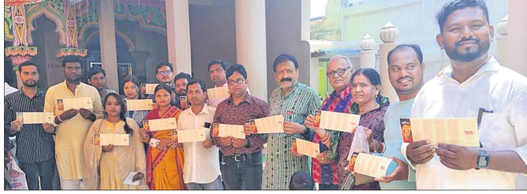
ଅତିଥିମାନେ କୋସଲି ହନୁମାନ ଚାଲିଶା ଉନ୍ମୋଚନ କରୁଛନ୍ତି।