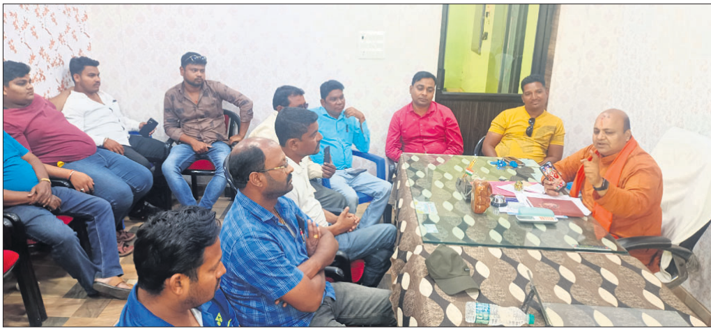
ଖବରଦାତା ସମ୍ମିଳନୀରେ ନଗରପାଳ ସୂଚନା ଦେଉଛନ୍ତି।