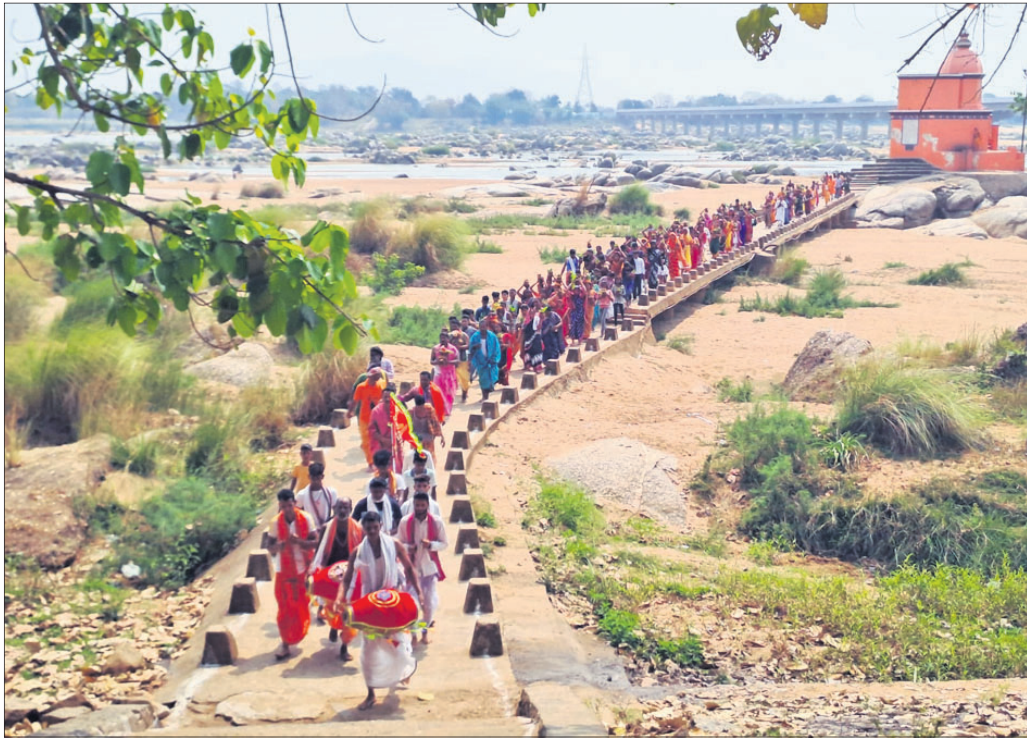
ମହିଳାଙ୍କ ଦ୍ୱାରା ମହାନଦୀ ଘାଟକୁ କଳସ ଶୋଭାଯାତ୍ରା।

ଗଡ଼ଜାତ ବୌଦ୍ଧ ଗଣପର୍ବ ରାମଲୀଳା ଉତ୍ସବ ପବିତ୍ର ରାମନବମୀ ଠାରୁ ଶ୍ରୀନାଥ ରତ୍ନନାଥ ଜୀଉ ମନ୍ଦିର ପ୍ରାଙ୍ଗଣସ୍ଥ ମାତୁଡ଼ା ମଠପ ଠାରେ ଆରମ୍ଭ ହୋଇଛି। ରାମ ନବମୀ ଉତ୍ସବ ଅବସରରେ ସାରା ବୌଦ୍ଧ ସହର ଚଳଚଞ୍ଚଳ ରହିବା ସହିତ ଯାତ୍ରାକୁସ୍ଥାନ ରାମଲୀଳା ନାଟ୍ୟ ସଂସଦର ସମସ୍ତ ସଦସ୍ୟ ୧୮ ଦିନ ପରମ୍ପରା ଅନୁଯାୟୀ ବ୍ରତ ଧାରଣ କରିଛନ୍ତି। ସହର ଦେଇ ଯାଇଥିବା ମହାନଦୀର ହନୁମାନ ମନ୍ଦିର ନିକଟରୁ ମହାନଦୀର ପବିତ୍ର ଜଳକୁ ୧୦୮ କଳସାରେ ଏକ ବିରାଟ ଶୋଭାଯାତ୍ରାରେ ନେଇ ମାତୁଡ଼ା ମଠପଠାରେ ସ୍ଥାପନ କରାଯାଇଛି। ଏହି କଳସ ଶୋଭାଯାତ୍ରା ମହିଳାଙ୍କ ଦ୍ୱାରା ଅନୁଷ୍ଠିତ ହୋଇଥିଲା। ଶ୍ରୀକାଳୀମାନେ ଦିନ ତମାମ ରତ୍ନନାଥ ଜୀଉ ମନ୍ଦିରରେ ଭିଡ଼ ଜମାଇ ରାମନବମୀ ପୂଜାଉତ୍ସବରେ ଅଂଶଗ୍ରହଣ କରିଛନ୍ତି। ବିରଳ ପରମ୍ପରା ଓ ଭାଇଚାରିଆ ନିଦର୍ଶନ ଦେଖାଇ ଏହି ପବିତ୍ର ଦିନରେ ସହରର ପୁସଲମାନ ଭାଇମାନେ ଗୁରୁବାର ଜୀବ ହତ୍ୟା ବନ୍ଦ କରିବା ସହିତ ସମ୍ପୂର୍ଣ୍ଣ ମାଂସ ଓ ମାଛ ବନ୍ଦୀ ବନ୍ଦ ରହିଛି। ସନ୍ଧ୍ୟାରେ ସମସ୍ତଙ୍କ ଦୀପ ଆଗରେ କଳସ ବଦାଇବା ସହ ଦୀପ ଜାଳିଥିଲେ। ଯାତ୍ରାରେ ଅଂଶଗ୍ରହଣ କରିଥିବା ବ୍ରତୀମାନେ ଗୁରୁବାରଠାରୁ ନିଜସ୍ୱ