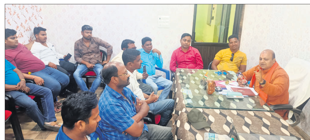
ଖବରଦାତା ସମ୍ମିଳନୀରେ ନଗରପାଳ ସୂଚନା ଦେଉଛନ୍ତି।