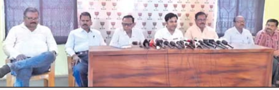
ଖବରବାଚା ସମ୍ମିଳନୀରେ ପୁରୀର ଦିଆଯାଇଛି।