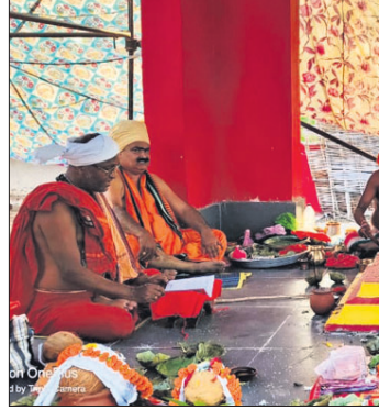
ତାରିଣୀ ପୀଠରେ ଚଣ୍ଡୀ ମହାଯଜ୍ଞ।