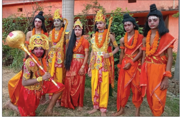
ଶିଶୁମାନେ ବିଭିନ୍ନ ବେଶରେ ସଜିତ ହୋଇଛନ୍ତି।

ଦର୍ଶନ ପରେ ସେଠାରେ ଅପେକ୍ଷା କରି ରହିଥିବା ସୁସଜିତ ରଥରେ ଶ୍ରୀରାମ, ଲକ୍ଷ୍ମଣ, ସୀତା ଓ ହନୁମାନ ବିରାଜମାନ ହୋଇ ନଗର ପରିକ୍ରମା କରିଥିଲେ। ପରିଚାଳନା କମିଟି, ଗୁରୁମା ଗୁରୁଜୀ, ଅଭିଭାବିକା ଅଭିଭାବକ, ସେବିକା ସେବକ, ବଜରଙ୍ଗଦଳ, ଆରମ୍ଭସମ୍ପଦ, ଗୋଡ଼ାଗା ଏବଂ ଗୋଶାଳାର ପୋଲିସ୍ ବିଭିନ୍ନ ମୁନିଷିକ ବେଶରେ ସଜିତ ହୋଇଥିଲେ। ସେମାନେ ସ୍କୁଲରୁ ବାହାରି ଅଧାରିପତ୍ରା ଦେଇ କମଳକିରୀ ମନ୍ଦିରକୁ ଦର୍ଶନ କରିବା ପାଇଁ ଯାଇଥିଲେ।