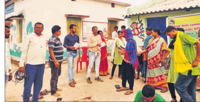
ପଥପ୍ରାନ୍ତ ନାଟକ ମାଧ୍ୟମରେ ଯଶ୍ୱା ରୋଗ ରୋଗ ଉପରେ ସଚେତନ କରାଯାଇଛି।

ସିନାପାଳି, ୩୦/୩(ଡି.ଏନ.ଏ.) ନୂଆପଡ଼ା ଜିଲ୍ଲା ସ୍ୱାସ୍ଥ୍ୟ ସମିତି ଓ ସ୍ୱେଚ୍ଛାସେବୀ ଅନୁଷ୍ଠାନ ଯାର ପଦ୍ମପୁର ଆନୁକୁଲ୍ୟରେ ଯଶ୍ୱା ଉପରେ ସଚେତନତା କାର୍ଯ୍ୟକ୍ରମ ଅନୁଷ୍ଠିତ ହୋଇଯାଇଛି। ଏହି ଅବସରରେ ସିନାପାଳି ବ୍ଲକ୍ ଉପାଧିକାରୀଙ୍କୁ ପଞ୍ଚାୟତ ଅନ୍ତର୍ଗତ ଧାନ୍ତାଗାଟା, ଯୋଗଭଙ୍ଗା, ପଞ୍ଚରପାଣି ଏବଂ ନଙ୍ଗଳବୋଡ଼ା ପଞ୍ଚାୟତର ବିଭିନ୍ନ ସ୍ଥାନରେ ପଥପ୍ରାନ୍ତ ସାମାଜିକ ନାଟକ ମାଧ୍ୟମରେ ଯଶ୍ୱା ଉପରେ ଆଧାରିତ ନାଟକ ପରିବେଷଣ କରି ସଚେତନ କରାଯାଇଥିଲା। ଉକ୍ତ ନାଟକ ଖଡ଼ିଆଳ ସାଂସ୍କୃତିକ ଅନୁଷ୍ଠାନ କଳାକାରମାନଙ୍କ ପକ୍ଷରୁ ମଞ୍ଚସ୍ଥ ହୋଇଥିଲା। କାର୍ଯ୍ୟକ୍ରମ ପରିଚାଳନାରେ ଯାର ଅନୁଷ୍ଠାନ