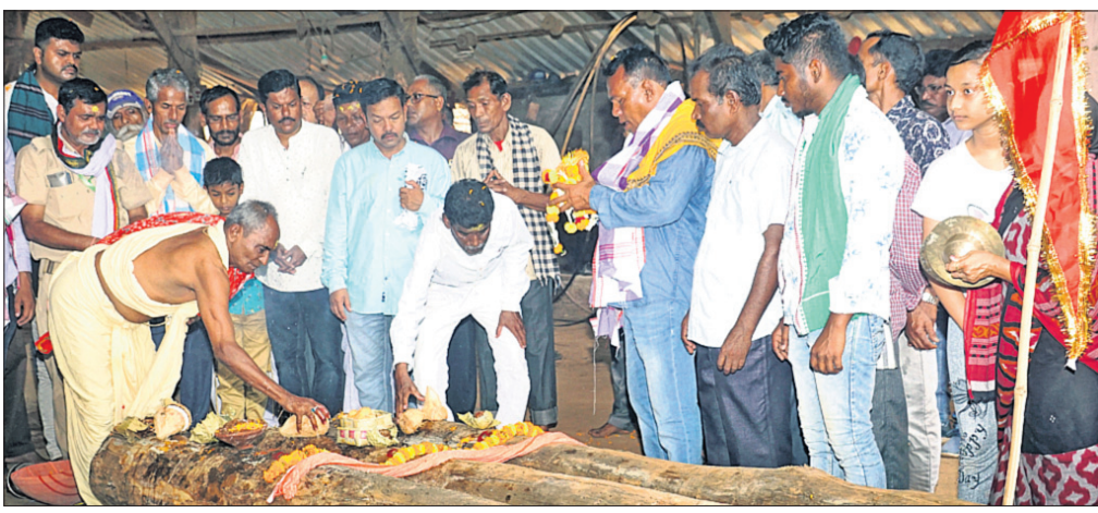
ଖପୁରିଆସ୍ଥିତ ସରକାରୀ ସ' ମିଲରେ ରଥକାଠ ଚିରଟ ପାଇଁ ପୂଜାର୍ଚ୍ଚନା କରାଯାଇଛି।