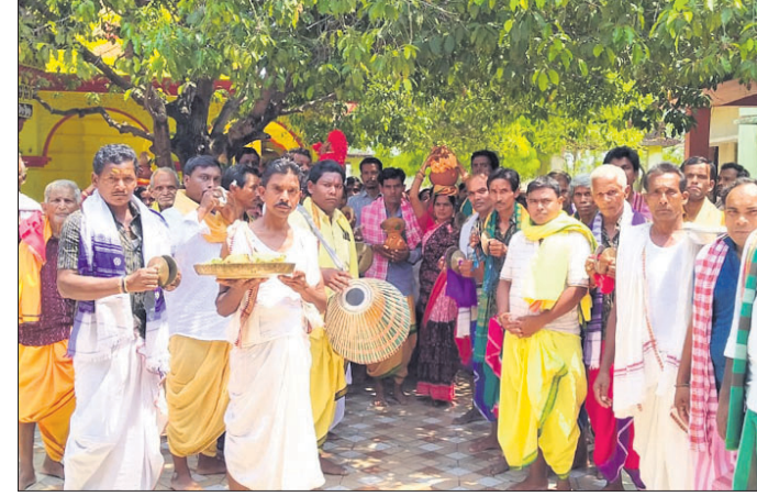
ରାମନବମୀ ଅବସରରେ ପୂଜା କମିଟି ସଦସ୍ୟ ପୂର୍ଣ୍ଣ କଳସ ଧରି ନାଟ୍ୟମଣ୍ଡପକୁ ଆସୁଛନ୍ତି।