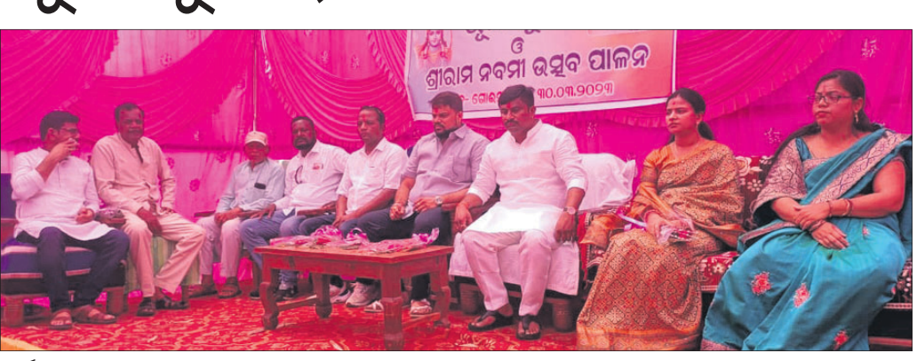
କାର୍ଯ୍ୟକ୍ରମରେ ଉପସ୍ଥିତ ଅତିଥିଗଣ।