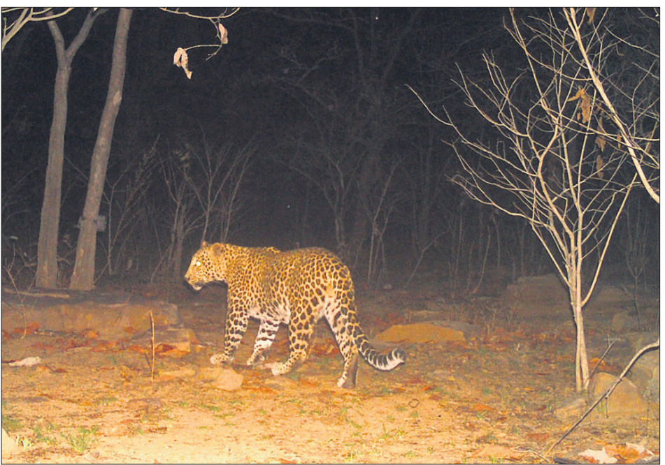
ଗ୍ରାମିଣ କ୍ୟାମ୍ପେରାରେ କଏଦ ହୋଇଥିବା କଲରାପତରିଆ ବାଘ।

ନୂଆପଡ଼ା ଅଫିସ, ୩୦/୩ ନୂଆପଡ଼ା ଜିଲ୍ଲା କୋମନା ବ୍ଲକ ଅଧୀନ ସୁନାବେଡ଼ା ବନ୍ୟପ୍ରାଣୀ ଅଭୟାରଣ୍ୟ ଭିତରେ ଅବସ୍ଥିତ ସୋସେଜ ପଞ୍ଚାୟତ ଜଳମତେଇ ଗାଁର ସାନମତି ବାରିକ (୬୮)ଙ୍କୁ ଗତ ୧୯ ତାରିଖ ରାତିରେ ମହାବଳ ବାଘ ଖାଇ ଦେବା ପରେ ଗାଁରେ ଆତଙ୍କ ଖେଳିଯାଇଛି। ବାଘର ଗତିବିଧିକୁ ନଜର ରଖିବା ପାଇଁ ବନ ବିଭାଗ ପକ୍ଷରୁ ୧୫ଟି ଟ୍ରାକ୍ କ୍ୟାମ୍ପେରା ଲଗାଯାଇଥିଲା। ଗୁରୁବାର ଭୋର ପ୍ରାୟ ୫ଟା ବେଳେ ବାଘ ଗ୍ରାମ କ୍ୟାମ୍ପେରାରେ କଏଦ ହୋଇଥିବା ନେଇ ସୁନାବେଡ଼ା ରେଞ୍ଜର ଶିବ ପ୍ରସାଦ ଖମାରି ସୂଚନା ଦେଇଛନ୍ତି। ଏହା କଲରାପତରିଆ ବାଘ ବୋଲି ସ୍ୱସ୍ତ୍ୟ ଜଣାପଡ଼ିଛି। କ୍ୟାମ୍ପେରାରେ ଫଟୋ କଏଦ ହେବା ପରେ ବନ ବିଭାଗ ପକ୍ଷରୁ ବାଘର ଗତିବିଧି ଉପରେ ତିନି ନଜର ରଖାଯାଇଛି। ବିଭାଗୀୟ କର୍ମଚାରୀମାନେ ସେଠାରେ ଦିନରାତି ପାଟ୍ରୋଲିଂ କରୁଛନ୍ତି। ସୂଚନାଯୋଗ୍ୟ, ଗତ ୧୯ ତାରିଖରୁ ନୂଆପଡ଼ା ଜିଲ୍ଲା ସୁନାବେଡ଼ା ଅଭୟାରଣ୍ୟ ଜଳମତେଇ ଗାଁରେ ଜଣେ ବୃଦ୍ଧଙ୍କ ସମେତ ୪ଟି ଗୁହପାଳିତ ପ୍ରାଣୀ ବାଘ ଶିକାର କରି ସାରିଲାଣି। ଛତିଶଗଡ଼ ସୀମାନ୍ତକୁ ଲାଗି ୬ ଶହ ବର୍ଗ କି.ମି. ପରିବ୍ୟାପ୍ତ ସୁନାବେଡ଼ା ଅଭୟାରଣ୍ୟ ଦିନକୁ ଦିନ ସଙ୍କୁଚିତ ହେବାରେ ଲାଗିଛି। ସଙ୍କୁଚିତ ବାସସ୍ଥଳି ଓ ଖାଦ୍ୟାଭାବ ଯୋଗୁ କଲରାପତରିଆ ବାଘ ଗାଁ ମୁହାଁ ହୋଇ ଶିକାର କରୁଛି। ବାଘ ଆତଙ୍କରେ ଜୀବନ ଜାବିକା ପ୍ରଭାବିତ ହେବା ସହ ଲୋକେ ବାହାରକୁ ବାହାରୁନାହାନ୍ତି।