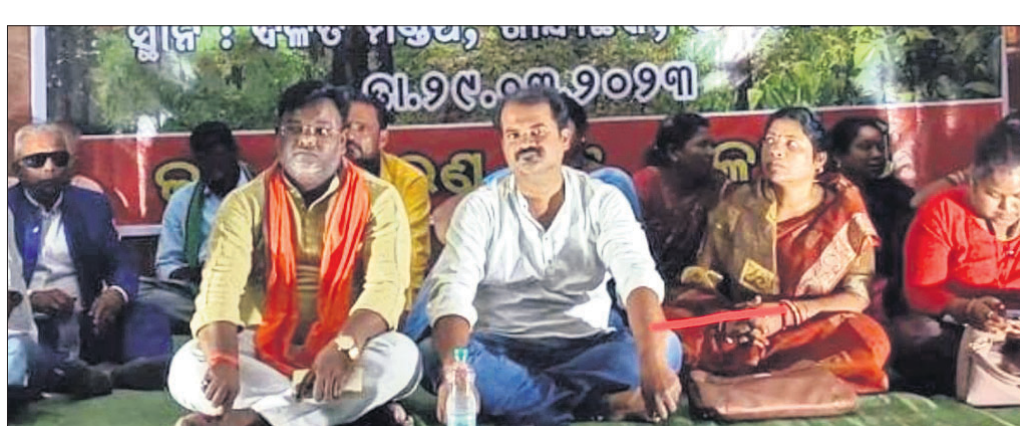
ଜନ ଜାଗରଣ ମଞ୍ଚ ପକ୍ଷରୁ ପ୍ରତିବାଦ ସଭା।