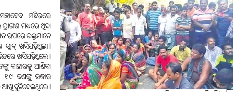
ଉଦ୍ଧାରକ ଗ୍ରାମବାସୀ ରାସ୍ତା ଅବରୋଧ କରି ଧାରଣାରେ ବସିଛନ୍ତି।