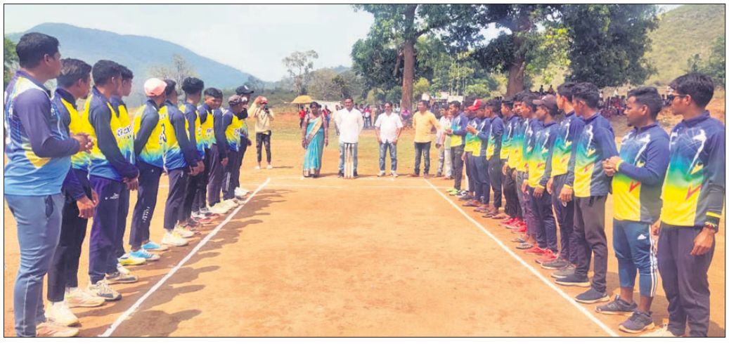
ଫାଇନାଲ ମ୍ୟାଚ୍ ଅବସରରେ ଅତିଥିଙ୍କୁ ରହଣରେ ଖେଳାଳିମାନେ।

ଥିଲେ। ପ୍ରକାଶ ଯେ, ୨୦୦୩ରେ କଳାହାଣ୍ଡି ଜିଲ୍ଲାରେ ପାଦ ଦେଇଥିଲା ବହୁ ରାଷ୍ଟ୍ରୀୟ କମ୍ପାନୀ ବେଦାନ୍ତ। କମ୍ପାନୀ ପ୍ରତିଷ୍ଠା ପାଇଁ ଆବଶ୍ୟକ ଜମିଜମା ରାଜ୍ୟ ସରକାର ଯୋଗାଇ ଦେଲେ। ହେଲେ ଖଣି ଖନନ ପାଇଁ ନିୟମିତି ଉପରେ ନଜର ପକାଇଥିଲା ବେଦାନ୍ତ କମ୍ପାନୀ। ଏ ନେଇ ସେହି ସମୟରେ କମ୍ପାନୀକୁ ନିରାଶ ହେବାକୁ ପଡ଼ିଥିଲା। କାରଣ ନିୟମିତି ପହାଡ଼ରେ ବାସ କରିଥିବା ସୁରକ୍ଷା ଦେବା ପାଇଁ ଅଣ୍ଡା ଭିତ୍ତି ନିୟମିତି ଉପରେ ବାସ କରୁଥିବା ଅଧିବାସୀ ଗ୍ରାମ ବୁଦ୍ଧବାଳର ଦ୍ୱାରସ୍ଥ ହୋଇଥିଲା। ଆଉ ଏହି ଆୟୋଜନକୁ ସମର୍ଥନ ଜଣାଇ ଦେଶର ସର୍ବୋଚ୍ଚ ନ୍ୟାୟାଳୟ ନିୟମିତି ସୁରକ୍ଷା ସମିତି ସପକ୍ଷରେ ଯାଇ ଖଣି ଖନନ ଆବେଦନକୁ ରଦ୍ଦ କରିବା ସହ ନିୟମିତିରେ ଖଣି ଖନନ କରାଯାଇ ପାରିବ ନାହିଁ ବୋଲି ସ୍ପଷ୍ଟ ଭାବେ ନିର୍ଦ୍ଦେଶ ଦେଇଥିଲେ। ଏବେ ଦେଶର ନଜର ଜିଲ୍ଲାର ଅନ୍ୟ ବହୁତ ଖଣି ଉପରେ ପଡ଼ିଛି। ଗୋଟିଏ ପଡ଼େ ଶିଳ୍ପ ପ୍ରତିଷ୍ଠା ହେଲେ ଜିଲ୍ଲାର ବିକାଶ ହେବ ବୋଲି ଅନେକ ବୁଦ୍ଧିଜୀବୀ ମତ ରଖୁଥିବା ବେଳେ ସେହି ପହାଡ଼ରେ ଉପରେ ବାସ କରୁଥିବା ଅଧିବାସୀ ଏହାକୁ ବିରୋଧ କରିବାକୁ ଲାଗିଲେଣି।