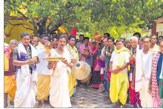
ରାମନବମୀ ଅବସରରେ ପୂଜା କମିଟି ସଦସ୍ୟ ପୂର୍ଣ୍ଣ କଳସ ଧରି ନାଟ୍ୟମଣ୍ଡପକୁ ଆସୁଛନ୍ତି।