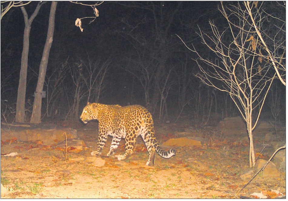
ଗ୍ରାମିଣ କ୍ୟାମ୍ପରେ କଏଦ ହୋଇଥିବା କଲରାପତରିଆ ବାଘ।

ନୂଆପଡ଼ା ଅଫିସ, ୩୦୩୩ ନୂଆପଡ଼ା ଜିଲ୍ଲା କୋମନା ବ୍ଲକ୍ ଅଧୀନ ସୁନାବେଡ଼ା ବନ୍ୟପ୍ରାଣୀ ଅଭୟାରଣ୍ୟ ଭିତରେ ଅବସ୍ଥିତ ସୋସେଇ ପଞ୍ଚାୟତ କଲମଡେଇ ଗାଁର ସାନମତି ବାରିକ (୬୮)ଙ୍କୁ ଗତ ୧୯ ତାରିଖ ରାତିରେ ମହାବଳ ବାଘ ଖାଇ ଦେବା ପରେ ଗାଁରେ ଆତଙ୍କ ଖେଳିଯାଇଛି। ବାଘର ଗତିବିଧିକୁ ନଜର ରଖିବା ପାଇଁ ବନ ବିଭାଗ ପକ୍ଷରୁ ୧୫ଟି ଗ୍ରାମିଣ କ୍ୟାମ୍ପରେ ଲଗାଯାଇଥିଲା। ଗୁରୁବାର ଭୋର ପ୍ରାୟ ୫ଟା ବେଳେ ବାଘ ଗ୍ରାମ କ୍ୟାମ୍ପରେ କଏଦ ହୋଇଥିବା ନେଇ ସୁନାବେଡ଼ା ରେଞ୍ଜର ଶିବ ପ୍ରସାଦ ଖମାପା ସୂଚନା ଦେଇଛନ୍ତି। ଏହା କଲରାପତରିଆ ବାଘ ବୋଲି ଖଣ୍ଡ ଜଣାପଡ଼ିଛି। କ୍ୟାମ୍ପରେ ଫଟୋ କଏଦ ହେବା ପରେ ବନ ବିଭାଗ ପକ୍ଷରୁ ବାଘର ଗତିବିଧି ଉପରେ ତିକ୍ଷ୍ଣ ନଜର ରଖାଯାଇଛି। ବିଭାଗୀୟ କର୍ମଚାରୀମାନେ ସେଠାରେ ଦିନରାତି ପାଟ୍ରୋଲିଂ କରୁଛନ୍ତି। ସୂଚନାଯୋଗ୍ୟ, ଗତ ୧୯ ତାରିଖରୁ ନୂଆପଡ଼ା ଜିଲ୍ଲା ସୁନାବେଡ଼ା ଅଭୟାରଣ୍ୟ କଲମଡେଇ ଗାଁରେ ଜଣେ ବୃଦ୍ଧଙ୍କ ସମେତ ୪ଟି ଗୃହପାଳିତ ପ୍ରାଣୀ ବାଘ ଶିକାର କରି ସାରିଲାଣି। ଛତିଶଗଡ଼ ସାମାଜିକ ଲାଗି ୬ ଶହ ବର୍ଗ କି.ମି. ପରିବ୍ୟାପ୍ତ ସୁନାବେଡ଼ା ଅଭୟାରଣ୍ୟ ଦିନକୁ ଦିନ ସଙ୍କୁଚିତ ହେବାରେ ଲାଗିଛି। ସଙ୍କୁଚିତ ବାସସ୍ଥଳି ଓ ଖାଦ୍ୟାଭାବ ଯୋଗୁ କଲରାପତରିଆ ବାଘ ଗାଁ ମୁହାଁ ହୋଇ ଶିକାର କରୁଛି। ବାଘ ଆତଙ୍କରେ ଜୀବନ ଜୀବିକା ପ୍ରଭାବିତ ହେବା ସହ ଲୋକେ ବାହାରକୁ ବାହାରୁନାହାନ୍ତି।