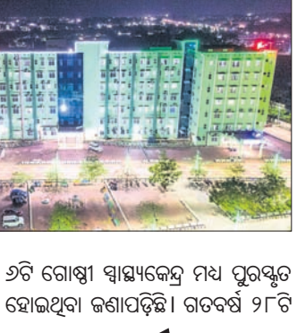
୬ଟି ରୋଷୀ ସ୍ୱାସ୍ଥ୍ୟକେନ୍ଦ୍ର ମଧ୍ୟ ପୁରସ୍କୃତ ହୋଇଛି। ସେହିପରି ଚରଡ଼ି ବର୍ଷ ଜିଲ୍ଲାର