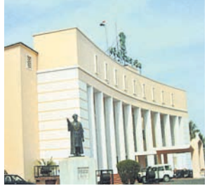
ଭପରେ ଗୁରୁତ୍ୱ ଦିଆଯାଇଛି ଆସନ୍ତାବର୍ଷ ରାଜ୍ୟରେ ସାଧାରଣ ନିର୍ବାଚନ ଅନୁଷ୍ଠିତ ହେବ। ଏହାକୁ ବ୍ୟୟ ବରଦା କରାଯାଇଛି।