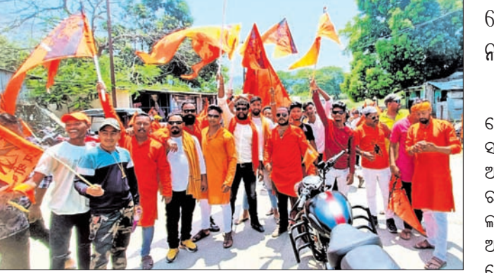
ରାମନବମୀ ଅବସରରେ ବାଳିମେଳାରେ ବାହାରିଥିବା ଶୋଭାଯାତ୍ରା ।