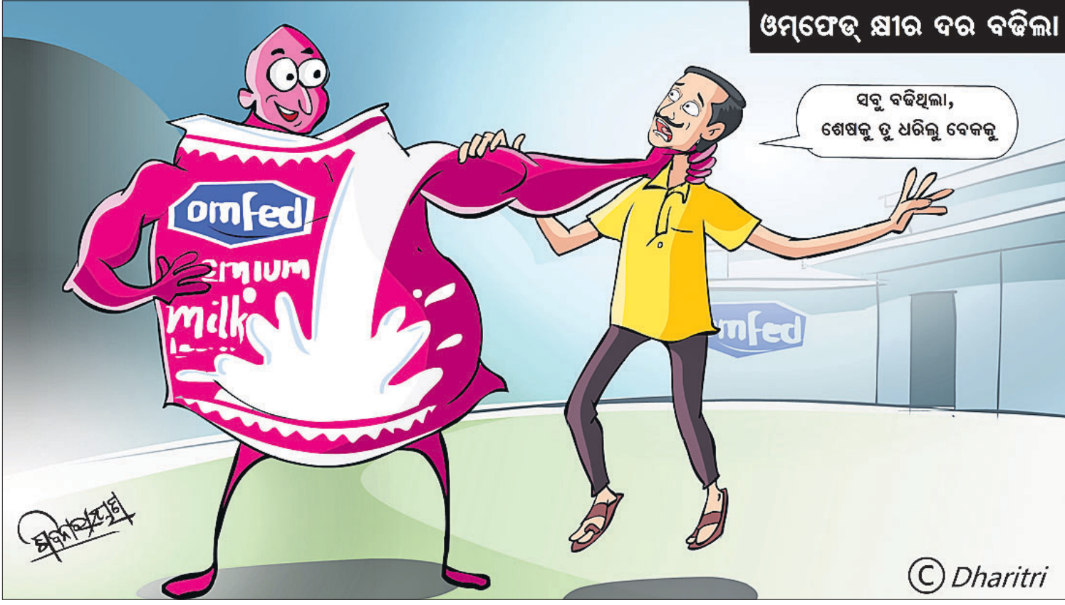
ଓମଫେଡ଼ କ୍ଷୀର ବର ବଢ଼ିଲା