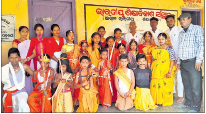
ମାଲକାନଗିରି ଜିଲ୍ଲାକାଳିମେଳାରେ କୁନିକୁନି ପିଲାମାନେ ରାମ ବେଶରେ ସଜିତ ହୋଇଛନ୍ତି ।

କୋରାପୁଟ/କୟପୁର//ପଟାଳି/ଦଶମନବମୀ/ମାଲକାନଗିରି/ପଡ଼ିଆ/କାଳିମେଳା/ଚିତ୍ରକୋଣ୍ଡା/କୋରୁକୋଣ୍ଡା ୩୦/୩(ସ୍ୱ.ପ୍ର./ନି.ପ୍ର./ଡି.ଏନ୍.ଏ.)