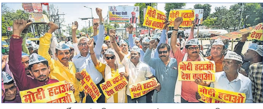
ଆମ୍ଭ ଆଦମ୍ଭୀ ପାର୍ଟି ପକ୍ଷରୁ 'ମୋଦି ହଟାଓ, ଦେଶ ବଚାଓ' ଲେଖାଥିବା ପୋଷ୍ଟର ଅଭିଯାନ।