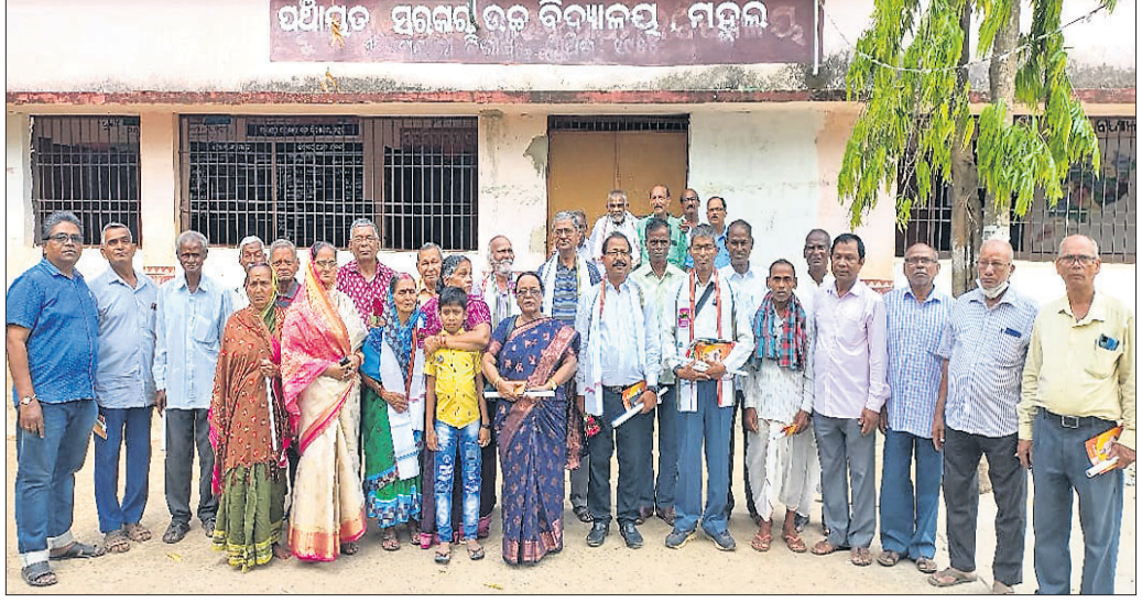
ଖୋର୍ଦ୍ଧା ମେଘାଶାଳା ସ୍ଥିତ ମହଲ ନିର୍ମାଣ ଉତ୍ସବରେ ଉପସ୍ଥିତ ଶିଳ୍ପୀମାନଙ୍କ ଓ ପୁରାତନ ଛାତ୍ରଛାତ୍ରୀମାନଙ୍କ ସହିତ ଏକ ସମାବେଶ ।