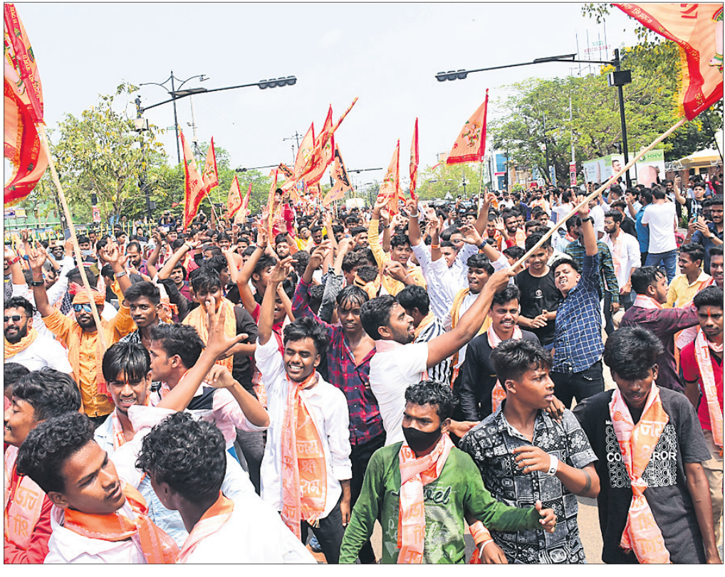
ରାମ ନବମୀ ଉପଲକ୍ଷେ ବଜରଜ ଦଳ ପକ୍ଷରୁ ବାହାରିଥିବା ଶୋଭାଯାତ୍ରା।