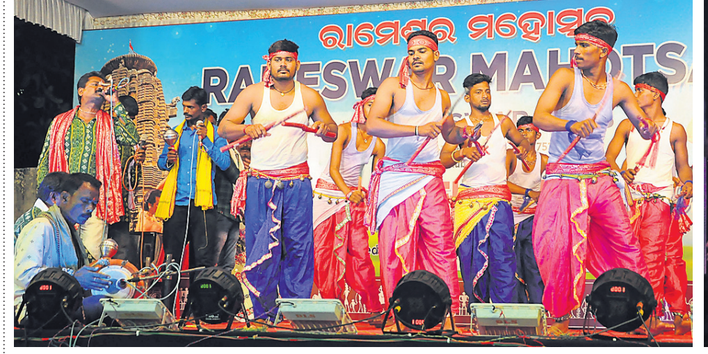
ରାମେଶ୍ୱର ମହୋତ୍ସବରେ ଆୟୋଜିତ ସାଂସ୍କୃତିକ କାର୍ଯ୍ୟକ୍ରମ।

ପୁରୁଣା ଭୁବନେଶ୍ୱର, ୩୦/୩ (ବି.ଏନ୍.ଏ.): ପ୍ରଭୁ ଶ୍ରୀଲିଙ୍ଗରାଜଙ୍କ ରୁକୁଣା ରଥଯାତ୍ରା ଉପଲକ୍ଷେ ଏକାମ୍ର ସାଂସ୍କୃତିକ ପ୍ରକାଶନୀ ପକ୍ଷରୁ ଚାଲିଥିବା ଶ୍ରୀଲିଙ୍ଗରାଜ ମହୋତ୍ସବର ରୁକୁଣାର ଦ୍ୱିତୀୟ ସନ୍ଧ୍ୟାରେ ଅଷ୍ଟମ କଟକ କଳାବିକାଶ କେନ୍ଦ୍ର ପକ୍ଷରୁ ଓଡ଼ିଶୀରେ ଗଜାନନ ନୃତ୍ୟ ପରିବେଷଣ କରାଯାଇଥିଲା। ପରେ ଉତ୍ତରାଞ୍ଚଳରୁ ଏକାକାରକ ଦ୍ୱାରା ଯଦିଆରୀ ନୃତ୍ୟ ପରିବେଷଣ କରାଯାଇଥିଲା। ପ୍ରକାଶନୀର ଗର୍ଭୀ ନୃତ୍ୟ, ପରେ କୋଳକାତାର ଶତଦି ନୃତ୍ୟାୟନ ଅନୁଷ୍ଠାନ ପକ୍ଷରୁ ବସନ୍ତ ଉତ୍ସବ ଓ ଦୁର୍ଗା ଉତ୍ସବ ପରିବେଷଣ କରାଯାଇଥିଲା। ଭୁବନେଶ୍ୱରର ଦୟାଲ ଅନୁଷ୍ଠାନ ପକ୍ଷରୁ ସମ୍ବଲପୁରୀ ନୃତ୍ୟ, ଓଡ଼ିଶୀରେ ଗଜାନନ ନୃତ୍ୟ ପରିବେଷଣ କରାଯାଇଥିଲା। ପରେ ଅନୁଗୋଳର ନିଉ କ୍ରୀଏସନ୍ ଡ୍ୟାନ୍ସ ଏକାକାରକ ଦ୍ୱାରା କ୍ରୀଏଟିଭ ନୃତ୍ୟ ପରିବେଷଣ କରିଥିଲେ। ଏହାକୁ ବାସୁଦେବ ନାଥ ପରିବେଷଣ କରାଯାଇଥିଲା। ପ୍ରକାଶନୀର ଗର୍ଭୀ ନୃତ୍ୟ, ପରେ କୋଳକାତାର ଶତଦି ନୃତ୍ୟାୟନ ଅନୁଷ୍ଠାନ ପକ୍ଷରୁ ବସନ୍ତ ଉତ୍ସବ ଓ ଦୁର୍ଗା ଉତ୍ସବ ପରିବେଷଣ କରାଯାଇଥିଲା। ଭୁବନେଶ୍ୱରର ଦୟାଲ ଅନୁଷ୍ଠାନ ପକ୍ଷରୁ ସମ୍ବଲପୁରୀ ନୃତ୍ୟ, ଓଡ଼ିଶୀରେ ଗଜାନନ ନୃତ୍ୟ ପରିବେଷଣ କରାଯାଇଥିଲା। ପରେ ଅନୁଗୋଳର ନିଉ କ୍ରୀଏସନ୍ ଡ୍ୟାନ୍ସ ଏକାକାରକ ଦ୍ୱାରା କ୍ରୀଏଟିଭ ନୃତ୍ୟ ପରିବେଷଣ କରିଥିଲେ। ଏହାକୁ ବାସୁଦେବ ନାଥ ପରିବେଷଣ କରାଯାଇଥିଲା। ପ୍ରକାଶନୀର ଗର୍ଭୀ ନୃତ୍ୟ, ପରେ କୋଳକାତାର ଶତଦି ନୃତ୍ୟାୟନ ଅନୁଷ୍ଠାନ ପକ୍ଷରୁ ବସନ୍ତ ଉତ୍ସବ ଓ ଦୁର୍ଗା ଉତ୍ସବ ପରିବେଷଣ କରାଯାଇଥିଲା।