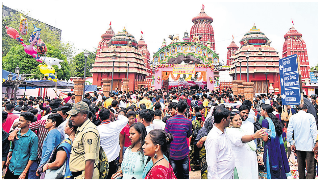
ରାମ ମନ୍ଦିରରେ ଶ୍ରଦ୍ଧାଳୁଙ୍କ ଭିଡ଼।

କେବଳ ମନ୍ଦିର ରୁହେଁ, ରାସ୍ତାଘାଟରେ ମଧ୍ୟ 'ଜୟ ଶ୍ରୀରାମ' ଧ୍ୱନି ଗୁଞ୍ଜରିତ ହୋଇଥିଲା। ଶୋଭାଯାତ୍ରା ସହ ରାମ, ଲକ୍ଷ୍ମଣ, ହନୁମାନ ଓ ସୀତା ବେଶଧାରୀଙ୍କ ଉପସ୍ଥିତି ସହରକୁ ଭକ୍ତିମୟ କରିଦେଇଥିଲା। ଏଥିପାଇଁ ସହରରେ ଥିବା ରାମ ମନ୍ଦିରକୁ ସକା ଯାଇଥିଲା। ଭଗବାନ ବିଷ୍ଣୁଙ୍କ ସପ୍ତମ ଅବତାରକୁ ଭଗବାନ ରାମଚନ୍ଦ୍ରଙ୍କର ଜନ୍ମ ଦିବସ ଭାବରେ ପାଳନ କରାଯାଏ। ଏହି ପବିତ୍ର ମୁହୂର୍ତ୍ତକୁ ଭକ୍ତମାନେ ରାମନବମୀ ଭାବେ ପାଳନ କରୁଛନ୍ତି। ପ୍ରଭାତରୁ ସମସ୍ତ ପୀଠରେ ବକ୍ରମାନେ ରାମଙ୍କ ଦର୍ଶନ କରିଥିଲେ। ଦିନସାରା ଉତ୍ସବର ରହି ଭଗବାନଙ୍କ ଆରାଧନା କରିଥିଲେ। ରାମନବମୀ ଦିନ ଭଗବାନ ରାମ ଓ ମା' ଭଗବତୀଙ୍କ ବିଧିବଦ୍ଧ ପୂଜାର୍ଚ୍ଚନା ଦ୍ୱାରା ମନଃମାନା ପୂରଣ ହୋଇଥାଏ ବୋଲି ବିଶ୍ୱାସ ରହିଛି।