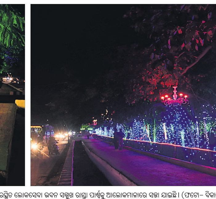
ଏପ୍ରିଲ ୧ ଓଡ଼ିଶା ବିକସ ପାଇଁ ରାଜଧାନୀ ଭୁବନେଶ୍ୱରରୁ ଲୋକସେବା ଭବନ ସମ୍ମୁଖ ରାସ୍ତା ପାର୍ଶ୍ୱକୁ ଆଲୋକନାମାରେ ସଜା ଯାଇଛି ।