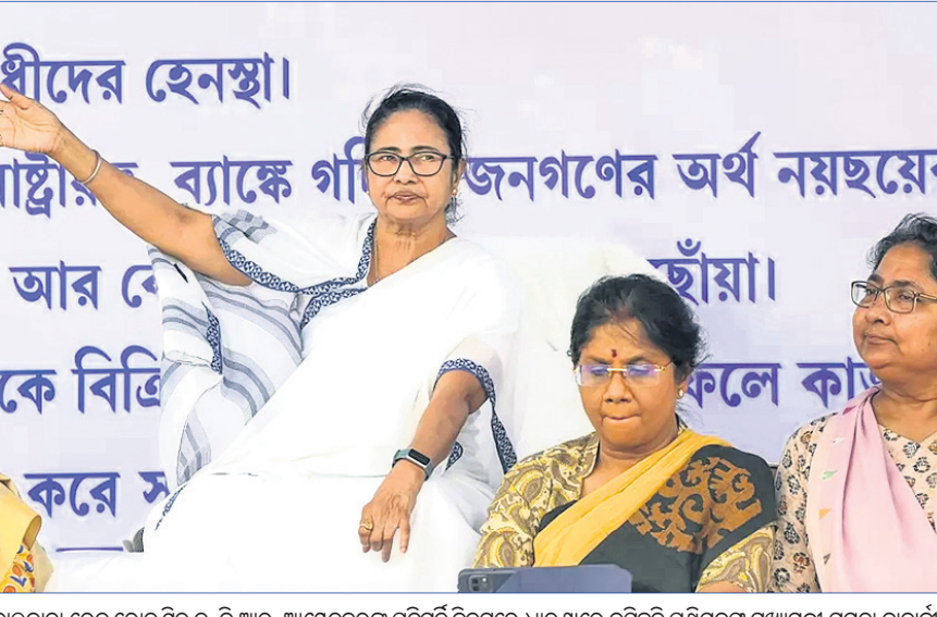
କୋଲକାତା ରେଡ୍ ଷୋରୁଟ୍ ରେ. ବି.ଆର୍. ଆନ୍ଦୋଳନର ପ୍ରତିରୁଦ୍ଧ ନିକଟରେ ଧାରଣାରେ ବସିଛନ୍ତି ପଶ୍ଚିମବଙ୍ଗ ମୁଖ୍ୟମନ୍ତ୍ରୀ ମମତା ବାନାର୍ଜୀ।

କୋଲକାତା, ୩୦ମାର୍ଚ୍ଚ: ପଶ୍ଚିମବଙ୍ଗ ପ୍ରତି କେନ୍ଦ୍ର ସରକାରଙ୍କ ପୀଡ଼ାପୀଡ଼ିତ ନୀତି ପ୍ରତିବାଦରେ ପଶ୍ଚିମବଙ୍ଗ ମୁଖ୍ୟମନ୍ତ୍ରୀ ତଥା ବିଧିସଭା ସଭ୍ୟମାନେ ମମତା ବାନାର୍ଜୀ କୋଲକାତାର ରେଡ୍ ଷୋରୁଟ୍ ଥିବା ତ. ବି.ଆର୍. ଆନ୍ଦୋଳନର ପ୍ରତିରୁଦ୍ଧ ନିକଟରେ ରୁଧିରୀୟମାନ ହୋଇଛନ୍ତି।