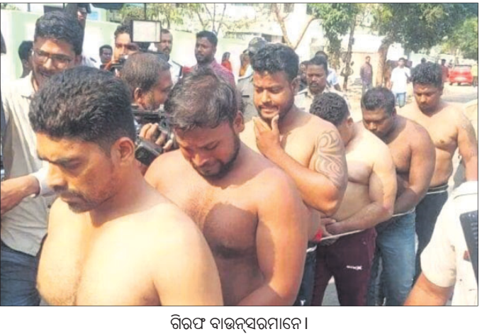
ଗିରଫ ବାଉଁଶରମାନେ ।

ହାତରେ କୋଡ଼ି ବାକ୍ସି ଶାର୍ଟ ଖୋଲି ଚଳାଇଲା ପୋଲିସ୍ ■ ନୟାପଲ୍ଲୀରେ ଦୋକାନ ଘର ଭାଙ୍ଗି ଲୁଟିବା ମହଙ୍ଗା ପଡ଼ିଲା ■ ଡରାଇ ଧମକାଇ ଅନ୍ୟର ଜମି ଅଧିକାର କରୁଥିଲେ ■ ବସ୍ ଓ ବାଇକ ଜବତ, ଏକାଧିକ ଫେରାର ଭୁବନେଶ୍ୱର, ୩୦/୩ (ବ୍ୟୁରୋ)