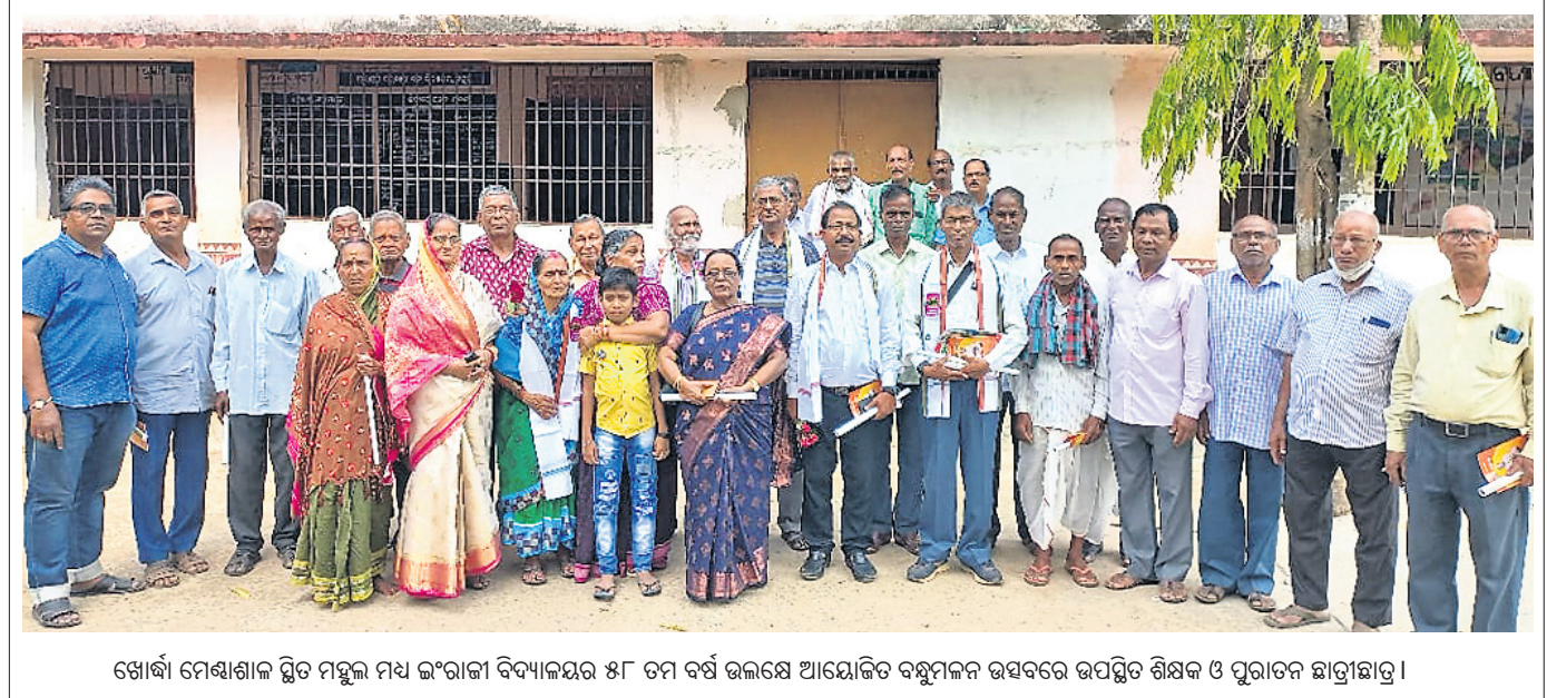
ଖୋର୍ଦ୍ଧା ମେଣ୍ଟାଶାଳ ସ୍ଥିତ ମହଲ ମଧ୍ୟ ଇଂରାଜୀ ବିଦ୍ୟାଳୟର ୫୮ ତମ ବର୍ଷ ଉଲ୍ଲାସ ଆୟୋଜିତ ବହୁମାନ ଉତ୍ସବରେ ଉପସ୍ଥିତ ଶିକ୍ଷକ ଓ ପୁରାତନ ଛାତ୍ରାଛାତ୍ରୀ।

ନିରାକାରପୁର, ୩୦୩୩(ଡି.ଏନ.ଏ.): ଖୋର୍ଦ୍ଧା ଜିଲ୍ଲା ରାମେଶ୍ୱରସ୍ଥିତ ମା' ବନପୁରୀଙ୍କ ପୀଠରେ ନବଦିନୀନାଥ ବାସନ୍ତିକ ପୂର୍ଣ୍ଣାସ୍ତମୀର ନୃପ ଦିବସରେ ମା' ସିଦ୍ଧିଦାତ୍ରୀ ବେଶରେ ଶ୍ରୀକପିଳେଶ୍ୱର ଦେବଙ୍କୁ ସମର୍ପଣ କରାଯାଇଥିଲା।