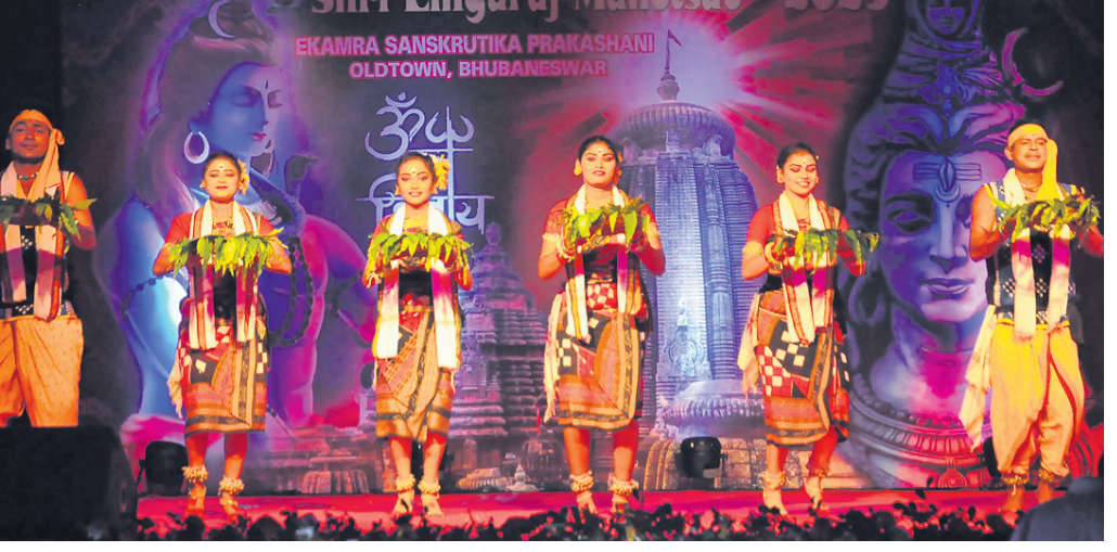
ଶ୍ରୀଲିଙ୍ଗରାଜ ମହୋତ୍ସବର ଦ୍ୱିତୀୟ ସନ୍ଧ୍ୟାରେ ପରିବେଷିତ ସମ୍ବଲପୁରୀ ନୃତ୍ୟ।