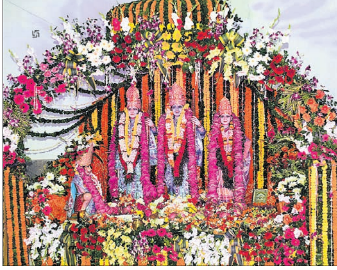
ଭୁବନେଶ୍ୱର ରାମ ମନ୍ଦିରରେ ରାମ, ଲକ୍ଷ୍ମଣ ଓ ସୀତାଙ୍କୁ ସଜଡ଼ କରାଯାଇଛି।

ଭୁବନେଶ୍ୱର, ୩୦/୩ (ବ୍ୟବହାର) ଉତ୍ସବ। ଏଥିପାଇଁ ଗୁରୁବାର ରାମ ପ୍ରଭୁ ଶ୍ରୀରାମଙ୍କ ସହ ଭକ୍ତଙ୍କୁ ନବମୀରେ ଉତ୍ସବମୁଖର ହୋଇ ନିକଟତର କରିଥାଏ ରାମନବମୀ ଉତ୍ସବରେ।