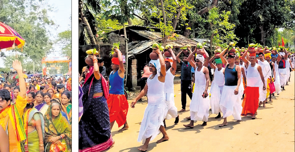
ରାମନବମୀ ଅବସରରେ ସାଲେପୁରରେ ବକରାଜ ଦଳ ଚଳାଉଥିବା ଆୟୋଜିତ ହିନ୍ଦୁ ଏକତା ଶୋଭାଯାତ୍ରା । ମାହାଙ୍ଗା ବୁକ ଅଞ୍ଚଳ ଲକ୍ଷ୍ମଣେଶ୍ୱର ତଥାପରିଆ ନବାକୂଳସ୍ଥିତ ସାଲେପୁର ମନ୍ଦିରର ବଡ଼ାଡ଼ି ଶୋଭାଯାତ୍ରା ପାଳିଛି । ଚିତ୍ତରଣାସ୍ଥିତ ଗଦାଧରପୁର ଶ୍ରୀରାମଚନ୍ଦ୍ରଙ୍କ ଜନ୍ମ ମନ୍ଦିରରେ ଭକ୍ତମାନେ କଳ୍ପ ଶୋଭାଯାତ୍ରାରେ ଯାଉଛନ୍ତି ।