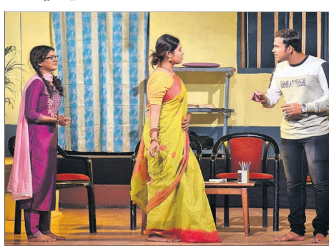
ଭୁବନେଶ୍ୱର ଉପକଣ୍ଠାରେ ଅନୁଷ୍ଠିତ ଲାବନ୍ୟ ନାଟ୍ୟ ମହୋତ୍ସବର ଗୁରୁବାର ପରିବେଷିତ ନାଟକ 'ସାମାଜିକ ସମାଜବାଦ'ର ଏକ ଦୃଶ୍ୟ ।

ରାମାନବମୀରେ ବିଧାୟକଙ୍କ ପୀଠ ପରିଦର୍ଶନ କରାଯାଇଛି । ଏଥିରେ ଓଡ଼ିଶା ସଭେରେ ରଞ୍ଜିତ ଅଭିଯୋଗ କରାଯାଇଛି ।