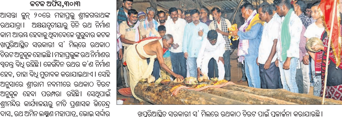
ଖପୁରିଆସ୍ଥିତ ସରକାରୀ ସ' ମିଲରେ ରଥକାଠ ଚିରଟ ପାଇଁ ପୂଜାର୍ଚ୍ଚନା କରାଯାଇଛି।