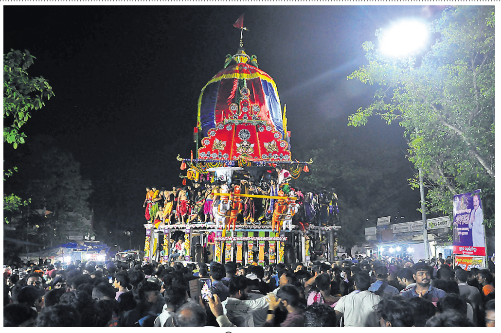
ରାମେଶ୍ୱର ମନ୍ଦିର ସମ୍ମୁଖରେ ରୁକୁଣା ରଥ।

ହୋଇ ରୋଷହୋମ, ମହାସ୍ନାନ, ବେଶ, ଭୋଗମଣ୍ଡପ ସରିବା ପରେ ରଥରେ ସକାଳ ଧୂପ ହୋଇଥିଲା। ଏହା ପରେ ଆକାଶରେ ହୋଇ ରଥ ଚଳରେ ଭୁଇଁ ଭଟ୍ଟା ପୁଆଁ ଦିଆଯାଇଥିଲା। ରଥ କାଳସିଙ୍କୁ ପାଲିଆ ପୂଜାପତ୍ର ଆଜ୍ଞା ପ୍ରସାଦ ଦେଇସାରିବା ପରେ ରଥଟଣା କାର୍ଯ୍ୟ ଆରମ୍ଭ ହୋଇଥିଲା। ଅଧିକାଂଶ ଆଡ଼ିଠାରେ ରଥ ପହଞ୍ଚିବା ପରେ ରଥରେ ଦ୍ୱିପୁତ୍ର ଧୂପ କରାଯାଇ ପୁଆଁ ଭୋଗ ହୋଇଥିଲା। ସନ୍ଧ୍ୟା ୬ଟା ୫୫ରେ ରଥ ରାମେଶ୍ୱର ମନ୍ଦିରଠାରେ ପହଞ୍ଚିଥିଲା। ପରେ ଦୁଇଜଣ ପୂଜାପତ୍ରା ରଥାତୁ ଠାକୁରଠାକୁରାଣୀଙ୍କୁ ଭେଟ ଆଳତି କରାଇଥିଲେ। ତତ୍ପରେ ଶ୍ରୀଲିଙ୍ଗରାଜ ପହଞ୍ଚି ବିଜେ ଆରମ୍ଭ ହୋଇଥିଲା। ବାଜା, ଘଣ୍ଟ, କାହାଳି, ରୋଷଣି ଶୋଭାଯାତ୍ରାରେ ପହଞ୍ଚିବେ ଶ୍ରୀଲିଙ୍ଗରାଜ ପହଞ୍ଚିବେ ଯାଇ ରାମେଶ୍ୱର ମନ୍ଦିରରେ ପହଞ୍ଚିଥିଲେ। ସେଠାରେ ଶ୍ୱତନ୍ତ୍ର ସିଂହାସନରେ ଶ୍ରୀଲିଙ୍ଗରାଜ ଉପବିଷ୍ଣୁ ହେବା ପରେ ନୀତିମାନ କରିଥିଲେ ପୂଜାପତ୍ରା ସେବାୟତ। ଏହା ପରେ ପ୍ରଭୁ ରାମେଶ୍ୱର ଏବଂ ଶ୍ରୀଲିଙ୍ଗରାଜଙ୍କ ମଧ୍ୟରେ ଭେଟ ଆଳତି ହୋଇଥିଲା।