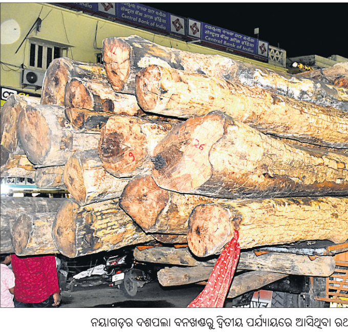
ନୟାପଲ୍ଲୀର ବଣପଲ୍ଲୀ ବନଖଣ୍ଡରୁ ବିତାୟ ପର୍ଯ୍ୟାୟରେ ଆସିଥିବା ରଥକାଠ ପୁରୀରେ ପହଞ୍ଚିଛି ।