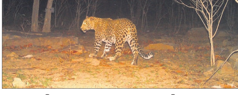
ଗ୍ରାମି କ୍ୟାମେରାରେ କଏଦ ହୋଇଥିବା କଲରାପତରିଆ ବାଘ।