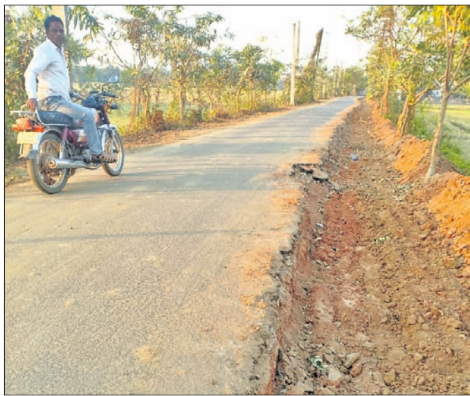
ଖଣ୍ଡଗିରି-ରଘୁନାଥପୁର ଗ୍ରାମ୍ୟ ଉନ୍ନୟନ ରାସ୍ତା ।

କଟକ ଜିଲା ନିର୍ଦ୍ଦେଶକାଳି ଗ୍ରାମ୍ୟ ଉନ୍ନୟନ ଉପଖଣ୍ଡ ଅଧିକାରୀ ଡାକ୍ତରୀ-ରଘୁନାଥପୁର ଗ୍ରାମ୍ୟ ଉନ୍ନୟନ ପ୍ରଶାସକରଣ କାର୍ଯ୍ୟ ଦୀର୍ଘ ଦିନ ହେବ ଅଧାରୁ ବନ୍ଦ ରହିଛି । ଫଳରେ ପଥଚାରୀମାନେ ନାହିଁ ନ ଥିବା ଅଭିବ୍ୟକ୍ତି ସମ୍ମୁଖରେ ହେଉଛନ୍ତି । ଦୀର୍ଘ ଏକମାସ ହେବ ରାସ୍ତାର ଉନ୍ନୟନକାର୍ଯ୍ୟରେ ଯୋଗଦାନ ପାଇଁ ଗାଡ଼ ଖୋଲିଯାଇ ଉତ୍ତମ ଅବସ୍ଥାରେ ପଡ଼ିରହିଛି । ଫଳରେ ରାସ୍ତାରେ ଅଧିକାଂଶ ସମୟରେ ଦୁର୍ଘଟଣା ହେଉଛି । ପ୍ରଶାସକରଣ ଏକେଡ଼ିଫିକ୍ସର ଉନ୍ନୟନ ବିଭାଗ ନିୟମିତ ପାଳନଯାଇଛି ।