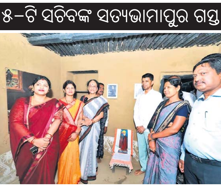
ମଧୁବାବୁଙ୍କ ଅବୃତ୍ତିଗାଳରେ ୫-ଟି ସଚିବ, ମହିଳା ମିଶନ ଶକ୍ତି ସଦସ୍ୟା ଓ ପ୍ରଶାସନିକ ଅଧିକାରୀମାନେ।