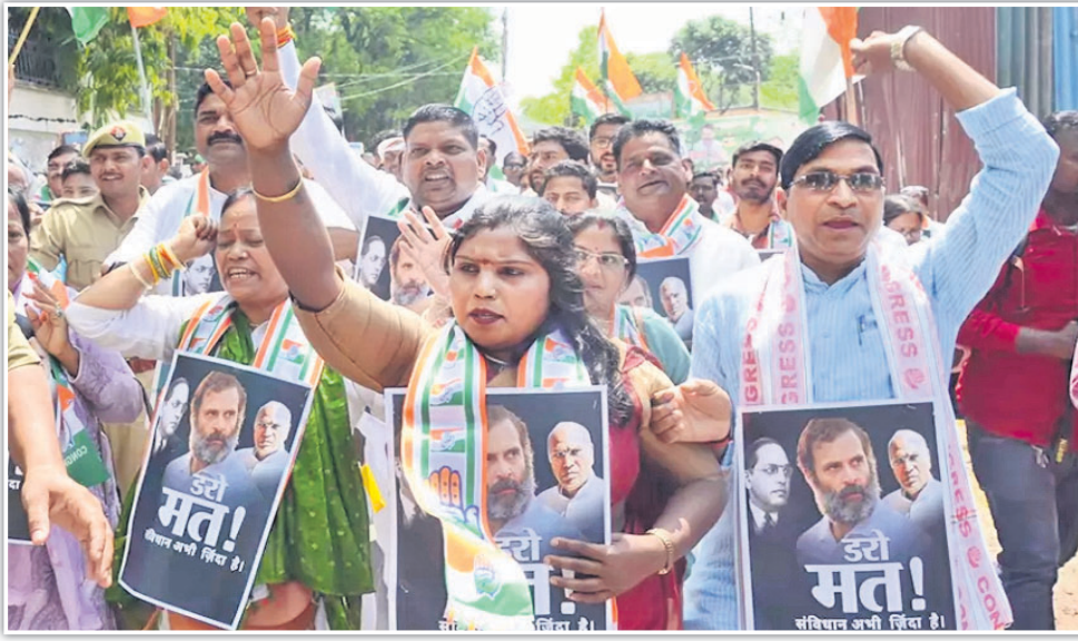
ରାଷ୍ଟ୍ରଲ ଗଣାଙ୍କ ଲୋକ ସଭା ସଦସ୍ୟତା ଉପ ପ୍ରସଙ୍ଗକୁ ନେଇ ଲକ୍ଷ୍ନୌରେ ଶନିବାର କଂଗ୍ରେସ ପକ୍ଷରୁ ବିକ୍ଷୋଭ ପ୍ରଦର୍ଶନ କରାଯାଇଛି ।

ସୋଡ଼ଗ ବିଧାନସଭାର ଦ୍ୱାଦଶ ଅଧିବେଶନ ୨୧ ଫେବୃଆରୀରୁ ଆସନ୍ତା ଏପ୍ରିଲ ୬ ପର୍ଯ୍ୟନ୍ତ ଚାଲିବ ।