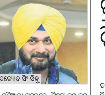
ନବଜ୍ୟୋତ ସିଂ ସିନ୍ଧୁ

■ ରାଜ୍ୟକୁ ଦୁର୍ଭିକ୍ଷ ଏବଂ ରାଷ୍ଟ୍ରପତି ଶାସନ ଲାଗୁ ପାଇଁ ଷଡ଼ଯନ୍ତ୍ର ହେଉଛି ■ ରାଷ୍ଟ୍ରଲଙ୍କ ସହ କାଢ଼ ଭଳି ଛିଡ଼ା ହେବ: ନବଜ୍ୟୋତ