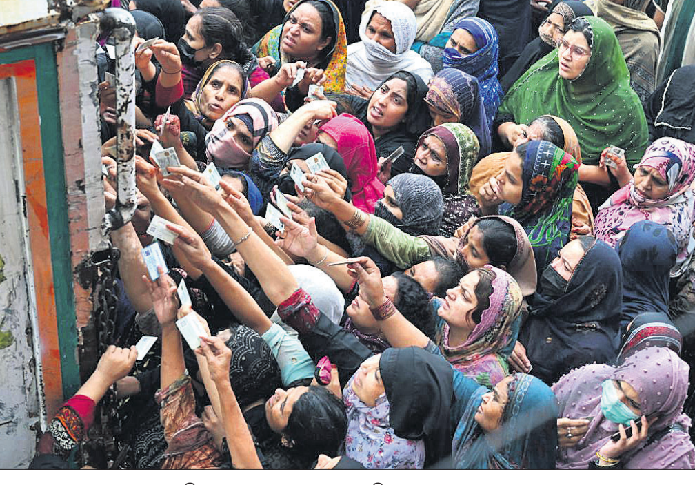
ମାଗଣା ଖାଦ୍ୟ ସାମଗ୍ରୀ ସଂଗ୍ରହ ଲାଗି ଏକ ବନ୍ଧନ କେନ୍ଦ୍ରରେ ଲୋକଙ୍କ ଭିଡ଼।

ପାକିସ୍ତାନରେ ପୁନଃସ୍ଥିତି ୫ ବର୍ଷକ ମଧ୍ୟରେ ସର୍ବାଧିକ ପ୍ରକାରେ ପହଞ୍ଚିଛି। ମାର୍ଚ୍ଚରେ ପୁନଃସ୍ଥିତି ୩୫.୩୭ ପ୍ରତିଶତ ରହିଥିଲା। ଏହା ସାଙ୍ଗକୁ ଅନ୍ତର୍ଜାତୀୟ ପୁନଃପାଣ୍ଡି (ଆଇଏମ୍ଏସ୍)ରୁ ରଣ ପାଇବା ପାଇଁ ଇସ୍ଲାମାବାଦ ଏହାର କେତେକ କଡ଼ା ସର୍ତ୍ତ ମାନିନେବାକୁ ବାଧ୍ୟ ହୋଇଛି। ଫଳରେ ଦରଦାମ୍ ଆକାଶକୁ ଆହୋଇଥିବାରୁ ସାଧାରଣ ଲୋକଙ୍କ ପକ୍ଷେ ଖାଦ୍ୟସାମଗ୍ରୀ ଓ ଅନ୍ୟାବଶ୍ୟକ ଦ୍ରବ୍ୟ କିଣିବା କଷ୍ଟକର ହୋଇପଡ଼ିଛି। ପାକିସ୍ତାନରେ ଏବେ ଦୁର୍ଭିକ୍ଷ ସ୍ଥିତି ସୃଷ୍ଟି ହୋଇଥିବା ବିଶେଷଜ୍ଞମାନେ ମତ ଦେଇଛନ୍ତି। ଦେଶରେ ଆର୍ଥିକ ସଙ୍କଟର ଗମ୍ଭୀର ପ୍ରଭାବ ଗରିବ ପାକିସ୍ତାନୀୟ ଉପରେ ସର୍ବାଧିକ ପଡ଼ିଛି। ରମଜାନ ମାସରେ ମାଗଣା ଖାଦ୍ୟସାମଗ୍ରୀ ବନ୍ଧନ ହେଉଥିବା ସ୍ଥାନରେ ଏତେ ଗଢ଼ ହେଉଛି ଯେ ଦକାବଦନରେ ଇତିମଧ୍ୟରେ ୨୦ ଜଣଙ୍କ ଜୀବନ ଗଲାଣି।