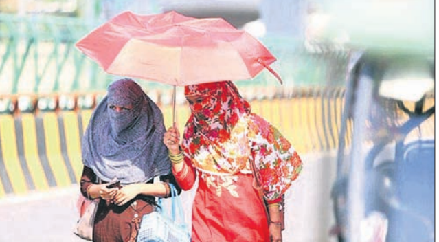
ଉତ୍ତରପ୍ରଦେଶ, ପଶ୍ଚିମବଙ୍ଗ, ଛତିଶଗଡ଼, ମହାରାଷ୍ଟ୍ର, ଗୁଜରାଟ୍, ପଞ୍ଜାବ ଓ ହରିୟାଣାରେ ଅଧିକ ଗ୍ରୀଷ୍ମ ଲହର

ଭାରତର ଅଧିକାଂଶ ଅଞ୍ଚଳରେ ଚାପପାତ୍ରା ଏପ୍ରିଲରୁ ଜୁନ୍ ମଧ୍ୟରେ ସାଭାବିକଠାରୁ ଅଧିକ ଉତ୍ତମ ବୋଲି ଭାରତୀୟ ପାଣିପାଗ ବିଭାଗ (ଆଇଏମ୍‌ଡି) ପକ୍ଷରୁ ଶନିବାର କୁହାଯାଇଛି। ବିଶେଷ କରି କେନ୍ଦ୍ରୀୟ, ପୂର୍ବ ଓ ଉତ୍ତରପଶ୍ଚିମ ଭାରତର ଅଧିକାଂଶ ଅଞ୍ଚଳରେ ଅଧିକ ଗ୍ରୀଷ୍ମ ଅନୁଭୂତ ହେବ। ଉପତ୍ୟା ଅଞ୍ଚଳ ଏବଂ ଉତ୍ତରପଶ୍ଚିମାଞ୍ଚଳର କିଛି ଅଂଶରେ ଚାପପାତ୍ରା ସାଭାବିକଠାରୁ କମ୍ ଉତ୍ତମ ବୋଲି ଆଇଏମ୍‌ଡି କହିଛି। ଓଡ଼ିଶା ସମେତ ବିହାର, ଝାଡ଼ଖଣ୍ଡ,