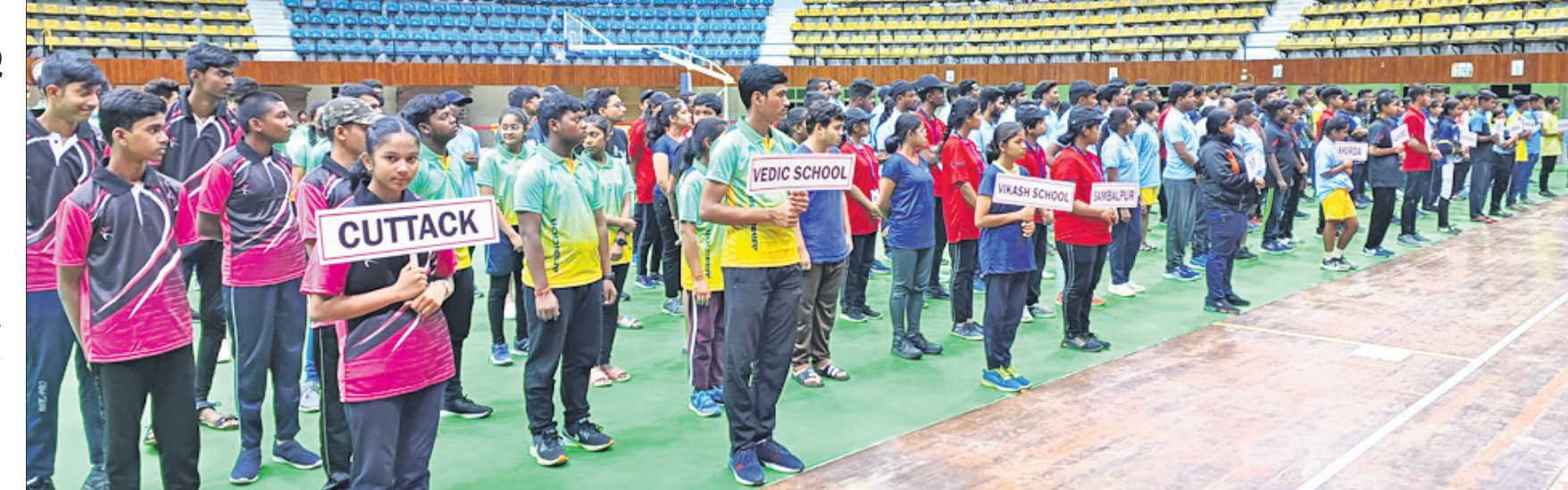
କଟକର ଜବାହରଲାଲ ନେହେରୁ ଇନ୍‌ଡୋର ଷ୍ଟାଡ଼ିୟମରେ ଶିନିବାର ରାଜ୍ୟ ଲନବଲ୍ ପ୍ରତିଯୋଗିତାର ଉଦ୍‌ଘାଟନା ଉତ୍ସବରେ ଅଂଶଗ୍ରହଣ କରିଥିବା ବିଭିନ୍ନ ଦଳର ପ୍ରତିଯୋଗୀ।