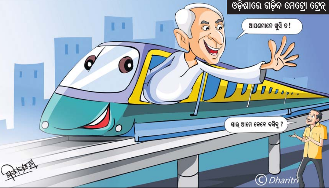
ଓଡ଼ିଶାରେ ଗତିକ ମେଟ୍ରୋ ଟ୍ରେନ୍