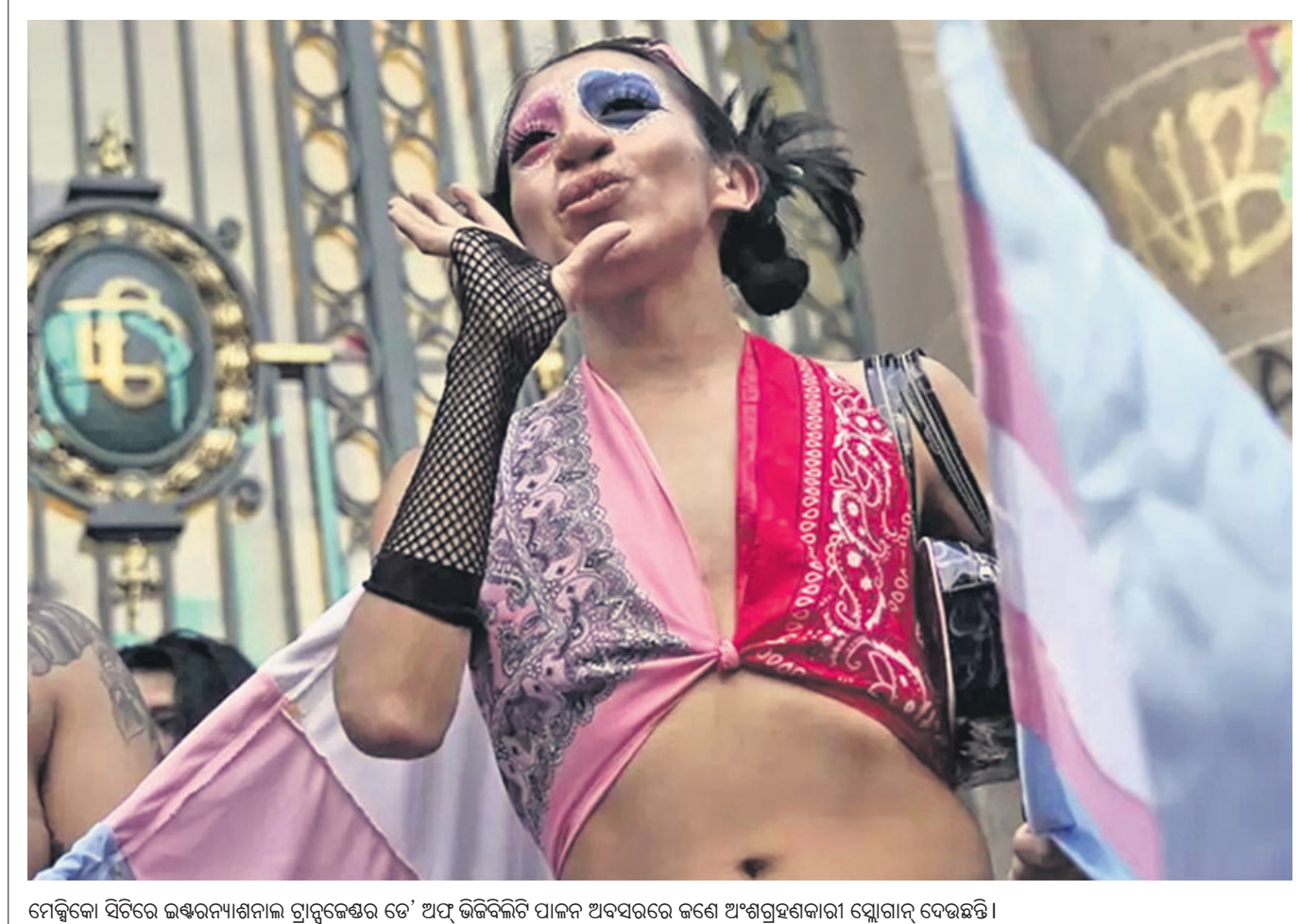
ନେପାଳୀ ସିତିରେ ଉତ୍ସବମୟାଶନାଳ ଗ୍ରାହକେଶ୍ୱର ଡେ' ଅଫ୍ ଭିଜିଟିଙ୍ଗି ପାଳନ ଅବସରରେ ଜଣେ ଅଂଶଗ୍ରହଣକାରୀ ଗୋଗାନ୍ ଦେଉଛନ୍ତି।

ଆମେରିକାର ଆକାନ୍ତ ଏବଂ ଇଲିନୋଇସ୍‌ରେ ଶୁକ୍ରବାର ଘୂର୍ଣ୍ଣିତ ଗାଡ଼ିରୁ ପ୍ରାୟ ୭ ଜଣଙ୍କ ମୃତ୍ୟୁ ଘଟିଛି। ଆକାନ୍ତରେ ଅନେକ ଘର ଏବଂ ଶିପ୍ ସେଠାରେ ଧସିଯିବା ହୋଇଯାଇଛି। ଅନ୍ୟପକ୍ଷେ ଇଲିନୋଇସ୍‌ରେ ଏକ ଧୂସର ଛାତ ଘାଟିପଡ଼ିଛି। ଏଥିରେ ଜଣଙ୍କର ମୃତ୍ୟୁ ଘଟିଥିବାବେଳେ ୨୮ ଜଣ ଆହତ ହୋଇଛନ୍ତି। ଛାତ ଭଗ୍ନାବଶେଷ ତଳେ ଅନେକ ଲୋକ ପସି ରହିଥିବା ଆଶଙ୍କା କରାଯାଇଛି। ସୁଲିବନ ନାଉଥ୍, ଇଣ୍ଡିଆନା ୩ ଜଣଙ୍କ ମୃତ୍ୟୁ ହୋଇଥିବା ଏମର୍ଜେନ୍ସି ନ୍ୟାସନେଲ୍ ଫୋରସ୍ ଡିଭିଜନ୍ କର୍ମୀ ପର୍ବରେ କହିଛନ୍ତି। ଘୂର୍ଣ୍ଣିତଗୁଡ଼ିରେ