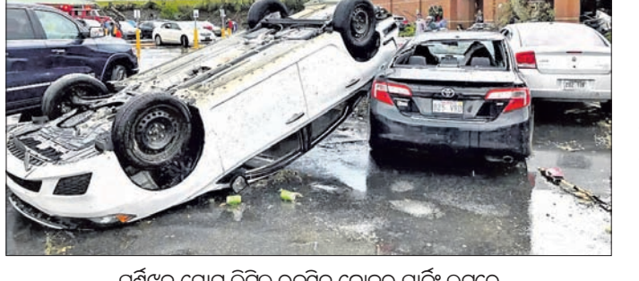
ଘୂର୍ଣ୍ଣିତ ଯୋଗୁ ଲିଟଲ୍ ରକ୍‌ସିଟି କ୍ରୋକର ପାର୍କ୍ ଲହରେ ଏକ କାର୍ ଅନ୍ୟ ଏକ କାର୍ ଉପରେ ଓଲଟିପଡ଼ିଛି।

ଅନେକ ନିଖୋଜ ଥିବା ଜଣାପଡ଼ିଛି। ୧୨ରୁ ଉର୍ଦ୍ଧ୍ୱ ଆହତ ହୋଇଛନ୍ତି। ଉତ୍ତର-ସେହିପରି ଲିଟଲ୍ ରକ୍ ଅଞ୍ଚଳରେ ମୃତ୍ୟୁ ହୋଇଥିବାବେଳେ ୨୨ରୁ ଉର୍ଦ୍ଧ୍ୱ ଆହତ ହୋଇଛନ୍ତି। ଉତ୍ତର-ପୂର୍ବ ଆକାନ୍ତ ଗଞ୍ଜ ଅଫ୍ ଫ୍ରେଜରେ ୨ ଜଣଙ୍କ ମୃତ୍ୟୁ ହୋଇଥିବା ଜଣାପଡ଼ିଛି।