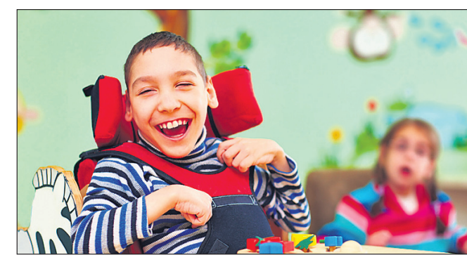
ବିଶ୍ୱ ଅଚ୍ଚିନ ସଚେତନତା ଦିବସ