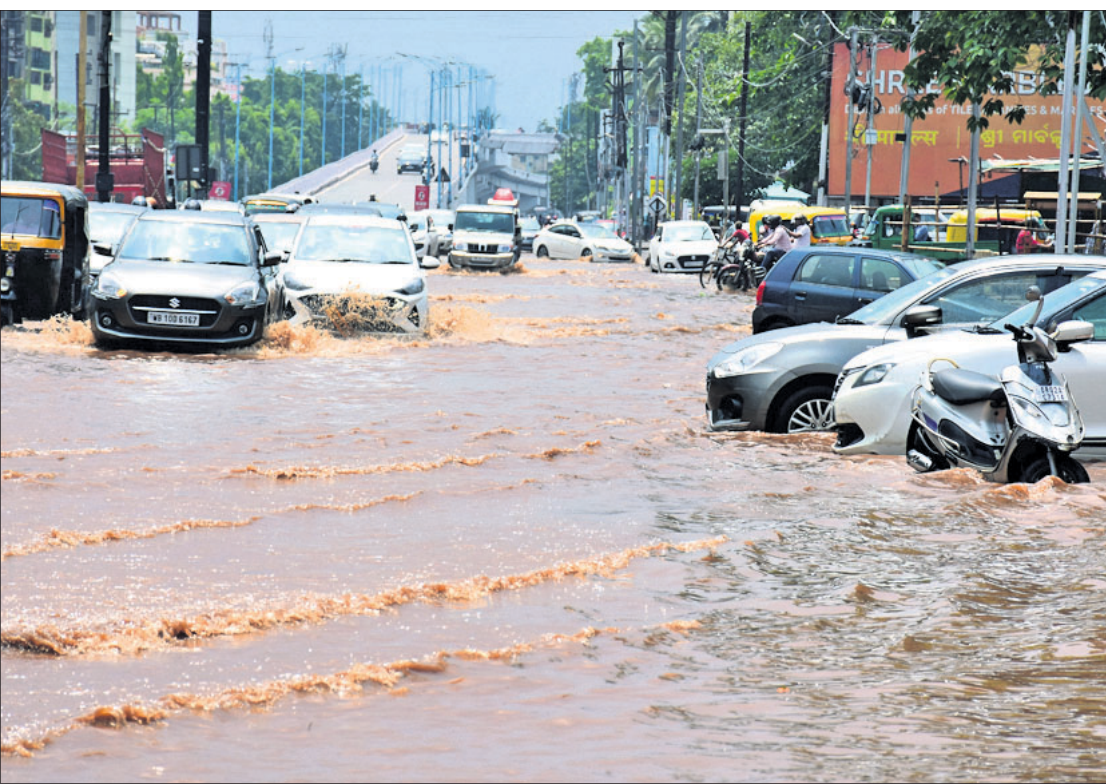
ପଶ୍ଚିମା ଝଡ଼ ପ୍ରଭାବରେ ବର୍ଷା ଯୋଗୁ ଶନିବାର ଭୁବନେଶ୍ୱରସ୍ଥିତ କଟକ ରୋଡ଼ର ବମିଖାଲ ଓଭରବ୍ରିଜ୍ ପାର୍ଶ୍ୱ ଓ ଏସ୍ପୋନେନ୍ସ ମଲ୍ ସମ୍ମୁଖରେ ଆଖୁଏ ପାଣି ଲହରୀ ମାଉଛି।