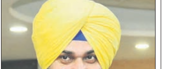
ନବଜୋତ୍ ସିଂ ସିକୁ

■ ରାଷ୍ଟ୍ରଲଙ୍କ ସହ କାହ ଇତି ଛିଡ଼ା ହେବି: ନବଜୋତ୍