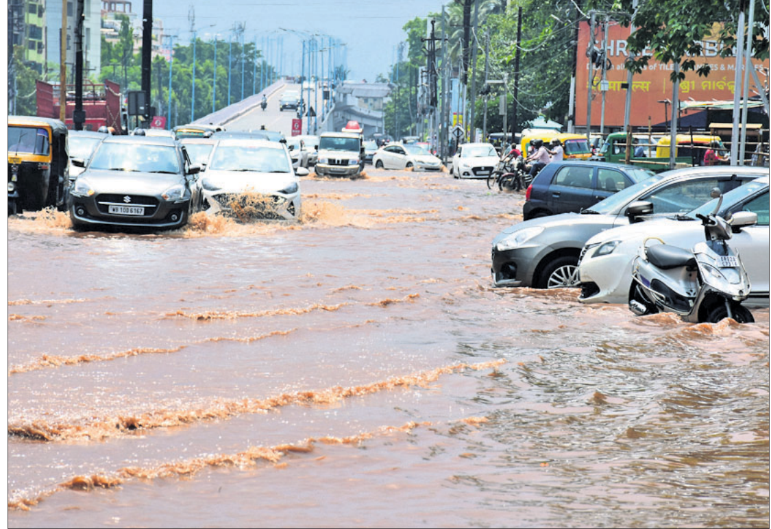
ପଶ୍ଚିମା ଝଡ଼ ପ୍ରଭାବରେ ବର୍ଷା ଯୋଗୁ ଶନିବାର ଭୁବନେଶ୍ୱରସ୍ଥିତ କଟକ ରୋଡ଼ର ବମିଖାଲ ଓଭରବ୍ରିଜ୍ ପାର୍ଶ୍ୱ ଓ ଏସ୍ପୋନେନ୍ସ ମଲ୍ ସମ୍ମୁଖରେ ଆଣ୍ଟି-ସିପି ଲହରୀ ମାଡୁଛି।

ସାତଥ୍ ଅଭିନେତ୍ରୀ କାଜଲ ଅଗ୍ରୱାଲ ନିକଟରେ ସାତଥ୍ ଲକ୍ଷଙ୍କୁ ବାମ କରିବାକୁ ପସନ୍ଦ କରୁଥିବା ଏକ ସାକ୍ଷାତକାରରେ କହିଛନ୍ତି।