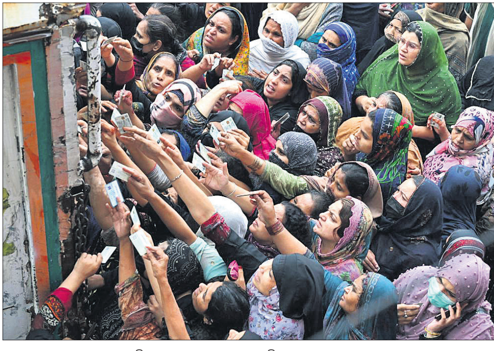
ମାଗଣା ଖାଦ୍ୟ ସାମଗ୍ରୀ ସଂଗ୍ରହ ଲାଗି ଏକ ବନ୍ଧନ କେନ୍ଦ୍ରରେ ଲୋକଙ୍କ ଭିଡ଼।

ପାକିସ୍ତାନରେ ପୁନଃସ୍ଥାପିତ ୫ ବର୍ଷକ ମଧ୍ୟରେ ସର୍ବାଧିକ ପ୍ରଭାରେ ପହଞ୍ଚିଛି। ମାର୍ଚ୍ଚରେ ପୁନଃସ୍ଥାପିତ ୩୫.୩୭ ପ୍ରତିଶତ ରହିଥିଲା। ଏହା ସାଙ୍ଗକୁ ଅନ୍ତର୍ଜାତୀୟ ପୁନଃପାଣି (ଆଇଏମ୍‌ଏଫ୍)ରୁ ରଣ ପାଇବା ପାଇଁ ଇସ୍ଲାମାବାଦ ଏହାର କେତେକ କଡ଼ା ସର୍ତ୍ତ ମାନିନେବାକୁ ବାଧ୍ୟ ହୋଇଛି। ଫଳରେ ଦରଦାମ୍ ଆକାଶକୁ ଆସି ହୋଇଥିବାରୁ ସାଧାରଣ ଲୋକଙ୍କ ପକ୍ଷେ ଖାଦ୍ୟସାମଗ୍ରୀ ଓ ଅନ୍ୟାବଶ୍ୟକ ଦ୍ରବ୍ୟ କିଣିବା କଷ୍ଟକର ହୋଇପଡ଼ିଛି। ପାକିସ୍ତାନରେ ଏବେ ଦୁର୍ଭିକ୍ଷ ସ୍ଥିତି ସୃଷ୍ଟି ହୋଇଥିବା ବିଶେଷଜ୍ଞମାନେ ମତ ଦେଇଛନ୍ତି। ଦେଶରେ ଆର୍ଥିକ ସଙ୍କଟର ଗମ୍ଭୀର ପ୍ରଭାବ ଗରିବ ପାକିସ୍ତାନୀୟ ଉପରେ ସର୍ବାଧିକ ପଡ଼ିଛି। ରମଜାନ ମାସରେ ମାଗଣା ଖାଦ୍ୟସାମଗ୍ରୀ ବନ୍ଧନ ହେଉଥିବା ଗ୍ଲାନରେ ଏତେ ଗହଳ ହେଉଛି ଯେ ଦକାବକଗାରେ ଇତିମଧ୍ୟରେ ୨୦ ଜଣଙ୍କ ଜୀବନ ଗଲାଣି।