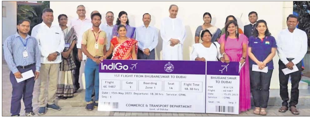
ଭୁବନେଶ୍ୱରରୁ ଦୁବାଇକୁ ସିଧାସଳଖ ବିମାନ ଯାତ୍ରା ପାଇଁ ଶନିବାର ନବୀନ ନିବାସଠାରେ ଟିକେଟର ଶୁଭାରମ୍ଭ ଅବସରରେ ମୁଖ୍ୟମନ୍ତ୍ରୀ ନବୀନ ପଟ୍ଟନାୟକଙ୍କ ସହିତ ଅନ୍ୟମାନଙ୍କର ଫୋଟୋ

ମେ ୧୫ରୁ ଭୁବନେଶ୍ୱରରୁ ଦୁବାଇକୁ ସିଧାସଳଖ ବିମାନ ଉଡ଼ିବ । ଏହି ପରିପ୍ରେକ୍ଷାରେ ଶନିବାର ଓଡ଼ିଶା ବିସର୍ଦ୍ଧା ଟିକେଟ ବିକ୍ରି ଆରମ୍ଭ ହୋଇଛି । ମୁଖ୍ୟମନ୍ତ୍ରୀ ନବୀନ ପଟ୍ଟନାୟକ ନବୀନ ନିବାସଠାରେ ଏହାର ଶୁଭାରମ୍ଭ କରି କହିଲେ, ସଂଯୋଗାଳନ ବିକାଶର ଚାଲିଥିବା ଏବଂ ରାଜ୍ୟ ସରକାର ଏଥିପାଇଁ ସର୍ବଦା ପ୍ରୟାସ ରତ । ଦୁବାଇକୁ ସିଧାସଳଖ ବିମାନ ସେବା ଦ୍ୱାରା ଭୁବନେଶ୍ୱର ସମୁଦାୟ ବିମାନ ଚଳାଚଳର ଅନୁଭବ ବଡ଼ ହେବ । ବିଶ୍ୱକୁ ସିଧାସଳଖ ଯୋଗାଣ କରିବା ସହ ଆର୍ଥିକ, ଉପାଦାନ ଏବଂ ପର୍ଯ୍ୟଟନ ପରି କ୍ଷେତ୍ରରେ ଓଡ଼ିଶାରେ ବିନିଯୋଗ ଉପରେ ଏହାର ବହୁମୁଖୀ ପ୍ରଭାବ ପଡ଼ିବ । ଏହି ବିମାନ ଚଳାଚଳ ଓଡ଼ିଶା ପାଇଁ ନୂତନ ଆଶା ସୂଚୀ କରୁଛି । ଏଥିପାଇଁ ରାଜ୍ୟରୁ ଏକ ବୃଦ୍ଧ ପ୍ରତିଷ୍ଠା ଏକ ଦୁବାଇ ଅଭିଯୋଗ ଯାତ୍ରା କରିବେ ବୋଲି ମୁଖ୍ୟମନ୍ତ୍ରୀ ସୂଚନା ଦେଇଛନ୍ତି । ଏଥିସହ ବିମାନ ଚଳାଚଳ ପାଇଁ