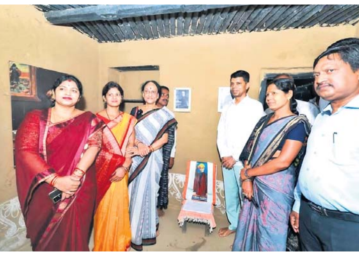
ମଧୁବାବୁଙ୍କ ଅନ୍ତର୍ଦ୍ଧିଶାଳରେ ୫-ଟି ସରକାରୀ, ମହିଳା ମିଶନ ଶକ୍ତି ସଦସ୍ୟା ଓ ପ୍ରଶାସନିକ ଅଧିକାରୀମାନେ।