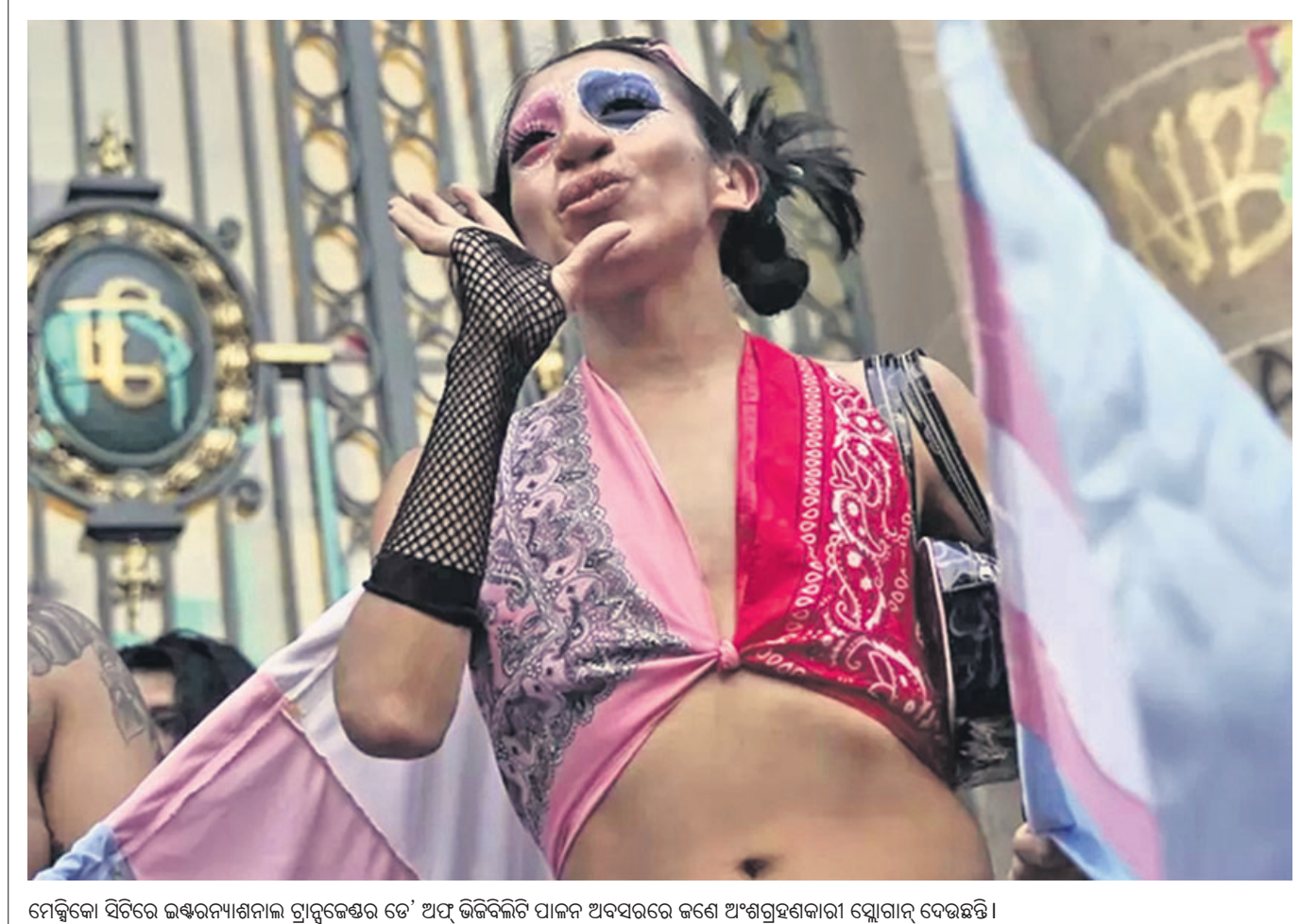
ମେକ୍ସିକୋ ସିଟିରେ ଇଣ୍ଡରଗ୍ରାଉଣ୍ଡ ଗ୍ରାଉଣ୍ଡରେ ତେ' ଅଫ୍ ଭିଜିଟିଙ୍ଗି ପାଳନ ଅବସରରେ ଜଣେ ଅଂଶଗ୍ରହଣକାରୀ ଗୋଗାନ୍ ଦେଉଛନ୍ତି।