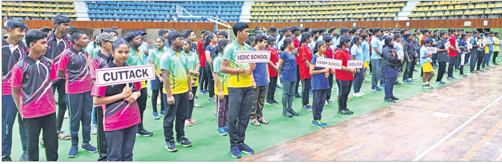
କଟକର ଜବାହରଲାଲ ନେହେରୁ ଇନ୍‌ଡୋର ଷ୍ଟାଡ଼ିୟମରେ ଶିନିବାର ରାଜ୍ୟ ଲନ୍‌ବଲ୍ ପ୍ରତିଯୋଗିତାର ଉଦ୍‌ଘାଟନା ଉତ୍ସବରେ ଅଂଶଗ୍ରହଣ କରିଥିବା ବିଭିନ୍ନ ଦଳର ପ୍ରତିଯୋଗୀ।