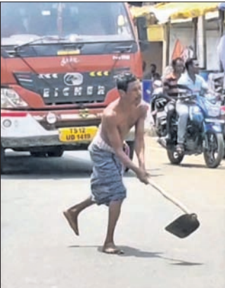
ଚଳାଇବା ବାଧାପାତ୍ର ହୋଇଛି।

ପାପଡ଼ାହାଣ୍ଡି, ୧୪(ବି.ପ୍ର.) ନବରଙ୍ଗପୁର ଜିଲ୍ଲା ପାପଡ଼ାହାଣ୍ଡି ସହରର ଭବାନି ଛକରେ ଶନିବାର ଜଣେ ନିଶାପଲ୍ଲ ମୃତକ ଦୀର୍ଘ ସମୟ ଧରି ହାତରେ କୋପାଳ ଧରି ବୁଲାଇବା ଯୋଗୁଁ ରାସ୍ତାରେ ଗାଡି ଚଳାଇବା ବାଧାପାତ୍ର ହୋଇଛି।