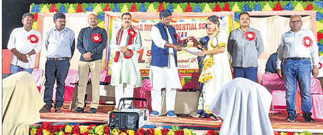
ଅତିଥି ଜଣେ କୁଟା ପ୍ରତିଯୋଗୀଙ୍କୁ ପୁରସ୍କୃତ କରୁଛନ୍ତି।

କରି ସମୟ ସହ ଚଳିବେଳେ ଭଲପାଠ ପଢ଼ିବାକୁ ଛାତ୍ରଛାତ୍ରୀଙ୍କୁ ସେମାନେ କହିଥିଲେ।