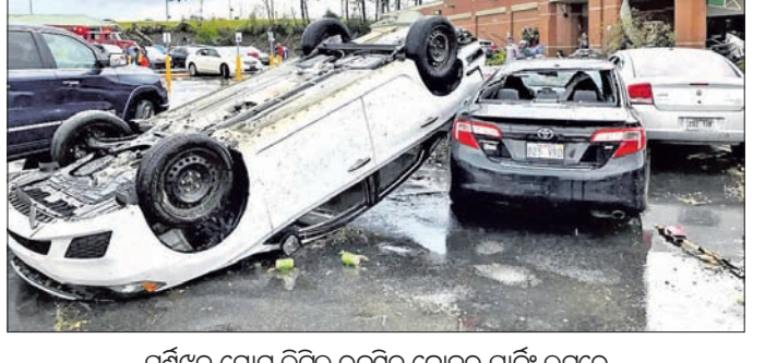
ଘୂର୍ଣ୍ଣିତ ଯୋଗୁ ଲିଟଲ୍ ରକ୍‌ସିଟି କ୍ରୋକର ପାର୍କ୍ ଲହରେ ଏକ କାର୍ ଅନ୍ୟ ଏକ କାର୍ ଉପରେ ଓଲଟିପଡ଼ିଛି।

ଅନେକ ନିଖୋଜ ଥିବା ଜଣାପଡ଼ିଛି। ୧୨ରୁ ଉର୍ଦ୍ଧ୍ୱ ଆହତ ହୋଇଛନ୍ତି। ଉତ୍ତର-ସେହିପରି ଲିଟଲ୍ ରକ୍ ଅଞ୍ଚଳରେ ମୃତ୍ୟୁ ହୋଇଥିବାବେଳେ