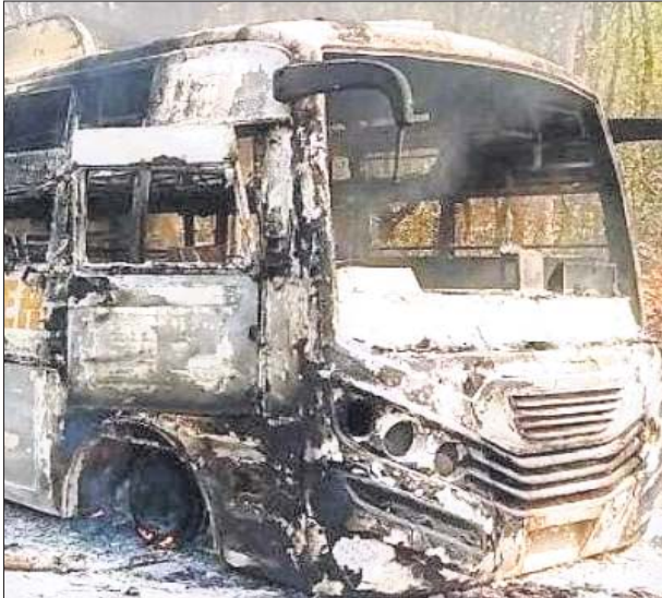
ମାଓବାଦୀମାନେ ପୋଡ଼ିଦେଇଥିବା ବସ୍ ।

ମାଓବାଦୀ ଗ୍ରାମୀଣତା ଭାବେ ଛତିଶଗଡ଼ ରାଜ୍ୟରେ ହିଂସା ଘଟାଇ ରାଜିଛନ୍ତି । ନିକଟରେ ସେମାନେ ରାୟା କାର୍ଯ୍ୟରେ ନିୟୋଜିତ ଠିକାଦାରଙ୍କ ୧୦ଟି ଗାଡ଼ି ପୋଡ଼ିଦେଇଥିଲେ । ଶୁକ୍ରବାର ଏକ ଗ୍ରାମରେ ଥିବା ମୋବାଇଲ୍ ଟାଣ୍ଡର ପୋଡ଼ିଥିବା ବେଳେ ଶନିବାର ସେମାନେ ଏକ ଯାତ୍ରୀବାହୀ ବସ୍‌ରେ ନିଆଁ ଲଗାଇ ପୋଡ଼ିଦେଇଛନ୍ତି । ଭୋର ସମୟରେ ନାରାୟଣପୁରରୁ ଦାନ୍ତେଶ୍ୱରୀକୁ ଯାଉଥିବା ଏକ ଯାତ୍ରୀବାହୀ ବସ୍‌କୁ ପ୍ରାୟ ୨୦ରୁ ଊର୍ଦ୍ଧ୍ୱ ସମସ୍ତ ମାଓବାଦୀ ମାଲେବାହି-ବାଦଳି ସିଆରପିଏସ୍ କ୍ୟାମ୍ପଠାରୁ ଅଳ୍ପ ଦୂରରେ ଅଟକାଇ ବସ୍‌ରେ ନିଆଁ ଲଗାଇ ଦେଇଥିଲେ । ବସ୍‌ଟି ଦାନ୍ତେଶ୍ୱରୀ ଜିଲାର ବସ୍‌ସ୍ଟେସନ୍‌ରେ ଏକ ପ୍ରାୟୋଗିକ ସମ୍ପ୍ରଦାୟ ବୋଲି ଜଣାପଡ଼ିଛି । ଏହି ସମୟରେ ମାଓବାଦୀମାନେ ବସ୍‌ର ଭ୍ରାଜଭର ଓ କଣ୍ଠରୁକୁ ମାଡ଼ ମାରିଛନ୍ତି । ତେବେ ସମସ୍ତ ଯାତ୍ରୀ ସୁରକ୍ଷିତ ଥିବା ଜଣାପଡ଼ିଛି ।