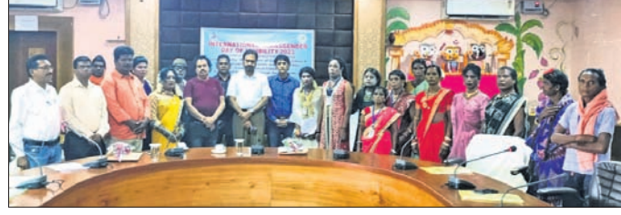
ବୈଠକରେ ଜିଲ୍ଲାପାଳ, ଅଧିକାରୀ ଓ କିନରସଂଘ ସଦସ୍ୟମାନେ।

ନବରଙ୍ଗପୁର ଜିଲ୍ଲା ପାପଡ଼ାହାଣ୍ଡି ବ୍ଲକ୍ ଚୁଲୁଲି ପଞ୍ଚାୟତ ରକାମାପୁରରେ ଶନିବାର ସାଇଜ ପଟା କାଠ ଚାଲାଣ ବେଳେ ଜଣକୁ ଗିରଫ କରିଛନ୍ତି ବନ ବିଭାଗ।