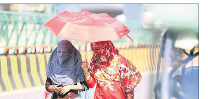
ଉତ୍ତରପ୍ରଦେଶ, ପଶ୍ଚିମବଙ୍ଗ, ଛତିଶଗଡ଼, ମହାରାଷ୍ଟ୍ର, ଗୁଜରାଟ, ପଞ୍ଜାବ ଓ ହରିୟାଣାରେ ଅଧିକ ଗ୍ରୀଷ୍ମ ଲହର

ପ୍ରାସିଦ୍ଧ ହେବ ବୋଲି ଆଇଏମ୍‌ଡି ମହାନିର୍ଦ୍ଦେଶକ ମୁଖ୍ୟମନ୍ତ୍ରୀ ମହାପାତ୍ର ଏକ ଭର୍ଚୁଆଲ୍ ଖବରଦାତା ସମ୍ମିଳନୀରେ