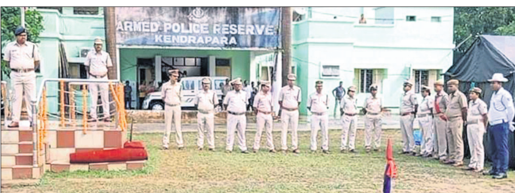
ପୋଲିସ ପ୍ରତିଷ୍ଠା ଦିବସ ଉତ୍ସବରେ ଏସ୍ପି ଅଭିବାଦନ ଗ୍ରହଣ କରୁଛନ୍ତି ।

ସାମ୍ପାଦିକ ବ୍ୟବସ୍ଥାରେ ପୋଲିସର ଭୂମିକା ରୁହୁତ୍ୱର୍ଣ୍ଣ । ଏଥିପାଇଁ ନିଷ୍ଠା, ଯୌର୍ଯ୍ୟ, ଶୌର୍ଯ୍ୟ ଓ ସମାଜସେବିତା ଆବଶ୍ୟକ । ଦେଶର ବନ୍ୟା, ବାତ୍ୟା, ଆଇନ ଶୁଖିଲରେ ଓଡ଼ିଶା ପୋଲିସ ଦାମ୍ଭି ୮୮ ବର୍ଷ ହେବ ନିଜର କର୍ତ୍ତବ୍ୟ ପରାୟଣତା ଦେଖାଇଛି । ଏଥିପାଇଁ ପୋଲିସ ବାହିନୀ ଗର୍ବିତ ବୋଲି ଜଗାଜଲ୍ଲିତ କେନ୍ଦ୍ରାପଡ଼ା ରିକର୍ଡ଼ ପୋଲିସ ଗ୍ରାଉଣ୍ଡରେ ଏସ୍ପି ମତକର ସମିତ ସମ୍ପତ ପ୍ରକାଶ କରିଛନ୍ତି । ଶନିବାର ସକାଳେ ଓଡ଼ିଶା ପୋଲିସ ପ୍ରତିଷ୍ଠା ଦିବସ ସମାରୋହରେ ମୁଖ୍ୟଅତିଥି ଭାବେ ଯୋଗ ଦେଇ ସେ କହିଛନ୍ତିଯେ, ୧୯୩୬ରେ ଏହି ପୋଲିସ ବାହିନୀ ଗଠନ କରାଯାଇଥିଲା । ଓଡ଼ିଶାରେ ବରପୁତ୍ରଙ୍କ ପରାମର୍ଶ କ୍ରମେ ଗଠିତ ଏହି ବାହିନୀ ସ୍ୱାଧୀନତା ସଂଗ୍ରାମ, ବନ୍ୟା, ବାତ୍ୟାପରି