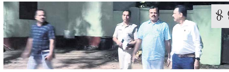
ବଲାଙ୍ଗୀର ଏସ୍‌ପି ଅଧିକାରୀ ଶନିବାର ସନ୍ଧ୍ୟାରେ କ୍ରାଇମ୍‌ଟ୍ରାଷ୍ଟ ଟିମ୍ ପହଞ୍ଚିଛନ୍ତି।