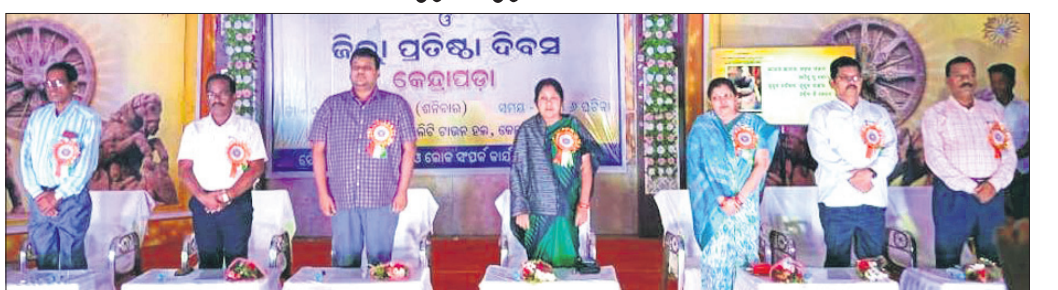
ଜିଲ୍ଲାପ୍ରଧାନ ଉତ୍ସବରେ ମଞ୍ଚାସୀନ ଅତିଥି ।