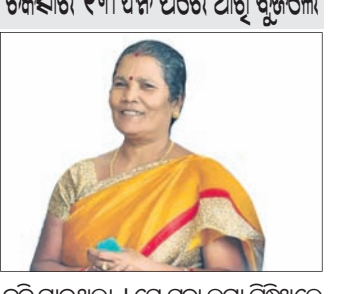
ଚିକିତ୍ସାର ୧୩ ଦିନ ପରେ ଆଖି ଚିକିତ୍ସା

ନୟାଗଡ଼ ସହରର ନୟାଗଡ଼ ସ୍ୱୟଂ ଶାସିତ ମହାବିଦ୍ୟାଳୟ ନିକଟସ୍ଥ ନାରାୟଣ ମନ୍ଦିରରେ ଗତ ମାର୍ଚ୍ଚ ୧୪ରେ ପୂଜାର୍ଚ୍ଚନା କରୁଥିବାବେଳେ ଦୀପ ନିଆଁରେ ପୋଡ଼ି ଯାଇଥିଲେ । ସକାଳେ ଦୋକାନ ଖୋଲିବା ବିକ୍ରୟ ହେବାରୁ ମାଲିକ କବାଟ ବାଡ଼େଇ ଡାକିଥିଲେ । କିନ୍ତୁ ସିଲ୍ ନ ଶୁଣିବାରୁ ଘରୁ ବିତୀତ ଚାପି ଆଣି କବାଟ ଖୋଲିଥିଲେ । ଏଥି ସହିତ ମୃତ ଯୁବକର ବାପା ପାଣିରେ ଲିଖିତ ଅଭିଯୋଗ କରିଛନ୍ତି । ଅଭିଯୋଗ ପାଇ ପୋଲିସ ମୃତ ଦେହକୁ ଜବତ କରିବା ସହିତ ଦୋକାନ ମାଲିକ କାର୍ତ୍ତିକକୁ ଅଟକ ରଖି ଛାଡ଼ି ଅଧିକା ତଦତ୍ତ ପାଇଁ ସାଲ୍ଫିଟିକ ଚିମ୍ ଡାକିଛନ୍ତି । ଏହି ଘଟଣାକୁ ନେଇ ଗ୍ରାମରେ ଚାପ ଉତ୍ତେଜନା ପ୍ରକାଶ ପାଇଛି ।