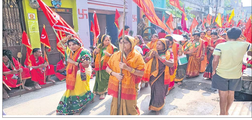
ମହିଳାଙ୍କ ନଗର ପରିକ୍ରମା ।