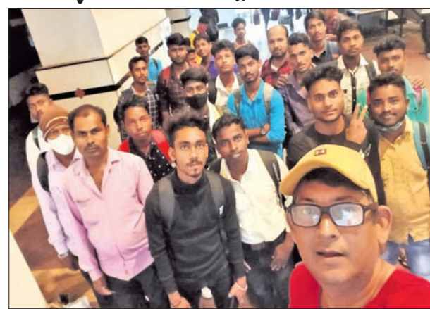
ହାଇଦ୍ରାବାଦକୁ ପ୍ରଶିକ୍ଷଣ ପାଇଁ ଯାଉଥିବା ଯୁବକମାନେ।