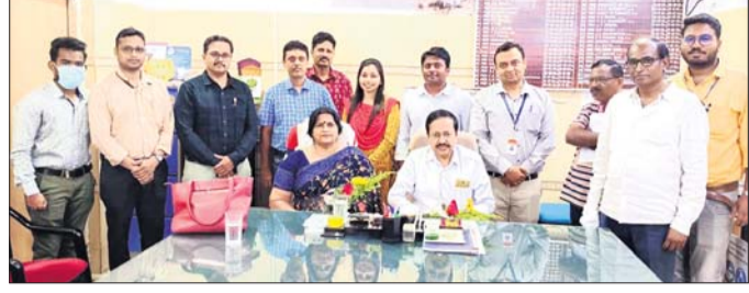
ଏମ୍ବେକସିଟି ଅଧ୍ୟକ୍ଷ ଓ ଅଧ୍ୟକ୍ଷକ ଦାୟିତ୍ୱଗ୍ରହଣ।