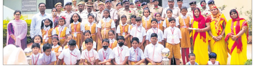
ଆନା ବୁଲିବାକୁ ଆସିଥିବା ଛାତ୍ରଛାତ୍ରୀ ।

ଓଡ଼ିଶା, ୧୧୪ (ସ.ପ୍ର.) ନୟାଗଡ଼ ଜିଲ୍ଲା ଓଡ଼ିଶା ଆଦର୍ଶ ଆନାରେ ଏକ ନିଆରା ଛକରେ ୮୮ ତନ ଓଡ଼ିଶା ଦିବସ ସହିତ ପୋଲିସ ପ୍ରତିଷ୍ଠା ଦିବସ ପାଳିତ କରିଛି । ସକାଳୁ ନିକଟସ୍ଥ ମହାବାଦୀ ଗାୟତ୍ରୀ ବିଦ୍ୟାଳୟର ସମସ୍ତ ଛାତ୍ରଛାତ୍ରୀ ଛାତ୍ରୀମାନଙ୍କ ସମାବେଶ ପରି ସ୍ଥଳର ଶିକ୍ଷୟିତ୍ରୀ ଶିକ୍ଷକଙ୍କ