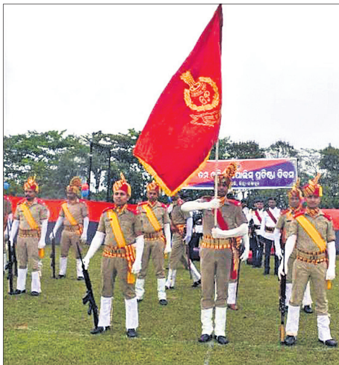
ପୋଲିସ ପ୍ରତିଷ୍ଠା ଦିବସରେ ଅନୁଷ୍ଠିତ ପରେଡ଼ ।