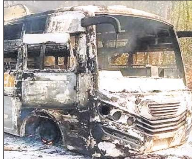
ମାଓବାଦୀମାନେ ପୋଡ଼ିଦେଇଥିବା ବସ୍ ।