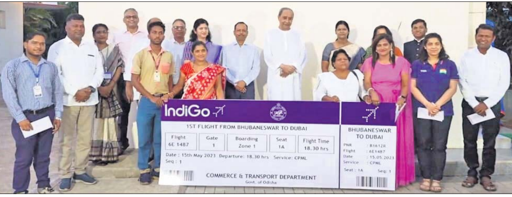
ଭୁବନେଶ୍ୱରରୁ ଦୁବାଇକୁ ସିଧାସଳଖ ବିମାନ ଯାତ୍ରା ପାଇଁ ଶନିବାର ନବୀନ ଦିବାସଠାରେ ଟିକେଟର ଶୁଭାରମ୍ଭ ଅବସରରେ ମୁଖ୍ୟମନ୍ତ୍ରୀ ନବୀନ ପଟ୍ଟନାୟକ ।

ମେ ୧୫ରୁ ଭୁବନେଶ୍ୱରରୁ ଦୁବାଇକୁ ସିଧାସଳଖ ବିମାନ ଉଡ଼ିବ । ଏହି ପରିପ୍ରେକ୍ଷାରେ ଶନିବାର ଓଡ଼ିଶା ଦିବସରେ ଟିକେଟ୍ ବିକ୍ରି ଆରମ୍ଭ ହୋଇଛି । ମୁଖ୍ୟମନ୍ତ୍ରୀ ନବୀନ ପଟ୍ଟନାୟକ ନବୀନ ଦିବାସଠାରେ ଏହାର ଶୁଭାରମ୍ଭ କରି କହିଲେ, ସଂଯୋଗାଳନ ବିକାଶର ଚାହିଦା ଏବଂ ରାଜ୍ୟ ସରକାର ଏଥିପାଇଁ ସର୍ବଦା ପ୍ରୟାସ ରତ । ଦୁବାଇକୁ ସିଧାସଳଖ ବିମାନ ସେବା ଦ୍ୱାରା ଭୁବନେଶ୍ୱର ସମୁଦାୟ ବିମାନ ଚଳାଚଳର ଅନୁଭବ ବଡ଼ ହେବ । ବିଶ୍ୱକୁ ସିଧାସଳଖ ଯୋଗାଣ ସହ ଆଇଟି, ଉତ୍ପାଦନ ଏବଂ ପର୍ଯ୍ୟଟନ ପରି କ୍ଷେତ୍ରରେ ଓଡ଼ିଶାରେ ବିନିଯୋଗ ଉପରେ ଏହାର ବହୁତୁଣ୍ଡ ପ୍ରଭାବ ପଡ଼ିବ । ଏହି ବିମାନ ଚଳାଚଳ ଓଡ଼ିଶା ପାଇଁ ନୂତନ ଆଶା ସୂଚୀ କରୁଛି । ଏଥିପାଇଁ ରାଜ୍ୟରୁ ଏକ ଦସ୍ତକ ପ୍ରତିନିଧି ଏକ ଦୁବାଇ ଅଭିଯୁକ୍ତ ଯାତ୍ରା କରିବେ ବୋଲି ମୁଖ୍ୟମନ୍ତ୍ରୀ ସୂଚନା ଦେଇଛନ୍ତି । ଏଥିସହ ବିମାନ ଚଳାଚଳ ପାଇଁ