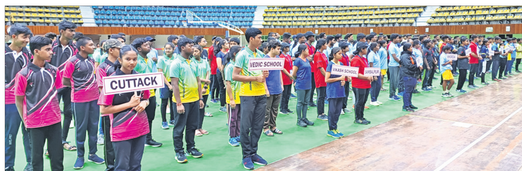
କଟକର ଜବାହରଲାଲ ନେହେରୁ ଇନ୍‌ଡୋର ଷ୍ଟାଡିୟମରେ ଶନିବାର ରାଜ୍ୟ ଲନ୍‌ବଲ୍ ପ୍ରତିଯୋଗିତାର ଉଦ୍‌ଘାଟନା ଉତ୍ସବରେ ଅଂଶଗ୍ରହଣ କରିଥିବା ବିଭିନ୍ନ ଦଳର ପ୍ରତିଯୋଗୀ।