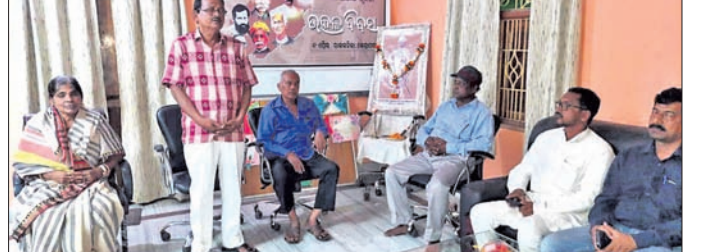
ଓଡ଼ିଶା ଦିବସ କାର୍ଯ୍ୟକ୍ରମରେ ଯୋଗଦେଇଥିବା ଅତିଥିବୃନ୍ଦ ।

ଓଡ଼ିଶା ପ୍ରଦେଶ ଗଠନରେ କନିକା ରାଜ୍ୟ ରାଜ୍ୟର ନାରାୟଣ ଭଞ୍ଜଦେଓଙ୍କ ଭୂମିକା ଅତୁଳନୀୟ ଥିଲା । ଉତ୍କଳ ସମ୍ମିଳନୀରେ ମୁଖ୍ୟ ଭାବେ ତାଙ୍କ ସହଯୋଗ ଅବଶ୍ୟତୀୟ । କନିକା ରାଜ୍ୟ ପ୍ରାସାଦ ସ୍ୱତନ୍ତ୍ର ଓଡ଼ିଶା ପ୍ରଦେଶ ଗଠନର ପୂର୍ବସାକ୍ଷୀ । କଂଗ୍ରେସଙ୍କ ସହ ସମ୍ପର୍କ ସ୍ଥାପନ କରି ସ୍ୱତନ୍ତ୍ର ଓଡ଼ିଶା ଗଠନ ପାଇଁ ତତ୍କାଳୀନ ରାଜାସାହେବଙ୍କ ପ୍ରୟାସ ଜାରି ରଖି ଥିଲେ ବୋଲି ବକ୍ତାମାନେ ମତବ୍ୟକ୍ତ କରିଛନ୍ତି । ଉତ୍କଳ ଗୌରବ ମଧୁସୂଦନ ଦାସ ଏବଂ ପଞ୍ଚିତ ଗୋପବନ୍ଧୁ ଦାସଙ୍କ ସ୍ମରଣ ଓଡ଼ିଶା ଗଠନରେ ରାଜା ସାହେବଙ୍କ ଅନେକ ପ୍ରଚେଷ୍ଟା ବୋଲି ଶନିବାର ରାଜକନିକା ଶୈଳକ୍ଷ୍ମ ନାରାୟଣ ମହାବିଦ୍ୟାଳୟ ପରିସରରେ ଆୟୋଜିତ ସ୍ୱତନ୍ତ୍ର ଓଡ଼ିଶା ପ୍ରଦେଶ ଗଠନ ସମାରୋହରେ ଯୋଗଦେଇ ଅତିଥିମାନେ ମତବ୍ୟକ୍ତ କରିଛନ୍ତି । ସୁଧା ସାହିତ୍ୟ ପତ୍ରିକାର ସମ୍ପାଦକ