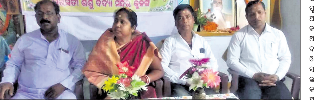
ଓଡ଼ିଶା ଦିବସ ସମାରୋହରେ ଯୋଗଦେଇଥିବା ଅତିଥିମାନେ।