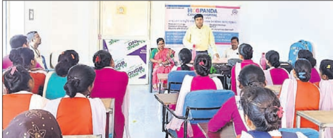
କାର୍ଯ୍ୟକ୍ରମରେ ଯୋଗ ଦେଇଥିବା ଅତିଥି ଓ ଛାତ୍ରୀମାନେ।