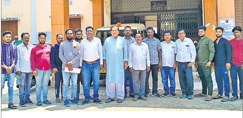
ତହସିଲଦାରଙ୍କୁ ଅଭିଯୋଗ କରିବାକୁ ଆସିଥିବା ଆନ୍ଦେଜକର ଚାରିଚେରୁଳ ଗ୍ରନ୍ଥ କର୍ମକର୍ତ୍ତା।