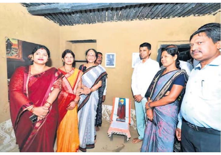
ମଧୁବାବୁଙ୍କ ଅନ୍ତର୍ଦ୍ଧିଶାଳରେ ୫-ଟି ସରକାରୀ, ମହିଳା ମିଶନ ଶକ୍ତି ସଦସ୍ୟା ଓ ପ୍ରଶାସନିକ ଅଧିକାରୀମାନେ।