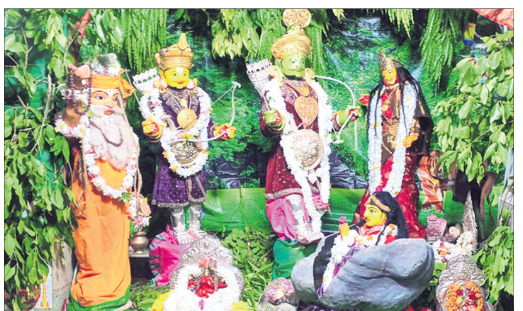
ଅହଲ୍ୟା ଉଦ୍ଧାରଣ ବେଶରେ ଶ୍ରୀକାନ୍ତ ।