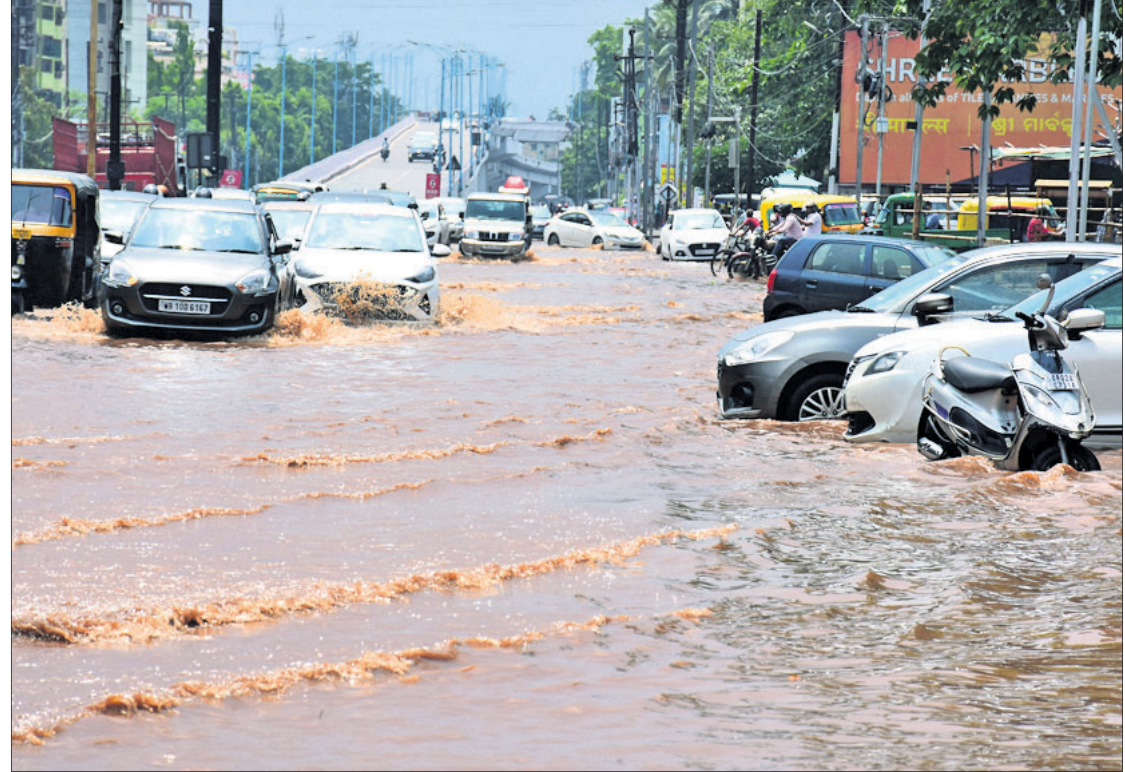
ପଶ୍ଚିମା ଝଡ଼ ପ୍ରଭାବରେ ବର୍ଷା ଯୋଗୁ ଶନିବାର ଭୁବନେଶ୍ୱରସ୍ଥିତ କଟକ ରୋଡ଼ର ବମିଖାଲ ଓଭରବ୍ରିଜ୍ ପାର୍ଶ୍ୱ ଓ ଏସ୍ପୋନେନ୍ସ ମଲ୍ ସମ୍ମୁଖରେ ଆଖୁଏ ପାଣି ଲହରୀ ମାଡୁଛି।