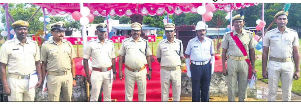
ସମ୍ମାନିତ ହୋଇଥିବା ପୋଲିସ କର୍ମଚାରୀ ।