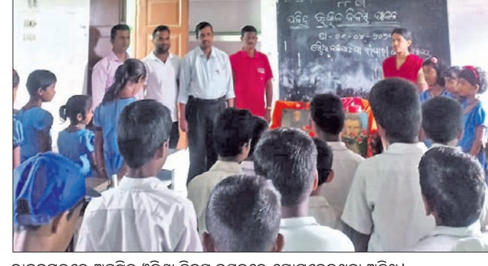
ରାଜନଗରରେ ଅନୁଷ୍ଠିତ ଓଡ଼ିଶା ଦିବସ ଉତ୍ସବରେ ଯୋଗଦେଇଥିବା ଅତିଥି ।