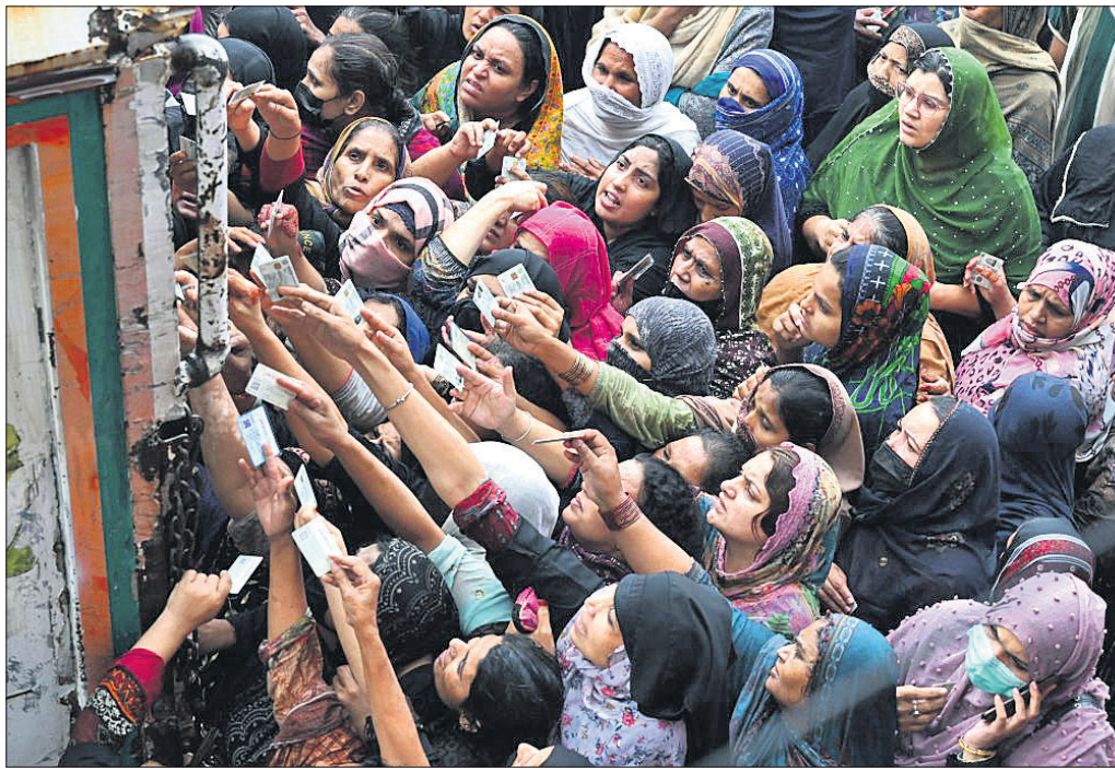
ମାଗଣା ଖାଦ୍ୟ ସାମଗ୍ରୀ ସଂଗ୍ରହ ଲାଗି ଏକ ବନ୍ଧନ କେନ୍ଦ୍ରରେ ଲୋକଙ୍କ ଭିଡ଼।

ପାକିସ୍ତାନରେ ପୁନଃସ୍ଥାପିତ ୫ ବର୍ଷକ ମଧ୍ୟରେ ସର୍ବାଧିକ ପ୍ରଭାବରେ ପହଞ୍ଚିଛି। ମାର୍ଚ୍ଚରେ ପୁନଃସ୍ଥାପିତ ୩୫.୩୭ ପ୍ରତିଶତ ରହିଥିଲା। ଏହା ସାଙ୍ଗକୁ ଅନ୍ତର୍ଜାତୀୟ ପୁନଃପାଣି (ଆଇଏମ୍‌ଏଫ୍)ରୁ ରଣ ପାଇବା ପାଇଁ ଇସ୍ଲାମାବାଦ ଏହାର କେତେକ କଡ଼ା ସର୍ତ୍ତ ମାନିନେବାକୁ ବାଧ୍ୟ ହୋଇଛି। ଫଳରେ ଦରଦାମ୍ ଆକାଶକୁ ଆହୋଇଥିବାରୁ ସାଧାରଣ ଲୋକଙ୍କ ପକ୍ଷେ ଖାଦ୍ୟସାମଗ୍ରୀ ଓ ଅନ୍ୟାବଶ୍ୟକ ଦ୍ରବ୍ୟ କିଣିବା କଷ୍ଟକର ହୋଇପଡ଼ିଛି। ପାକିସ୍ତାନରେ ଏବେ ଦୁର୍ଭିକ୍ଷ ସ୍ଥିତି ସୃଷ୍ଟି ହୋଇଥିବା ବିଶେଷଜ୍ଞମାନେ ମତ ଦେଇଛନ୍ତି। ଦେଶରେ ଆର୍ଥିକ ସଙ୍କଟର ଗମ୍ଭୀର ପ୍ରଭାବ ଗରିବ ପାକିସ୍ତାନୀୟ ଉପରେ ସର୍ବାଧିକ ପଡ଼ିଛି। ରମଜାନ ମାସରେ ମାଗଣା ଖାଦ୍ୟସାମଗ୍ରୀ ବନ୍ଧନ ହେଉଥିବା ଗ୍ଲାନରେ ଏତେ ଗହଳ ହେଉଛି ଯେ ଦକାବକଗାରେ ଇତିମଧ୍ୟରେ ୨୦ ଜଣଙ୍କ ଜୀବନ ଗଲାଣି।