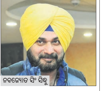
ନବଜୋତ୍ ସିଂ ସିକୁ

ରାଜ୍ୟରେ ରାଷ୍ଟ୍ରପତି ଶାସନ ଲାଗୁ କରିବା ପାଇଁ ଷଡ଼ଯନ୍ତ୍ର କରାଯାଇଛି। ଭାଜପା ପଞ୍ଜାବକୁ ଦୁର୍ଭିକ୍ଷ କରିବାକୁ ଚାହୁଁଛି, ଯାହା ଅସମ୍ଭବ। ସେ କଂଗ୍ରେସ୍ ନେତା ରାଜୁଲ୍ ଗାଣ୍ଡା, ପ୍ରିୟଙ୍କା ଗାଣ୍ଡା ଏବଂ ପ୍ରଦେଶ ଦଳୀୟ କର୍ମଚାରୀଙ୍କ ସହିତ କାହ ଇତି ଛିଡ଼ାହୋଇ ରହିବେ ବୋଲି କହିଛନ୍ତି। ଅନ୍ୟପକ୍ଷେ ଏପି ଗଣତନ୍ତ୍ର ଏକ ଜିଣିବା ଯେତେବେଳେ ମାନ୍ ରାଜ୍ୟବାସୀଙ୍କୁ ମିଛ ପ୍ରତିଷ୍ଠିତ ଦେଇ ବୋକା ଦନାଉଥିବା ଅଭିଯୋଗ ଆଣିଛନ୍ତି।