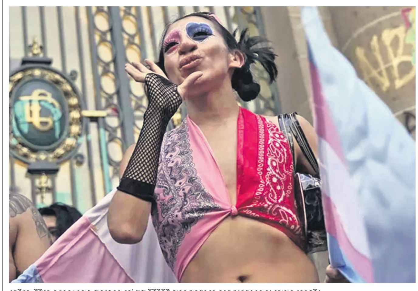
ମେକ୍ସିକୋ ସିଟିରେ ଇଣ୍ଡରଗ୍ରାଉଣ୍ଡ ଗ୍ରାଉଣ୍ଡରେ ତେ' ଅଫ୍ ଭିଜିଟିଙ୍ଗି ପାଳନ ଅବସରରେ ଜଣେ ଅଂଶଗ୍ରହଣକାରୀ ଗୋଗାନ୍ ଦେଖିଛନ୍ତି।