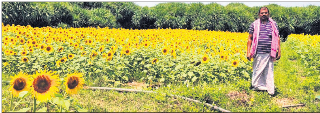
ଚାଷ ହୋଇଥିବା ସୂର୍ଯ୍ୟମୁଖୀ ଫୁଲ।