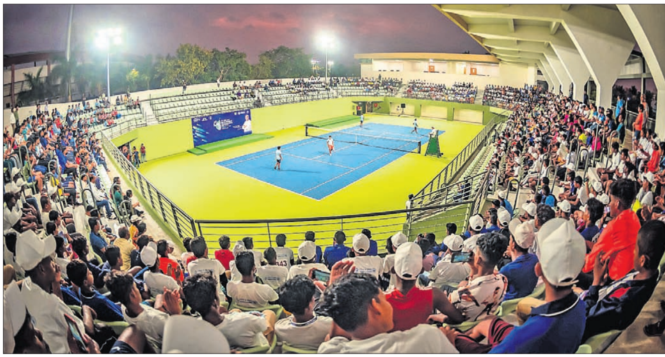
କଳିଙ୍ଗ ଷ୍ଟାଡ଼ିୟମରେ ନବନିର୍ମିତ ଚେନିସ୍ କମ୍ପ୍ଲେକ୍ସ।

ଭୁବନେଶ୍ୱର, ୩୧୪ (କ୍ରୀଡ଼ା ପ୍ରତିନିଧି) କଳିଙ୍ଗ ଷ୍ଟାଡ଼ିୟମରେ ମଙ୍ଗଳବାର ଆରମ୍ଭ ହେବ ଆଇଟିଏଫ୍(ଅନ୍ତର୍ଜାତୀୟ ଚେନିସ୍ ଫେଡେରେଶନ)ଚେନିସ୍ ପ୍ରତିଯୋଗିତା। ସର୍ବଭାରତୀୟ ଚେନିସ୍ ଆସୋସିଏଶନ (ଏଆଇଟିଏ), ଓଡ଼ିଶା ଚେନିସ୍ ଆସୋସିଏଶନ(ଓଟିଏ) ଓ ରାଜ୍ୟ ସରକାରଙ୍କ ଜୁଡ଼ା ବିଭାଗର ମିଳିତ ଆନୁକୁଲ୍ୟରେ ଆଇଟିଏଫ୍ ଏସିଆନ୍ ୧୪ ବର୍ଷରୁ କମ୍ ବୟସ୍କମାନଙ୍କୁ ଚାମ୍ପିୟନଶିପ୍ରେ ଫାଇନାଲ୍ ଏଠାରେ ଅନୁଷ୍ଠିତ ହେବ। ଭାରତରେ ଏପରି ଏକ ସମ୍ମାନଜନକ ପ୍ରତିଯୋଗିତା ଆୟୋଜନ ପ୍ରଥମ। ମ୍ୟାଗ୍ନେଟିକ୍ ଏପ୍ରିଲ ୪ରୁ ୮ ଏବଂ ୧୦ରୁ ୧୪ ପର୍ଯ୍ୟନ୍ତ ଅନୁଷ୍ଠିତ ହେବ। ୧୪ ଦେଶର ୪୬ ଖେଳାଳି ଉଭୟ ବାଳିକା ସିଙ୍ଗଲ୍ ଓ ଡବଲ୍ ଏବଂ ବାଳକ ସିଙ୍ଗଲ୍ ଓ ଡବଲ୍ରେ ପ୍ରତିଦ୍ୱନ୍ଦ୍ୱିତା କରିବେ। ଭାରତ ସମେତ ହାଙ୍କ, ଇଣ୍ଡୋନେସିଆ, କୋରିଆ, ଡିଏସ୍, କାଜାଖସ୍ତାନ, ମାଲେସିଆ, ଶ୍ରୀଲଙ୍କା, ଆଇଲ୍ୟାଣ୍ଡ, ସିରିୟା, ଇରାନ, କୁଏତ, ମ୍ୟାନ୍ମାର, ପାକିସ୍ତାନ, ଉଜବେକିସ୍ତାନ, ଟୁର୍କମେନିସ୍ତାନ, କିର୍ଗିସ୍ତାନ, ଚାଇନା ଆଦି ଦେଶର ପ୍ରତିଯୋଗୀ ଏଥିରେ ଅଂଶଗ୍ରହଣ କରିବେ।