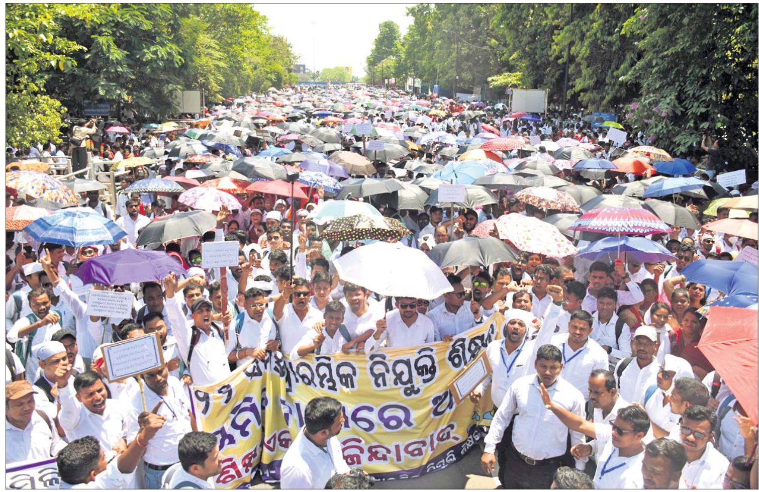
୨୦୧୬ରୁ ୨୦୨୨ ମସିହା ମଧ୍ୟରେ ନିୟୁତ୍ରି ପାଇଥିବା ଶିକ୍ଷାମିତ୍ରାଶିକ୍ଷକଙ୍କୁ ଗ୍ଲାୟା ନିୟୁତ୍ରି ପ୍ରଦାନ ଦାବିରେ ଓଡ଼ିଶା ସରକାରୀ ସିବିଟି ଶିକ୍ଷକ ସଂଘ ତାକଡ଼ାରେ ସାରା ରାଜ୍ୟକୁ ଆସିଥିବା ଶିକ୍ଷାମିତ୍ରାଶିକ୍ଷକ ଯୋମାବାର ଭୁବନେଶ୍ୱର ଲୋୟର ପିଏମ୍ଜିରେ ବିରୋଧ ପ୍ରଦର୍ଶନ କରୁଛନ୍ତି।