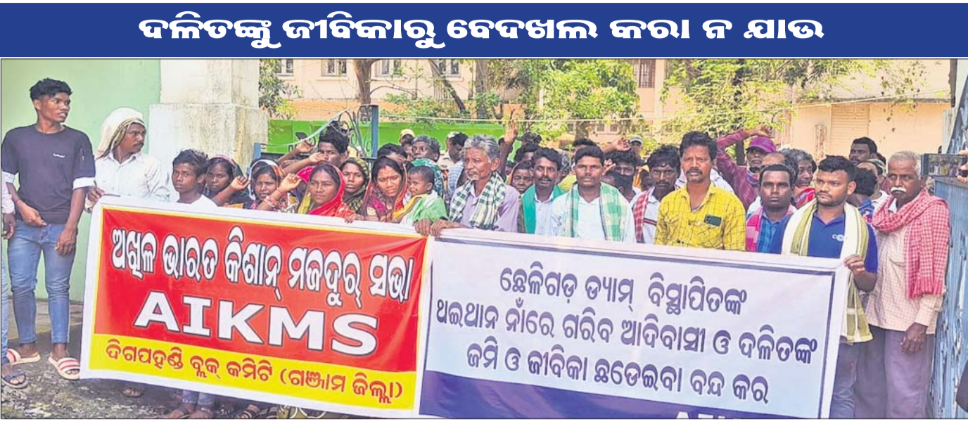
ଉପଜିଲାପାଳଙ୍କୁ ଦାବି ପତ୍ର ଦେବାକୁ ରାଲିରେ ଯାଉଛନ୍ତି ।

ବ୍ରହ୍ମପୁର ଅଧିକାରୀଙ୍କୁ ଦାବି ପତ୍ର ଦେବାକୁ ରାଲିରେ ଯାଉଛନ୍ତି ।