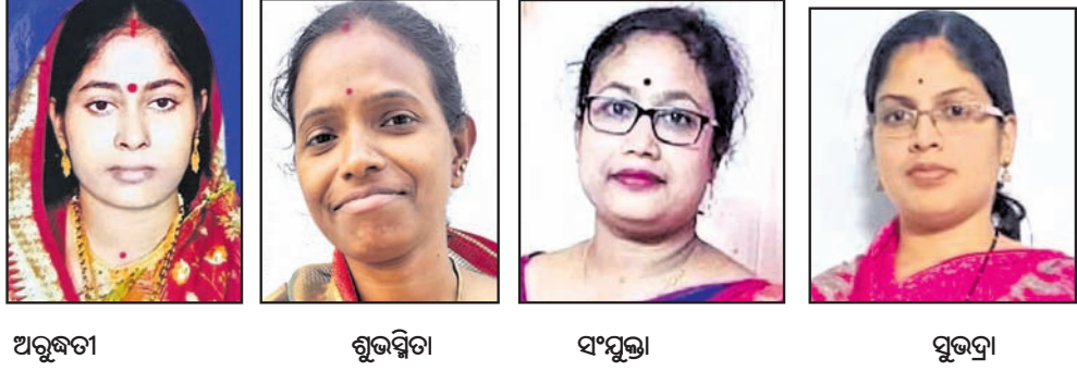
ଅରୁଣ୍ଡତା, ଶୁଭସ୍ମିତା, ସଂଯୁକ୍ତା, ସୁଭଦ୍ରା

କରୋନା ପାଇଁ ସମସ୍ତେ ପୂର୍ବଭଳି ସତର୍କ ରୁହନ୍ତୁ। କାର୍ଯ୍ୟକ୍ରମ ଏଥର ବି ସଂକ୍ରମଣ ବୃଦ୍ଧିରେ ଲାଗିଲାଣି। ଯଦି ସତର୍କ ନ ହେବା ତ ଏହା ପୁଣି ଥରେ ଭୟଙ୍କର ରୂପ ନେଇପାରେ। ତେଣୁ ସମସ୍ତେ ମାସ୍କ ଲଗାନ୍ତୁ ଏବଂ ହ୍ୟାଣ୍ଡୱାଶ, ସାନିଟାଇଜର ବ୍ୟବହାର କରନ୍ତୁ। ପରିଷ୍କାର ପରିଚ୍ଛନ୍ନ ରହିବା ସହ ସମସ୍ତେ ନିଜ ଜମ୍ପ୍ୟୁନିଟି ବଡ଼ାଇବା ପାଇଁ ଚେଷ୍ଟା କରନ୍ତୁ। ପୁଷ୍ୟ ଖାଦ୍ୟ ଖାଆନ୍ତୁ ଏବଂ ରୋଗର ସାମାନ୍ୟ ଲକ୍ଷଣ ଦେଖିବା ମାତ୍ରେ ତୁରନ୍ତ ଚିକିତ୍ସା କରନ୍ତୁ। ଯେହେତୁ ସମସ୍ତେ କରୋନାର ଭୟଙ୍କର ରୂପକୁ ଥରେ ଦେଖି ସାରିଛନ୍ତି ତେଣୁ କୌଣସି ପରିସ୍ଥିତିରେ ବି ଅବହେଳା କରିବା ଠିକ୍ ନୁହେଁ। ଏବେ ତ କରୋନା ସହିତ ଏଚଏସଏନ୨ ଭାରିଆଖିର ସଂକ୍ରମଣ ବୃଦ୍ଧି ଚାଲିଗଲାଣି। ଏବେ ଅଧିକ ସଂଖ୍ୟାରେ ସଂକ୍ରମିତ ରୋଗୀ ଆସୁଛନ୍ତି। ତେଣୁ ରୋଗ ହେବା ପୂର୍ବରୁ ନିରାକରଣ କରିବା ହିଁ ବୁଦ୍ଧିମାନର କାମ।