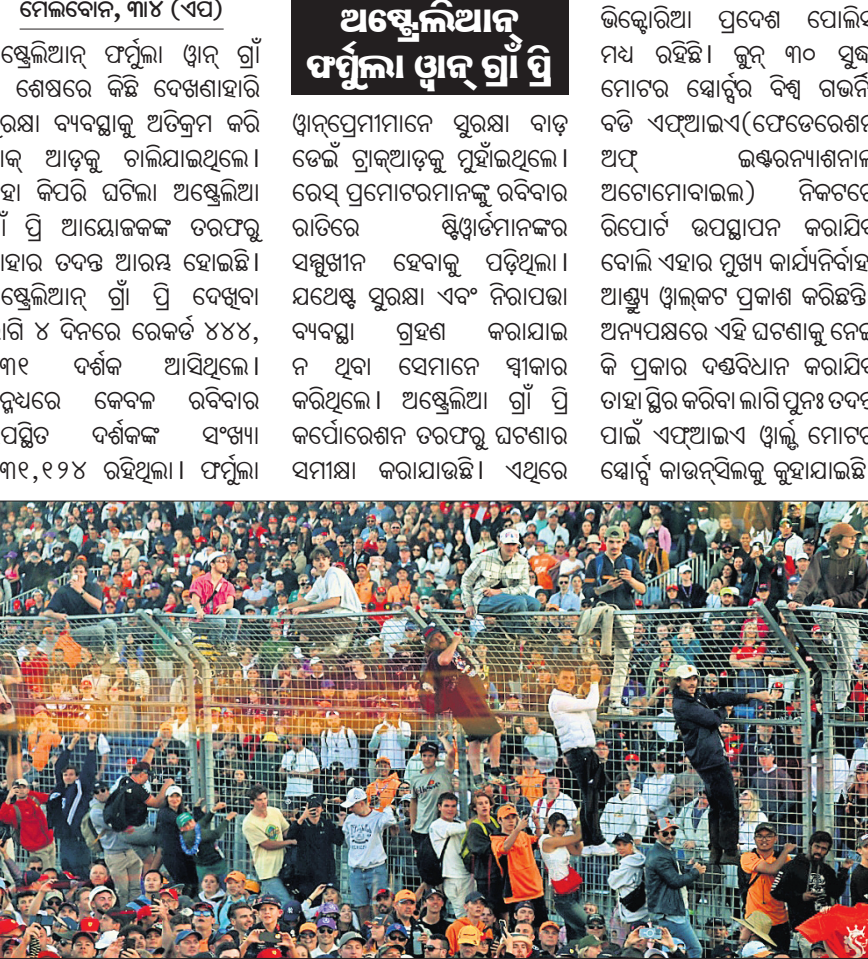
ଅଷ୍ଟେଲିଆନ୍ ଫର୍ମୁଲା ଓଏନ୍ ଗ୍ରାଁ ଅବସରରେ ଉପସ୍ଥିତ ଦର୍ଶକ।

ମେଲବୋର୍ନ, ୩୪ (ଏପି) ଅଷ୍ଟେଲିଆନ୍ ଫର୍ମୁଲା ଓଏନ୍ ଗ୍ରାଁ ପ୍ରତି ଶେଷରେ କିଛି ଦେଖାହାରି ସୁରକ୍ଷା ବ୍ୟବସ୍ଥାକୁ ଅତିକ୍ରମ କରି ଡ୍ରାକ୍ ଆଡ଼କୁ ଚାଲିଯାଇଥିଲେ। ଏହା କିପରି ଘଟିଲା ଅଷ୍ଟେଲିଆ ଗ୍ରାଁ ପ୍ରତି ଆୟୋଜକଙ୍କ ତରଫରୁ ତାହାର ତଦନ୍ତ ଆରମ୍ଭ ହୋଇଛି। ଅଷ୍ଟେଲିଆନ୍ ଗ୍ରାଁ ପ୍ରତି ଦେଖିବା ଲାଗି ୪ ଦିନରେ ରେକର୍ଡ୍ ୪୪୪, ୬୩୧ ଦର୍ଶକ ଆସିଥିଲେ। ତରୁଧରେ କେବଳ ରବିବାର ଉପସ୍ଥିତ ଦର୍ଶକଙ୍କ ସଂଖ୍ୟା ୧୩୧,୧୨୪ ରହିଥିଲା। ଫର୍ମୁଲା ଅଷ୍ଟେଲିଆନ୍ ଫର୍ମୁଲା ଓଏନ୍ ଗ୍ରାଁ ପ୍ରତି ଓଏନ୍ ଗ୍ରାଁରେ ସୁରକ୍ଷା ବାଡ଼ ଡେଇଁ ଡ୍ରାକ୍ ଆଡ଼କୁ ମୁହାଁଇଥିଲେ। ରେସ୍ ପ୍ରମୋଟରମାନଙ୍କୁ ରବିବାର ରାତିରେ ଷ୍ଟ୍ରିକ୍ଟମାନଙ୍କର ସମ୍ପୂର୍ଣ୍ଣ ହେବାକୁ ପଡ଼ିଥିଲା। ଯଥେଷ୍ଟ ସୁରକ୍ଷା ଏବଂ ନିରାପତ୍ତ ବ୍ୟବସ୍ଥା ଗ୍ରହଣ କରାଯାଇ ନ ଥିବା ସେମାନେ ସ୍ୱୀକାର କରିଥିଲେ। ଅଷ୍ଟେଲିଆ ଗ୍ରାଁ ପ୍ରତି କର୍ତ୍ତାବ୍ୟରେ ତରଫରୁ ଘଟଣାର ସମୀକ୍ଷା କରାଯାଇଛି। ଏଥିରେ