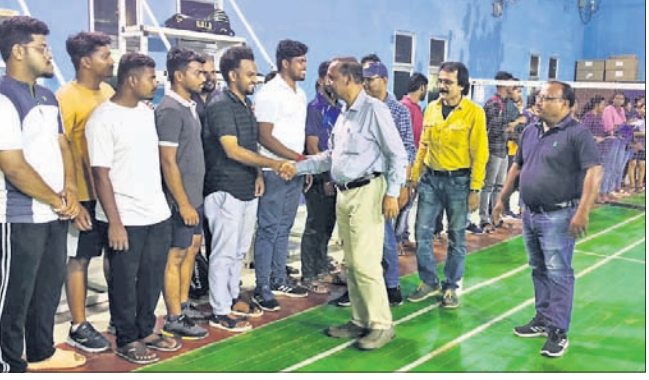
ଅତିଥିମାନେ ଖେଳାଳିଙ୍କ ସହ ପରିଚିତ ହେଉଛନ୍ତି।