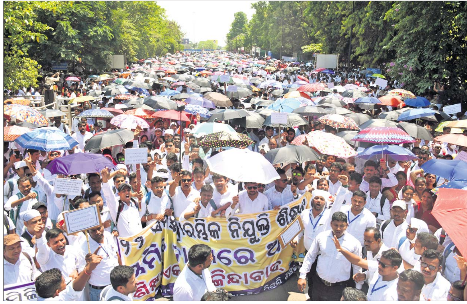
୨୦୧୬ରୁ ୨୦୨୨ ମସିହା ମଧ୍ୟରେ ନିମ୍ନ ପାଇଥିବା ଶିକ୍ଷାମିତ୍ରୀଶିକ୍ଷକଙ୍କୁ ଗ୍ଲାୟା ନିମ୍ନ ପ୍ରଦାନ ଦାବିରେ ଓଡ଼ିଶା ସରକାରୀ ସିବିଟି ଶିକ୍ଷକ ସଂଘ ତାଙ୍କର ଦାବୀ ରାଜ୍ୟକୁ ଆସିଥିବା ଶିକ୍ଷାମିତ୍ରୀଶିକ୍ଷକ ସୋମବାର ଭୁବନେଶ୍ୱର ଲୋୟର ପିଏନଜିରେ ବିରୋଧ ପ୍ରଦର୍ଶନ କରୁଛନ୍ତି।