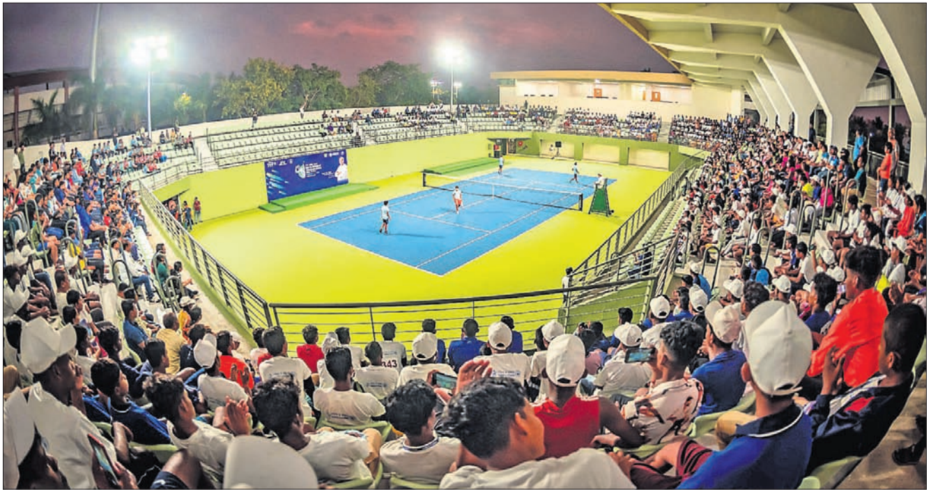
କଳିଙ୍ଗ ଷ୍ଟାଡ଼ିୟମରେ ନବନିର୍ମିତ ଚେନିସ୍ କମ୍ପ୍ଲେକ୍ସ।

କଳିଙ୍ଗ ଷ୍ଟାଡ଼ିୟମରେ ମଙ୍ଗଳବାର ଆରମ୍ଭ ହେବ ଆଇଟିଏଫ୍ (ଆଇଟିଏଫ୍ ଚେନିସ୍ ଫେଡେରେଶନ) ଚେନିସ୍ ପ୍ରତିଯୋଗିତା। ସର୍ବଭାରତୀୟ ଚେନିସ୍ ଆସୋସିଏଶନ (ଏଆଇଟିଏ), ଓଡ଼ିଶା ଚେନିସ୍ ଆସୋସିଏଶନ (ଓଟିଏ) ଓ ରାଜ୍ୟ ସରକାରଙ୍କ କ୍ରୀଡ଼ା ବିଭାଗର ମିଳିତ ଆନୁକୁଲ୍ୟରେ ଆଇଟିଏଫ୍ ଏସିଆନ୍ ୧୪ ବର୍ଷରୁ କମ୍ ବୟସ୍କ ଚେନିସ୍ ଚାମ୍ପିୟନସ୍‌ସିପ୍ ଫାଇନାଲ୍ ଏଠାରେ ଅନୁଷ୍ଠିତ ହେବ। ଭାରତରେ ଏପରି ଏକ ସମ୍ମାନଜନକ ପ୍ରତିଯୋଗିତା ଆୟୋଜନ ପ୍ରଥମ। ମ୍ୟାଗ୍ନେଟିକ୍ ଏପ୍ରିଲ ୪ରୁ ୮ ଏବଂ ୧୦ରୁ ୧୪ ପର୍ଯ୍ୟନ୍ତ ଅନୁଷ୍ଠିତ ହେବ। ୧୪ ଦେଶର ୪୬ ଖେଳାଳି ଉଭୟ ବାଳିକା ସିଙ୍ଗଲ୍ ଓ ଡବଲ୍ ଏବଂ ବାଳକ ସିଙ୍ଗଲ୍ ଓ ଡବଲ୍ରେ ପ୍ରତିଦ୍ୱନ୍ଦ୍ୱିତା କରିବେ। ଭାରତ ସମେତ ହଂକାଙ୍ଗ, ଇଣ୍ଡୋନେସିଆ, କୋରିଆ, ଭିଏଟନାମ, କାଜାଖସ୍ତାନ, ମାଲେସିଆ, ଶ୍ରୀଲଙ୍କା, ଆଇଲାଣ୍ଡ, ସିରିୟା, ଇରାନ, କୁବେତ, ମ୍ୟାନ୍ଦାର, ପାକିସ୍ତାନ, ଉଜବେକିସ୍ତାନ, ଚିଲି, କିର୍ଗିସ୍ତାନ, ତାଜିକିସ୍ତାନ ଆଦି ଦେଶର ପ୍ରତିଯୋଗୀ ଏଥିରେ ଅଂଶଗ୍ରହଣ କରିବେ।