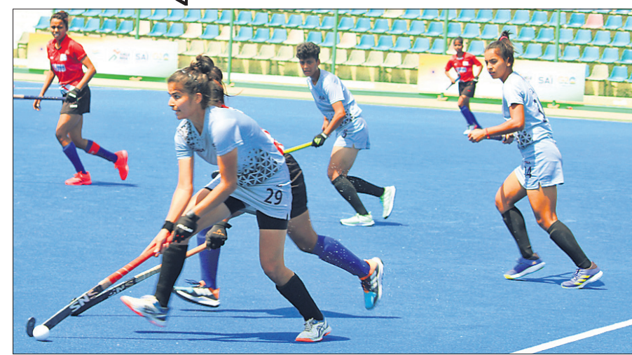
ଓଡ଼ିଶା ଷ୍ଟୋର୍ଟ୍ ହଷ୍ଟେଲ ଓ ସାଇ ବାଲ୍ ଟିମ୍ ମଧ୍ୟରେ ଅନୁଷ୍ଠିତ ମ୍ୟାଚ୍ ।

ଭୁବନେଶ୍ୱର, ୩୪ (କ୍ରୀଡ଼ା ପ୍ରତିନିଧି) ଉତ୍ତର ପ୍ରଦେଶର ଲକ୍ଷ୍ମୀଠାରେ ଚାଲିଥିବା ୨୧ ବର୍ଷରୁ କମ୍ ଖେଳୋ ଇଣ୍ଡିଆ ମହଲ୍ ହକି ଲିଗ୍ (ଫେବ୍-୨)ରେ ଓଡ଼ିଶା ଷ୍ଟୋର୍ଟ୍ ହଷ୍ଟେଲର ଭଲ ପ୍ରଦର୍ଶନ ଅବସାହତ ରହିଛି । ସୋମବାର ଅନୁଷ୍ଠିତ ମ୍ୟାଚ୍‌ରେ ଓଡ଼ିଶା ଦଳ ୩-୧ ଗୋଲରେ ପ୍ରାୟୋଗିକା ବାଲ୍ ଟିମ୍‌କୁ ପରାସ୍ତ