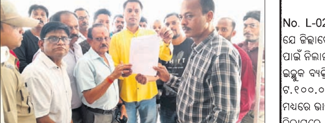
ଉପକଳାପାଳକ ସହ ଦୋକାନୀ ସଂଘ ସଦସ୍ୟ।