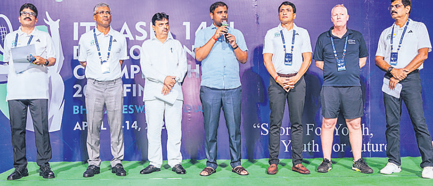
ଉଦ୍‌ଘାଟନୀ ଉତ୍ସବରେ ଉପସ୍ଥିତ ଅତିଥି, କର୍ମକର୍ତ୍ତା ଓ ଅତିଥିଆଳୀ।

ଭୁବନେଶ୍ୱର, ୪୪ (କ୍ରୀଡ଼ା ପ୍ରତିନିଧି) ଭୁବନେଶ୍ୱରରେ ଆୟୋଜିତ ହୋଇଥିବା ଟେନିସ୍ ଉଦ୍‌ଘାଟନୀ କାର୍ଯ୍ୟକ୍ରମରେ ଧୋନୀଙ୍କ ଚେତାବନୀ ଶୁଣିବାକୁ ସମର୍ଥନୀୟ ଥିଲେ।