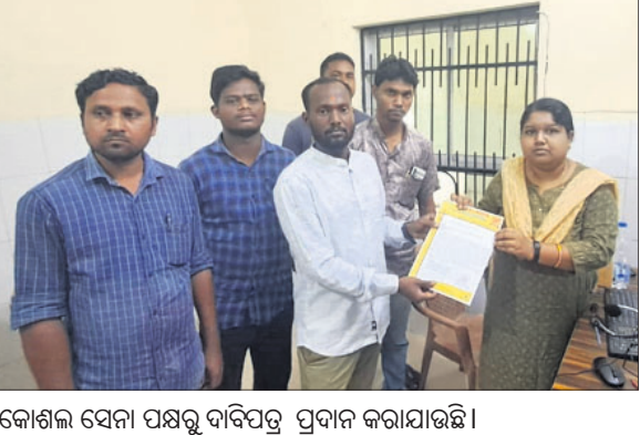
କୋଶଳ ସେନା ପକ୍ଷରୁ ଦାବିପତ୍ର ପ୍ରଦାନ କରାଯାଇଛି।

ଭୁବନେଶ୍ୱର, ୪୪ (ଡି.ଏନ.ଏ.) ସୁବର୍ଣ୍ଣପୁର ଜିଲ୍ଲା ଭୁବନେଶ୍ୱର ଗୋଷ୍ଠୀ ସ୍ୱାସ୍ଥ୍ୟକେନ୍ଦ୍ରରେ ରକ୍ତ ଭଣ୍ଡାର ଓ ଶବ ବ୍ୟବହୃତ ଗୃହ ନାହିଁ।