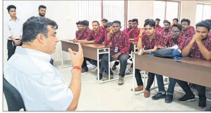
ଜିଏମ୍.ସି.ରେ ଛାତ୍ରାଛାତ୍ରୀଙ୍କୁ ସହ ଆଲୋଚନା କରୁଛନ୍ତି।

ସମ୍ବଲପୁର ରାଜ୍ୟ ଶିକ୍ଷା ଓ ଉଚ୍ଚଶିକ୍ଷା ମନ୍ତ୍ରୀ ଡ. ସୁଧାଂଶୁ କୁମାର ସାହୁ ଶିକ୍ଷା ଓ ଉଚ୍ଚଶିକ୍ଷା ମନ୍ତ୍ରାଳୟରେ ଉଚ୍ଚଶିକ୍ଷା ମନ୍ତ୍ରୀଙ୍କ ସହ ଆଲୋଚନା କରିଥିଲେ।