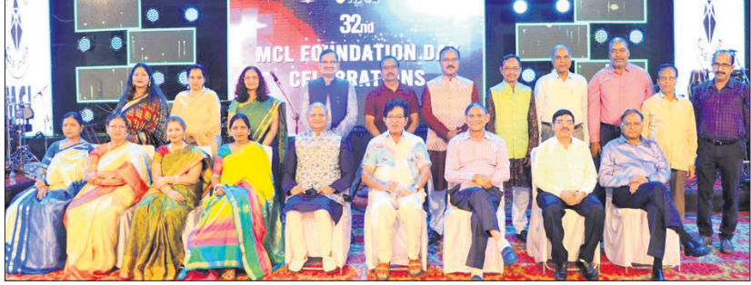
ଏମସିଏଲର ପ୍ରତିଷ୍ଠା ଦିବସରେ ଅଧିକାରୀ।