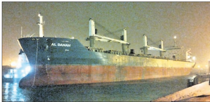
ପାରାଦୀପ ବନ୍ଦରରେ ଲାଗିଥିବା ଏକ ଜାହାଜ ।

■ ୭୬ ପ୍ରତିଶତ ପର୍ଯ୍ୟନ୍ତ ପରିବହନ ଜଳପଥରେ ହେଉଛି