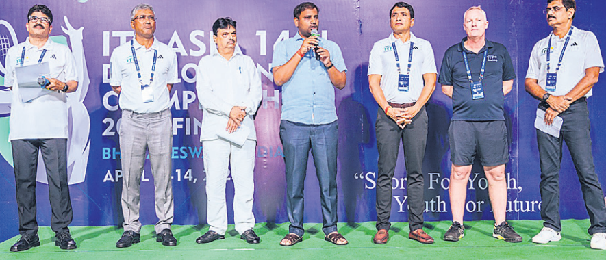
ଉଦ୍‌ଘାଟନୀୟା ଉତ୍ସବରେ ଉପସ୍ଥିତ ଅତିଥି, କର୍ମକର୍ତ୍ତା ଓ ଅତିଥିଆଳୀ।

ଭୁବନେଶ୍ୱର, ୪୪ (କ୍ରୀଡ଼ା ପ୍ରତିନିଧି) ସର୍ବଭାରତୀୟ ଟେନିସ୍ ଆସୋସିଏସନ (ଏଆଇଟିଏ), ଓଡ଼ିଶା ଟେନିସ୍ ଆସୋସିଏସନ (ଓଟିଏ) ଓ ରାଜ୍ୟ ସରକାରଙ୍କ କ୍ରୀଡ଼ା ବିଭାଗର ମିଳିତ ଆହ୍ୱାନରେ ଆଇଟିଏସ୍ ଏସିଆନ ୧୪ ବର୍ଷରୁ କମ୍ ଉତ୍ତମପ୍ରବେଶୀ ଚାମ୍ପିୟନସିପ୍‌ର ଓପିଏସ୍‌ଏସ୍ ଉଦ୍‌ଘାଟନୀୟା ଆୟୋଜନ କରାଯାଇଛି।