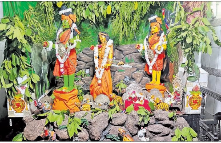
ବନବାସ ବେଶରେ ରାମ, ଲକ୍ଷ୍ମଣ, ସୀତା

ଉଡ଼ଗାଁ, ୪୫ (ସ.ପ୍ର.) ନୟାଗଡ଼ ଜିଲାର ଓଡ଼ଗାଁରେ ବିଜେ ଶ୍ରୀରାମ ପଞ୍ଚାବଳୀ ପ୍ରତିଷ୍ଠା ପାଇଁ ଗ୍ରାମବାସୀ ସମସ୍ତଙ୍କ ସହଯୋଗ ସହକାରେ ପ୍ରଭୁ ଶ୍ରୀରାମ, ଅନୁଜ ଲକ୍ଷ୍ମଣ ଓ ମାତା ଜାନକୀ ବନବାସ କରିବା ପାଇଁ ପ୍ରସ୍ତୁତ ହୋଇଛନ୍ତି । ଧାନକିଣାରେ ଧାନକିଣା ପାଇଁ ପ୍ରସ୍ତୁତ କରାଯାଇ ନାହିଁ । ଧାନକିଣାରେ ଅବସର ନେଇ ଅଭିଯୋଗ ସତ୍ତ୍ୱେ ଚଳେଇଲା । ଅଧିକାରୀ ଧାନକିଣାରେ ଧାନକିଣା ପାଇଁ ପ୍ରସ୍ତୁତ କରାଯାଇ ନାହିଁ । ଧାନକିଣାରେ ଅବସର ନେଇ ଅଭିଯୋଗ ସତ୍ତ୍ୱେ ଚଳେଇଲା । ଅଧିକାରୀ ଧାନକିଣାରେ ଧାନକିଣା ପାଇଁ ପ୍ରସ୍ତୁତ କରାଯାଇ ନାହିଁ ।