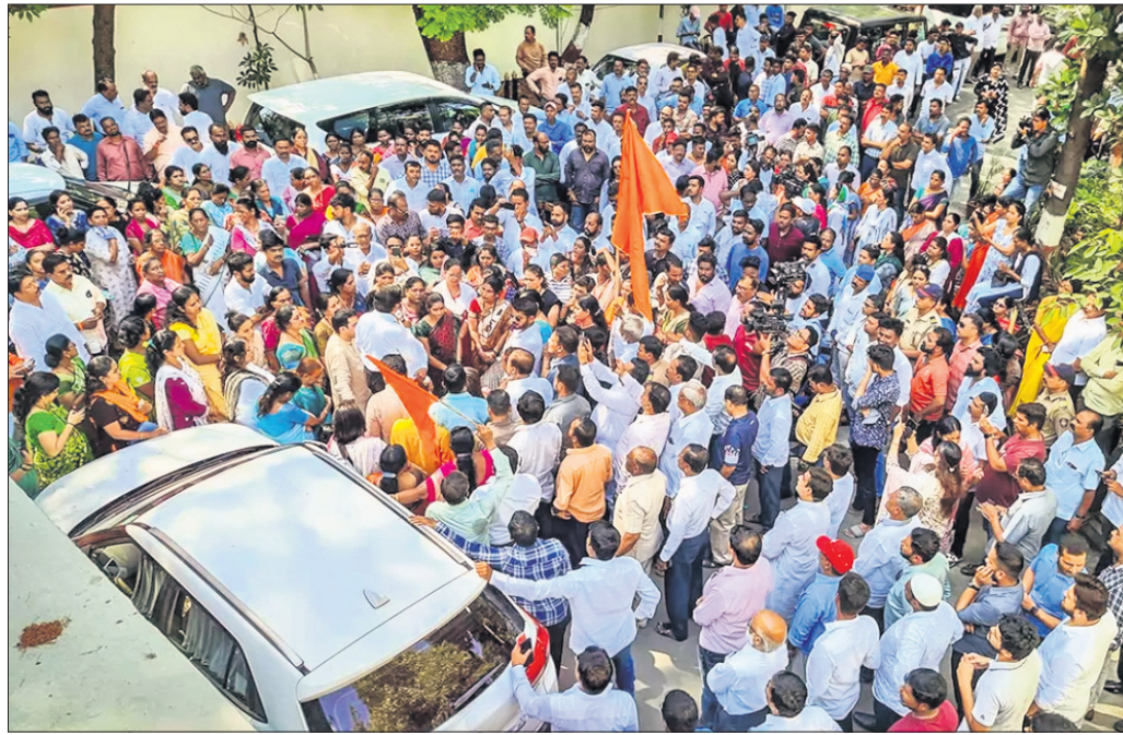
ମହାରାଷ୍ଟ୍ରର ଠାଣେରେ ଏକନାଥ ଶିନ୍ଦେ ଗୋଷ୍ଠୀର 'ଶିବସେନା' କର୍ମୀଙ୍କ ଆଲୁମ୍ନୀମଣ୍ଡଳରେ ଭବ୍ୟ ଠାକରେ ଗୋଷ୍ଠୀର ଜଣେ କର୍ମୀ ଆହତ ହେବା ପରେ ମଙ୍ଗଳବାର ବହୁସଂଖ୍ୟକ କର୍ମୀ ଦକାଇ କାର୍ଯ୍ୟକ୍ରମରେ ଏକାଠି ହୋଇଛନ୍ତି ।

ଆଲୋଚନା ହୋଇଥିଲା । ମେ' ୧୦ରେ ୨୨୪ ଆସନ ବିଶିଷ୍ଟ କର୍ମଚକ