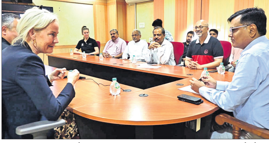
ବୈଠକରେ ଉପସ୍ଥିତ ଅତିର୍ଜାତୀୟ ଟେକ୍ନିକାଲ ଟେନିସ ଫେଡେରେଶନ ଓ ରାଜ୍ୟ ଆସୋସିଏସନ କର୍ମକର୍ତ୍ତା।